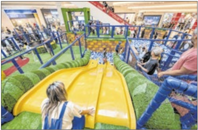
Área fica no primeiro piso do shopping