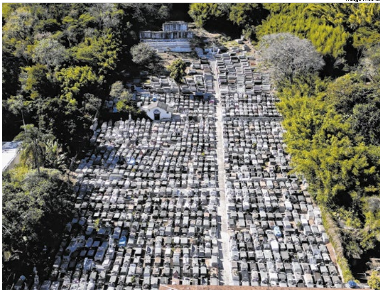
Pendência passou por seis gestões e segue sem resolução. MP pede medidas do poder público