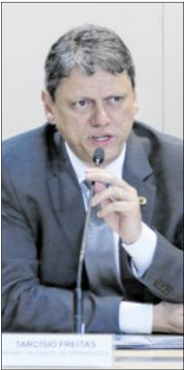
Tarcísio e Flávio disputam as preferências da direita

Congressistas apontam que, para uma eventual reação, pesa mais a postura do presidente do Senado, Davi Alcolumbre (União Brasil-AP). Ele, que preside o Congresso, também está em reaproximação com Lula, embora o movimento se dê em velocidade mais lenta do que no caso de Motta. Alcolumbre havia se afastado do petista em novembro, quando Lula decidiu indicar o advogado-geral da União, Jorge Messias, para uma vaga no STF (Supremo Tribunal Federal) em vez de escolher o senador Rodrigo Pacheco (PSD-MG). De acordo com lideranças do Congresso, Alcolumbre não demonstrou até o momento vontade de revidar o veto de Lula ou derrubá-lo.