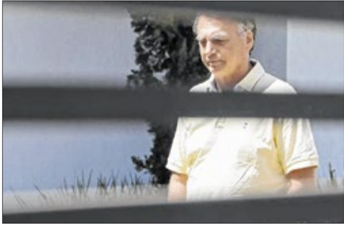
Advogados alegam motivos de saúde do ex-presidente