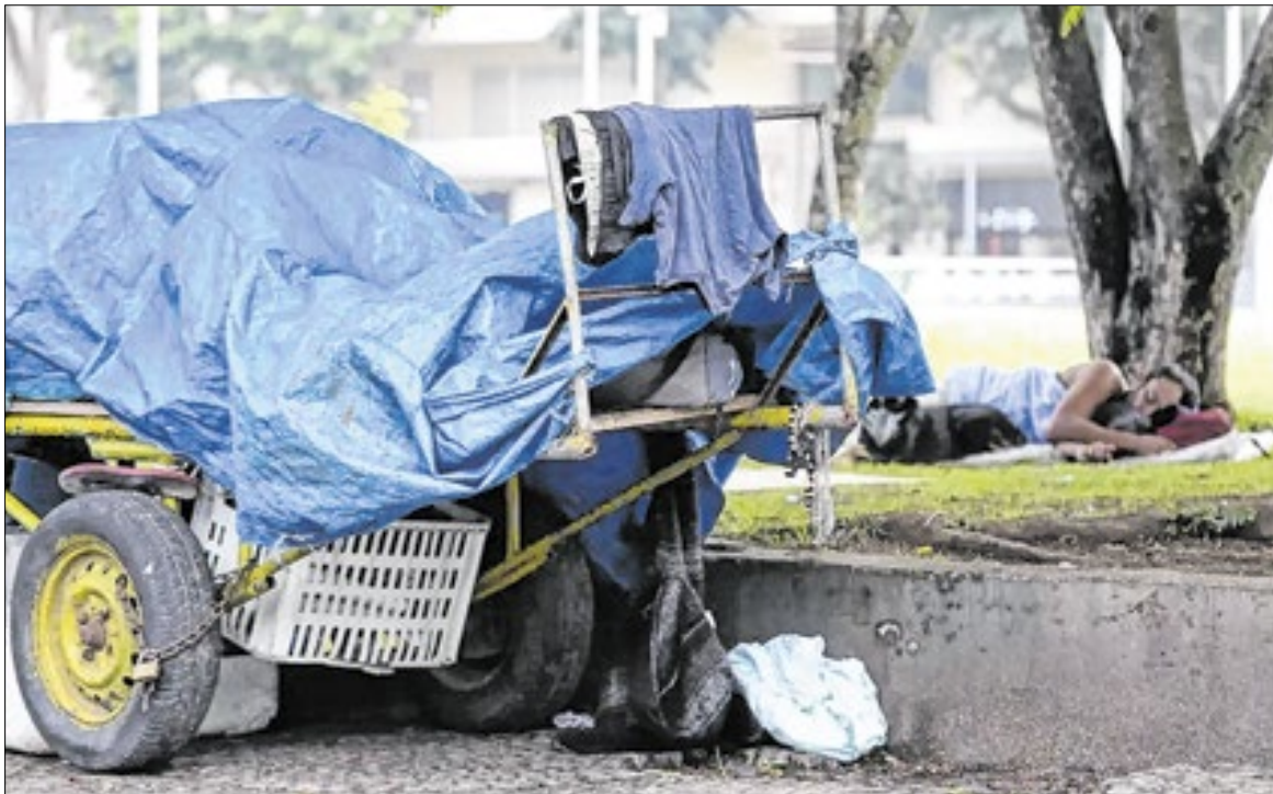
Procuradoria do Município afirma que estava em tratativas com o MPRJ para atualizar o TAC

Os órgãos pedem que a Justiça dê 30 dias para a Prefeitura criar o comitê e 60 dias para um plano de trabalho. O plano deve proibir