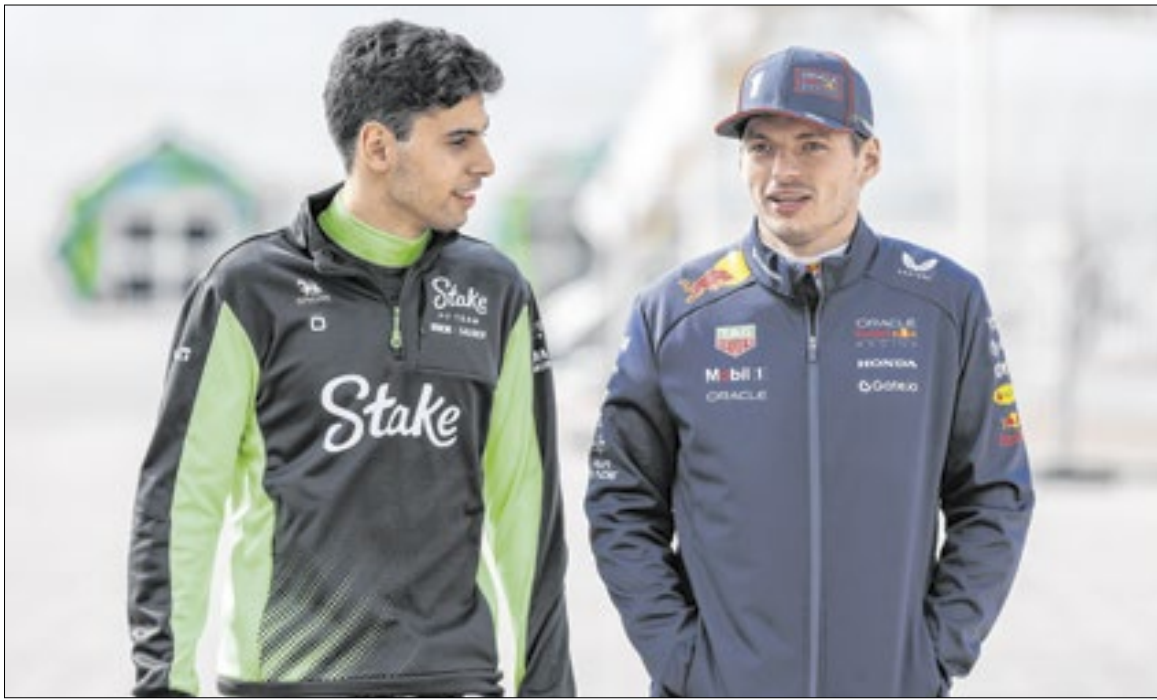
Gabriel Bortoleto e Max Verstappen desenvolveram relação de amizade na Fórmula 1

"Depois de mais de 230 corridas, meu objetivo certamente não é alcançar sete títulos mundiais. Não há nada mais importante para mim que a minha família e amigos. Eles são a motivação que você só pode conseguir em casa", disse o holandês.