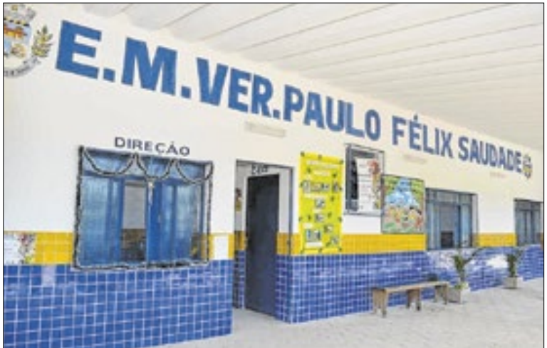
Construção de novas salas de aula fortalece o ensino em tempo integral

“Estamos trabalhando para garantir que nossas escolas estejam preparadas para oferecer um ensino de qualidade, com estrutura adequada e segura. A ampliação da Escola Paulo Félix da Saudade reforça o compromisso da gestão com o fortalecimento do ensino em tempo integral e com o futuro dos nossos estudantes”, afirmou.