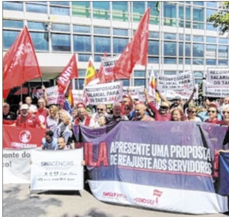
Manifestação de servidores públicos no Distrito Federal

As inscrições devem ser realizadas através do formulário eletrônico que consta no Edital Proen 01/20026, no qual constam todas as informações. A seleção será composta por análise curricular de títulos e experiência profissional e por entrevista, ambas de caráter eliminatório e classificatório.