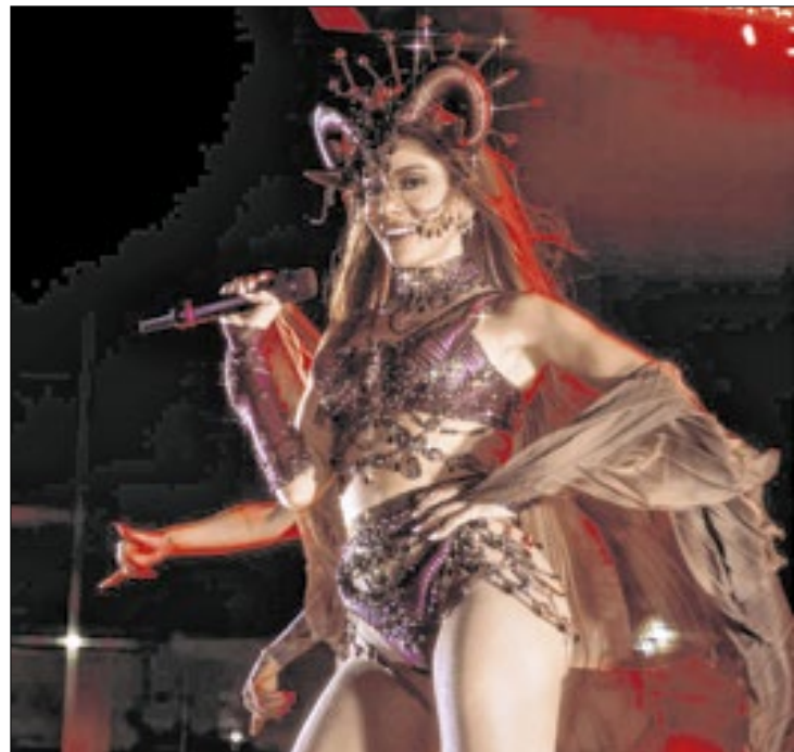
Além do Rio, outras capitais recebem o projeto de pré-carnaval