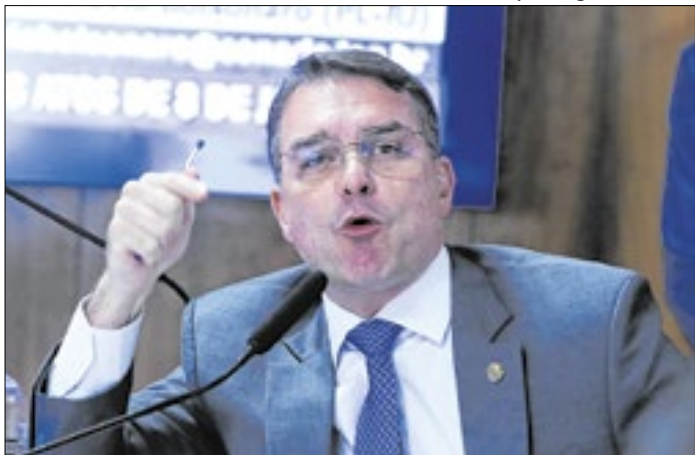
Quaest não confirmou a murchada de Flávio