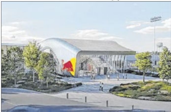
Brasil utilizará as instalações do Red Bull New York