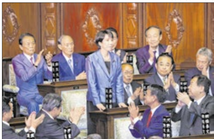
Primeira-ministra do Japão quer eleições antecipadas