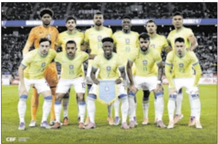
Brasil ficará em área de fácil acesso ao MetLife Stadium