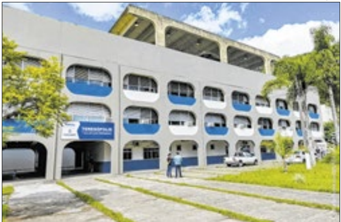
Resultado será divulgado dia 26 de janeiro

Também houve mudanças voltadas aos motociclistas. As vagas de motos que existiam na Avenida Lúcio Meira, nas proximidades da saída do semáforo da Rua Heitor de Moura Estevão, foram desativadas. No local, agora é proibido parar ou estacionar, em razão das novas intervenções viárias. As vagas destinadas às motocicletas foram realocadas para a Rua Francisco Sá, em frente ao Hemonúcleo Municipal.