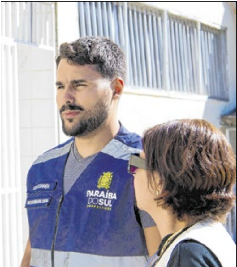
Ação visa mapear escolas que podem ser pontos de apoio