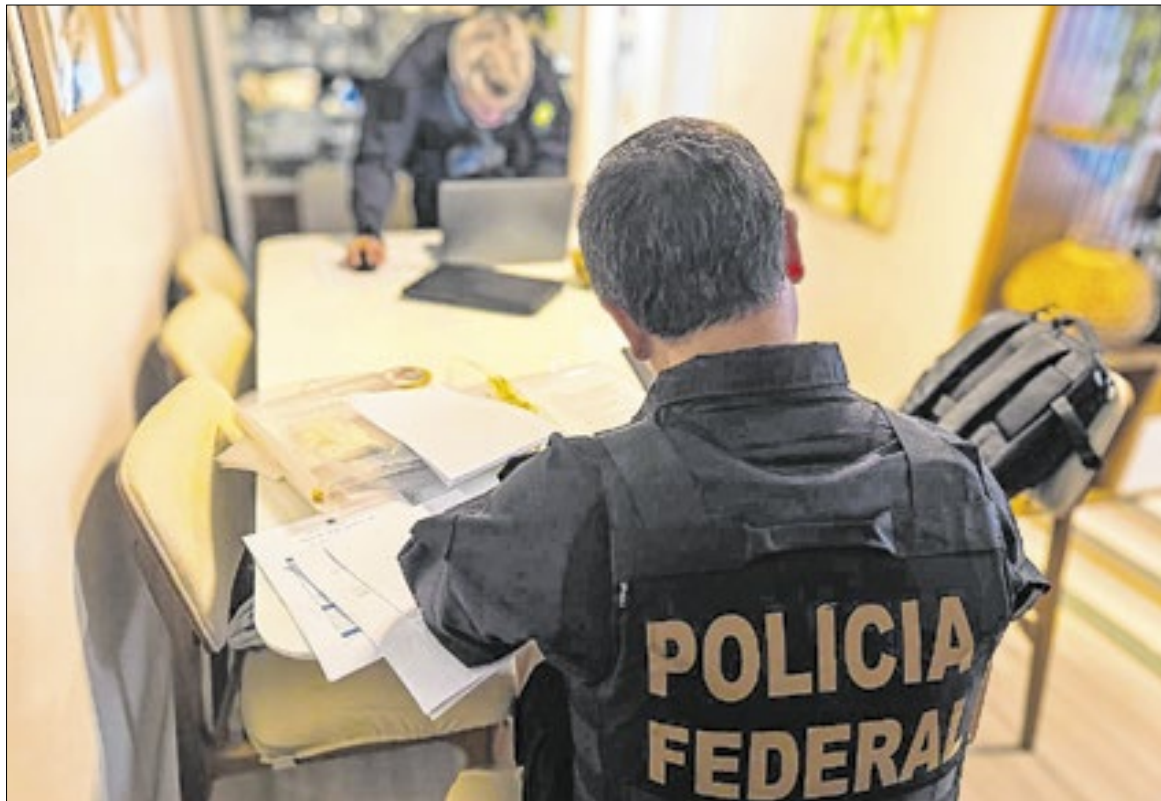
Polícia Federal avançou nas investigações sobre o Master

Na etapa anterior, deflagrada em novembro, foram decretadas prisões e houve apreensão de carros e itens de luxo; investigadores estimaram, à época, que as fraudes poderiam alcançar R$ 12 bilhões — em especial pela emissão de CDBs com promessa de rentabilidade de até 40% acima das taxas usuais, re-