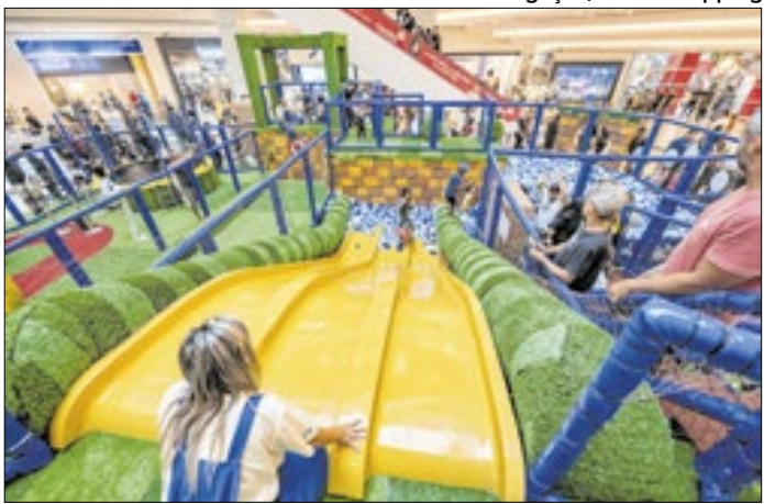
Área fica no primeiro piso do shopping