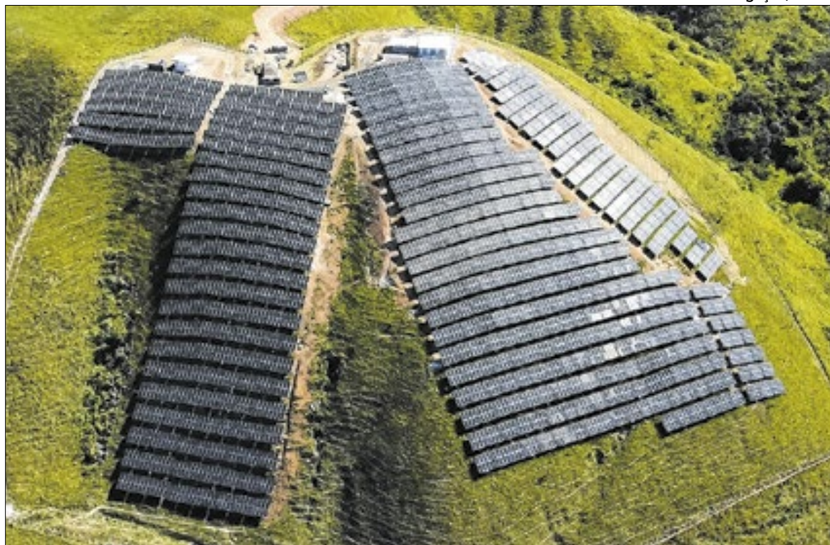
Usina passou pelo primeiro teste e agora, aguarda inspeção da concessionária Light

Energia será repassada para a Light e deve gerar economia de cerca R$ 5 milhões por ano