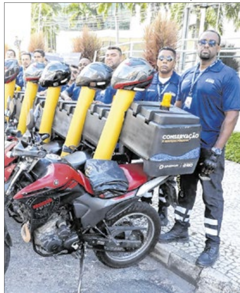
A iniciativa integra a Operação Abre Ralo e amplia a agilidade