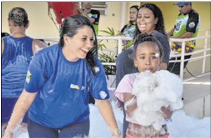
Ação da Assistência Social acontece ao longo de janeiro