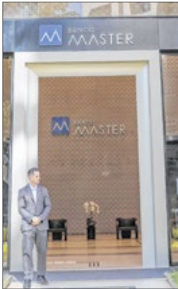
Master entrou em liquidação

O impacto para clientes e investidores é amplo. Estimativas apontam cerca de 1,6 milhão de investidores com CDBs elegíveis ao ressarcimento, em um volume aproximado de R$ 41 bilhões — o