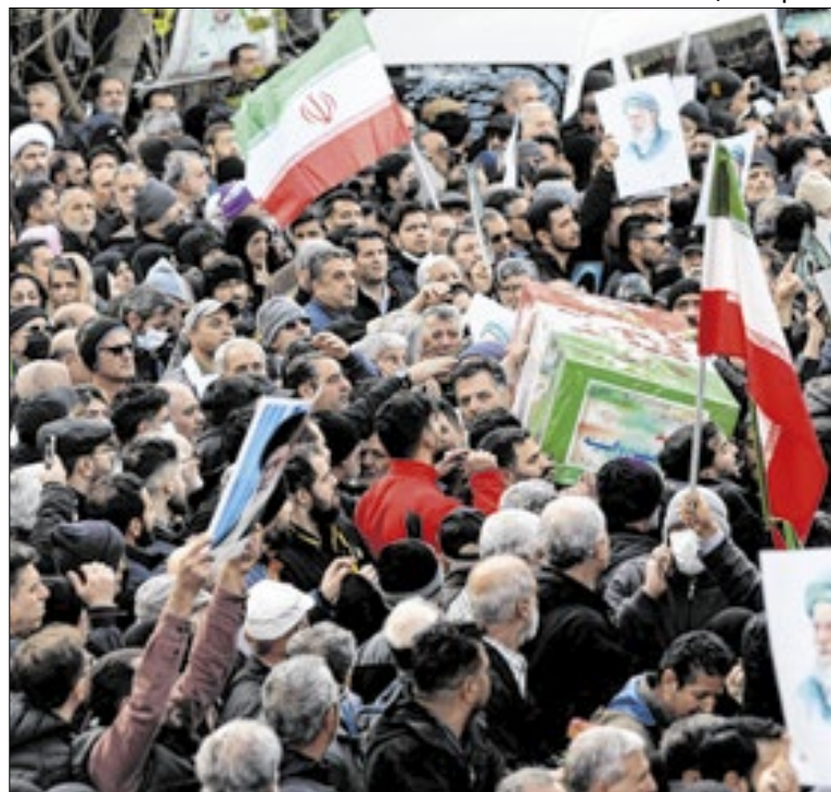
Irã vem enfrentando manifestações intensas nos últimos dias

Ejei visitou uma prisão de Teerã onde manifestantes, chamados de “rebeldes” pelas autoridades, estão detidos para revisão de seus casos. Após a agenda, ele prometeu julgamentos rápidos e públicos. “Se alguém ateou fogo em uma pessoa, a decapitou antes de queimar seu corpo, devemos fazer nosso trabalho rapidamente”, declarou.