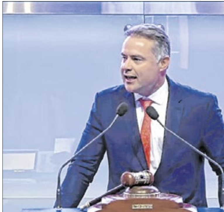
Renan Filho chega ao Estado do Rio nesta quinta-feira

Em Quatis, mulheres podem fazer o alistamento para o Exército e passarão pelo mesmo processo seletivo aplicado aos homens. Caso aprovada, poderá ser voluntária, com duração inicial de um ano. Após esse período, há a possibilidade de permanência por até oito anos, conforme critérios do Exército.