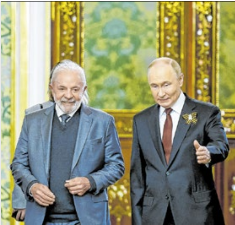
Conversa com Putin mostra esforço de Lula na mediação

Da parte do Centrão, já parece haver maior precificação de Flávio. Sua entrada já no patamar superior a 20% surpreendeu. O que o Centrão espera, porém, é sua capacidade de agregar. Há ainda quem desconfie que sua candidatura só ajuda o PL e os nomes mais à direita, escanteando os mais moderados.