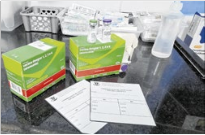
A conscientização continua sendo fundamental