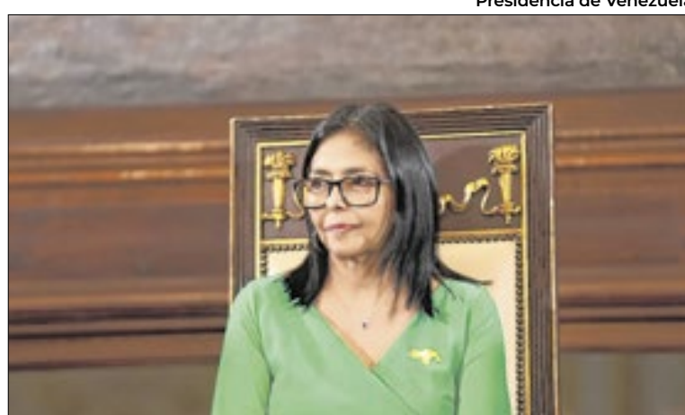
Presidência de Venezuela

Governo Trump deu “boas-vindas à libertação de americanos”