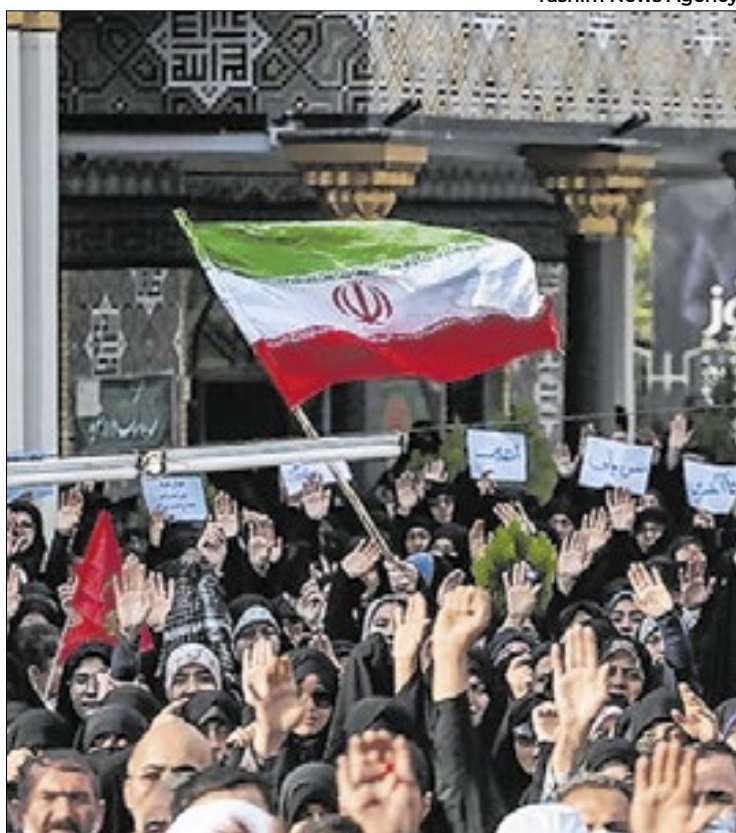
Tasnim News Agency