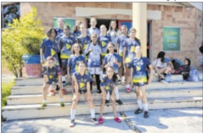
Avaliações técnicas acontecerão no Clube Municipal