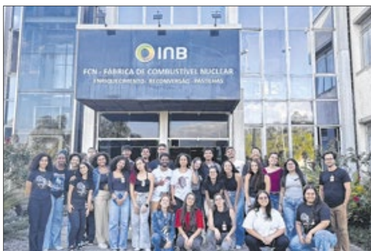
Universitários visitam áreas da estatal federal

Nas três unidades, os perfis dos visitantes são diversos. De acordo com a gerência de Comunicação Institucional da INB, enquanto estudantes do ensino fundamental e médio buscam ampliar o conhecimento sobre energia nuclear e ciência, universitários e profissionais demonstram interesse por temas como segurança nuclear, processos industriais, meio ambiente e proteção radiológica.