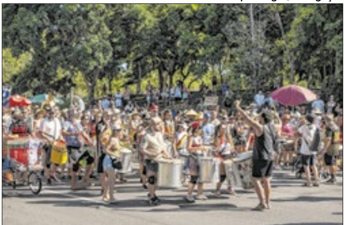
Bloco ocupa a Fundição Progresso no pré-Carnaval