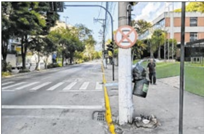
Medida começou nesta terça-feira (13)