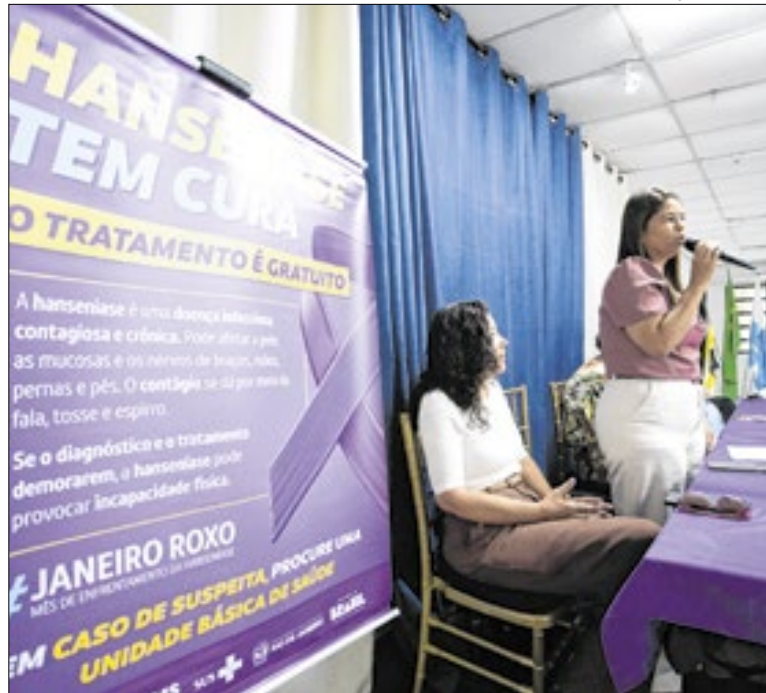
Ação aconteceu no campus Aterrado da UFF

A Prefeitura de Quatis informa que, pela necessidade de substituição de um registro em um dos reservatórios do município, o abastecimento de água no bairro Bondarovsky será temporariamente interrompido. A interrupção ocorrerá a partir das 9h desta quinta-feira (15), com previsão de retorno às 15h do mesmo dia.