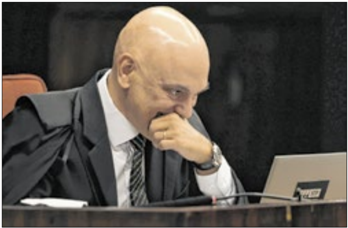
Defesa pediu isonomia em relação a Fernando Collor