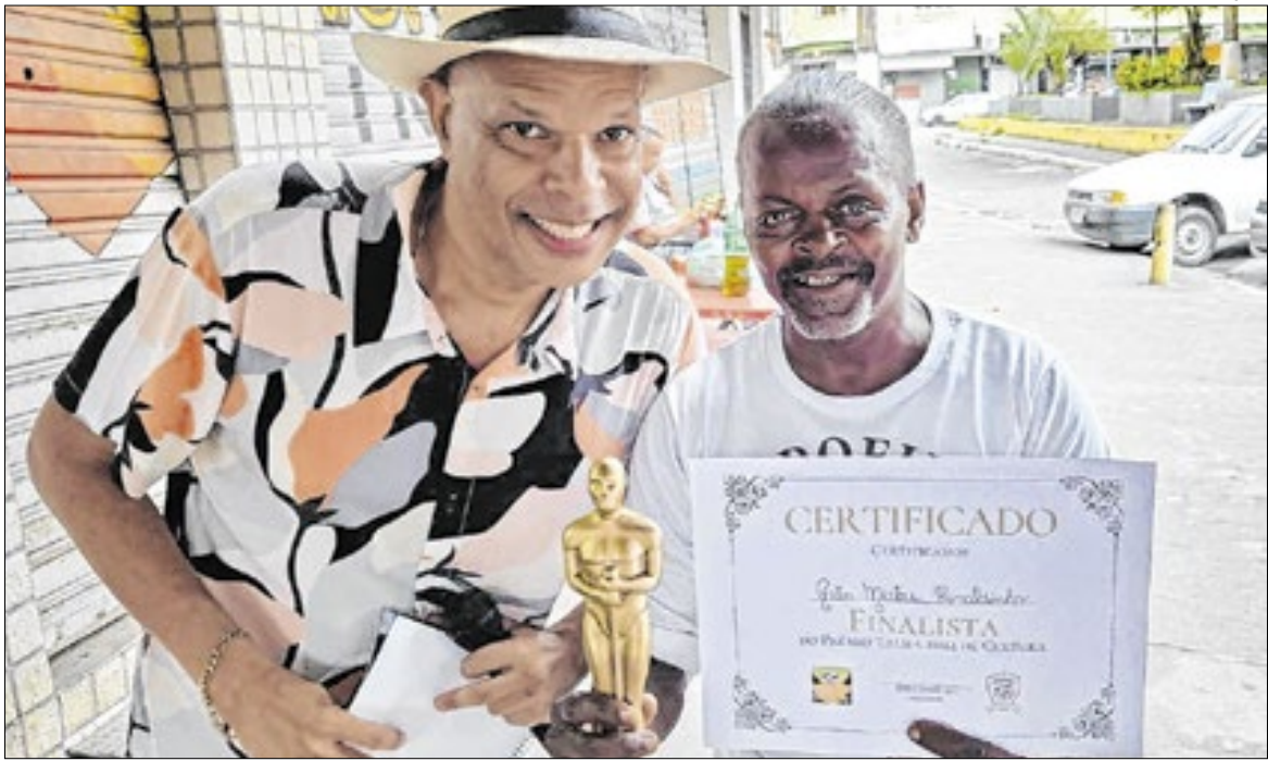
Nesta edição, são 66 finalistas distribuídos em 11 categorias. Todos os indicados serão certificados, e os três primeiros colocados de cada categoria receberão troféus.

Nesta edição, são 66 finalistas distribuídos em 11 categorias, representando cidades como Magé, Duque de Caxias, Nova Iguaçu, Belford Roxo, São João de Meriti, Nilópolis, Guapimirim, Queimados, Mesquita, Japeri, Seropédica e Itaguaí. Todos os indicados serão certificados, e os três primeiros co-