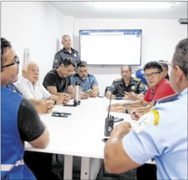
Reunião para definir o planejamento das obras

Além de melhorar significativamente a visibilidade noturna, a nova iluminação contribui para a redução de acidentes, facilitando a mobilidade de pedestres e motoristas no período da noite. Com investimentos contínuos em infraestrutura, a Prefeitura reafirma o compromisso com a promoção de espaços urbanos mais seguros.