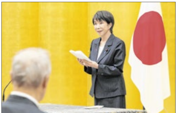
Takaichi foi exposta pelo secretário-geral de seu partido