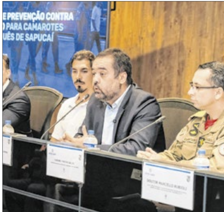
Governador Cláudio Castro (PL) anunciou o plano de prevenção

A piscina de 50 metros segue padrões internacionais. O Parque Oeste Ana Gonzaga ocupa 234 mil metros quadrados e terá ainda mais novidades. A obra, tocada pela Rio-Urbe, busca transformar o local em um polo de lazer completo, com mirante, chuveirão em cascata e área de refeição para uso da população.