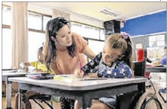
Agente de inclusão escolar faz parte do pessoal de apoio