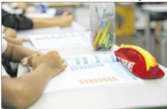
Professores no Estado do Rio estão com o piso defasado