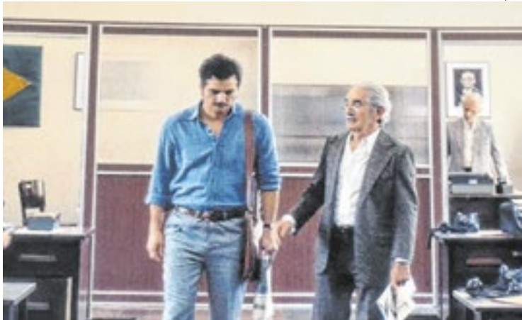
'O Agente Secreto' tem 52,9% de sua receita vinda do exterior

“O Agente Secreto” já arrecadou quase US$ 5 milhões (R$ 27 milhões) em arrecadação total desde seu lançamento. Segundo o site Box Office Mojo, a maior parte da receita veio de fora do Brasil. O longa arrecadou até agora US$ 4,629 milhões (R$ 24,96 milhões) em bilheteria global. Desse valor, US$ 2,1 milhões (R$ 11,3 milhões) é arrecadação doméstica, o que equivale a 47,1% do total. Já