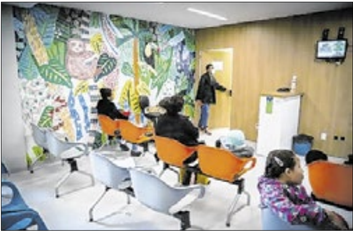
Atendimento ficará limitado a quadros graves