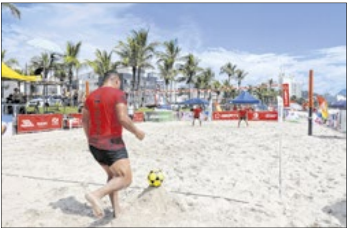
Atividade integra calendário oficial da temporada