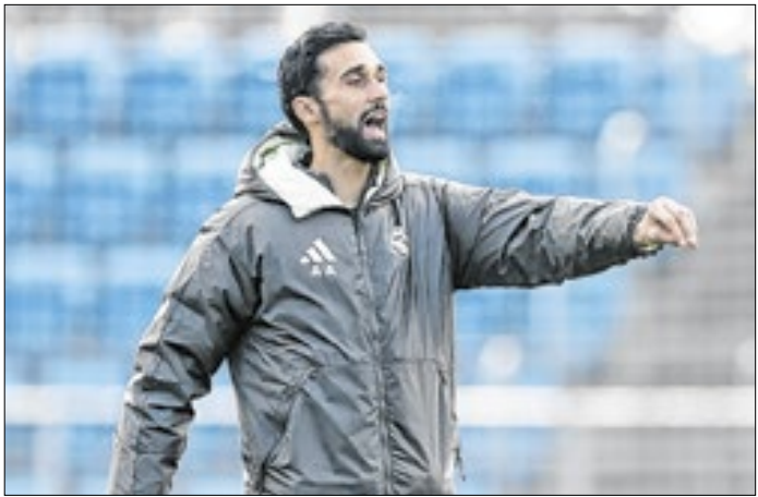
Arbeloa destacou o papel dos jogadores na reconstrução