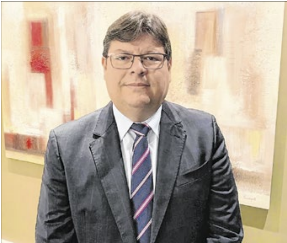
Solenidade em sua homenagem acontece neste mês de janeiro

Sob sua liderança, o MPRJ conduziu ainda as investigações sobre o assassinato da vereadora Marielle Franco. Ele também fortaleceu a atuação do Ministério Público no interior fluminense, ao visitar todas as unidades da instituição e se reunir com promotores de Justiça em diversas regiões do estado.