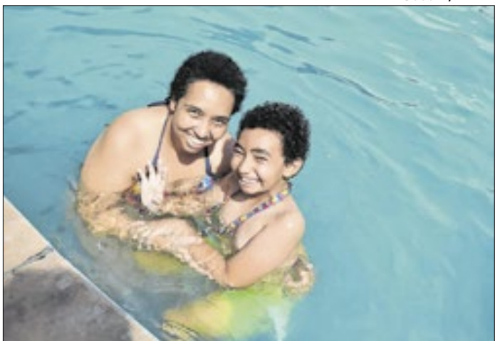
Ação visa oferecer lazer e dignidade aos PCDs