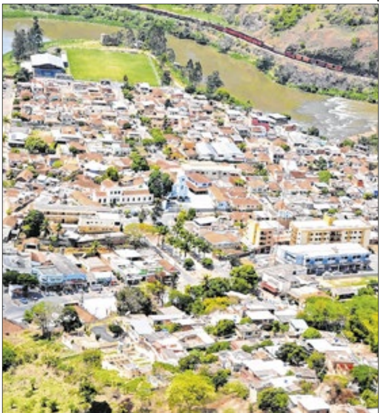
Prefeitura de Levy

A Prefeitura de Levy Gasparian foi questionada sobre a decisão judicial, mas até o fechamento desta edição não se manifestou.