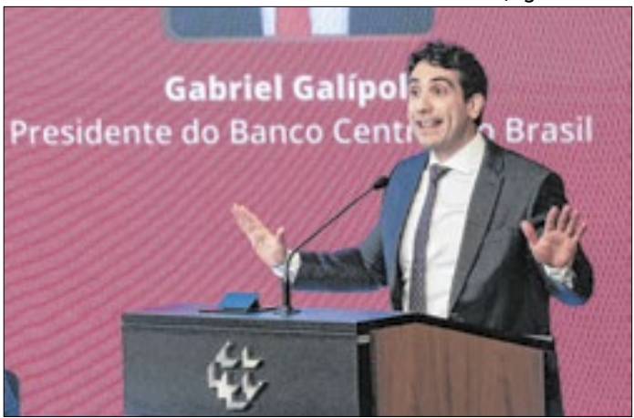
Galípolo: defesa da autonomia do BC