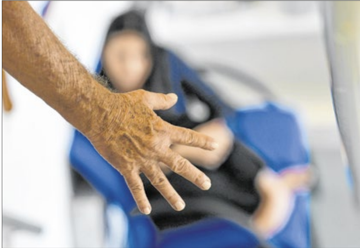
Especialista diz que realidade dos crimes de ódio contra a mulher é diária e avassaladora

Para denunciar violência contra a mulher, seja a vítima ou pessoa próxima, basta ligar gratuitamente para a central 180.