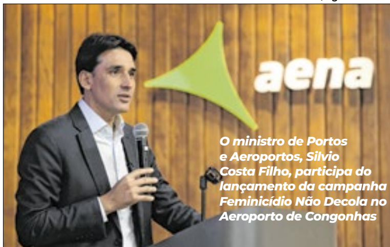
O ministro de Portos e Aeroportos, Silvio Costa Filho, participa do lançamento da campanha Feminicídio Não Decola no Aeroporto de Congonhas

A iniciativa faz parte da segunda fase da campanha “Assédio Não Decola”, iniciada em maio, voltada à conscientização e ao enfrentamento da violência contra as mulheres. A ação, desenvolvida pelo Ministério de Portos e