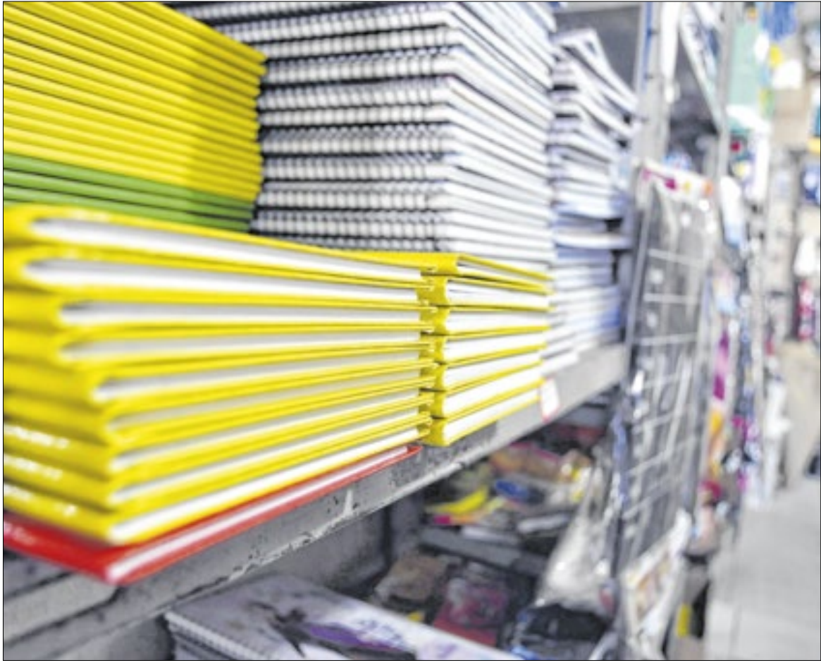
Procon de Barra Mansa orienta sobre compra consciente de material escolar no retorno às aulas