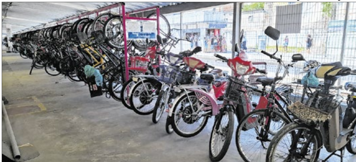
Espaços dos bicicletários estão completando dois anos de funcionamento para atender a população de Japeri

“Depois do sistema, o processo ficou muito mais ágil e o controle das bicicletas