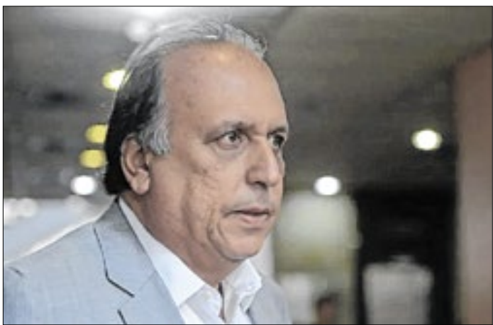
Pezão agradece apoio de vereadores de Piraí