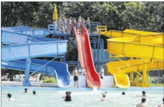
Atividade acontece na próxima sexta-feira (16)