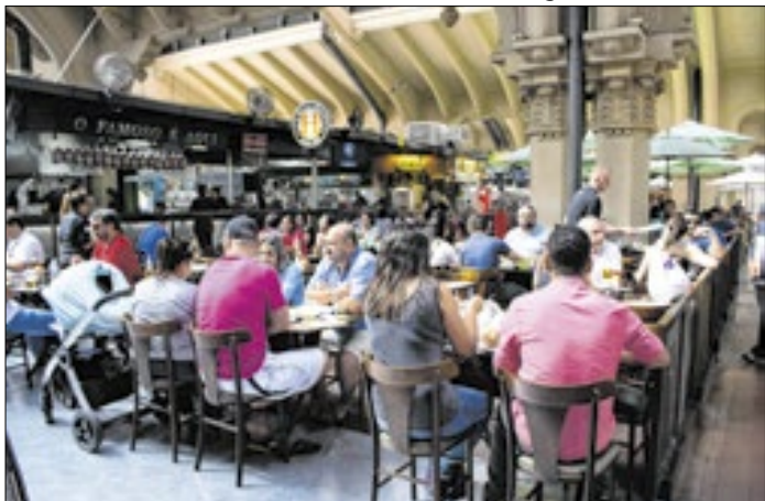
Alimentação é destaque no faturamento do setor