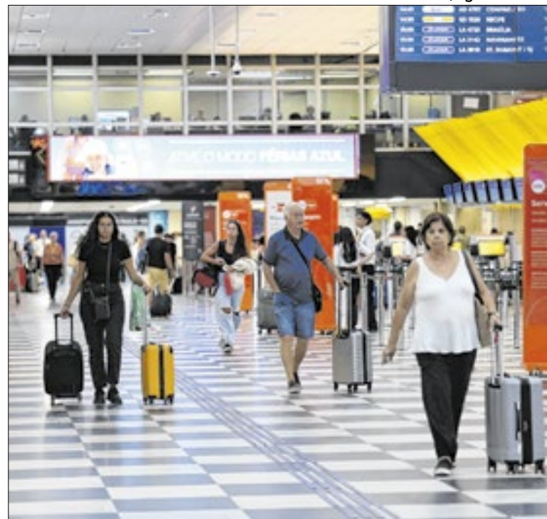
Brasil acompanha expansão global e bate recorde histórico

O acordo é firmado em um momento favorável para o turismo fluminense. Em 2025, o Rio de Janeiro recebeu 2,19 milhões de turistas internacionais, crescimento de 43,7% em relação ao ano anterior. O desempenho acompanha o recorde nacional, que fechou o ano com 9,3 milhões de visitantes estrangeiros no país.