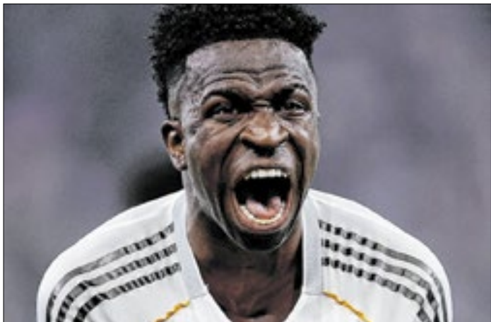
Novo técnico do Real Madrid elogiou o camisa 7 brasileiro