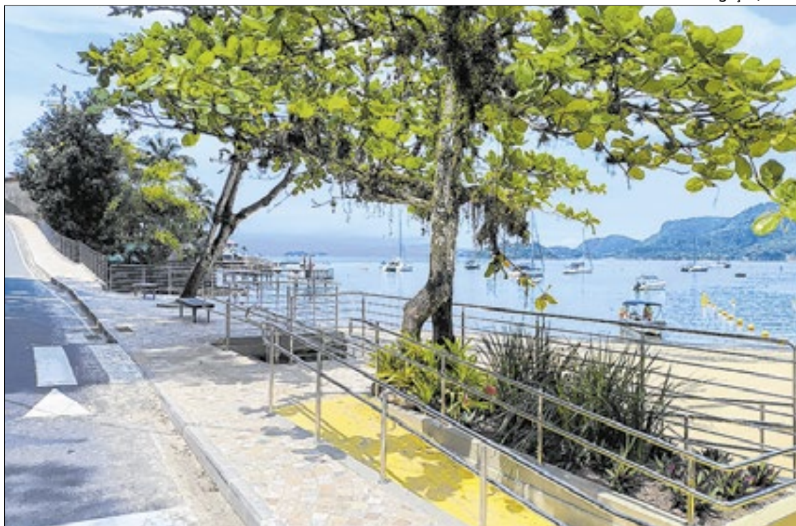
Angra dos Reis tem projeto para melhorar abastecimento de água, diz prefeitura

Entre os serviços previstos está a construção de uma nova ETA, com vazão de 150 L/s, prevista para a Rua Rei Baltazar, na Japuiba. Para viabilizar a conexão à nova unidade, será realizado o remanejamento de um trecho da adutora de 400 mm na Estrada da Banqueta, além da execução de uma nova interligação de 500 mm da adutora antiga da Cedae à futura estação.