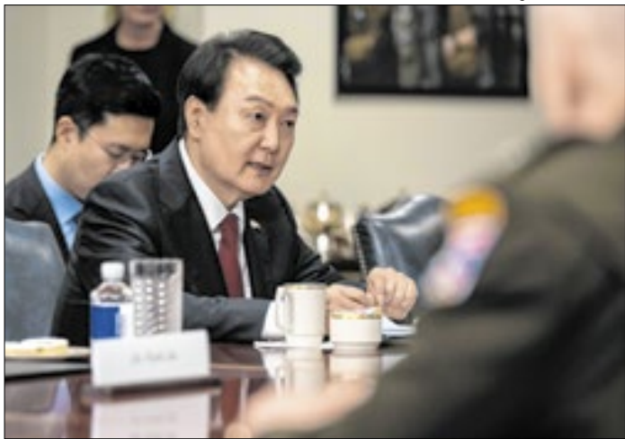
Ex-presidente da Coreia do Sul tentou golpe de Estado