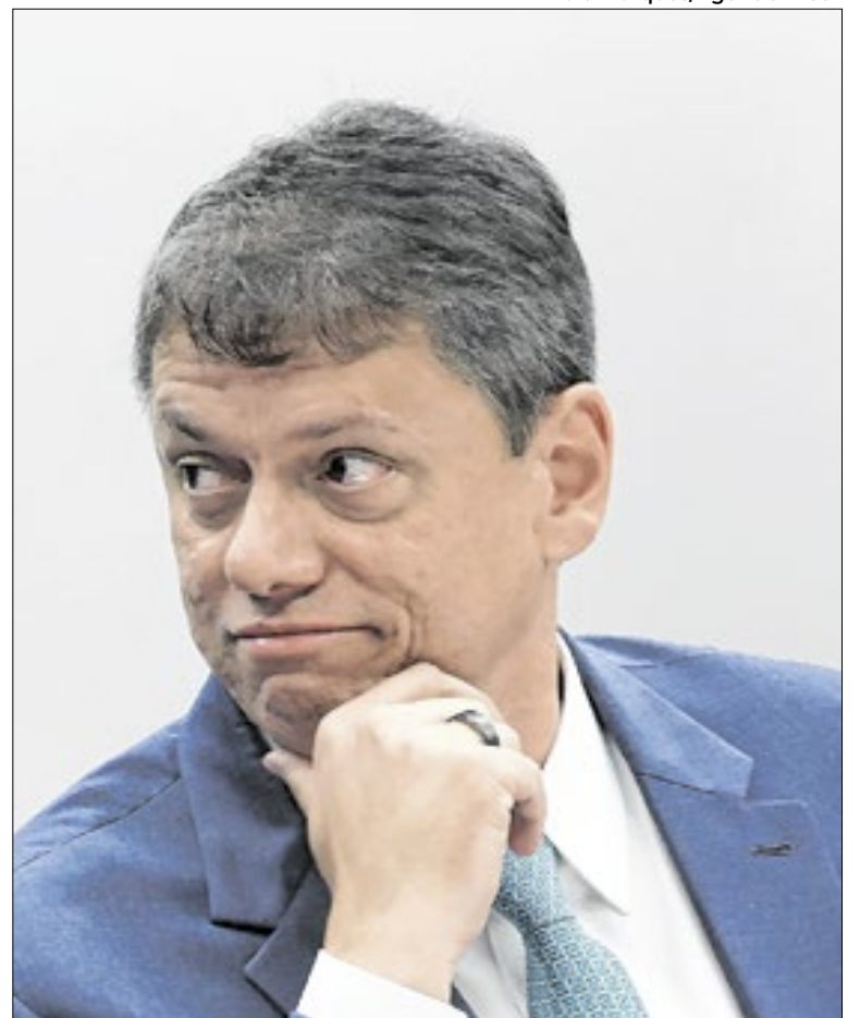
Pesquisa mostra Tarcísio como único que empataria com Lula