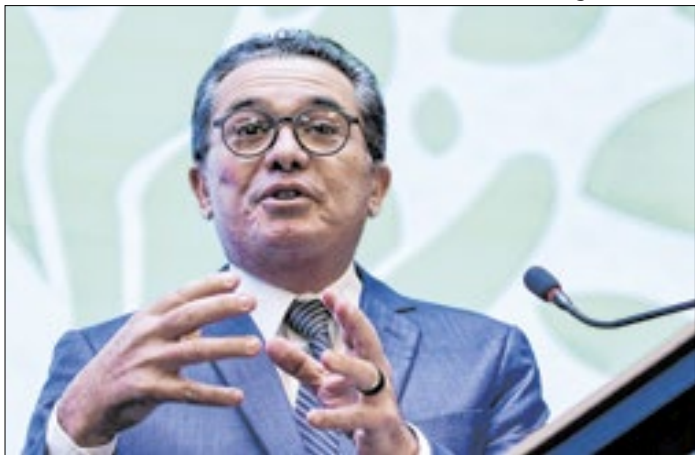
Vital: acordo para evitar desmoralização