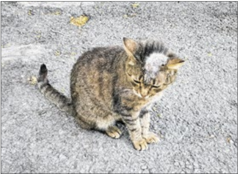
A ação é voltada para gatos que apresentem lesões suspeitas

Durante cinco horas, o público poderá mergulhar no universo dos grãos especiais, além de ter oportunidade de conversar diretamente com produtores de café dos estados do Rio, Espírito Santo e Minas Gerais. Haverá ainda oficinas e uma palestra sobre Alimentação Inclusiva. Quem chegar cedo vai poder degustar cafés especiais.