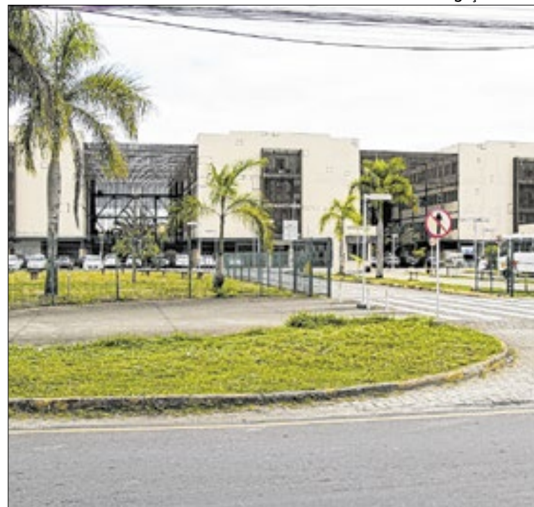
UFF possui unidades no Aterrado e na Vila Santa Cecília

Nesta primeira edição de 2026, a atração musical fica por conta do cantor Willian Gastão. No local, barracas típicas de feirantes também estarão em funcionamento ao longo do evento. O objetivo da Feirarte é valorizar microempreendedores locais e fomentar o turismo regional, com foco em garantir o lazer da população.