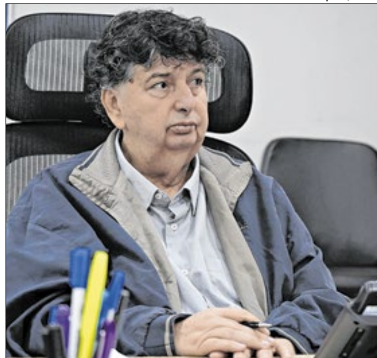
Índice vale para funcionários ativos, inativos e pensionistas

“A implantação do GTAM fortalece a Guarda Municipal, aprimora o serviço prestado à população e contribui para ampliar a capacidade de resposta do Município frente às crescentes demandas de segurança”, conclui o vereador Sargento Ramires (PL), em defesa de sua lei.