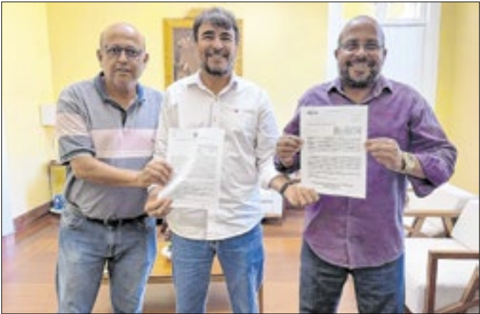
Prefeito Marcelo Batista com seus secretários