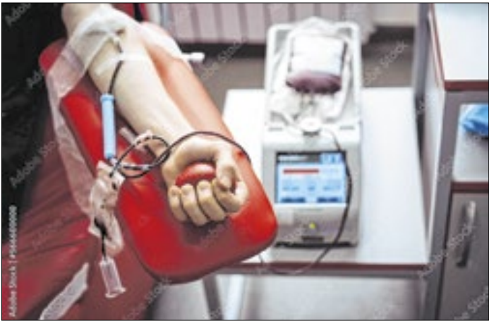
Uma doação de sangue pode salvar até quatro vidas