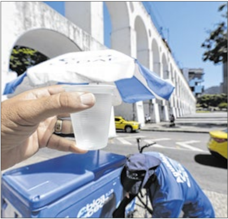
Águas são distribuídas em copos biodegradáveis

A Secretaria de Saúde realiza anualmente a campanha de vacinação antirrábica no segundo semestre, buscando reforçar a proteção dos pets contra a raiva. A vacinação antirrábica é segura, gratuita e essencial para cães e gatos, além de integrar um conjunto de ações permanentes de vigilância e controle de zoonoses.