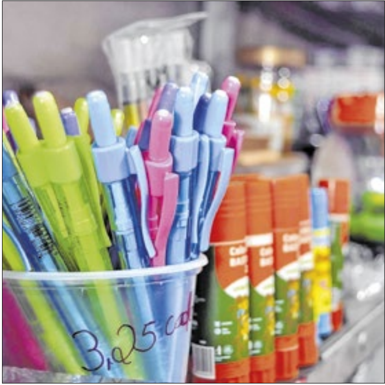
Procon reforça que escolas não podem impor marcas

O consumidor pode se recusar a comprar esses itens e procurar o Procon para que seus direitos sejam garantidos”, explicou o advogado.