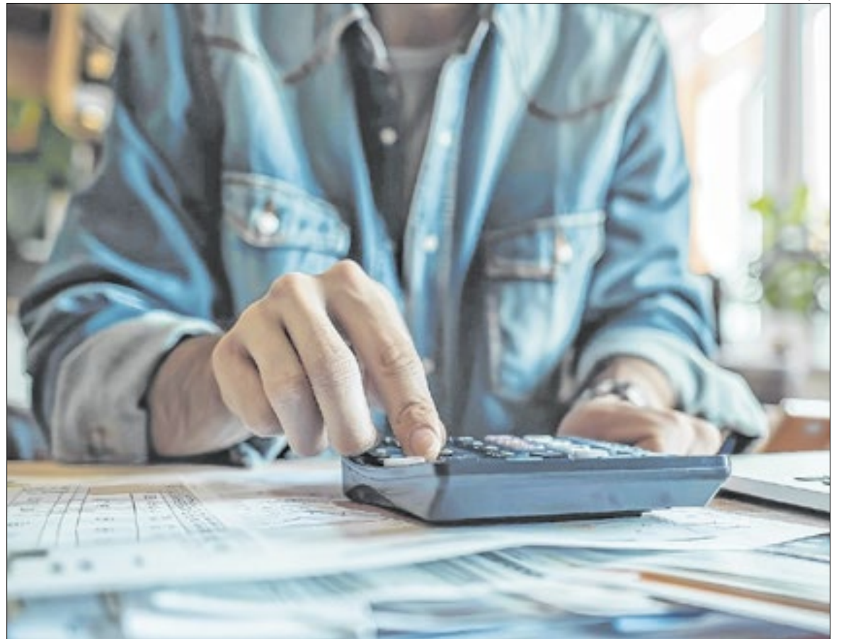
Contas do início do ano causam estresse em famílias, alerta especialista da Hapvida

"Existe uma série de apelos, de todas as naturezas, nessa época do ano (final de ano), para que se consuma cada vez mais. O fim do ano chega, gastamos de forma desregrada, em seguida janeiro chega, com um monte de contas para pagar e não se tem recurso,