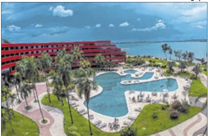
Royal Tulip Brasília Alvorada projeta melhor janeiro