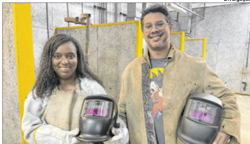
Fundec está com mais de 17 mil vagas abertas em cursos gratuitos

A seleção será realizada por sorteio eletrônico; o resultado será divulgado no dia 24 de janeiro, a partir das 12h, no site da instituição.