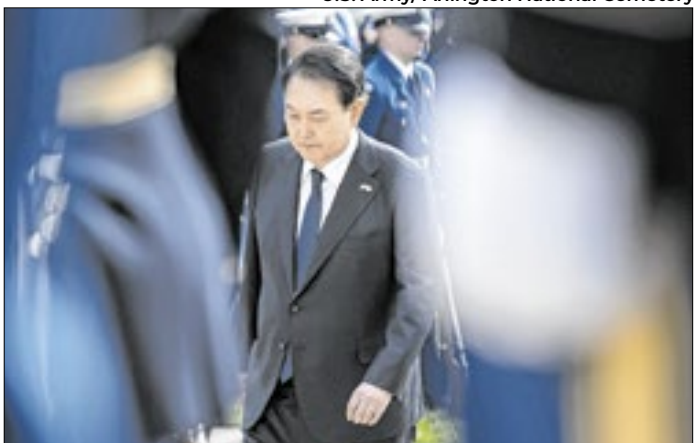
Yoon Suk Yeol pode ser condenado a pena de morte