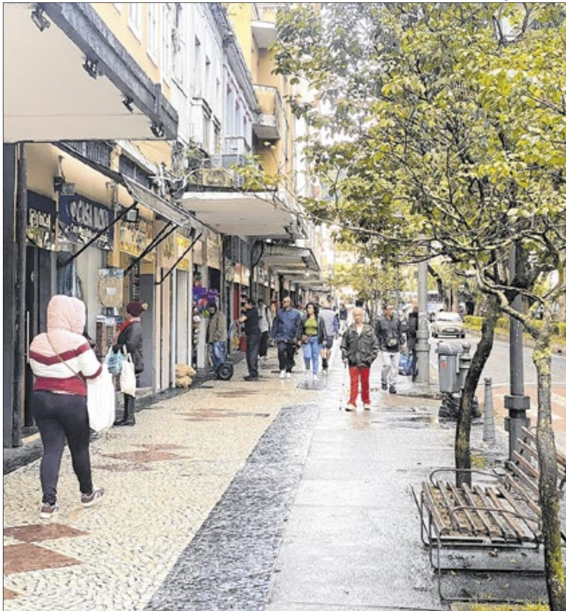
Foram 195 empresas a mais abertas em 2025, quando comparado ao ano anterior

Outro destaque foi o aumento dos serviços de escritório, que passaram de 46 empresas em 2024 para 48 em 2025. Já os escritórios de consultoria, que não apareciam entre os cinco primeiros em 2024, entraram em 2025 com 49 novos registros, substituindo as lanchonetes, casas de chá, de sucos e similares, que