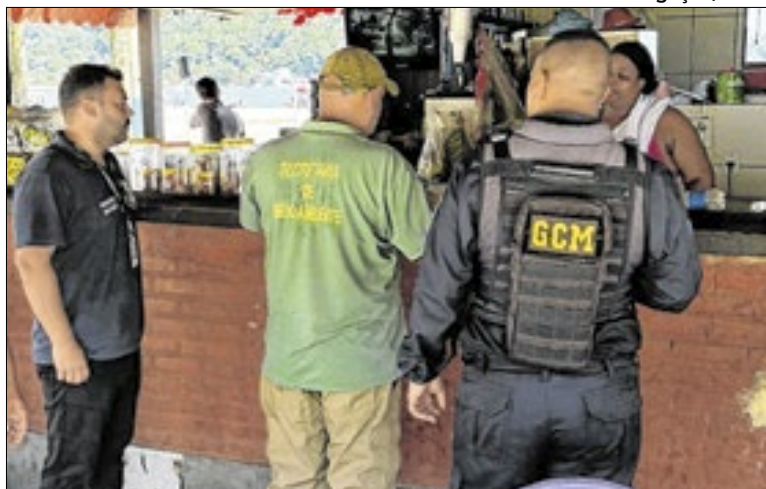
Operação vistoriou estabelecimentos em Mangaratiba

O outro estabelecimento foi interditado por não possuir licença sanitária para funcionamento. Os demais quiosques vistoriados foram notificados