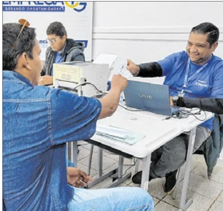
Dados do Novo Caged apontam avanço no emprego

Três Lagoas (MS) retomará, na quinta (15), as atividades do Comitê Municipal de Mobilização e Combate às Arboviroses. A primeira reunião do ano ocorrerá às 8h, no auditório do Sindicato dos Servidores Públicos Municipais, para definir metas e planejar ações integradas contra dengue, zika e chikungunya em 2026.