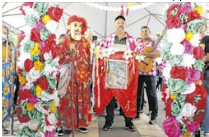
Evento cultural reunirá 30 municípios convidados