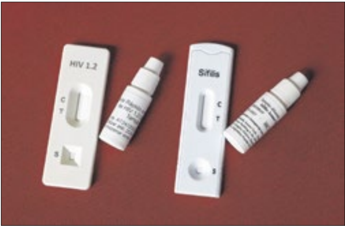
Sunlenca se torna nova ferramenta para PrEP