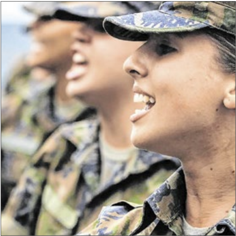
Datas variam de acordo com o cronograma de cada Força

Na avaliação das duas instituições públicas, a transformação digital ainda avança de forma desigual. Isso porque, enquanto alguns estados e municípios dispõem de estrutura técnica para desenvolver soluções próprias, outros enfrentam limitações que dificultam a digitalização de serviços públicos.