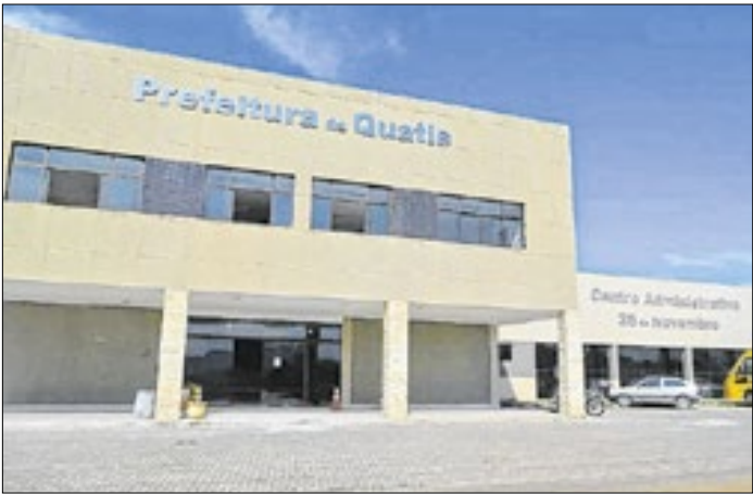
Inscrições na prefeitura de 19 a 23 de janeiro