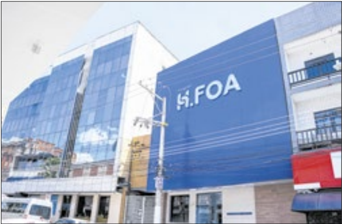
H.FOA está localizado no bairro Jd. Amália

Os interessados devem apresentar documentação específica, incluindo ficha de cadastro, documentos pessoais, comprovante de residência, declarações de renda e capacidade de criação, além de comprovação de posse ou propriedade do local de destino do animal. O processo de seleção seguirá critérios objetivos, como análise da documentação, entrevista complementar e visita técnica ao local de criação.