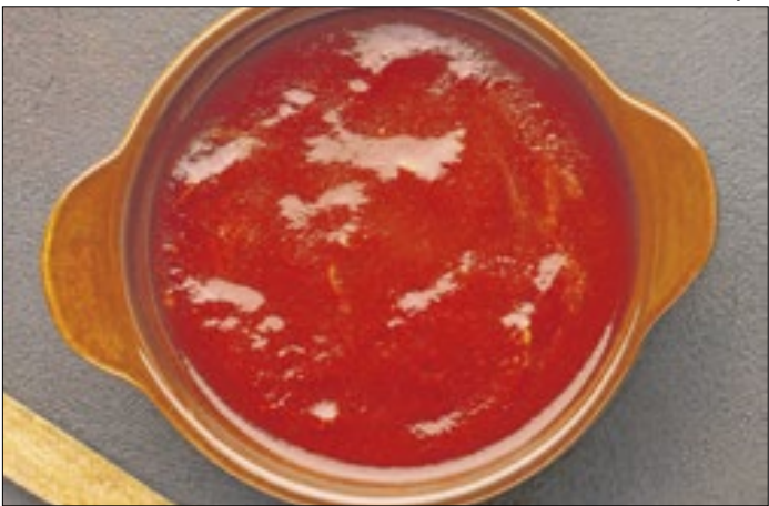
Lote teve venda, distribuição e consumo suspenso