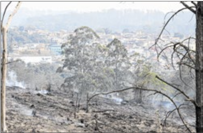
Redução chegaria a 33% em cidades com tratamento