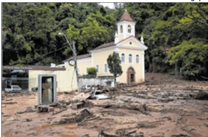
Igreja de Santo Antônio atingida pelo deslizamento em 2011