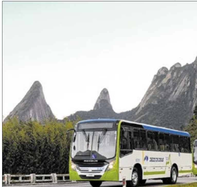
Linha gratuita vai beneficiar moradores do 2º Distrito

Os selecionados serão contratados pelo período de 12 meses, com possibilidade de prorrogação por igual período. O edital, com data de inscrição, requisitos a serem preenchidos pelos futuros candidatos e documentos a serem apresentados, entre outras informações, pode ser consultado no site da Prefeitura.