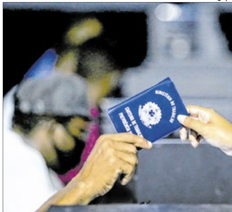
A taxa de desemprego recuou para 5,2%, a menor já registrada desde 2012, refletindo crescimento consistente em todos os estados e setores da economia