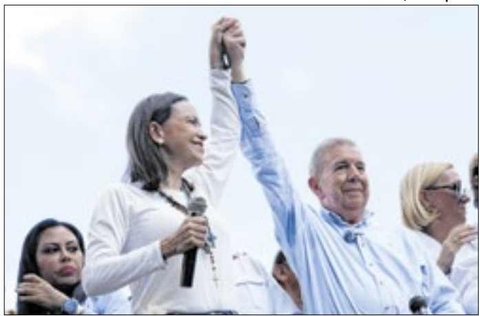
Machado defende que Edmundo González assuma o país