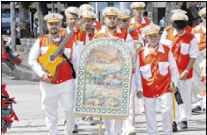
Valorização da cultura popular fluminense