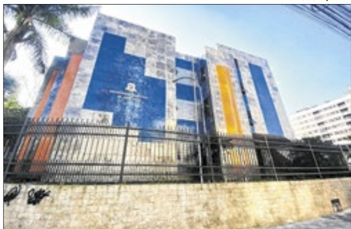
Secretaria Municipal de Educação de Teresópolis