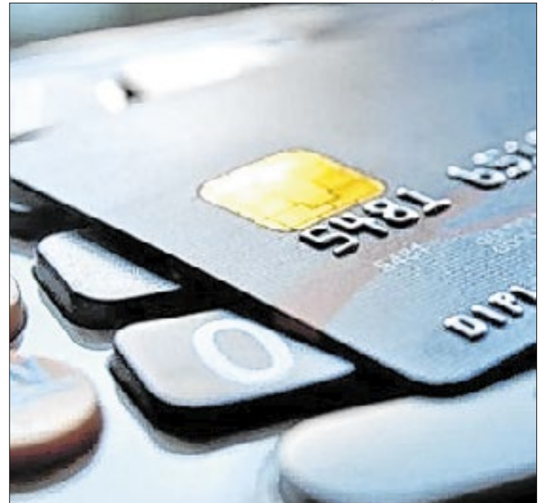
Serviço BC Protege+ é totalmente gratuito e opcional

Apesar do superávit elevado, o resultado do ano passado representou uma queda de 7,9% em relação a 2024, quando o saldo foi de US$ 74,2 bilhões. Para 2026, o ministério estima exportações entre US$ 340 bilhões e US$ 380 bilhões. As importações devem variar de US$ 270 bilhões a US$ 290 bilhões.