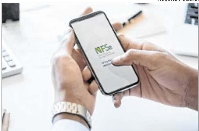
Sistema tem objetivo padronizar, simplificar e integrar