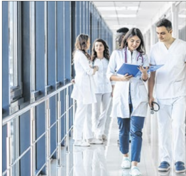
Alunos de Medicina da rede privada podem se beneficiar

Os hospitais cariocas listados são: o Hospital Estadual Transplante, Câncer e Cirurgia Infantil, no Valqueire, Hospital Municipal Lourenço Jorge, na Barra da Tijuca, Instituto Estadual de Cardiologia Aloysio de Castro, no Humaitá, Instituto Estadual do Cérebro Paulo Niemeyer, no Centro, e a Maternidade da Mulher Mariska Ribeiro, em Bangu.