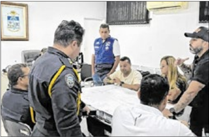
Encontro para organização do entorno para o evento