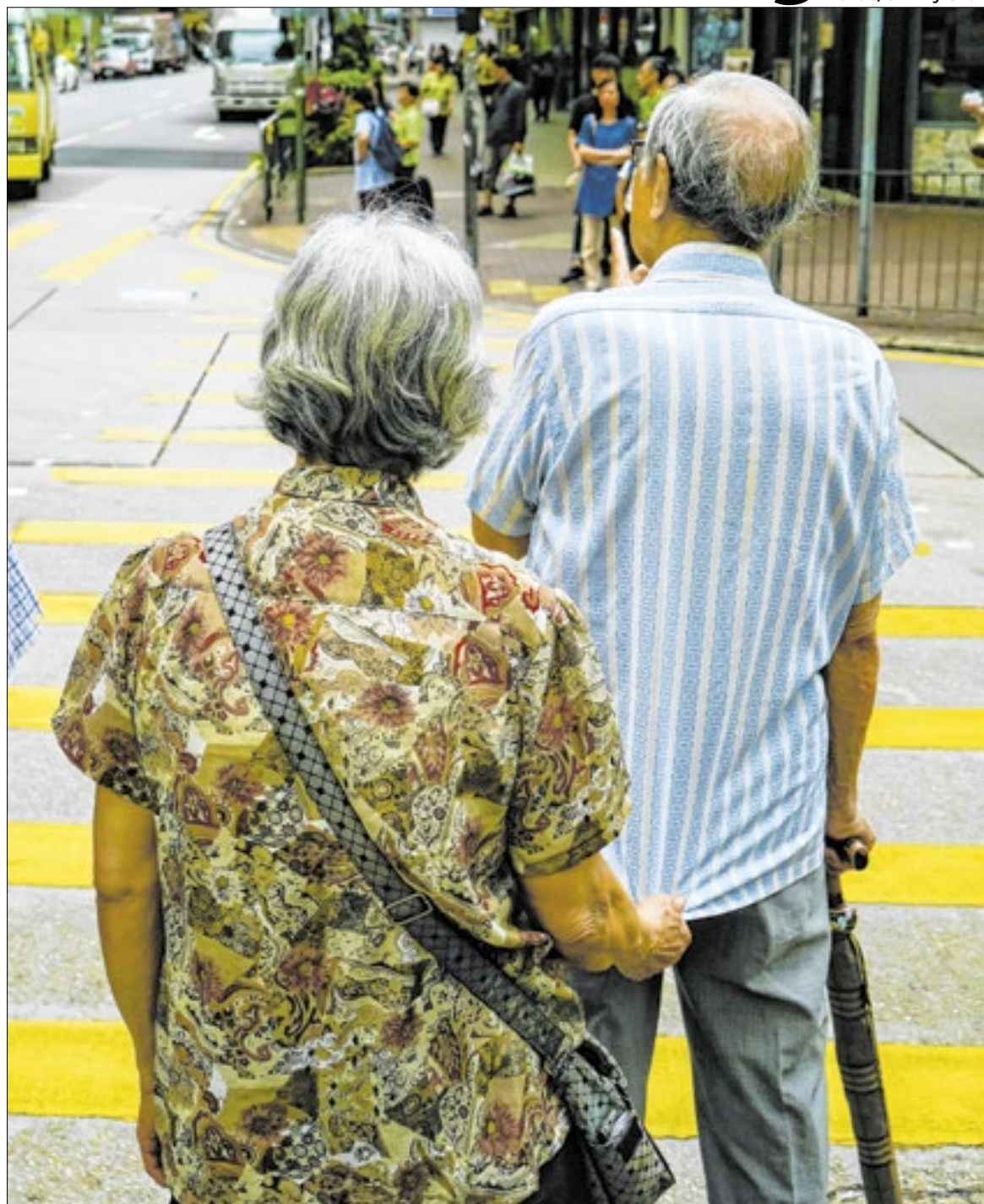
O envelhecimento da população deve ser visto como um motivo para que as empresas se preparem para o futuro

“Em um nível individual, por exemplo, não é possível prever