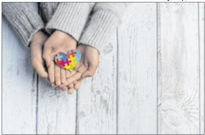
Benefício é voltado para pessoas com TEA no município