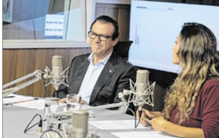
Marinho durante entrevista ao programa “Bom Dia, Ministro”

Luiz Marinho ressaltou ainda que a renda do trabalho exerce papel estratégico no financiamento de políticas públicas estruturantes. Recursos como o Fundo de Garantia do Tempo de Serviço (FGTS) e o Fundo de Amparo ao Trabalhador (FAT) são fortalecidos com o crescimento do emprego formal, con-