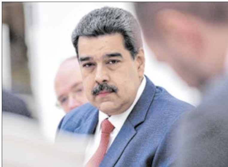
Maduro será julgado por conspiração e narcoterrorismo

das grandes lideranças dos cartéis de drogas, é uma forma de mostrar força para a sociedade americana. É mostrar o Maduro como se fosse um ‘troféu’.