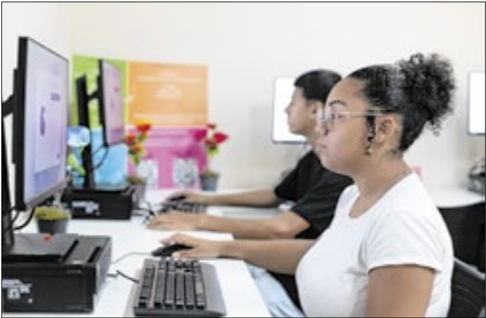
Aulas serão realizadas no Centro Oportunizar, na Vila