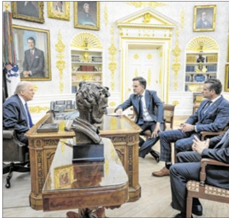
Trump falou com Secretário-Geral da OTAN Mark Rutte em 2025

Prefeito de Minneapolis exigiu que os agentes de imigração deixem a cidade imediatamente. “A presença de agentes federais de imigração está causando caos em nossa cidade”, afirmou Jacob Frey nas redes sociais. Governador de Minnesota, Tim Walz, disse que está reunindo informações sobre o incidente.