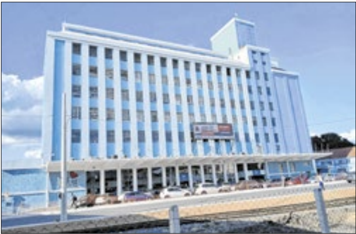
Sindicato quer ainda fixação de multa a gestão municipal