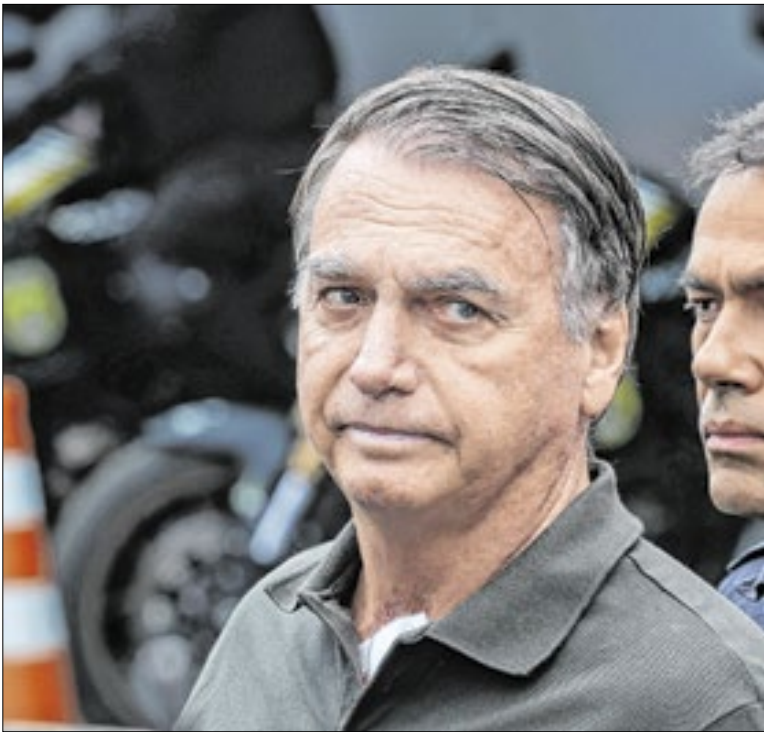
Médicos agora acreditam que Bolsonaro teria tropeçado

Indicado por Lula para o STF, Jorge Messias corre o risco de enfrentar armadilha preparada pela oposição no Senado: a de ter seu nome aprovado na Comissão de Constituição e Justiça e acabar barrado pelo plenário. Ele até mandou mensagens de Boas Festas para a oposição, que aposta na sua derrota.