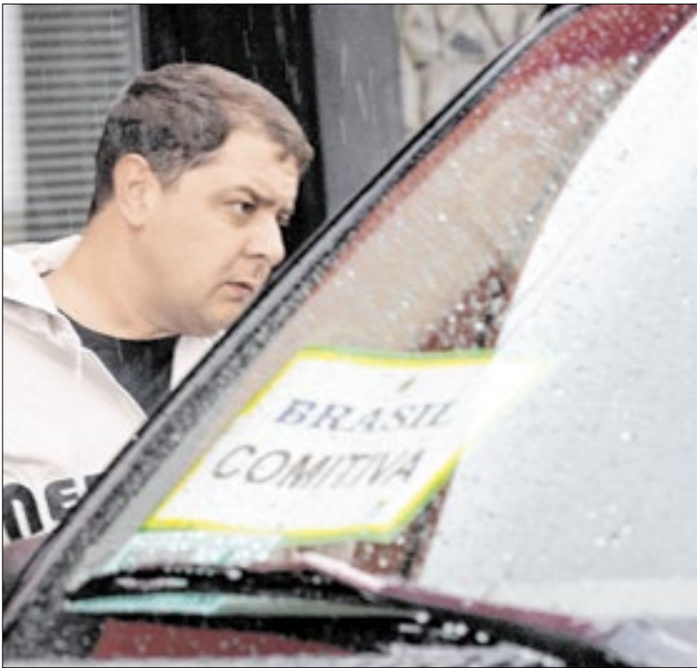
CPMI pretende investigar relações do filho de Lula

Será preciso ver se tais dados afunilam a disputa até abril. Alguns movimentos foram percebidos. Movimentos começaram. No Paraná, informações de que Ratinho Jr permaneceria no governo. Em Goiás, que o governador Ronaldo Caiado (União) poderia desistir da Presidência e sair para o Senado.