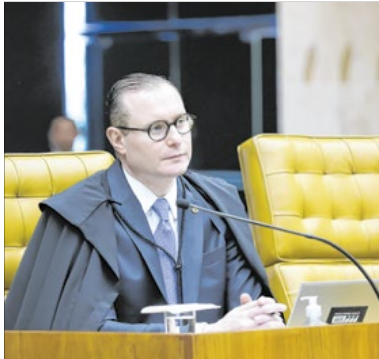
Zanin: artigo 40 estabelece que regime é para servidores

O texto no Congresso prevê ainda a criação de carreiras para o Poder Executivo federal, reajusta a remuneração de carreiras da Receita Federal e da Auditoria-Fiscal do Trabalho, bem como o percentual máximo do bônus de eficiência e produtividade atribuído aos aposentados e pensionistas.