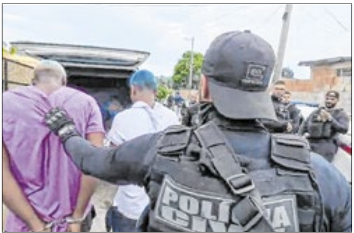
Apertando o cerco contra organizações criminosas