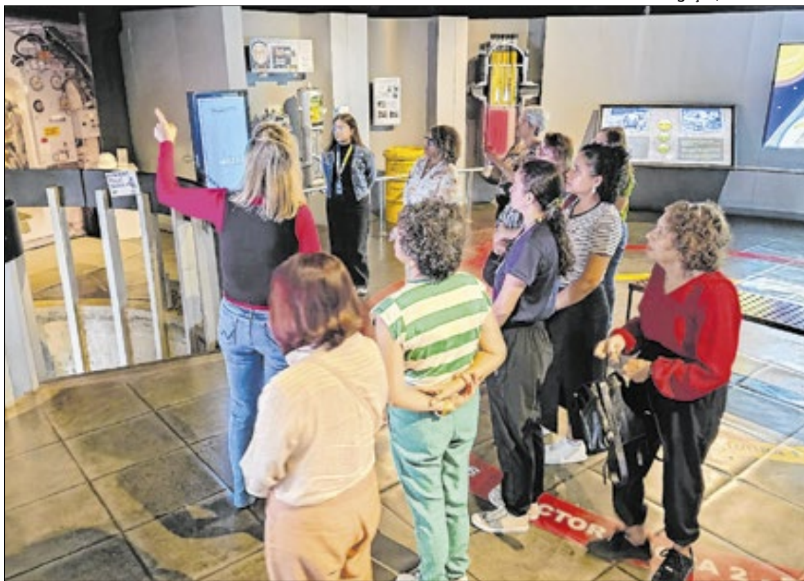
Observatório nuclear fica na Rodovia Rio-Santos próximo à entrada da Central Nuclear

-Conseguimos estabelecer boas parcerias neste ano para ampliar o conhecimento das pessoas