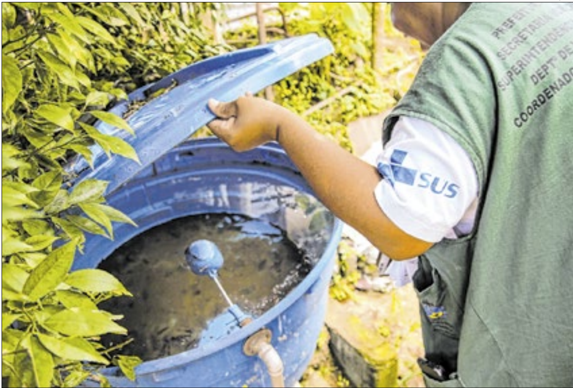
Até o dia 30 de novembro de 2025, foram 628.781 visitas de rotina aos imóveis