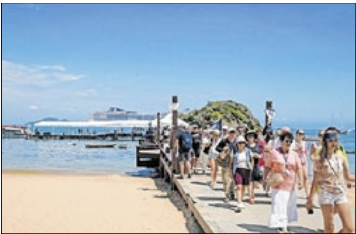
Mais de 76 mil passageiros na temporada são previstos