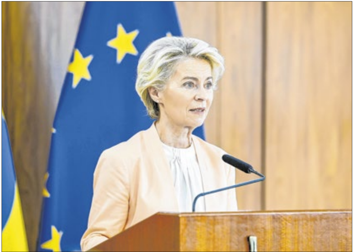
Se o Conselho aprovar o acordo, Ursula von der Leyen assinará o termo na América do Sul