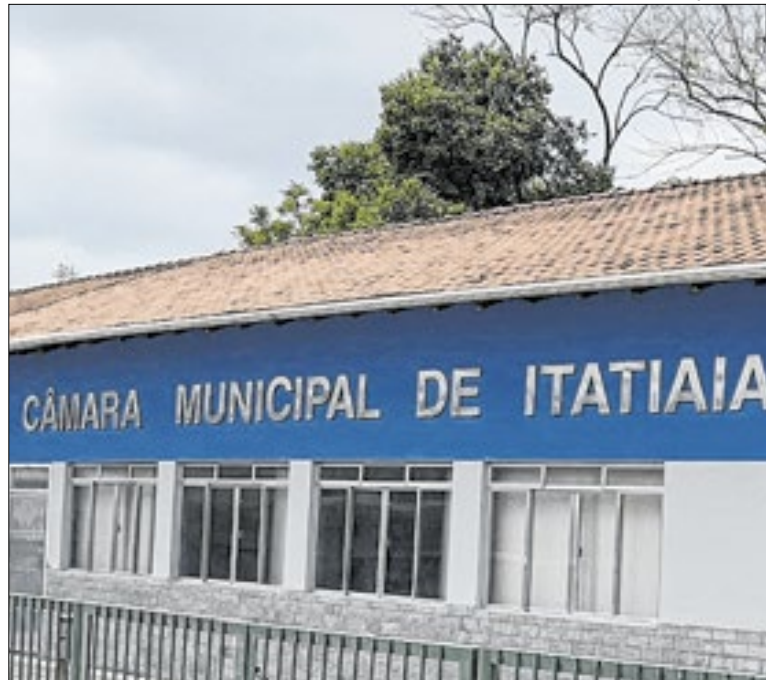
Vereadores do PSD da Câmara de Itatiaia sob suspeita

Pacientes da Linha de Atenção Oncológica, de Volta Redonda, foram beneficiadas pela implantação do serviço de navegação do paciente em julho de 2025, no H.FOA. O sistema garante assistência individualizada que guia pessoas, especialmente com câncer, durante toda a sua jornada de tratamento.