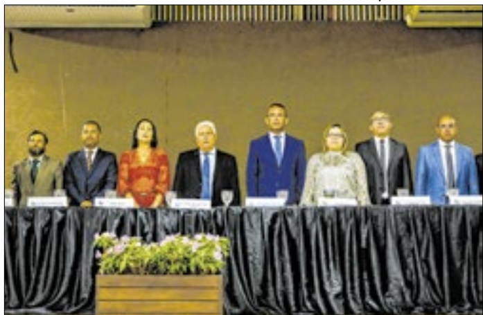
Sessão solene na Câmara Municipal de Angra dos Reis