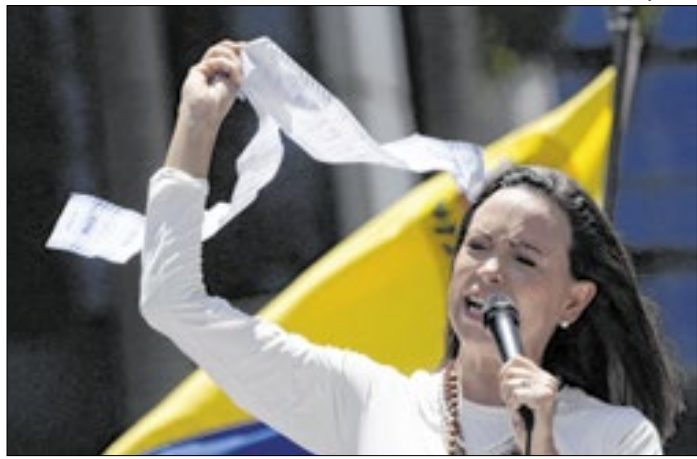
Maria Corina quer que a oposição governe a Venezuela