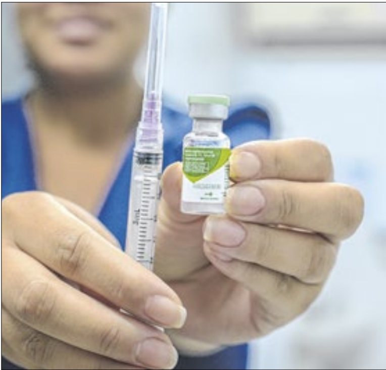
Imunizante está disponível gratuitamente nas UBS

A prefeitura de Quatis também afirmou que o Sistema Emissor Nacional de Notas Fiscais, base de dados do sistema municipal, está apresentando instabilidade. O sistema nacional da Receita Federal tem registrado falhas temporárias no processamento das emissões, o que acarreta em imprecisões pontuais.