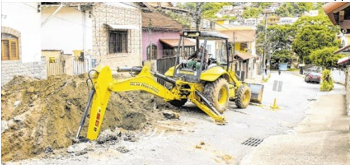
O reparo na rede pluvial da Rua Santos Dumont faz parte de um pacote de intervenções

O reparo na rede pluvial da Rua Santos Dumont faz parte de um pacote de intervenções preparado pela