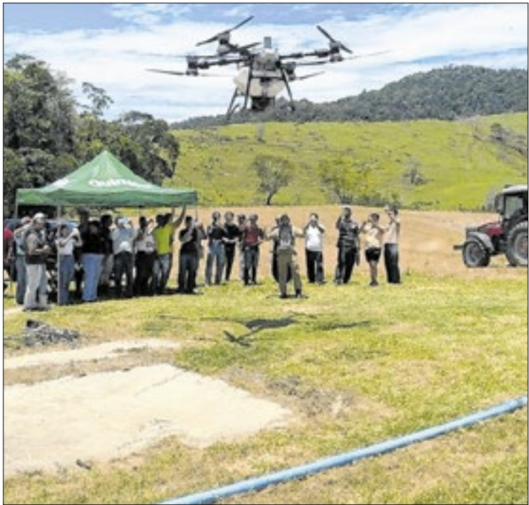
Fortalecimento da proteção ambiental

Organizada pelo GSI-RJ, a ação integra as polícias Militar e Civil, secretarias estaduais e prefeituras. A operação envolve o uso de retroescavadeiras, rompedores hidráulicos e caminhões, o que otimiza o processo de retirada dos materiais. Ação acontece de forma coordenada em 18 comunidades.