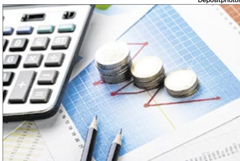
Impostos, matrículas e despesas acompanham início do ano

Manter as contas em dia e o orçamento equilibrado pode