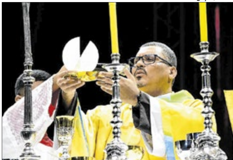
Eventos aconteceram na Praia do Anil em Angra dos Reis