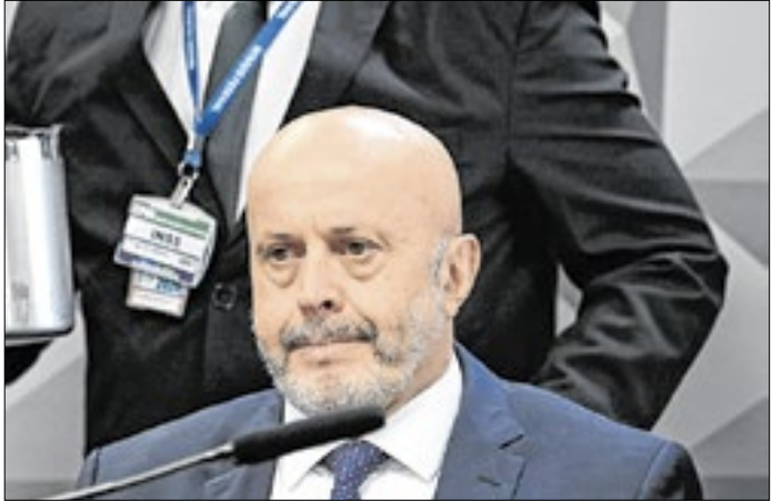
'Careca do INSS': suposta ligação com filho de Lula