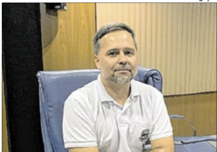
Vereador Tiago Forastieri de olho na Saúde de Resende