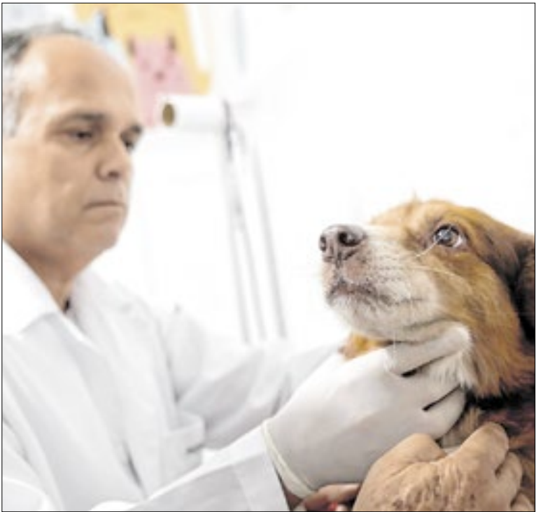
Média diária de 60 a 70 animais assistidos

As ações intensificadas de fiscalização de trânsito da Secretaria de Mobilidade Urbana seguem produzindo resultados positivos. A ação em conjunto da Coordenadoria de Trânsito, em parceria com a Polícia Militar, recuperou duas motocicletas com anotações de roubo/furto, durante as festividades de fim de ano.