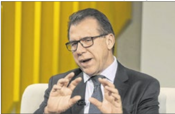
Ministro Luiz Marinho participará do “Bom Dia, Ministro”