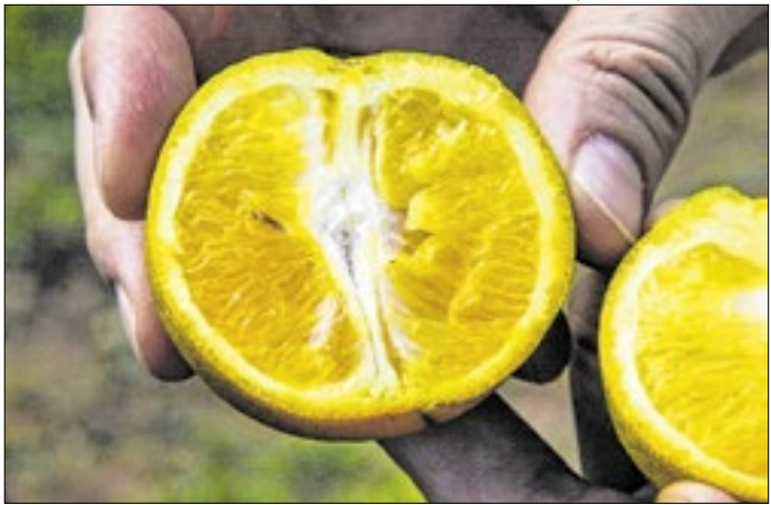
Profissional da Defesa Agropecuária inspeciona fruta