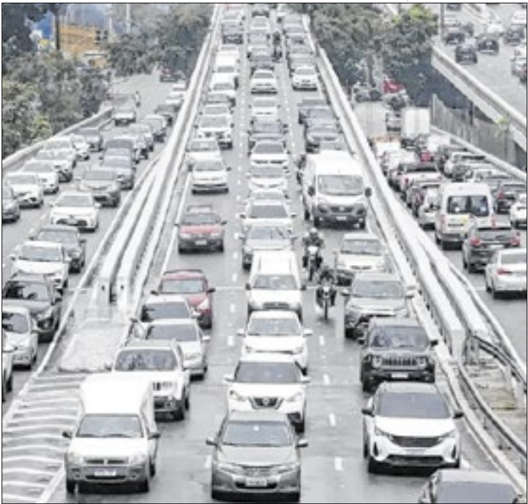
Para licenciar, é preciso antes quitar eventuais multas

O Fundo Social iniciou o repasse de 4.800 cestas básicas a municípios do litoral paulista, dentro da Operação Verão Integrada. A ação, em parceria com a Polícia Militar, beneficia até 19,2 mil pessoas em situação de vulnerabilidade social. Entregas ocorrem entre 6 e 11 de janeiro, abrangendo Baixada Santista, Litoral Sul e Litoral Norte.