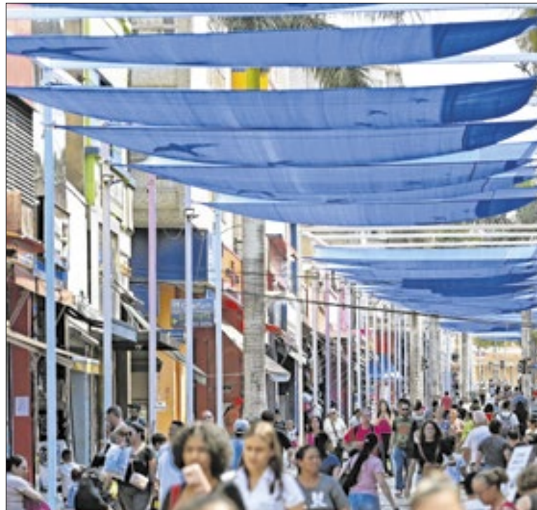
Janeiro tem promoções mas também muitas despesas

Também no Castro Mendes, “A Cigarra e a Formiga” chega no dia 17 de janeiro. A obra fala de uma cigarra e uma formiga que fazem escolhas de vidas diferentes. Na história, as crianças vão encontrar lições sobre solidariedade, humor e altas doses de poesia. A entrada é R$ 20 (inteira) e R$ 10 (meia).