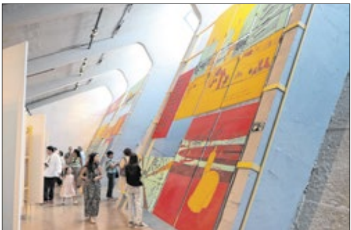
Painéis gráficos são o destaque da exposição