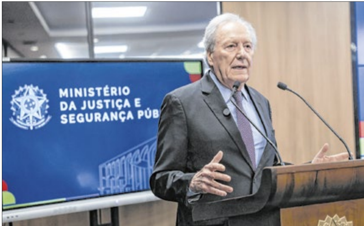
Lewandowski deve ser o primeiro de 20 ministros que deixarão o governo

Para além de Lewandowski, o ministro da Fazenda, Fernan-