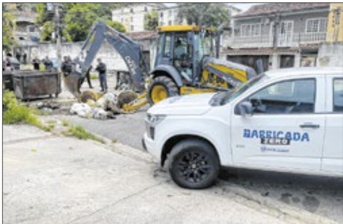
Equipes atuam em diversas frentes contra os entulhos