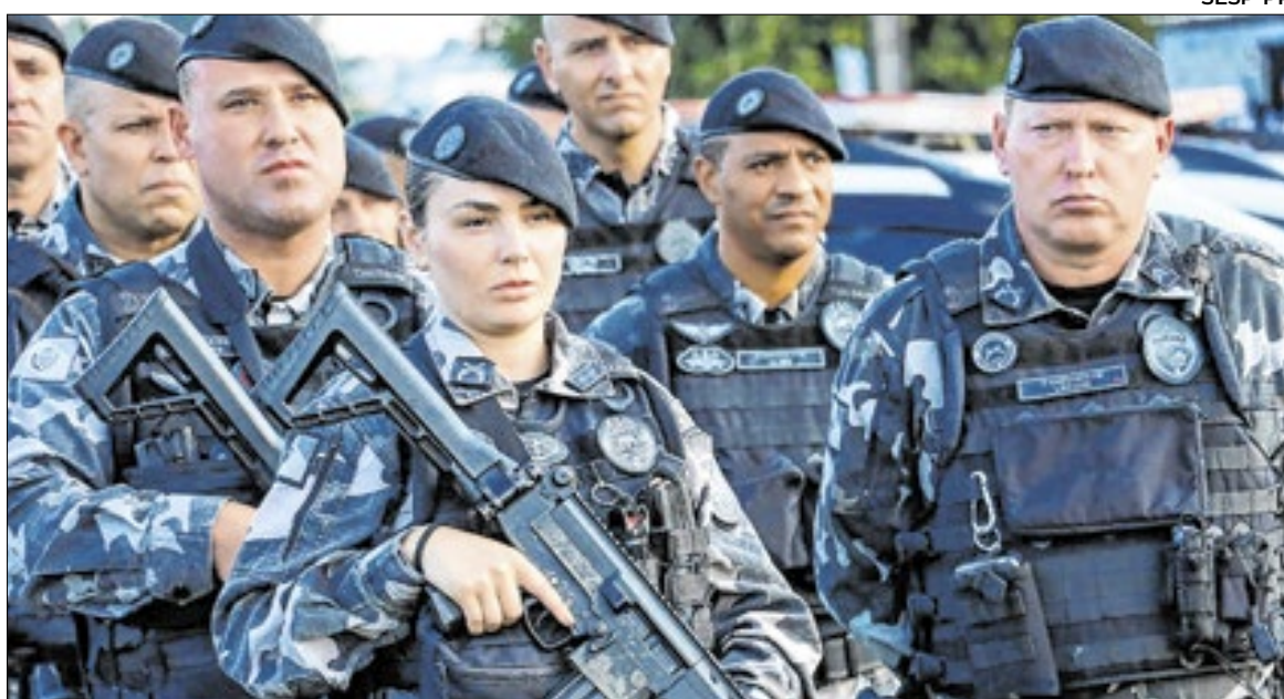
Dados mostram que 12% dos agentes da PM do país são mulheres

Essa predominância masculina se reproduz nas próprias forças policiais