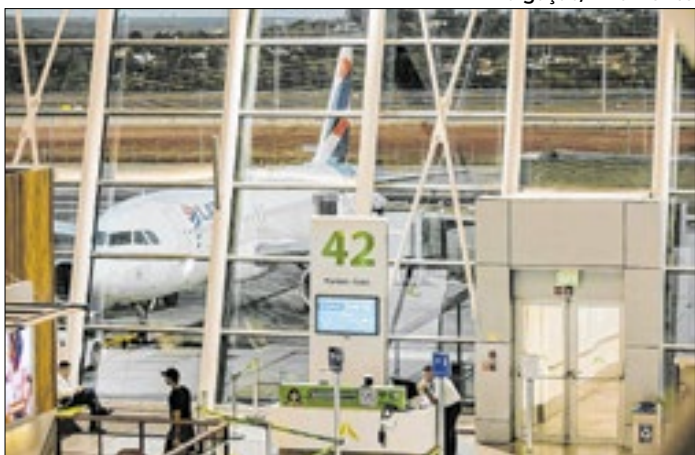
Terminal mantém liderança nacional em eficiência