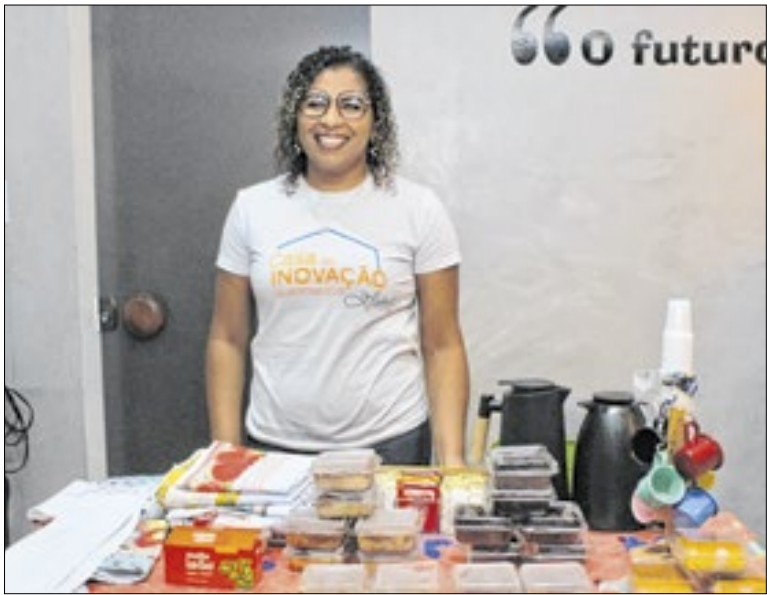
Município realizou evento de incentivo ao empreendedorismo feminino em Queimados

Em setembro, 128 alunos do 6º ao 9º ano do Ensino Fundamental da rede municipal de Queimados trocaram o campo de futebol pelo