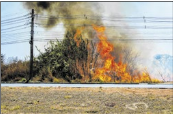
As queimadas oferecem risco de morte para seres vivos