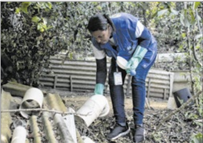
Mutirão terá ações educativas, visitas e intervenções