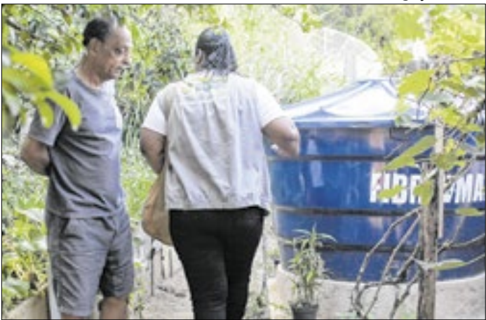
Período de verão intensifica contágio