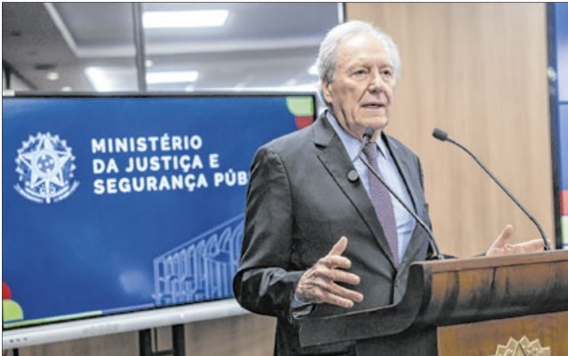
Lewandowski deve ser o primeiro de 20 ministros que deixarão o governo

Para além de Lewandowski, o ministro da Fazenda, Fernan-