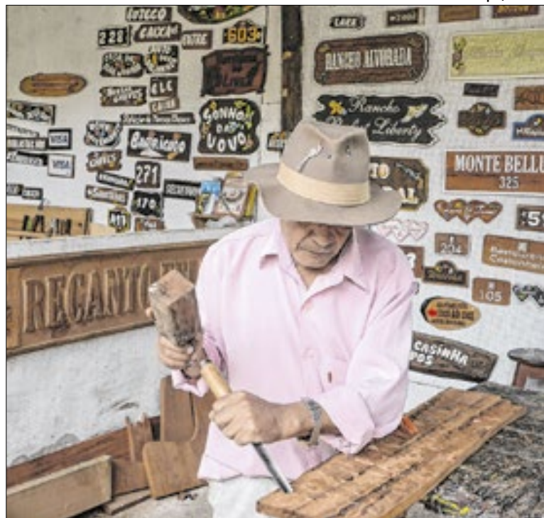
Turismo responde por 5% dos empregos formais

O turismo de eventos fechou 2025 em alta, com o Brasil visto como destino competitivo para congressos internacionais de médio e grande porte. O segmento reforçou impactos econômicos relevantes e aponta para 2026 como um novo ciclo de expansão, especialmente em eventos científicos, médicos e corporativos.