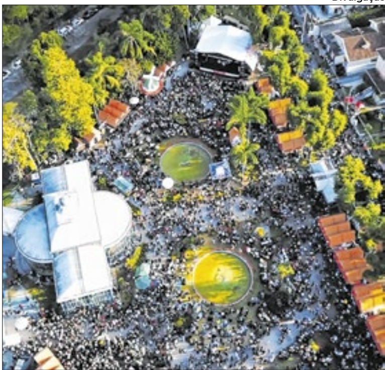
Durante o ano, foram mais de 95 eventos em Petrópolis

Para 2026, já foi lançado o Calendário Unificado de