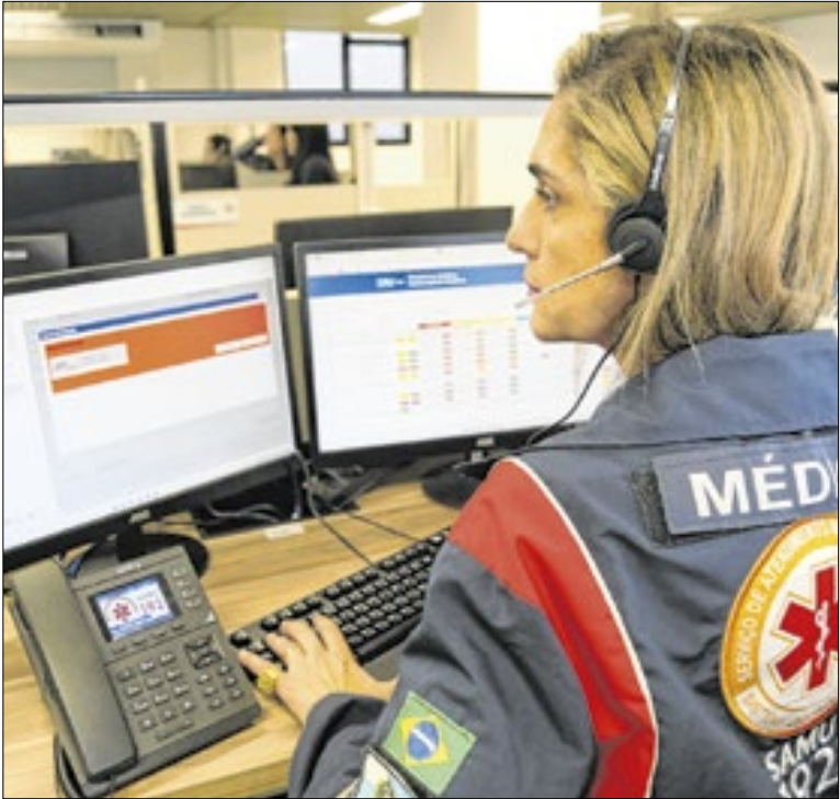
Redução de trotes para o SAMU-RJ foi de 9%

Ao acessar a plataforma, o contribuinte deverá informar o número do Registro Nacional de Veículos Automotores (Renavam). O documento pode ser quitado via Pix, em qualquer instituição financeira, ou por código de barras, em instituições parceiras da Fazenda Estadual (Bradesco, Itaú, Santander e SICOOB).