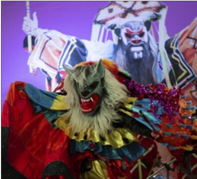
Encontro de Folias de Reis abre calendário cultural de 2026

ção tenha chegado ao Brasil ainda durante o período de colonização. Dessa forma, a Folia dos Reis pode ter sido usada como forma de catequização dos povos indígenas.