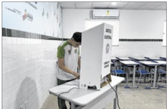
Em ano eleitoral cresce a demanda por serviços