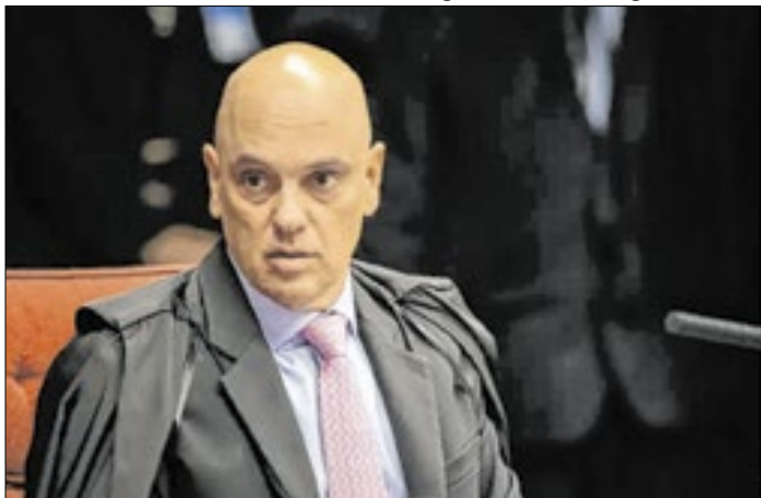
PL diz que Moraes será um dos alvos da investigação