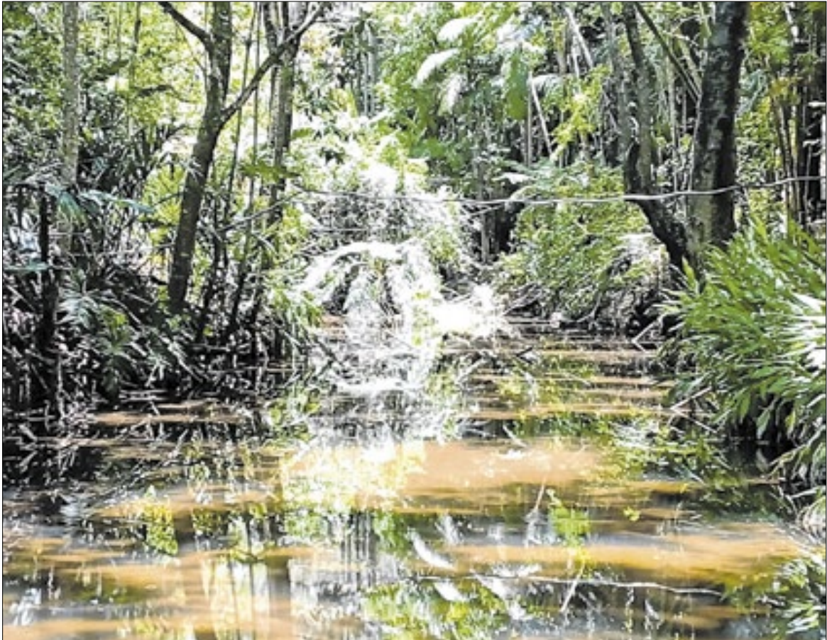
Comitê aguarda equipe técnica do município para dar início aos trabalhos na região

Ela ainda alerta que é necessário recurso para a obra efetivamente, tendo em vista que os recursos do Comitê, são para a elaboração. “A contratação fará o projeto executivo do esgotamento sanitário e o estudo ambiental. Porém a execução da obra é um recurso alto