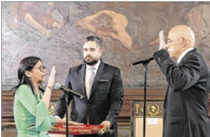
Delcy Rodríguez assumiu a presidência interina do país