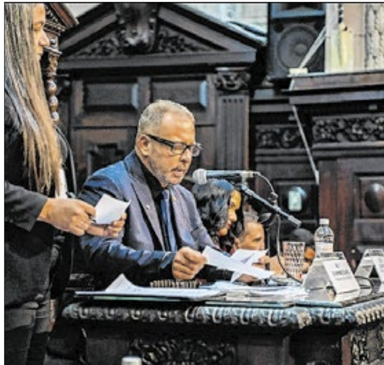
Guilherme Delaroli assumiu a presidência da Alerj em 2025

Com a resolução do Contran, em que as aulas em autoescolas deixam de ser obrigatórias, o agendamento dos interessados em tirar a primeira CNH, será facilitado, com menos burocracias e agilidade no processo. O agendamento da prova teórica também pode ser feito pelos canais de teleatendimento (21) 3460-4040 e (21) 3460-4041.