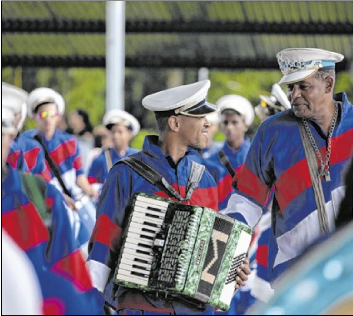
Apresentações começam a partir das 10 horas na Ilha São João em Volta Redonda

É uma celebração de origem espanhola e portuguesa. Há estudiosos que defendem que a celebra-