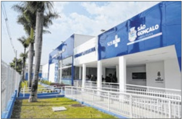
Clínica da Lagoinha inicia os exames de mamografia