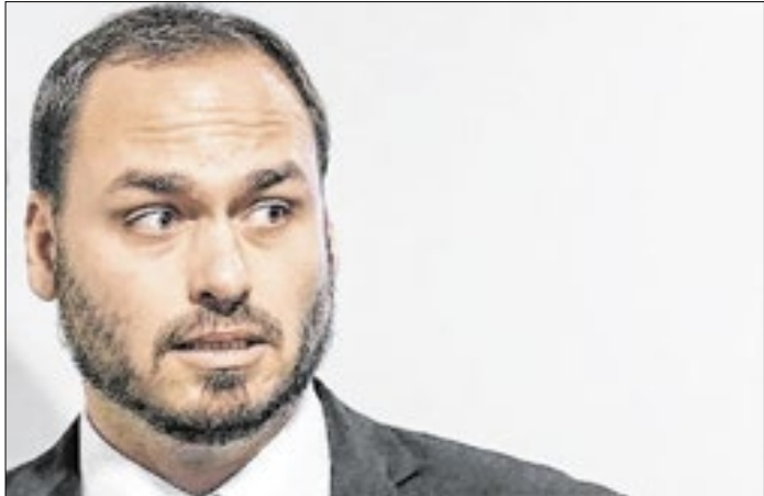
Carlos Bolsonaro já se mudou para Santa Catarina