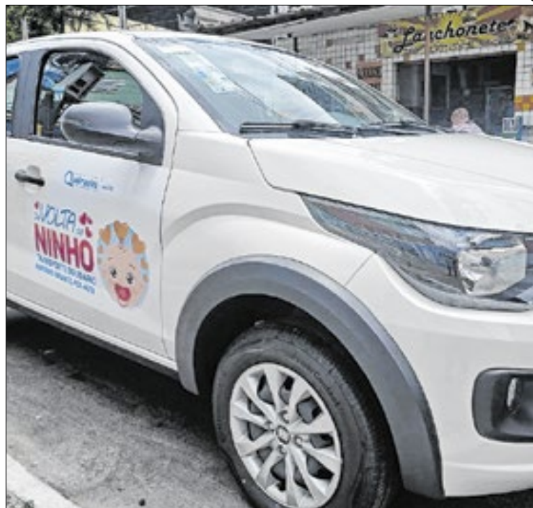
Retorno para casa no pós alta hospitalar será com motorista

Ele integrava um grupo armado, que atuava de forma coordenada, surpreendendo as vítimas com tiros, não dando chance para fuga dos alvos. Ele foi encontrado no bairro São Bento, em Caxias. Contra ele, foram cumpridos dois mandados de prisão preventiva pelos crimes de tentativa de homicídio qualificado.