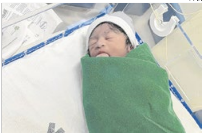
Antonela nasceu no Hospital Juscelino Kubitschek no dia 2