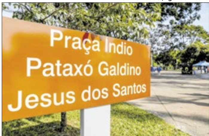
Miranda atuou no caso Galdino, que deu nome à praça