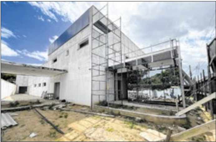
Serviços estão na identidade arquitetônica do prédio