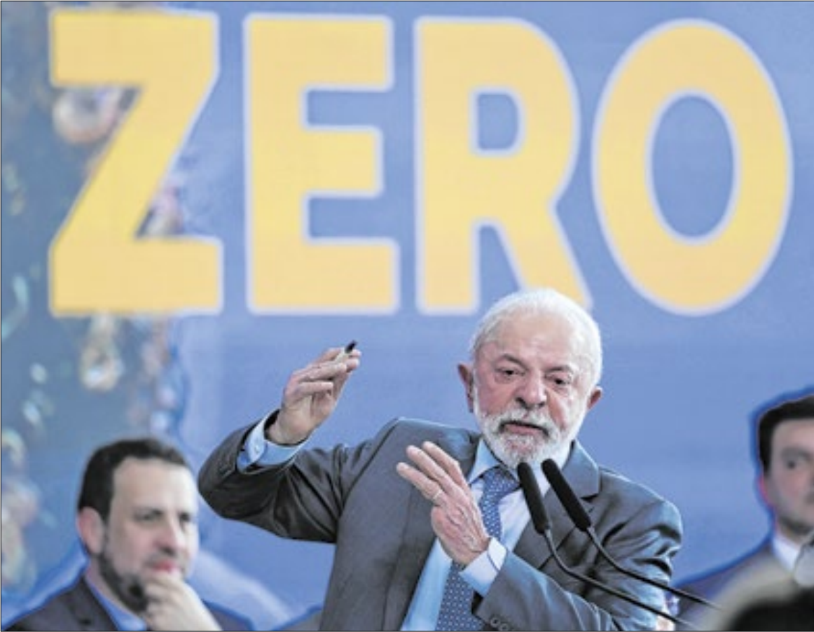
O presidente Luiz Inácio Lula da Silva sanciona a lei que amplia a faixa de isenção do IR