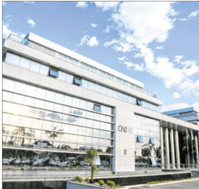
Sede do Conselho Nacional de Justiça (CNJ)

O procedimento tecnológico promoveu uma mudança na plataforma. O PJe do TRF1 operava na versão 2.1.10 e passou a funcionar na versão 2.9.1. De acordo com a Administração, o upgrade englobou mais de mil melhorias e correções, além de ampliar a compatibilidade com a Plataforma Digital do Poder Judiciário.