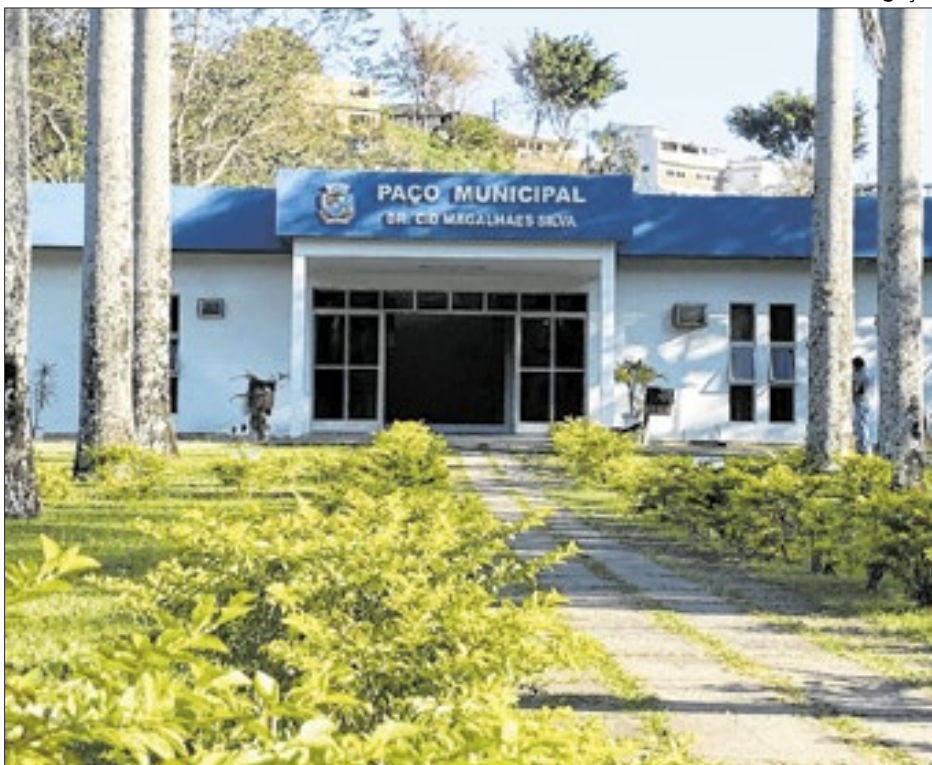
Sede da prefeitura de Rio Claro