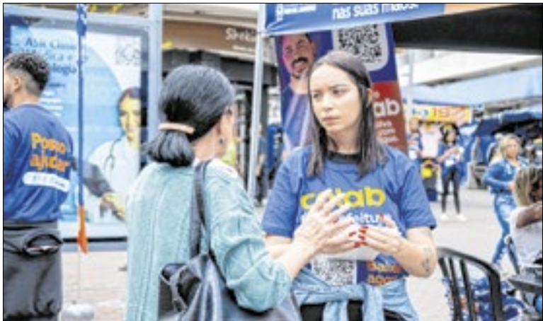
O balanço dos atendimentos em 2025 foi considerado positivo pela prefeitura

Do total de registros, 87,1% das demandas foram concluídas, com um tempo médio de resposta de 22 dias, demonstrando a eficiência do fluxo de atendimento e o empenho das secretarias e órgãos municipais na resolução das demandas da população. No sistema de Zeladoria, que concentra solicitações de serviços urbanos, foram registradas 25.812 solicitações em 2025.