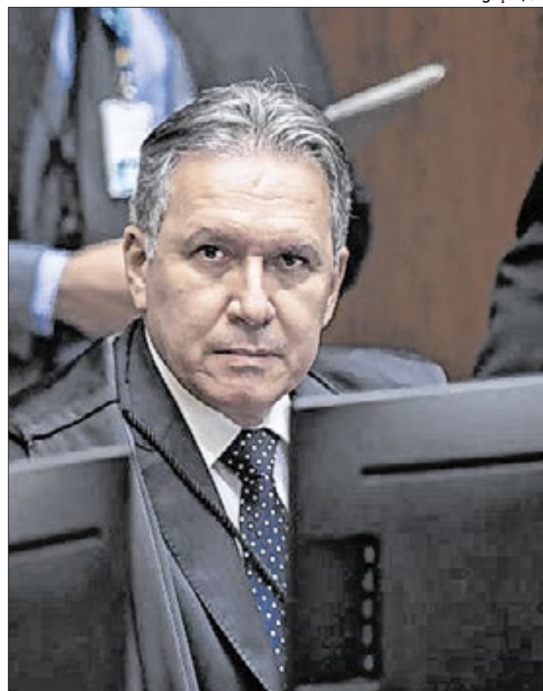
Ministro Afrânio Vilela manteve a isenção de IPI

“Desse modo, deve ser mantida a isenção de IPI quando da transferência do veículo/sucata para a seguradora como cumprimento de cláusula contratual para pagamento de indenização decorrente de sinistro, seja porque a situação não caracteriza alienação voluntária por parte do beneficiário da isenção, seja porque não há previsão legal para a cobrança do IPI outrossa dispensado nesse caso”, concluiu.