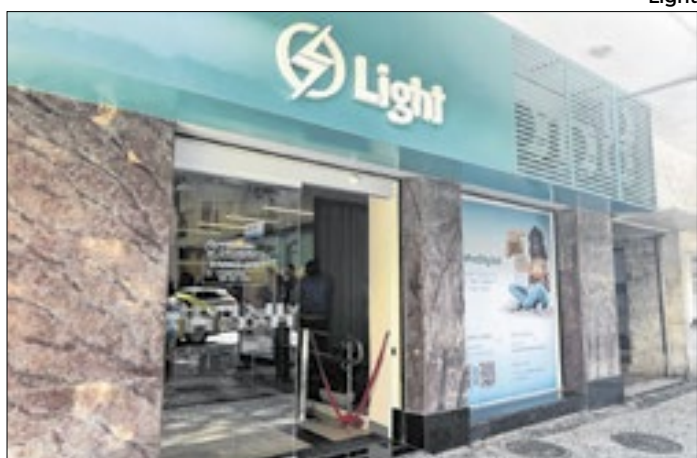
Agência em Copacabana é na Rua Barata Ribeiro, 96