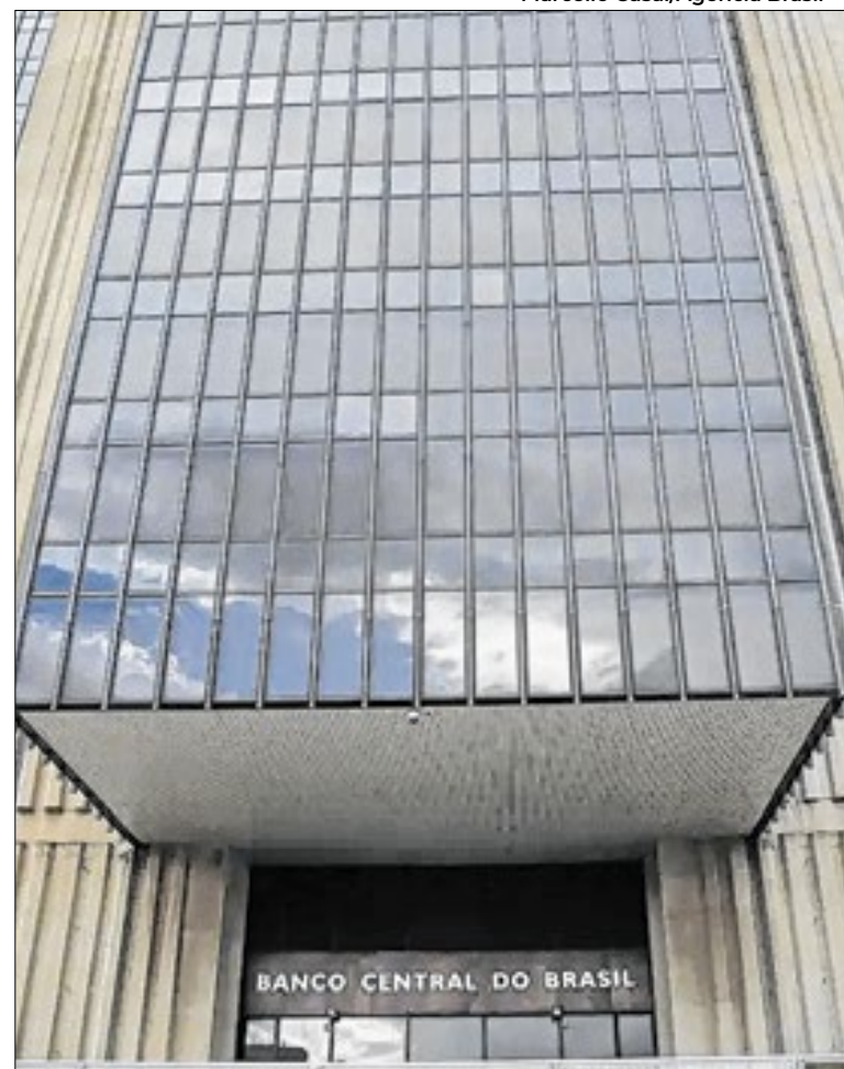
Caso Master virou palco de disputa entre o BC e o TCU

“Há mais batom que cueca disponível neste caso do Banco Master, na minha opinião. O problema é que lambuja tanta gente que a pressão está enorme”.