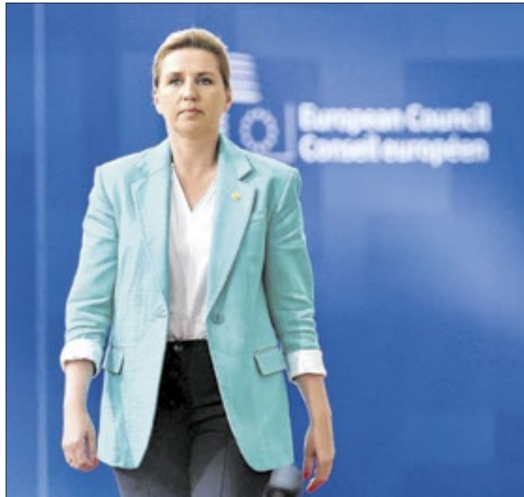
Mette Frederiksen recebeu apoio público da União Europeia