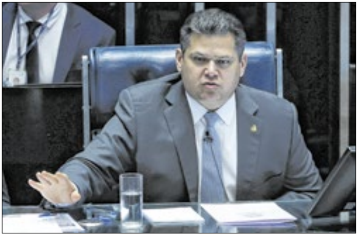
Presidente do Congresso precisa convocar sessão