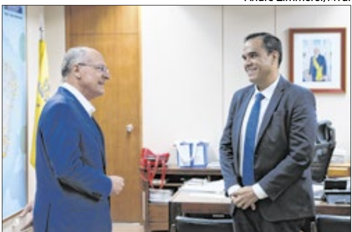
Ministro inicia gestão com reuniões no núcleo do governo