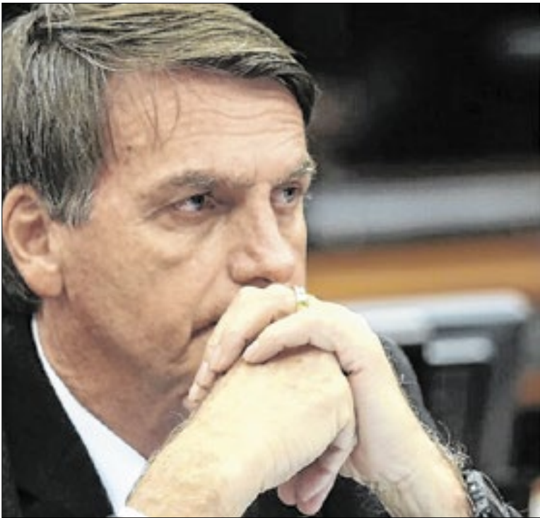
Bolsonaro sofreu uma queda enquanto dormia

O próprio Eduardo já chegou a admitir que talvez não volte ao Brasil. Cogitou até virar “apátrida” para pedir asilo. No caso, o PT imagina a possibilidade de uma outra brecha em São Paulo. Haddad aparece próximo de Eduardo, segundo o Paraná Pesquisas. E o vice-presidente Geraldo Alckmin (PSB) vem logo atrás.