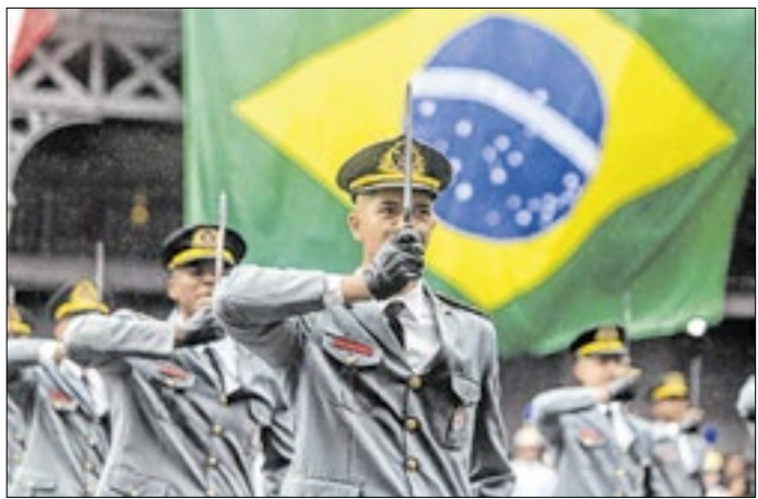
Curso de Formação de Oficiais do Corpo de Bombeiros