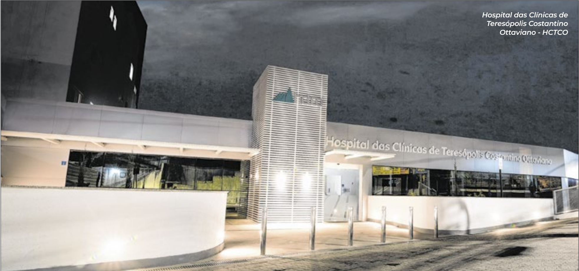
Hospital das Clínicas de Teresópolis Costantino Ottaviano - HCTCO