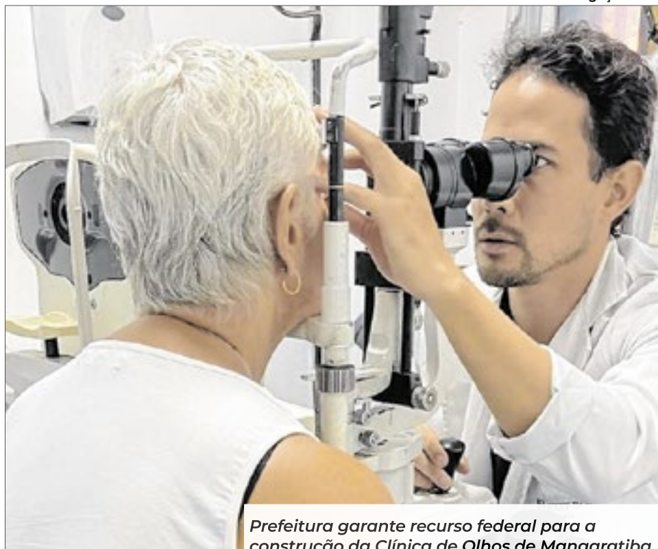
Prefeitura garante recurso federal para a construção da Clínica de Olhos de Mangaratiba

A assinatura do contrato marca o início do processo formal para a implantação da unidade, que seguirá agora para a fase de cumprimento das exigências