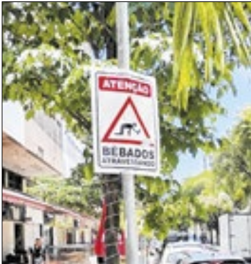
Placa em rua de Botafogo