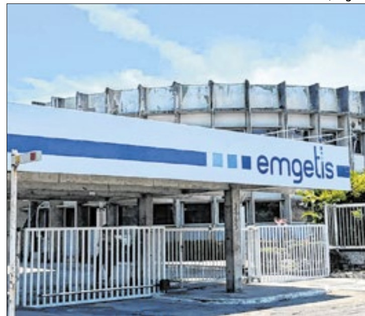
A Engetis é a empresa de tecnologia de Sergipe

Ascom Fundação de Amparo à Pesquisa de Alagoas