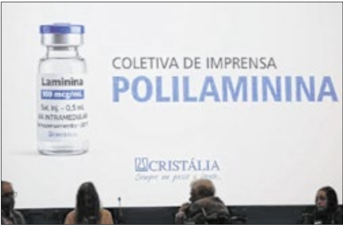
Anuncio foi feito na segunda-feira (5)