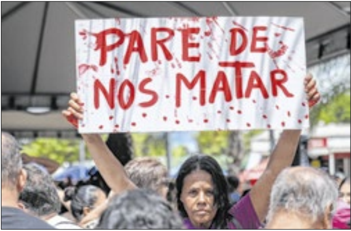
Crime foi no sábado e o criminoso foi preso no domingo