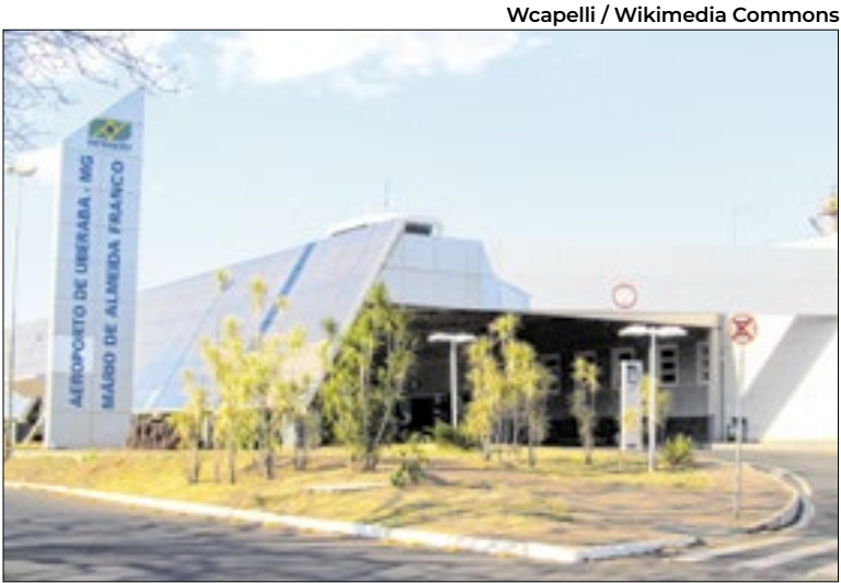
Novo voo direto passa a operar três vezes por semana

10h05, pousando em Guarulhos às 11h25 (horários locais). A ampliação da conectividade aérea em Minas Gerais é resultado do trabalho articulado do Governo de Minas, por meio da Secretaria de Estado de Desenvolvimento Econômico (Sede-MG) e da Invest Minas, em diálogo permanente com companhias aéreas, municípios e operadores aeroportuários. A iniciativa integra a estratégia estadual de fortalecimento do ambiente de negócios, descentralização do desenvolvimento e valorização das vocações regionais. “Fortalecer o ambiente de negócios em Minas depende de conexões ampliadas, frequentes e com mais comodidade. Essa nova rota em Uberaba conecta um polo econômico relevante do