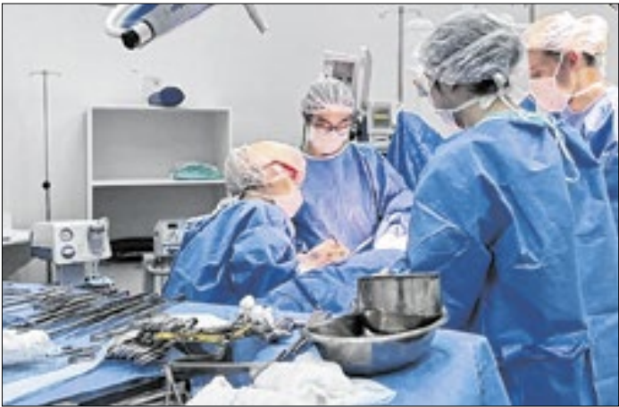
Hospital e Maternidade São Francisco fez 200 cirurgias