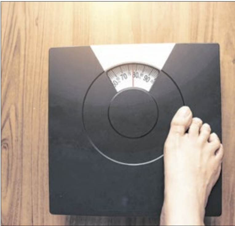
Especialistas indicam maior alerta entre 40 e 60 anos

O valor da taxa de inscrição é de R$180, que deverá ser paga até 2 de fevereiro. Pessoas com inscrição ativa no CadÚnico e doadores de medula óssea em entidades reconhecidas pelo Ministério da Saúde poderão solicitar a isenção do pagamento da taxa de inscrição até quarta-feira (7).