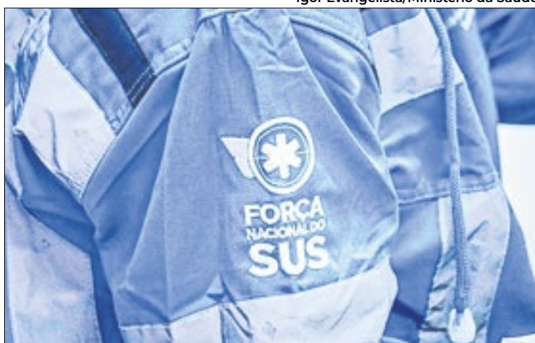
Igor Evangelista/Ministério da Saúde

Desde o início das operações militares no entorno do país vizinho, o Ministério da Saúde mobilizou equipes da Agência Brasileira de Apoio à Gestão do Sistema Único de Saúde (AgSUS), FNSUS e de Saúde Indígena para reduzir, ao máximo, os impactos no SUS bra-