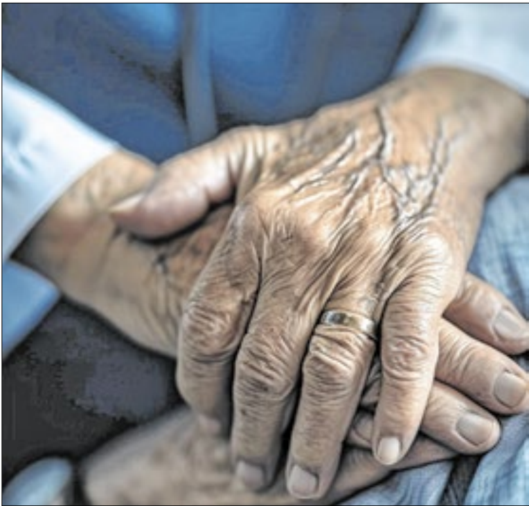
655 novos processos foram distribuídos pós criação da vara

O Corpo de Bombeiros de São Paulo salvou mais de 1,1 mil pessoas durante o período de férias nas praias do litoral paulista. O balanço faz parte da Operação Verão Integrada, iniciativa inédita e intersetorial do Governo de SP para reforçar a segurança, saúde, mobilidade e proteção ambiental no litoral paulista.