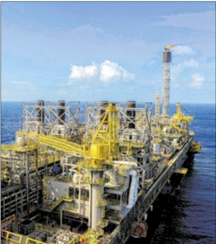
Vista do navio-plataforma P-71, no pré-sal

O Brasil produziu 4,9 milhões de barris de petróleo. A produção, porém, recuou 6,4% em novembro ante igual mês em 2024. Nova plataforma começou a operar no Campo de Búzios