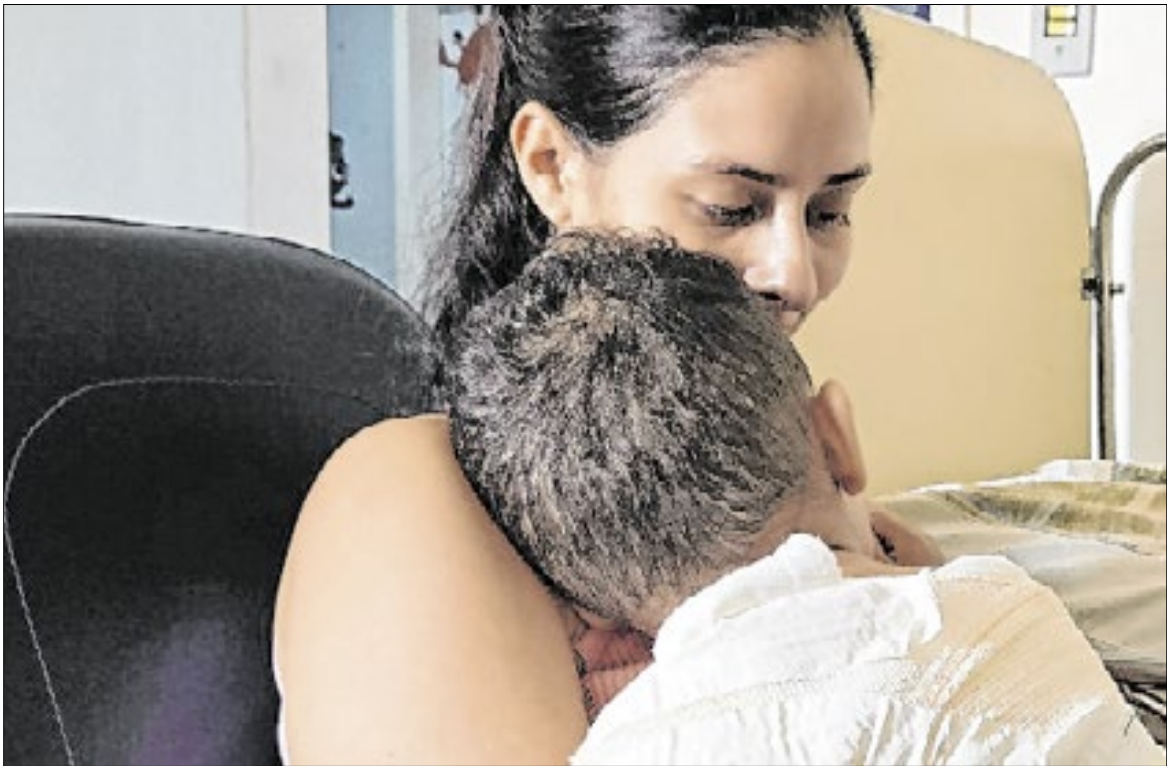
Menino foi atendido no Hospital João XXIII, MG, após sofrer queimaduras