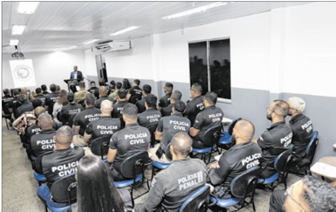
O curso é ministrado em regime de internato

“O uso de drones amplia nossa capacidade de resposta, qualifica as investigações e contribui para operações mais seguras e eficientes em todo o estado”, afirmou.