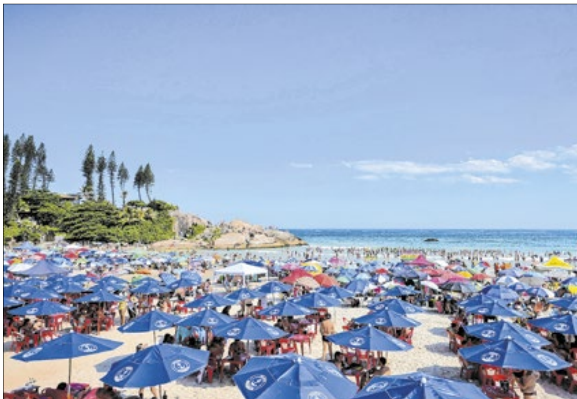
Tempo começou com praia, mas chuvas começarão no meio da semana

permanece semelhante, com sol e variação de nuvens na maior parte do estado. No Litoral Norte e entre o Litoral e o Vale do Itajaí, há condições para chuvas fracas e isoladas nos extremos do dia, devido à circulação marítima.