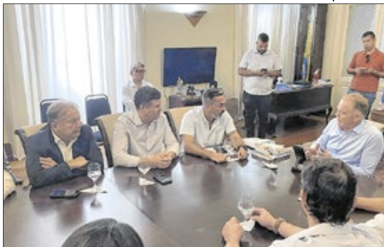
A obra conta com investimento total de R$ 57,2 milhões

Casagrande comentou sobre a importância da obra na unidade hospitalar. “Vamos praticamente duplicar o hospital e adquirir equipamentos modernos. Essa estrutura vai servir para atender Baixo Guandu e outros municí-