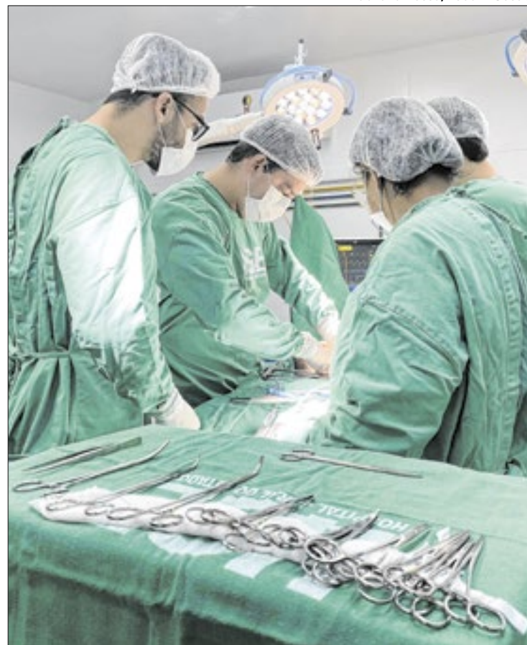
Foram 52 autorizações para doação de órgãos em 2025