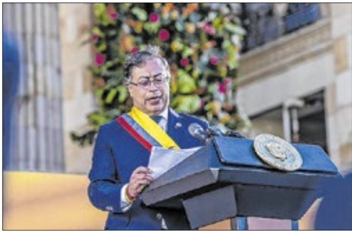
Colombiano disse que pegará em armas contra Trump