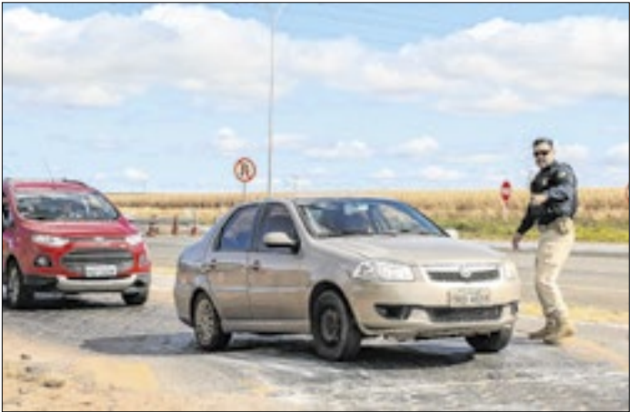
Operação Ano Novo registrou 1.152 sinistros