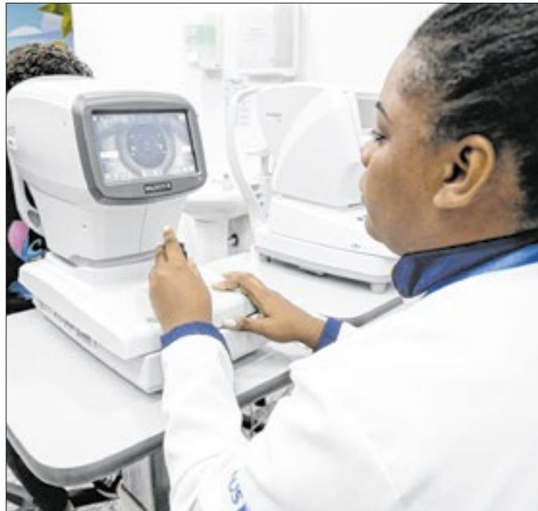
Planos de saúde do serviço público subiu 8,9% em 2025