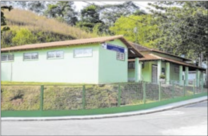
Farmácia de Piraí abre em horário normal