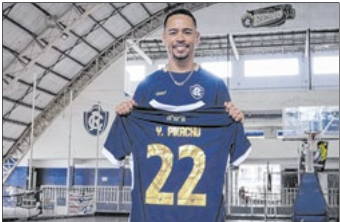
Ídolo do Paysandu, Pikachu defenderá o Remo em 2026