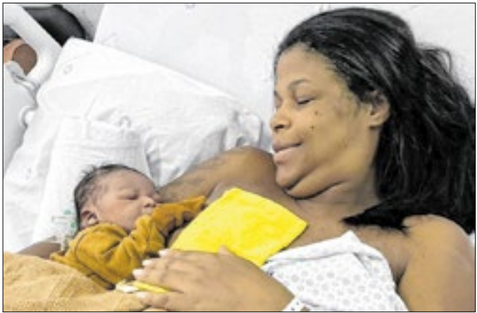
Heitor chega ao mundo como símbolo de amor e cuidado