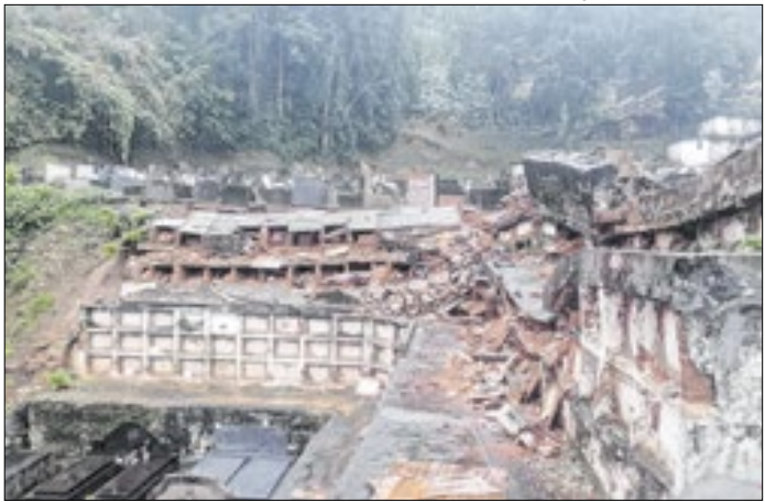
Cemitério no período das chuvas de 2022