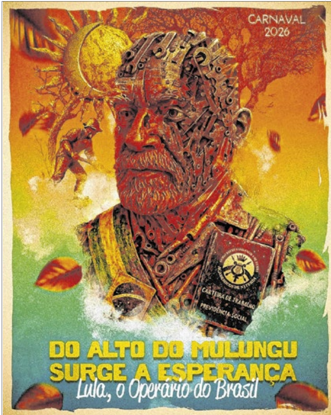
Desfile suscita discussão sobre propaganda antecipada

Na mesma linha, o advogado eleitoral e ex-juiz Auxiliar da Presidência do Tribunal Su-