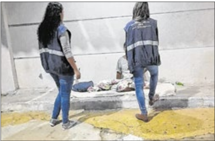
Agentes vão fazer operações ao longo do mês