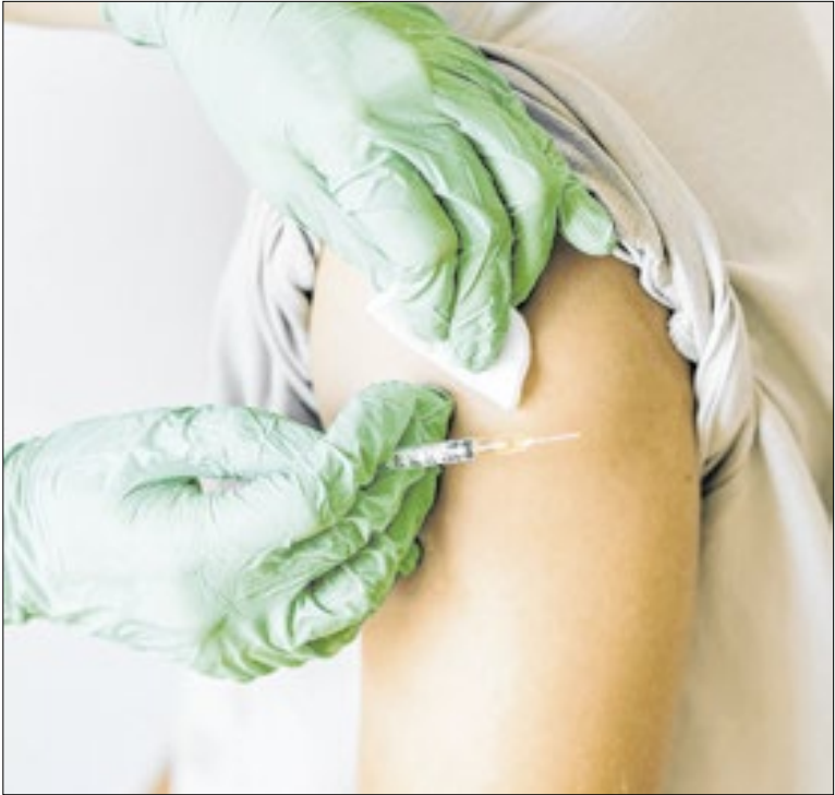
Município oferece imunizante em 64 unidades de saúde

O município também avança na consolidação de Maricá como referência hospitalar, com a ampliação dos atendimentos de urgência e emergência 24 horas no Hospital Municipal Conde Modesto Leal, no Centro. Estão previstas intervenções estruturais para qualificar a assistência prestada à população.