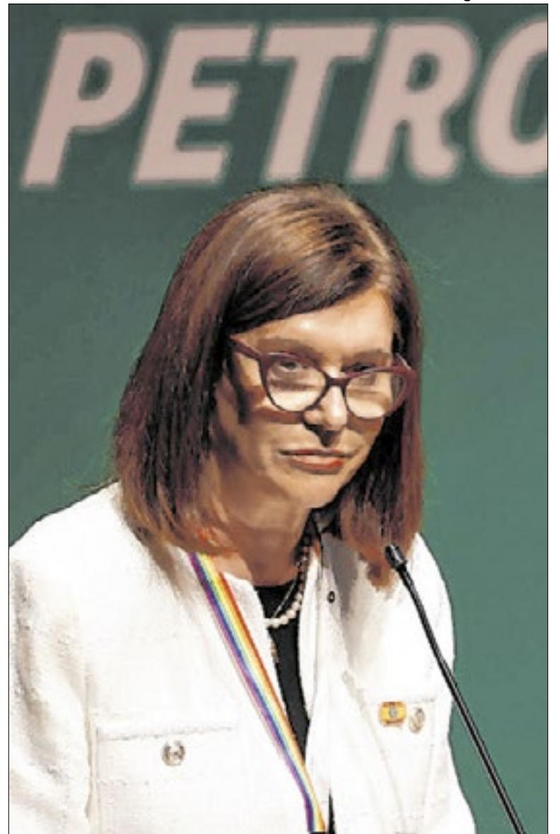
Magda Chambriard, presidente da Petrobras, fez o anúncio no Rio de Janeiro