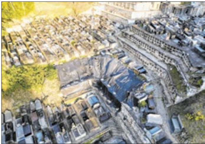
Túmulos continuam danificados e cobertos