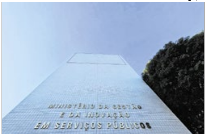
Candidatos terão que enviar documentação para o MGI