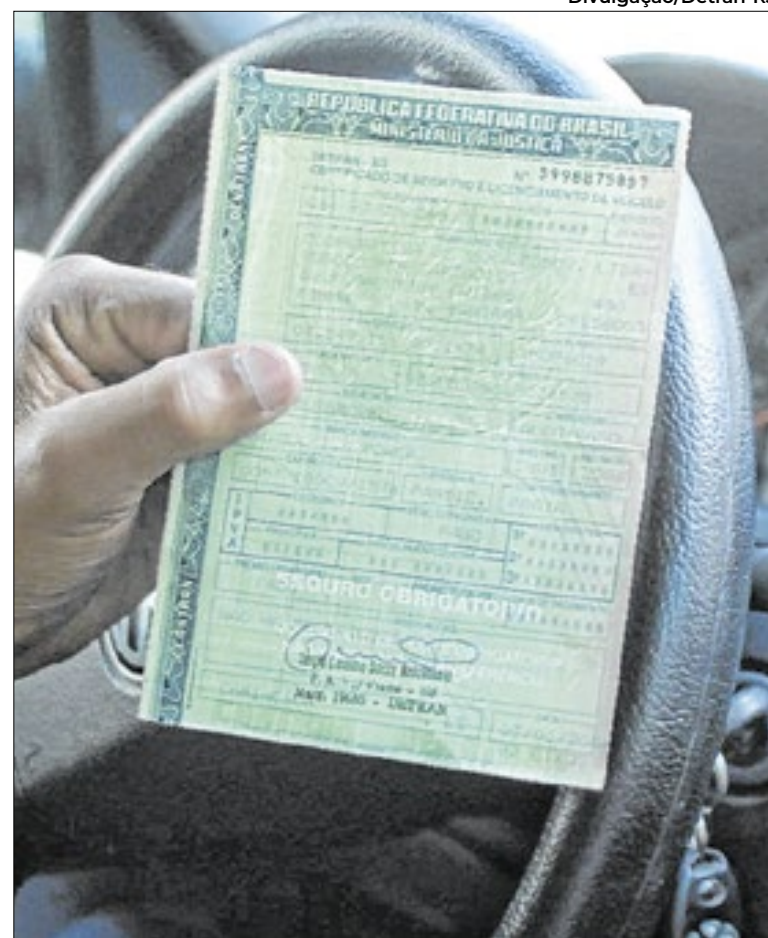
Quadrilhas usam sites falsos para emitir boletos do IPVA

O Detran reforça que, ao se deparar com tentativas de comunicação duvidosa, o cidadão pode entrar em contato com a Ouvidoria do departamento (pelo site do Detran.RJ, na aba Transparência; pelos telefones (21) 2332-0438 / (21) 2332-0450; ou presencialmente.