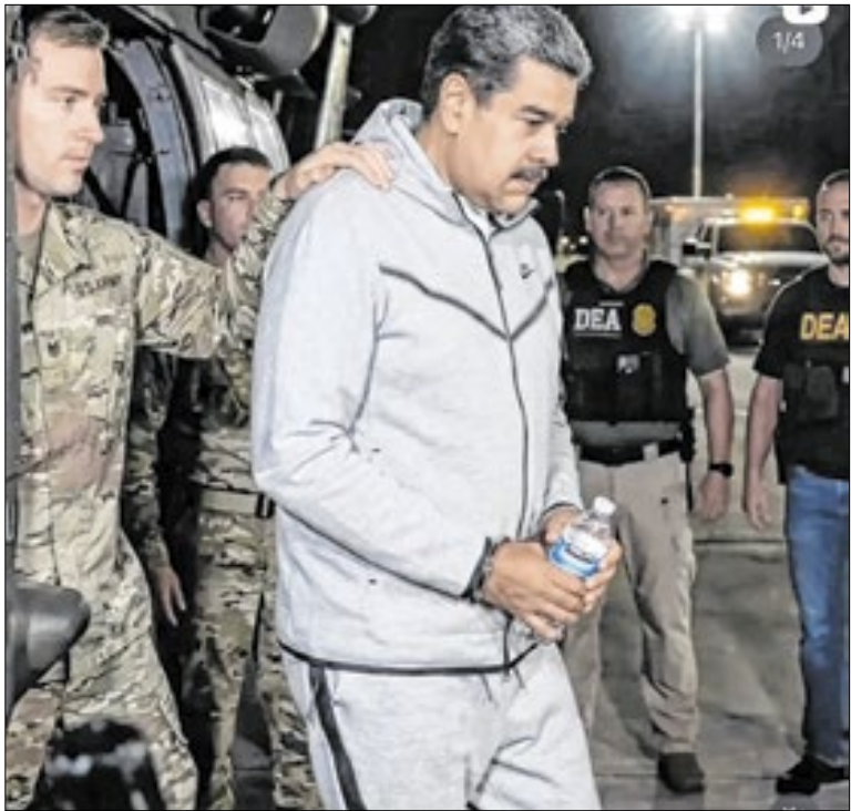
Maduro sendo conduzido pelos soldados norte-americanos

Boa parte dos políticos de oposição aplaudiu a ação de Trump na Venezuela. Mais afobado, o deputado Nikolas Ferreira (PL-MG) chegou a defender uma intervenção dos EUA no Brasil. Uma situação delicada que exige muita cautela. Não apenas por parte do governo brasileiro, mas dos investidores chineses.