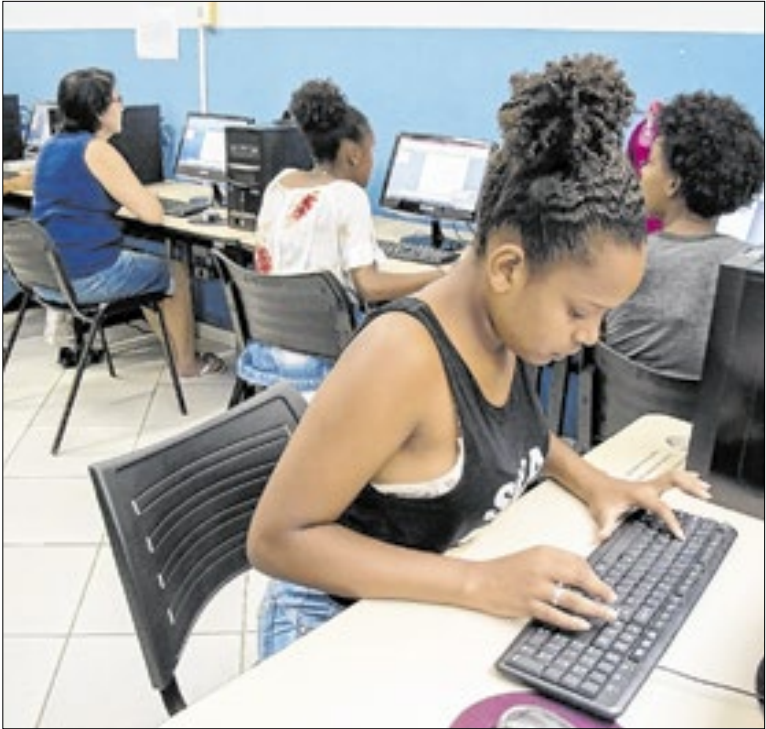
Oficinas gratuitas de Informática Básica e Excel Intermediário

Ainda em Quatis, o posto do DETRAN-RJ (Identificação Civil) está em manutenção por tempo indeterminado, a partir desta segunda-feira (05). Por esse motivo, a unidade não terá expediente para a emissão de novos documentos. A entrega do RG seguirá normalmente.