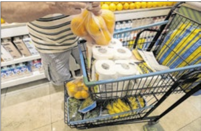
Percepção da inflação é termômetro do mercado