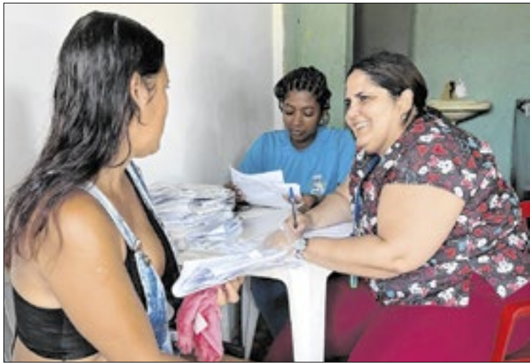
Meta é cadastrar 4.200 usuários referenciados à UBS Alecrim