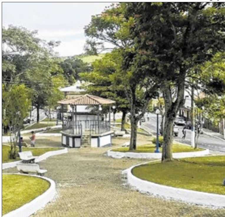
Cidade tem avanços em infraestrutura