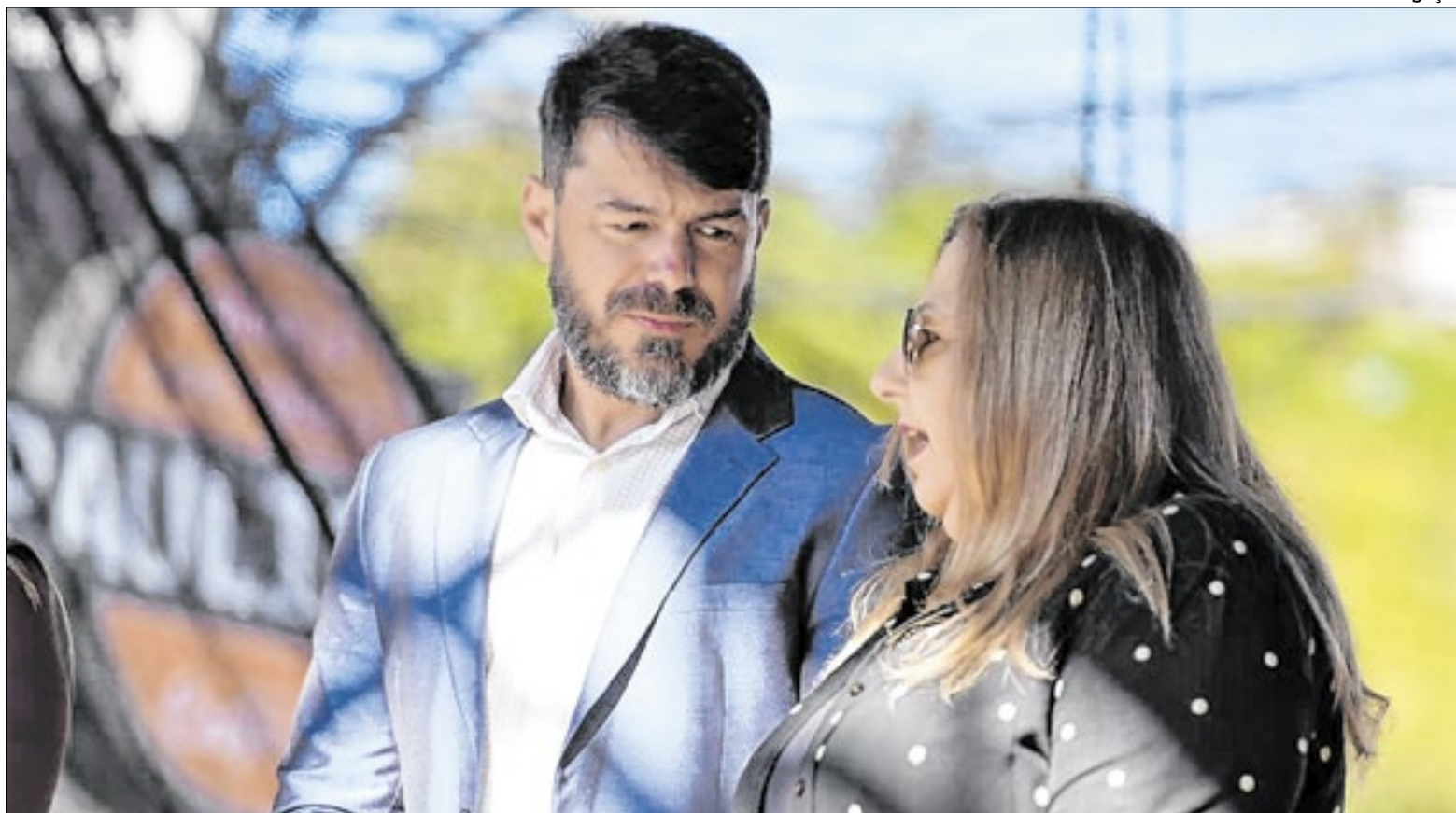
Prefeito e vice-prefeita tem expectativas positivas para 2026

Na área de Finanças, a prefeitura implantou o IPTU Digital e Itinerante, promoveu reestruturação administrativa do setor e avançou na modernização da legislação municipal, com atualização do Código Tributário, Código de Posturas e normas relacionadas à liberdade econômica.