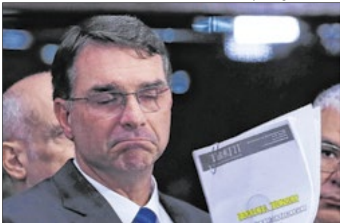
Filho de Bolsonaro é pré-candidato a presidente