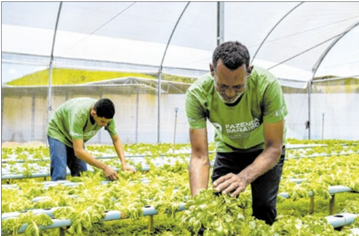
Por meio do acolhimento, os dependentes químicos são recuperados e reinseridos na sociedade

A demanda chega por meio dos Centros de Atenção Psicossocial (CAPS), do Serviço Social das unidades de saúde pública e também por procura espontânea, quando o próprio acolhido ou seus familiares buscam ajuda. Após a conclusão do tratamento, os acolhidos são encaminhados para acompanhamento contínuo nos CAPS do município.