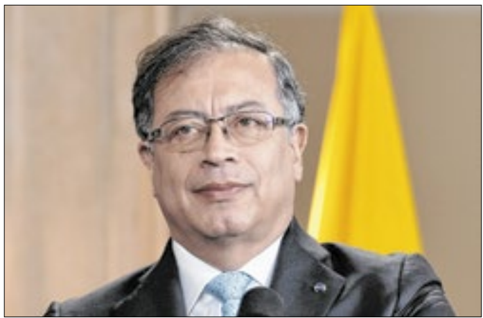
Petro rebateu as ameaças de Donald Trump