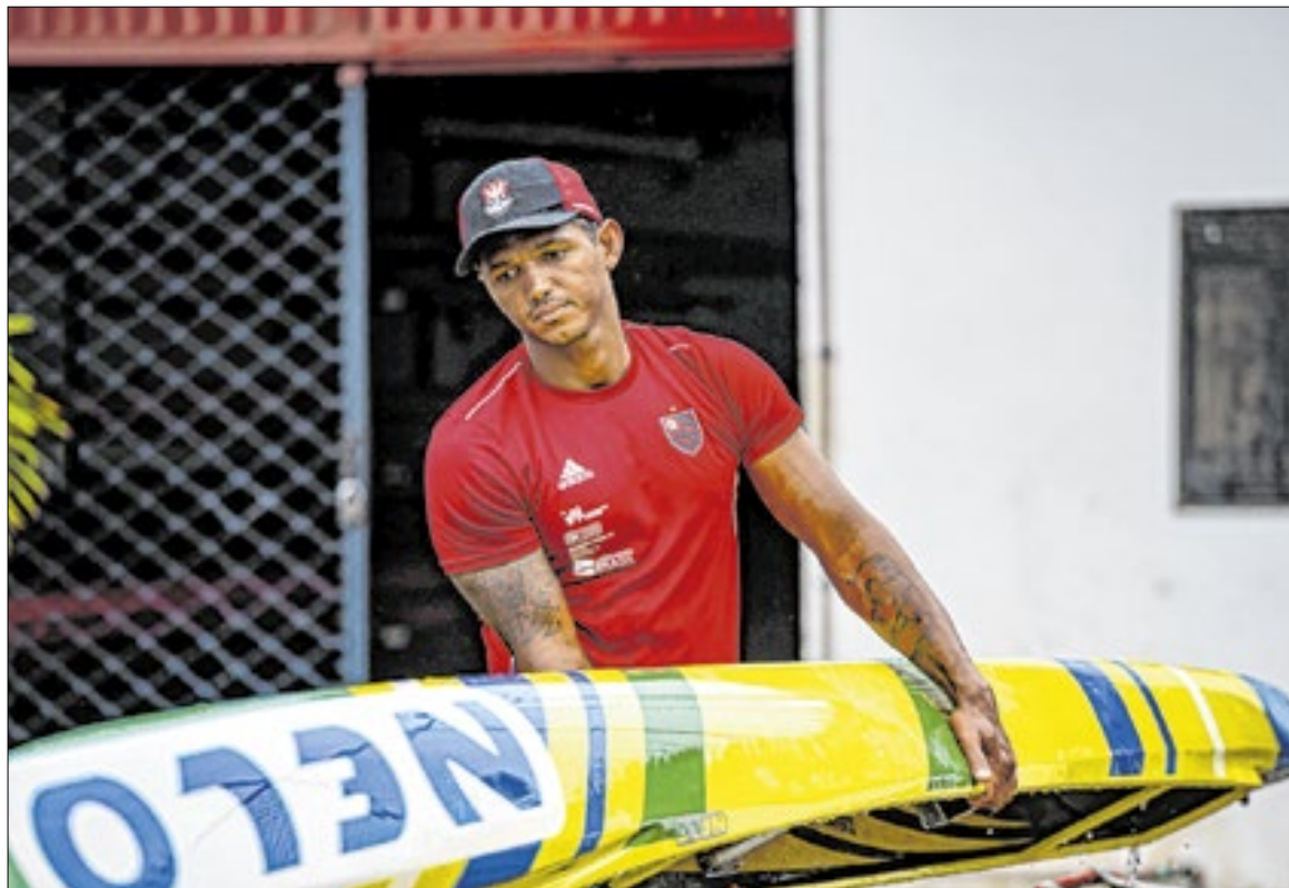
Flamengo alegou que atletas não morarem no Rio inviabiliza a formação de ‘novos talentos’