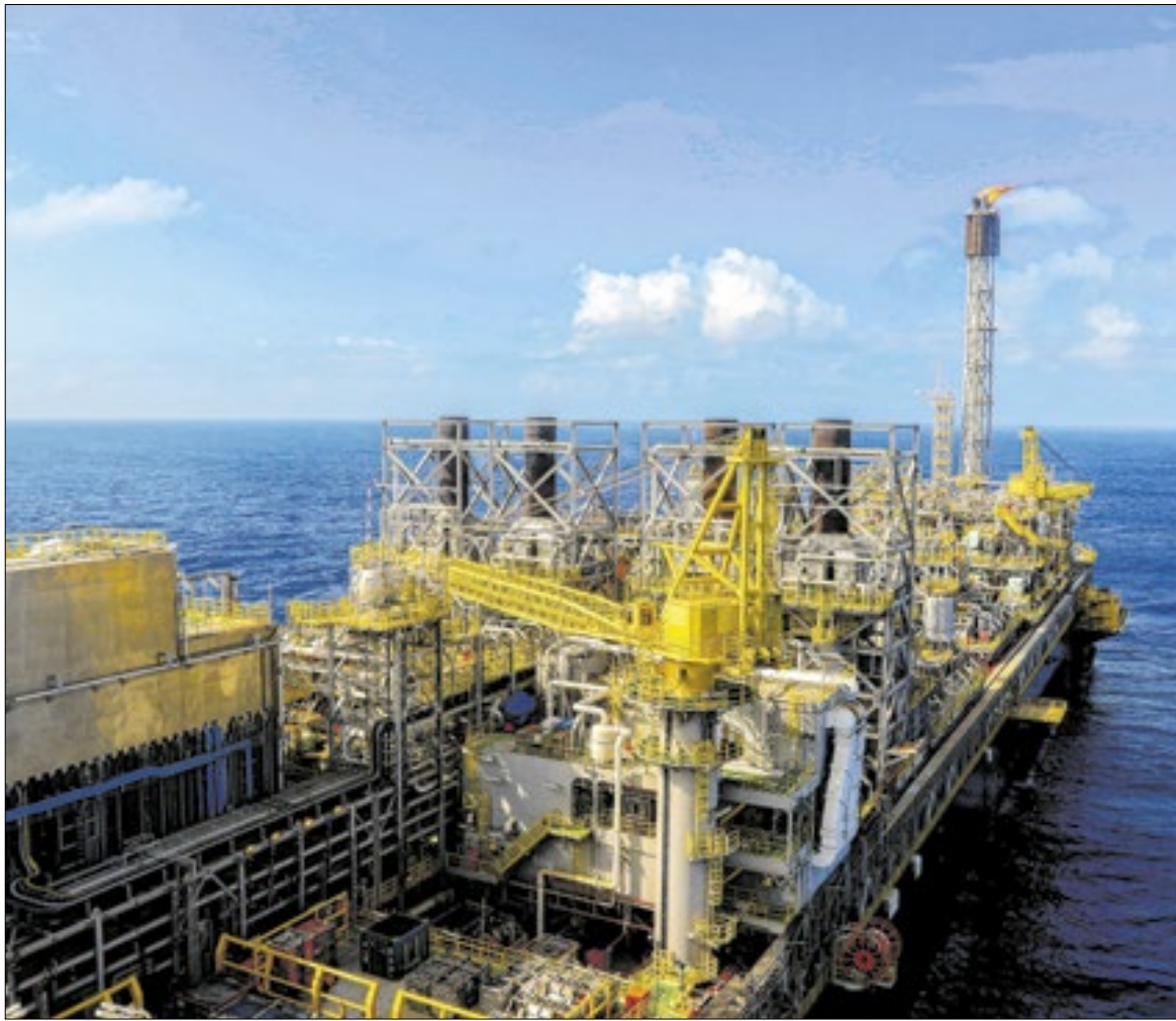
Vista do navio-plataforma P-71, instalado no campo de Itapu, no pré-sal da Bacia de Santos