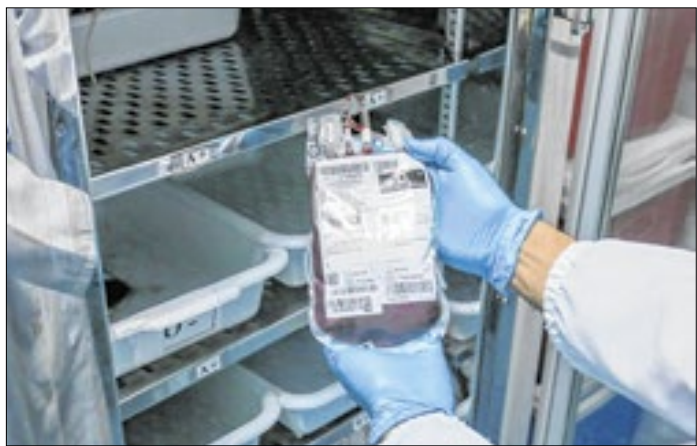
Estoque de sangue registra déficit de 40%