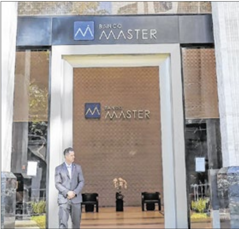
Mercado teme questionamento sobre autonomia do BC

Famosa pela concentração de bares, a Rua Nelson Mandela, em Botafogo, passou a exibir em um poste placa que alerta para o risco representado por pessoas alcoolizadas. O aviso é dirigido aos motoristas e mostra um boneco atravessando a rua, engatinhando, com uma garrafa na mão: “Bêbados atravessando”, diz.