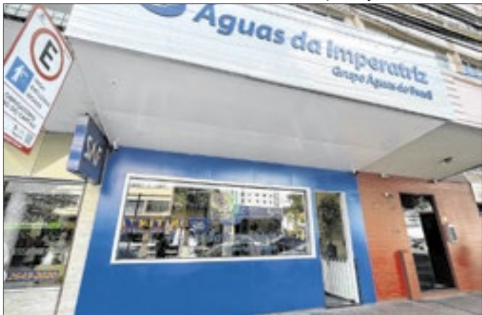
Prazo para inscrição termina nesta sexta-feira (09)