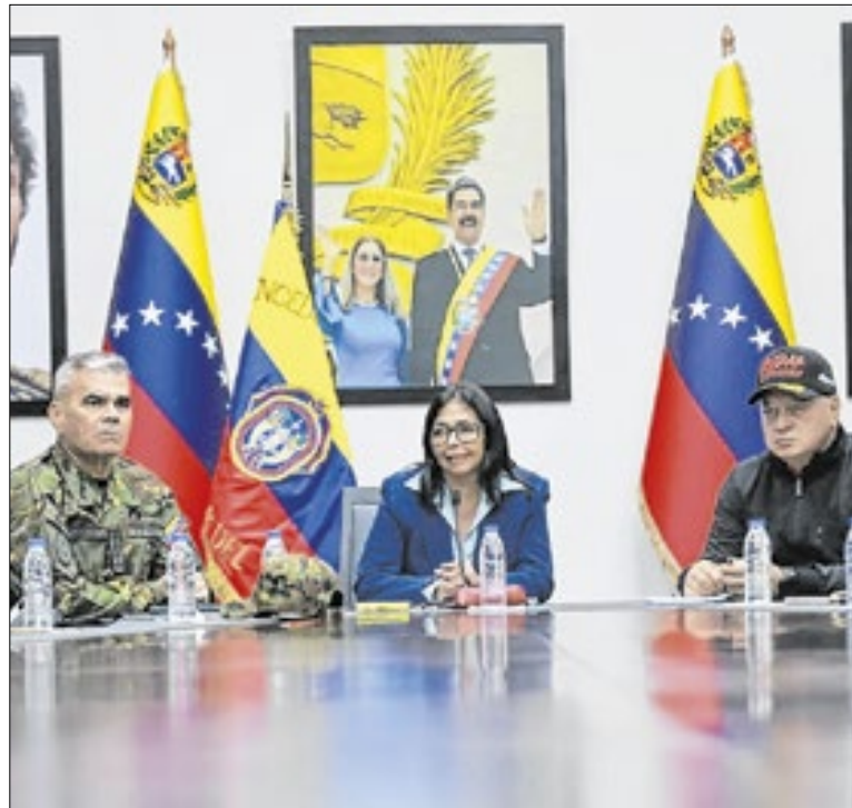
Delcy Rodríguez está no comando da Venezuela interinamente

JD Vance e a família não estariam em casa, segundo a CNN. Um oficial federal dos EUA afirmou ao veículo de imprensa que o suspeito provavelmente não conseguiu entrar na casa do vice-presidente, mas que a investigação ainda apura se a intenção era ou não de um ataque contra JD Vance.