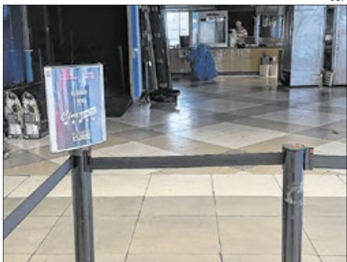
Cine Show passará por um processo de modernização