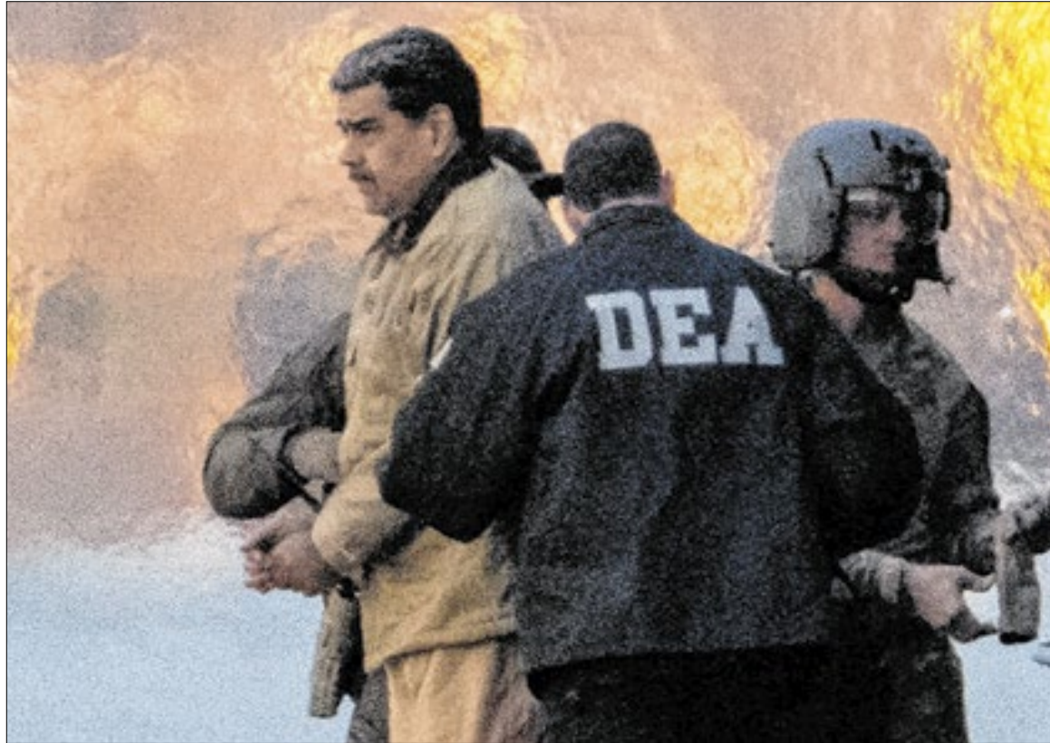
Nicolás Maduro comparecerá novamente à corte em audiência marcada para o dia 17 de março