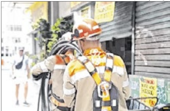
Light realizou a troca de cabos nesta segunda-feira (5)