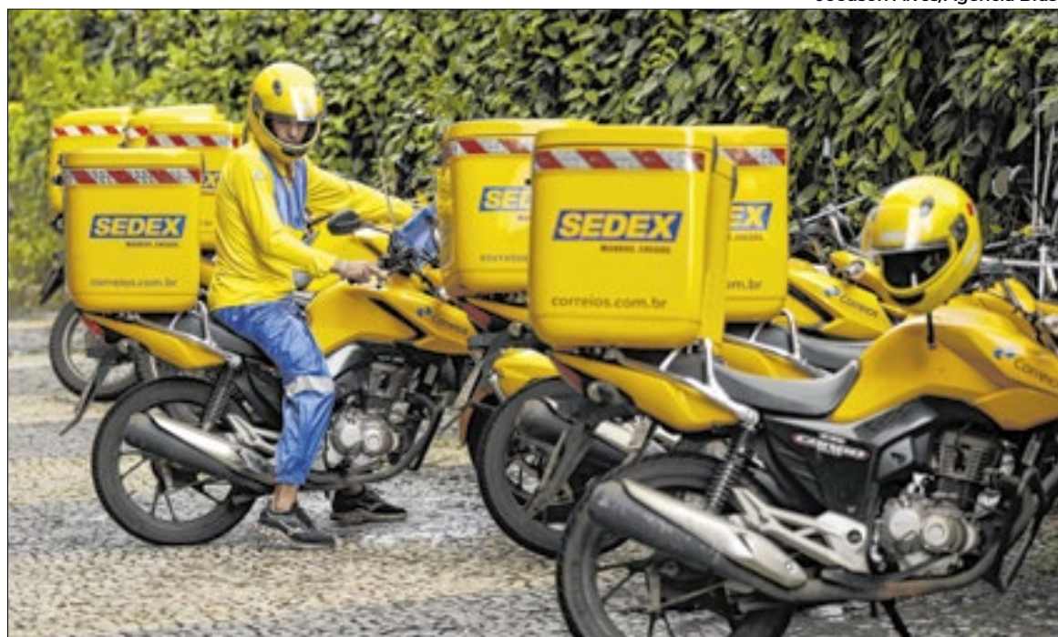
Plano de recuperação prevê empréstimo de até R$ 20 bilhões

Apesar da declaração de legalidade do movimento paredista, trabalhadores que paralisaram as atividades terão as faltas descontadas nos salários, em valores que serão divididos em três parcelas mensais, sucessivas e iguais, apurados de forma individualizada