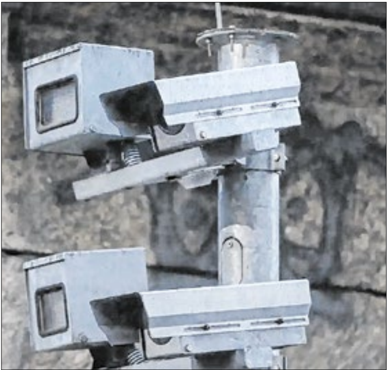
Medida tem como objetivo reduzir acidentes de trânsito

A Prefeitura de Teresópolis publicou no Diário Oficial (D.O) desta segunda-feira (05) o contingenciamento de 25% do orçamento previsto para 2026, a fim de arcar com despesas com pessoal, pagamento de precatórios, da dívida pública e despesas emergenciais com saúde pública.