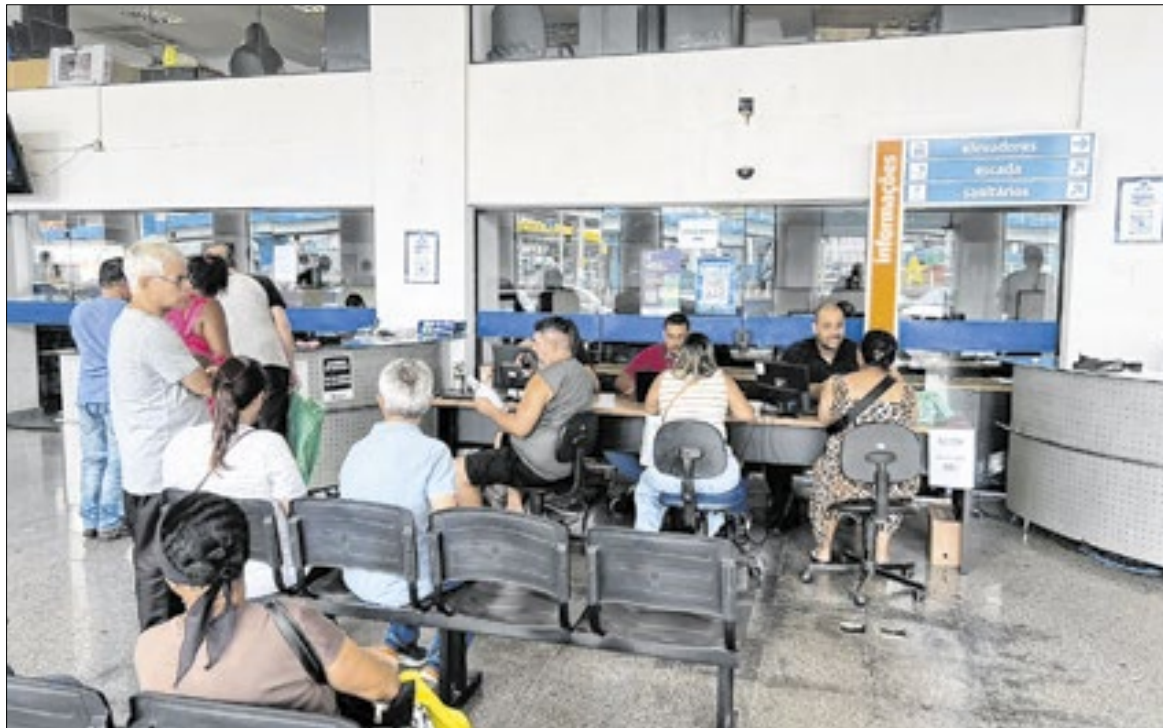
Atendimentos estão sendo realizados no saguão da prefeitura, de segunda a sexta-feira

A declaração é indispensável para comprovar faturamento e garantir a regularidade do MEI junto à Receita Federal, além de impedir o cancelamento do CNPJ e assegurar o acesso a benefícios como INSS, financiamentos e participação em compras públicas. A expectativa