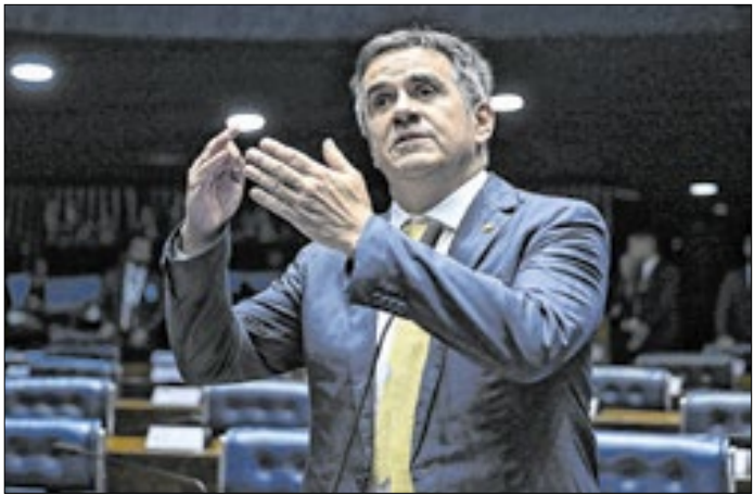
Presidente do PP: problemas para se reeleger