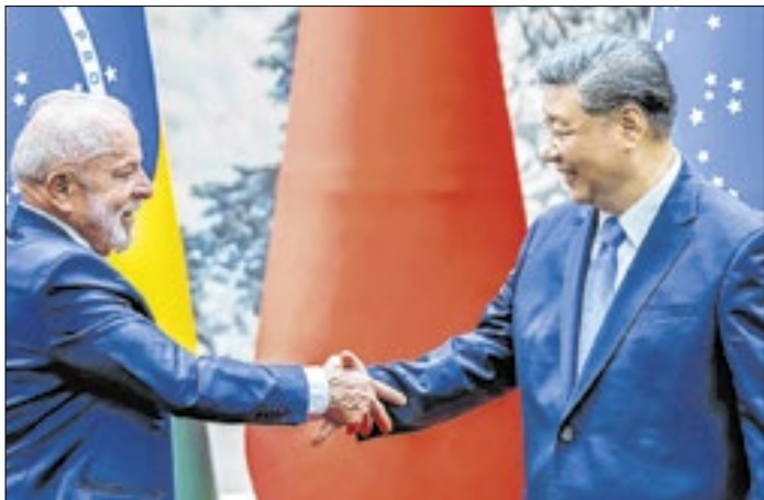
Xi Jinping não conseguiu adesão à Nova Rota da Seda