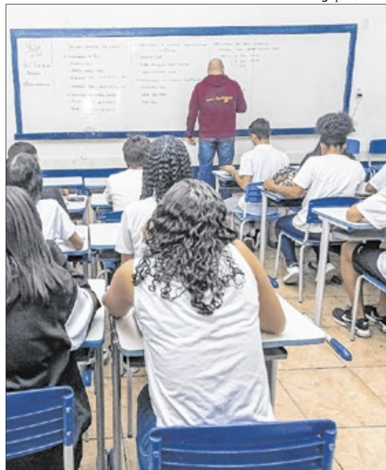
São 10 mil novas vagas em mais de 1.200 unidades de ensino