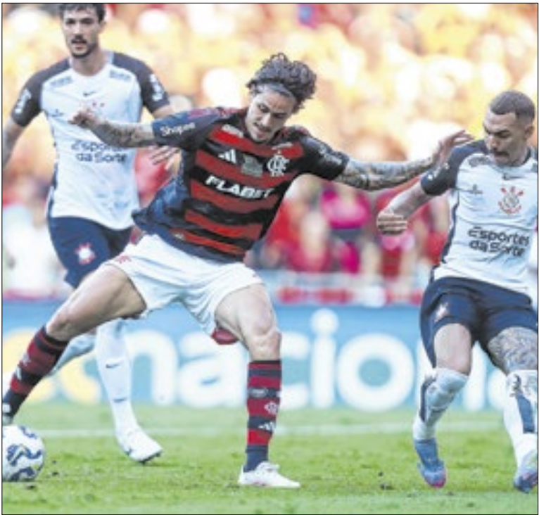
Não vão faltar jogos para os apaixonados pelo esporte