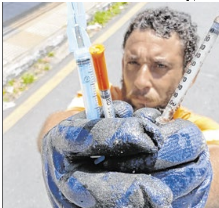
Secretaria de Saúde se uniu a órgãos de saúde do trabalhador

As inscrições para o processo seletivo devem ser feitas na sede do Sine de Volta Redonda. Os candidatos devem portar documentos como: RG, CPF, Título de Eleitor, Carteira de Trabalho e Certificado de Reservista (caso seja necessário). Para mais informações, pode-se entrar em contato com: (24) 3346-6640.