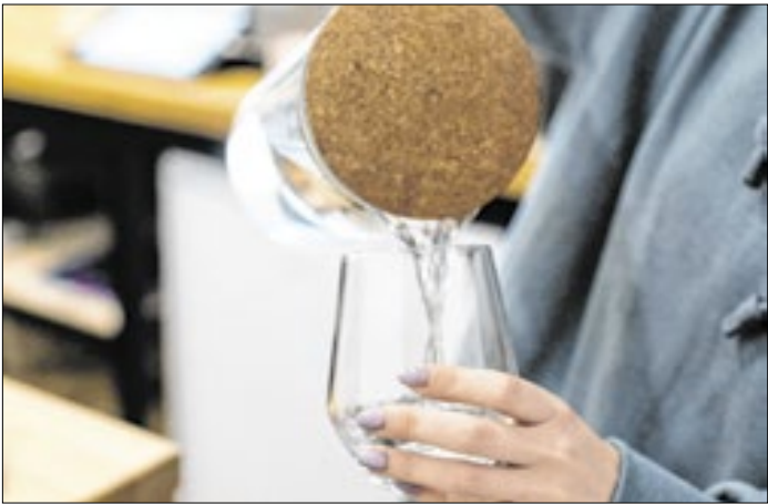
População está economizando água