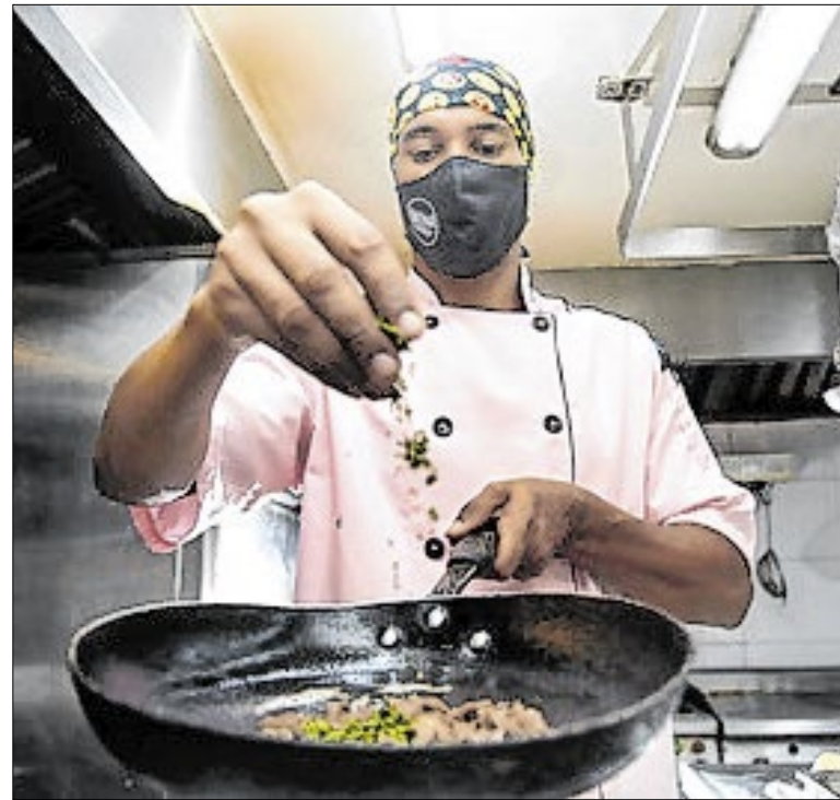
Há vagas disponíveis para auxiliar de cozinha

O cadastro para participar do projeto Botinho deve ser realizado no site www.botinho.cbmerj.rj.gov.br . As atividades acontecem entre os dias 21 e 30 de janeiro, das 8h às 11h, em 29 praias fluminenses. Após o cadastro, os inscritos receberão um e-mail de confirmação com orientações para entrega de documentos.