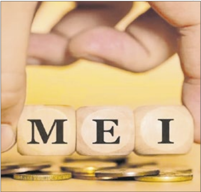
Espaço empreendedor pela prefeitura municipal

A Selic, que fechou 2025 a 15%, deve cair para 12,25% ao longo de 2026; para 10,50% em 2027; e 9,75% em 2028. A taxa básica de juros situa-se no maior nível desde julho de 2006, quando estava em 15,25% ao ano. Após chegar a 10,5% ao ano em maio do ano passado, a taxa começou a ser elevada em setembro de 2024 (15%).