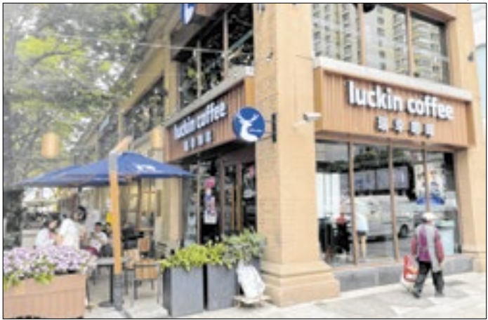
A Luckin' Coffee virou a maior rede de cafés do mundo