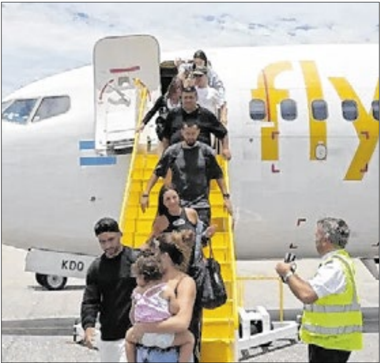
Ligações diretas entre Cabo Frio e Buenos Aires e Rosário

Entre as principais orientações, inclusive com monitoramento inteligente através de drones, os agentes impediram a prática de esportes com bolas fora do horário e das áreas permitidas, como altinha, futevôlei e frescobol, além do uso de garrafas de vidro e caixas de som na faixa de areia.