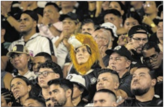
Remo dará o equivalente a duas voltas na Terra na Série A