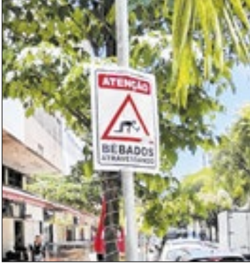
Placa em rua de Botafogo