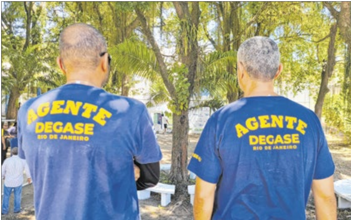
Unidades do Degase terão obras para melhorias e a realização de novo concurso

Uma das principais mudanças previstas é no Cense Aeroporto Dom Bosco, que será dividido em duas unidades independentes. Cada uma terá capacidade para 40 vagas: uma destinada à internação provisória e outra à internação definitiva. Apesar de funcionarem no mesmo espaço, as unidades terão direções e equipes próprias, compartilhando áreas comuns como escola, biblioteca e campo de futebol.