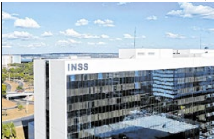
Servidores do INSS fizeram greve em 2024