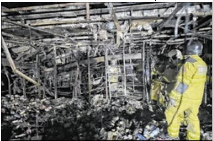
Subsolo do Shopping Tijuca após grande incêndio