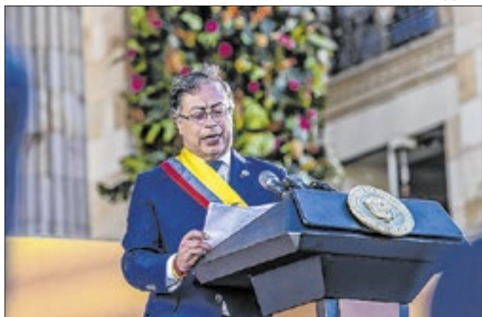
Colombiano disse que pegará em armas contra Trump