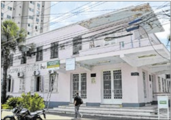
Medida foi publicada no Diário Oficial