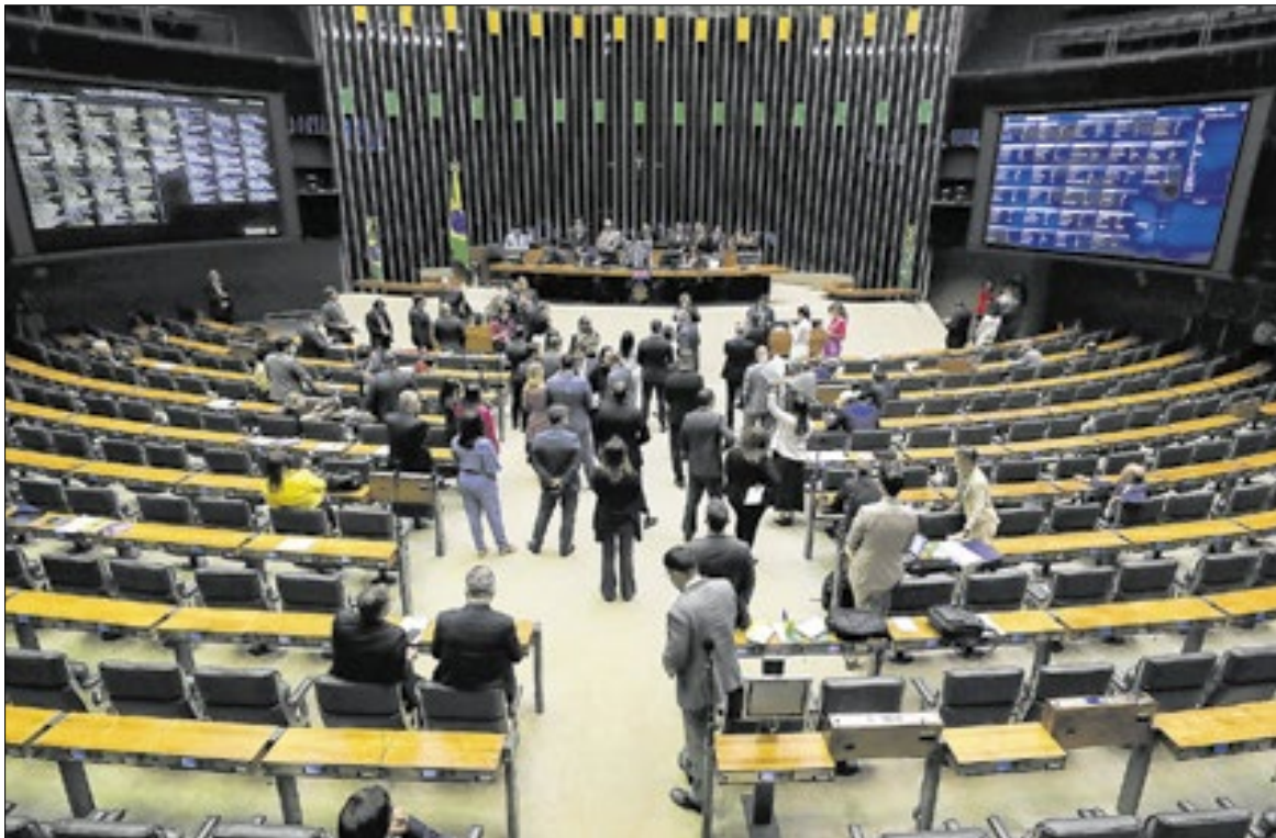
Câmara dos Deputados abre 70 vagas para analistas e técnicos