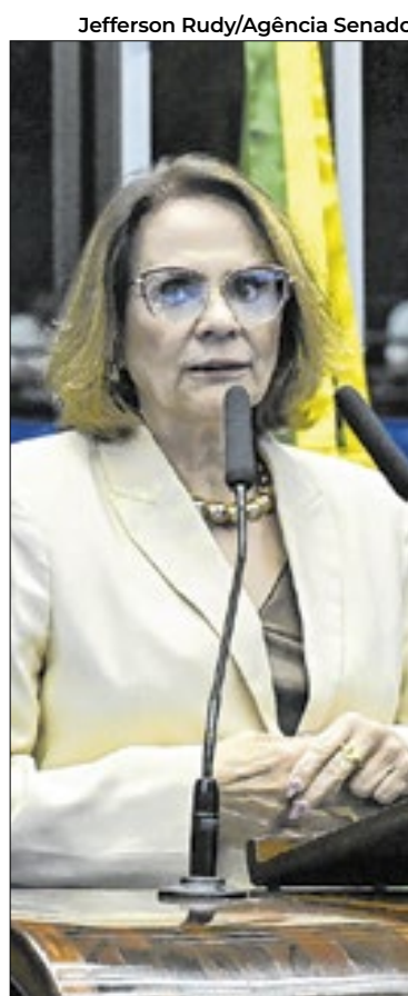
Damares: “Coisa absurda, vamos investigar”