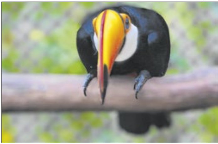
Tucano no Bosque dos Jequitibás, em Campinas