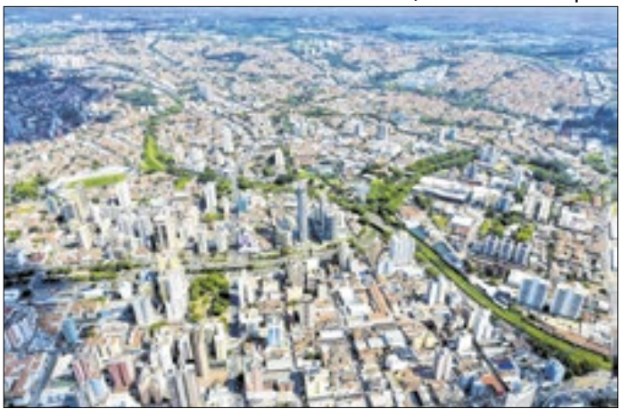
Receitas próprias representam 76% da arrecadação