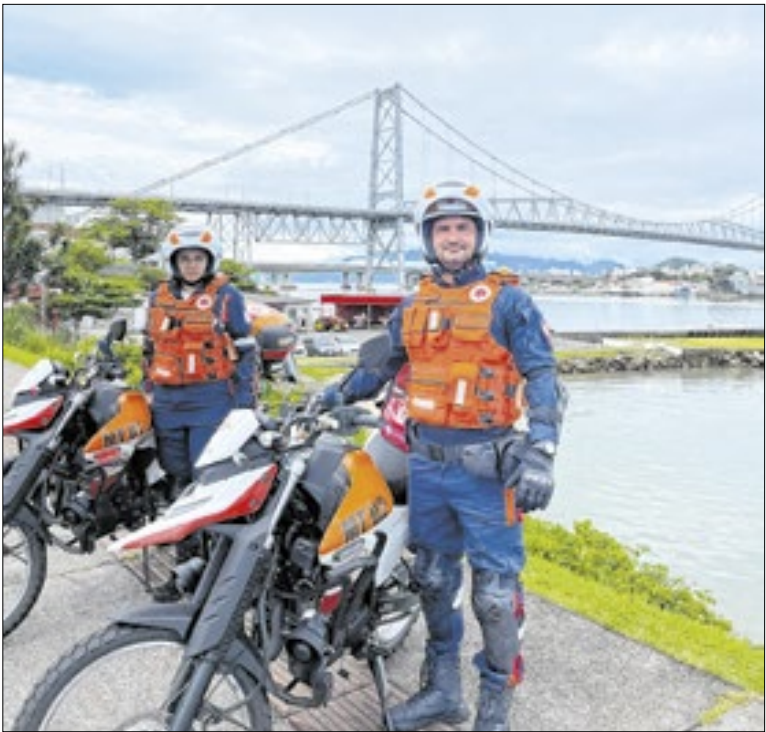
O Governo investiu este ano na entrega de 12 motolâncias

Blumenau (SC) terá programação de Réveillon na quarta (31) com shows e fogos em frente à prefeitura. A agenda começa às 18h e segue até 2h, com atrações locais, apresentação da Turma do Pagode e queima de fogos de baixo ruído à meia-noite, lançados de 3 pontos para ampliar a visibilidade do público.