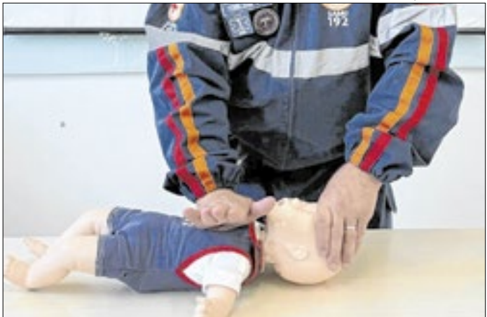
Samu altera protocolos repassados por chamadas