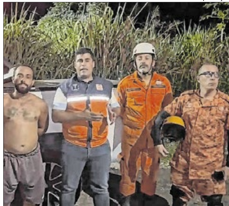
Equipes da Defesa Civil estiveram no local logo após o ocorrido

A lei estabelece que as visitas deverão ocorrer em dias úteis e finais de semana, conforme os horários definidos por cada unidade de saúde. Sempre que possível, a permanência mínima será de uma hora diária, com a presença simultânea de até dois familiares por paciente, respeitando a dinâmica hospitalar e as orientaçõe médicas.