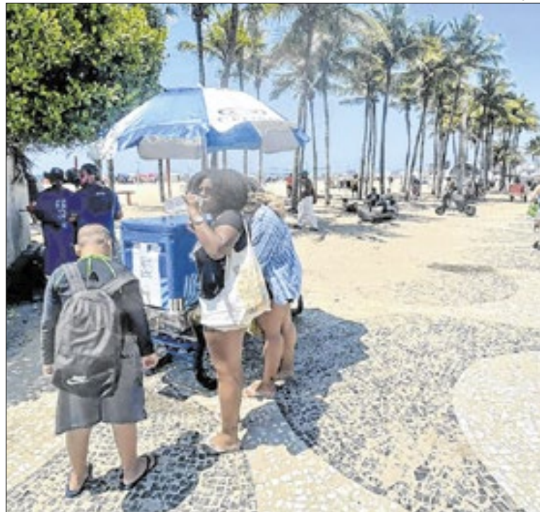
Bicicletas e pontos fixos de hidratação garantem água fresca

O deputado estadual Carlos Minc (PSB) acionou a Justiça contra a chamada gratificação faroeste, prevista na Lei 11.003/25, que reestrutura a Polícia Civil. O dispositivo autoriza bônus de até 150% do salário a policiais por “neutralização de criminosos”. Para o parlamentar, a regra é inconstitucional e estimula a letalidade.