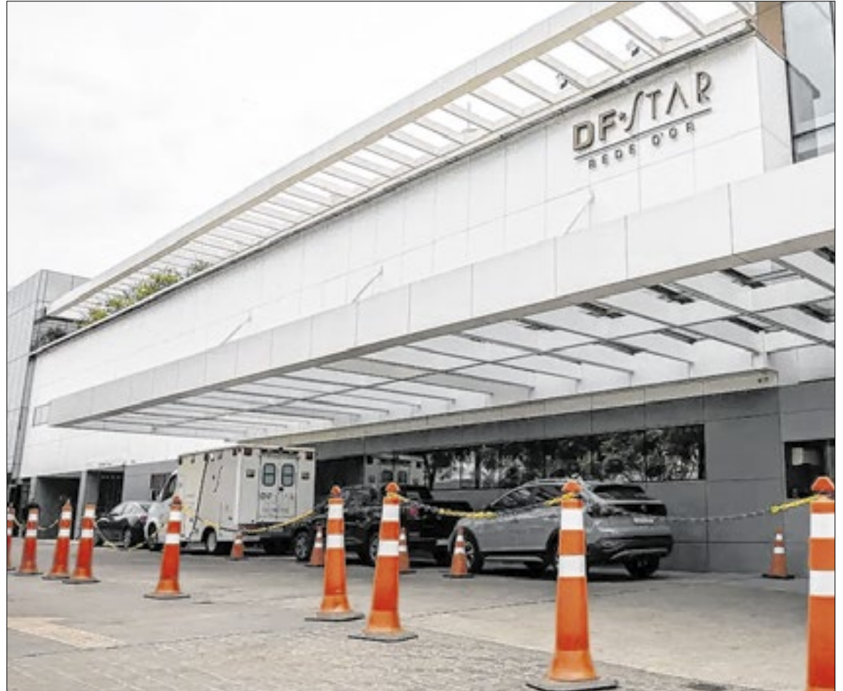
Bolsonaro está no hospital DF Star desde 25 de dezembro

De acordo com os médicos, Bolsonaro sofre de crises de soluço crônico desde o período