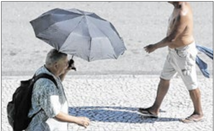
SMS orienta evitar exposição, se hidratar e uso roupas leves