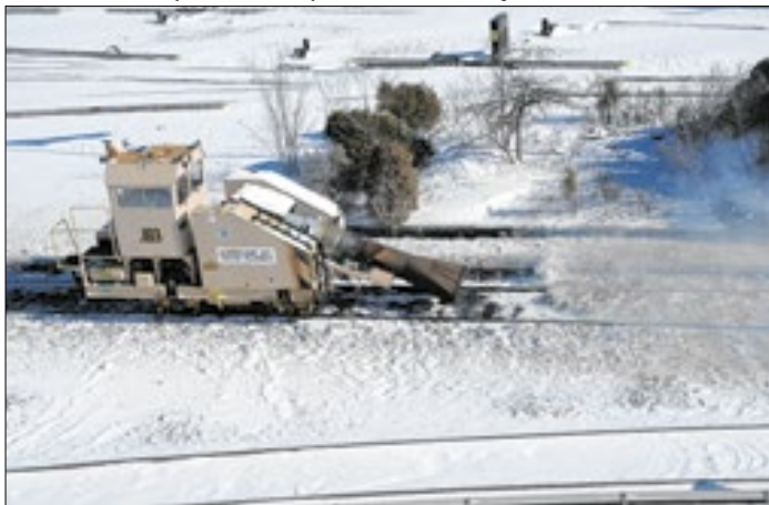
Situação pegou moradores de Nova York desprevenidos

Metropolitan Transportation Authority of the State of New York