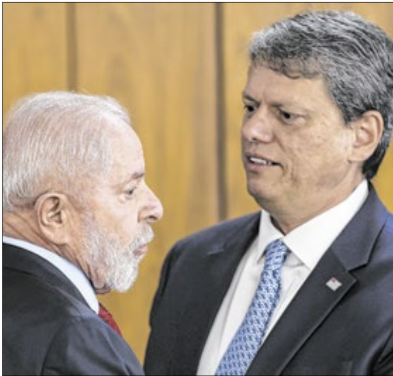
Tarcísio teria empate técnico com Lula em 2º turno

Segundo a Backstage, o verde foi usado por remeter ao país e por predominar na comunicação visual do evento. Disse que o personagem já vestiu “camisa florida nas cores verde e amarelo”. A Petrobras também falou em identidade visual. A BB alegou que sua cota não lhe dava o direito de escolher a cor da roupa.