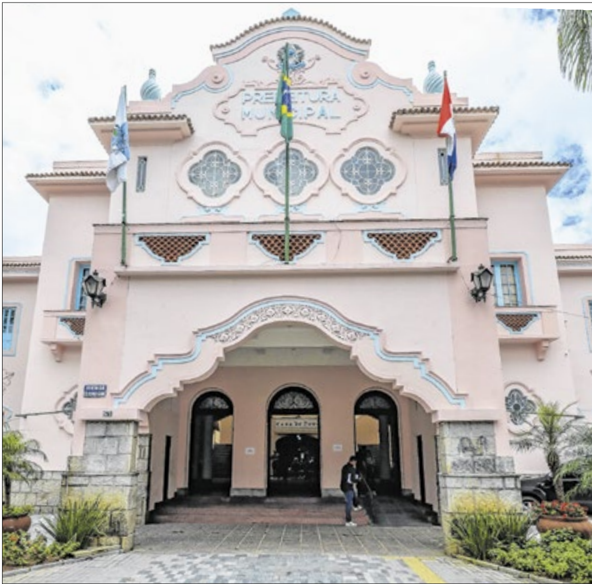
Gasto com shows em 2025 ultrapassa em 84% os valores destinado à prevenção para todo ano de 2026

A Prefeitura de Teresópolis foi questionada sobre os recursos destinados à prevenção de desastres e aguardamos um posicionamento. O Tribunal de Contas do Estado também foi acionado para esclarecer se o valor previsto é considerado suficiente, mas até o momento não houve resposta.