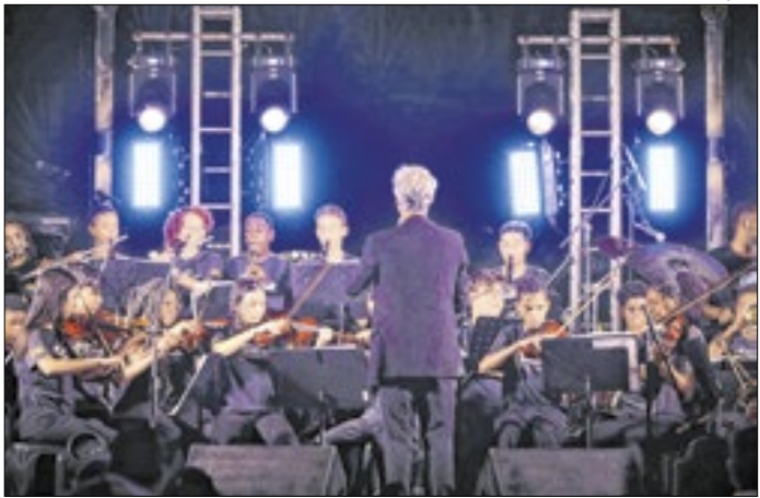
Orquestra tem residentes da cidade de Valença