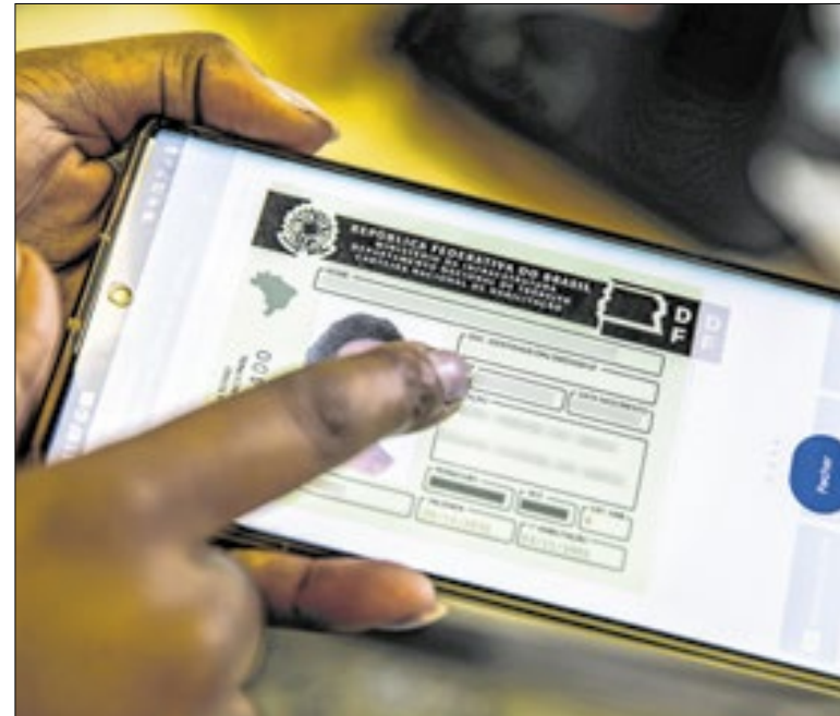
AGU derrubou liminar que suspendia programa CNH do Brasil