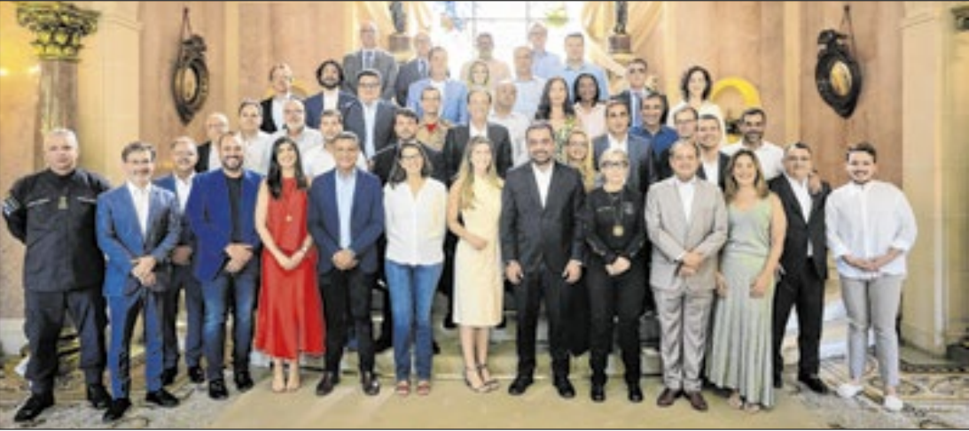
A tradicional foto na escadaria do Laranjeiras do governador Cláudio Castro com os seu secretariado e presidentes de autarquias

de seu time ao longo de 2025. O encontro, de encerramento do ano, aconteceu no Palácio Laranjeiras, residência do Governador.