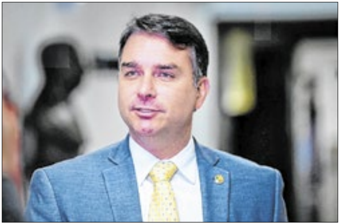
O senador foi a escolha segura do pai