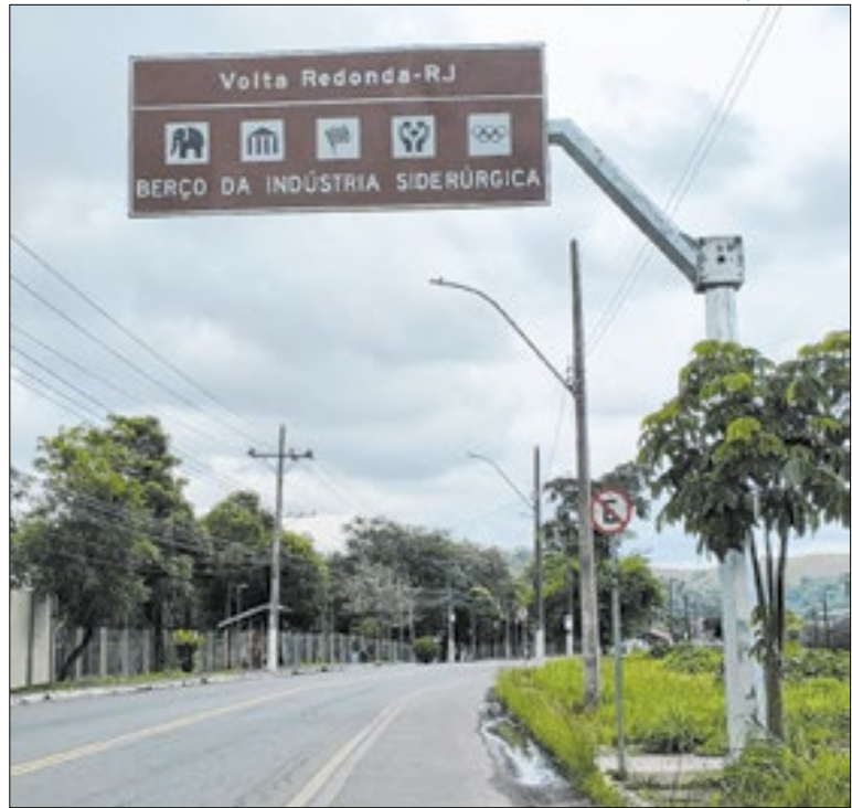
Serão instalados mais de 200 equipamentos indicativos

A iniciativa do Estado do Rio inclui medidas já adotadas pelo governo e que serão ampliadas durante este período, como uma megaoperação de hidratação em locais de grande circulação, equipes com motolâncias para atendimento de emergência e emissão diária de alertas do governo estadual.