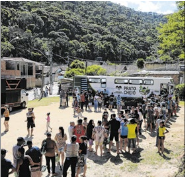
O programa tem como objetivo ampliar o acesso à alimentação

Medicamentos controlados também estão faltando na unidade, como clomorpazina, fluoxetina, gardenal, quetiapina, risperidona e pregabalina. A Coluna questionou o município sobre os medicamentos e insumos que estão em falta no Hospital Raul Sertã, mas não obtivemos retorno.