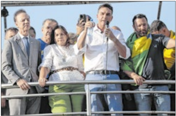
Rejeição alta inviabilizaria Flávio