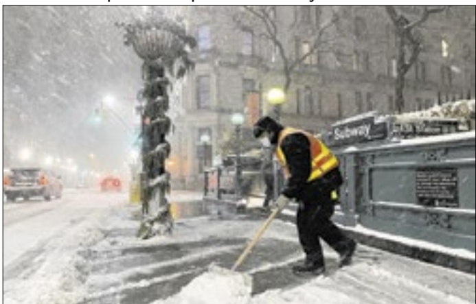
Equipes trabalham intensamente para reduzir riscos

Metropolitan Transportation Authority of the State of New York