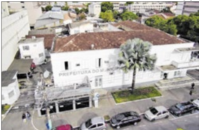
Medida visa adequação à Lei Federal 14.133/2021