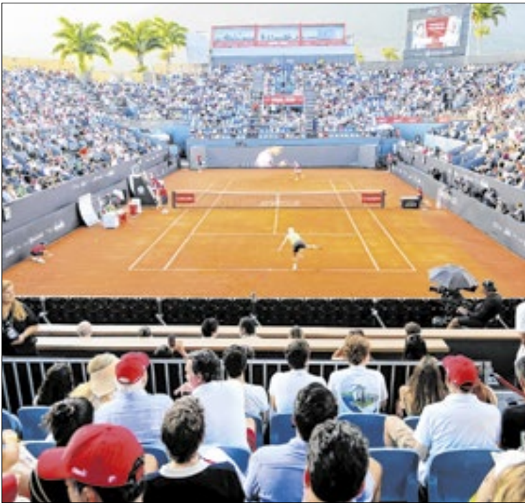
Rio Open foram um dos projetos da Lei de Incentivo ao Esporte

Outra intervenção importante ocorreu na Travessa Antenor Bessa, no bairro de Santa Rosa. A área recebeu cortinas atirantadas, solo grampeado com concreto projetado e geomanta, além de drenagem, instalação de guarda-corpo e revitalização completa dos acessos, com novas escadarias e calçadas.