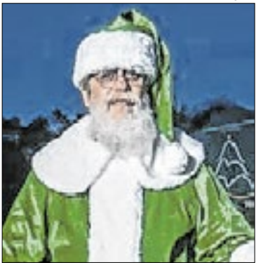
Papai Noel de verde na Lagoa