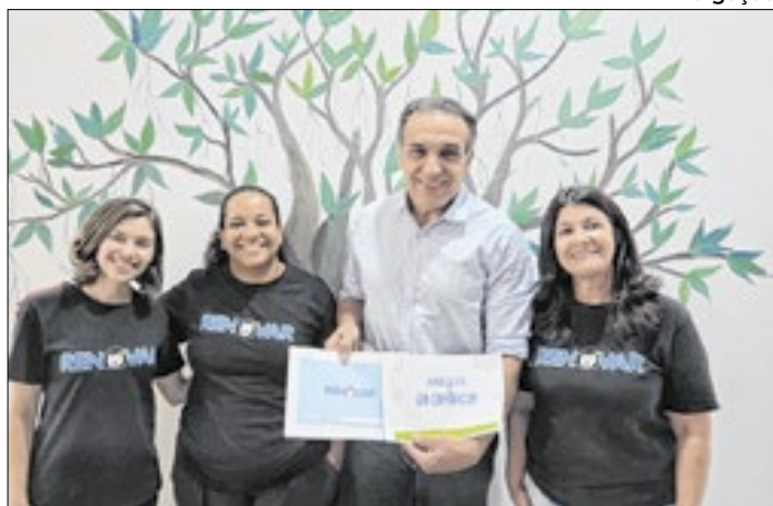
13 instituições sociais já possuem recursos depositados