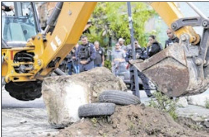
São Gonçalo é a cidade com o maior impacto da operação