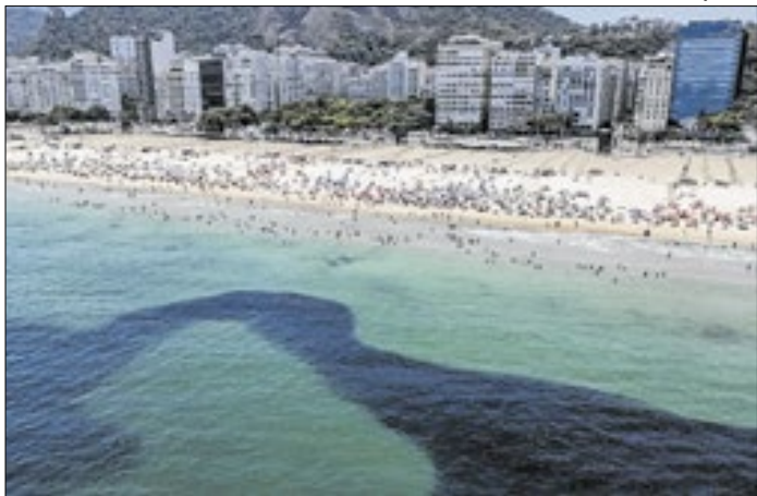
Cardume de majubinhas forma mancha escura na praia