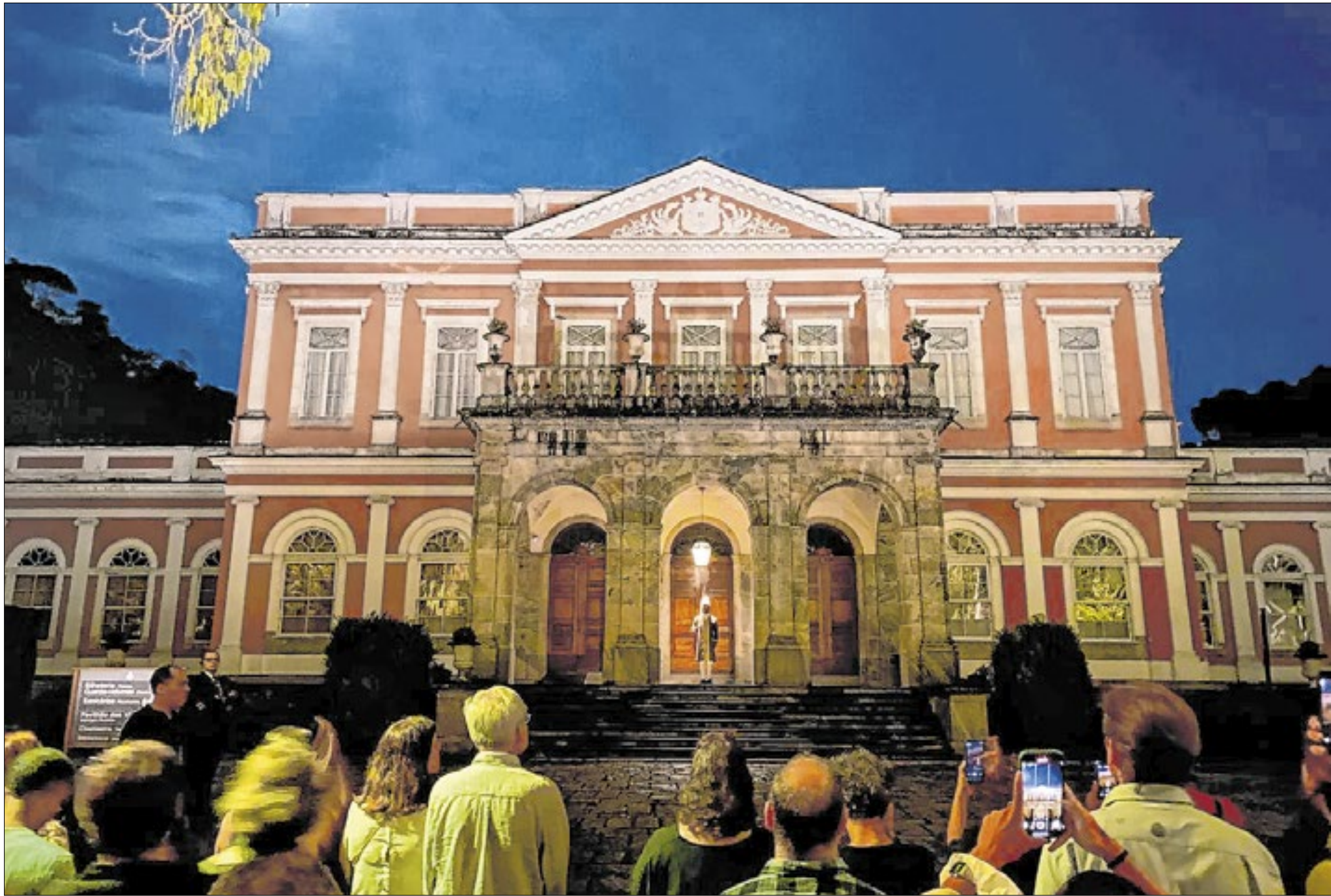
Museu Imperial retomou a apresentação do espetáculo “Som e Luz”, que narra parte da trajetória de Dom Pedro II durante o Segundo Reinado