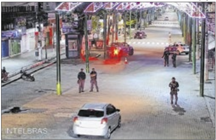
Ação foi integrada com forças de segurança