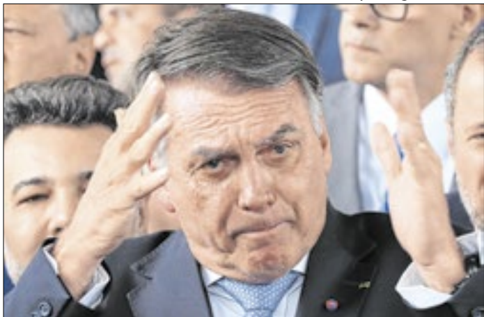
Ex-presidente elegeu filho para a disputa