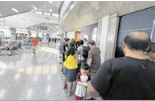
Entrada da Sala VIP da GOL/Smiles registrada pela coluna no Galeão