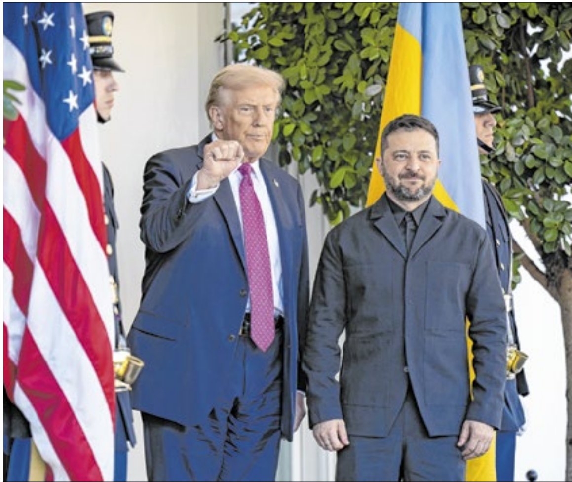
Encontro vai discutir proposta revisada de plano de paz que tem pontos rejeitados por Moscou

O “timing” da divulgação, claro, levanta suspeitas de exageros para influenciar a negociação entre o presidente americano e o ucraniano, marcada para a tarde deste domingo (28) no resort de Trump na Flórida, em Mar-a-Lago.