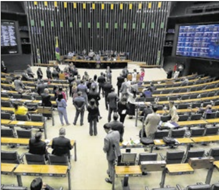
Isenção de IR até R$ 5 mil teve unanimidade no Congresso

O plano de Valdemar era fazer do PL a grande referência conservadora do país. Abrigando ali a extrema-direita bolsonarista e dialogando com a centro-direita mais pragmática. Precisa evitar que o radicalismo afaste os dois campos. Diante do risco, Valdemar torce pela briga agora.