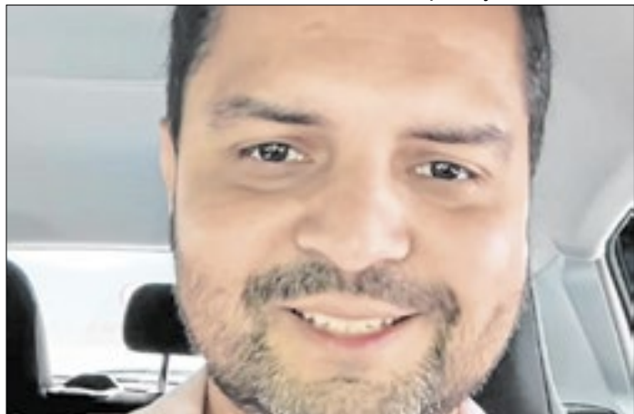
Kaio diz que Itatiaia precisa de solução urgente