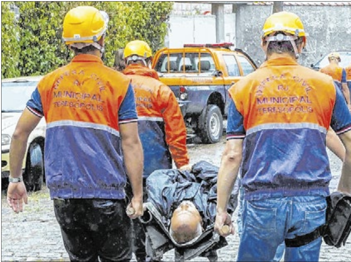
Simulação de resgate realizada em 2023 no município