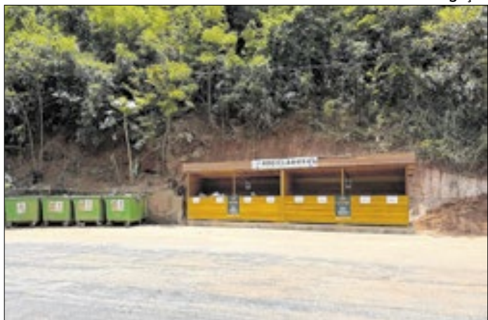
Objetivo para 2026 é ampliar as ações em Petrópolis