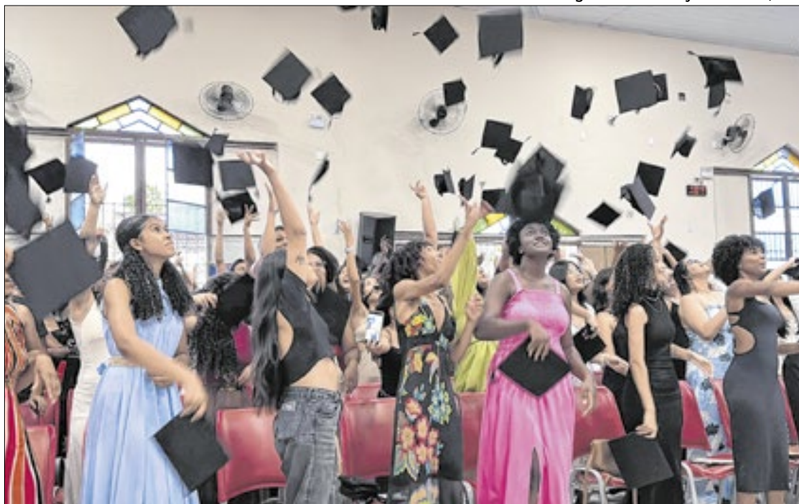
Evento na Igreja Assembleia de Deus, no bairro Guandu, marcou a conclusão do curso gratuito