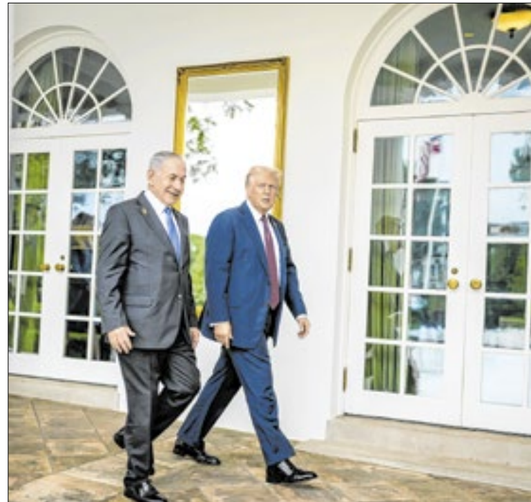
Cenário político mundial pode sofrer mudanças drásticas

Os documentos da investigação sobre Epstein estão sendo publicados desde a última semana. “Agora foram encontradas mais um milhão de páginas sobre Epstein. O Departamento de Justiça é obrigado a dedicar todo o seu tempo a esse embuste inspirado pelos democratas”, escreveu Trump na Truth Social.