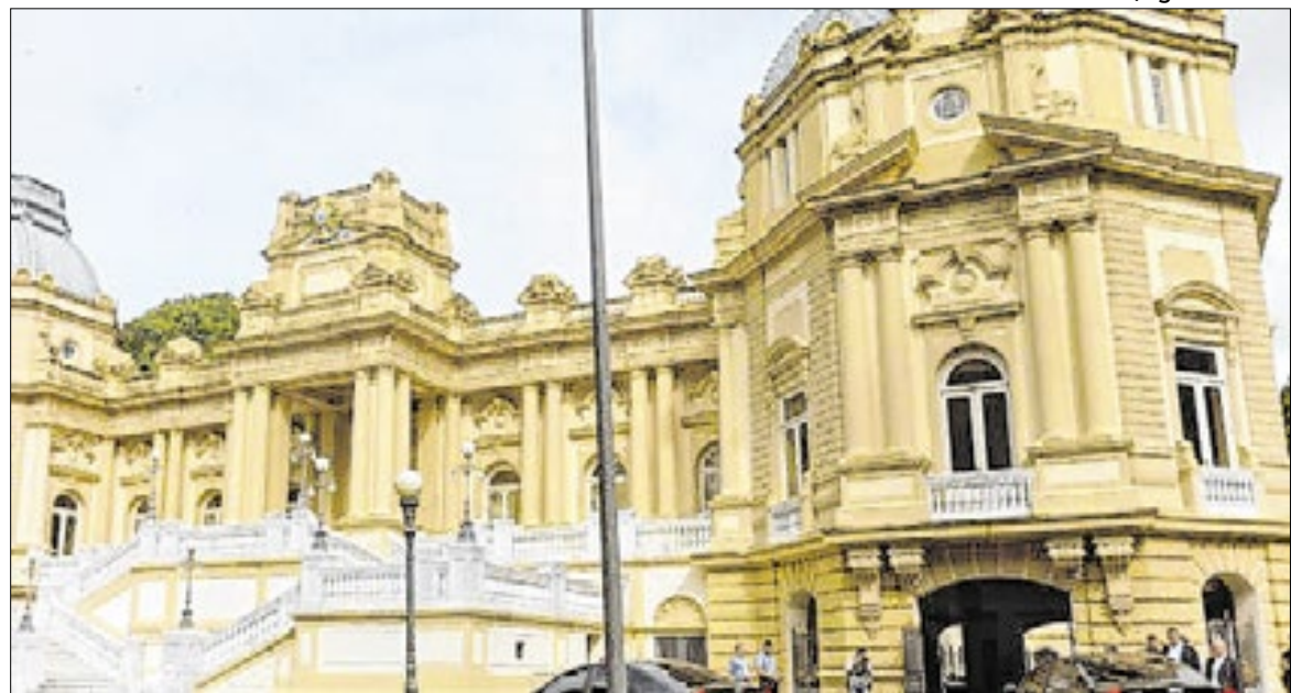
Projeto vai ajudar o estado a pagar as dívidas com a União

O Propag permite que o Rio de Janeiro e os demais estados conciliem o pagamento das suas dívidas com a prestação dos serviços públicos e a realização de investimentos em áreas como Saúde, Educação e Segurança. Enquanto no RRF a correção da dívida é feita com base no IPCA