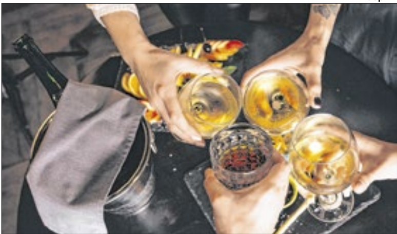
‘Bebida não pode ser a protagonista’, diz psiquiatra

O consumo de bebidas alcoólicas tende a aumentar no período de festas de fim de ano, impulsionado por confraternizações e celebrações familiares. Para a psiquiatra Alessandra Diehl, membro do conselho consultivo da Associação Brasileira de Estudos do Álcool e Outras Drogas, esse consumo potencializa os riscos à saúde física e mental e traz prejuízos para as relações sociais. A especialista destaca que não existe consumo seguro de álcool. Ela lembra que documentos recentes, ratificados pela Organização Mundial da Saúde, reforçam que qualquer quantidade ingerida pode trazer prejuízos. “Entre os principais problemas observados nesse período estão quedas, intoxicações e a redução da supervisão de crianças”.