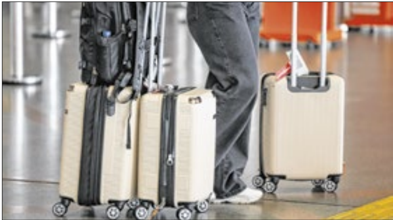
Categoria vai votar proposta salarial para decidir caso

Os aeronautas, pilotos, copilotos, comissários e demais empregados que trabalham a bordo das aeronaves de voos regulares comerciais, poderão entrar em greve nacional a partir de 1º de janeiro. A decisão, no entanto, ainda depende do resultado de duas assembleias da categoria. Segundo o Sindicato Nacional dos Aeronautas, uma nova proposta salarial, apresentada na terça em audiência no Tribunal Superior do Trabalho, será avaliada em assembleia online, com votação entre os dias 26 e 28. Caso seja recusada, está marcada uma nova assembleia, presencial, na capital paulista, no dia 29, a qual poderá deflagrar a paralisação.