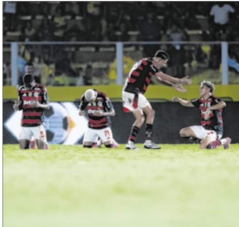
Atletas do Sub-20 vão disputar o início do Cariocão 2026

Nos últimos seis meses, o meia Saúl, do Flamengo, vem jogando com dores por conta de uma tendinopatia insercional do Tendão de Aquiles. Na Espanha, ele vem se consultando com médicos para avaliar se a cirurgia será necessária ou se há um tratamento mais conservador. Se operar, perderá cerca de 4 meses com recuperação.