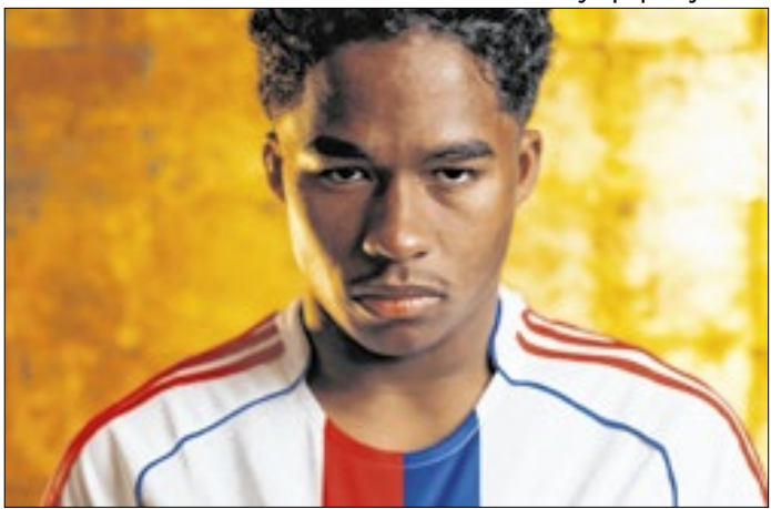
Joia brasileira vai tentar jogar mais minutos na França