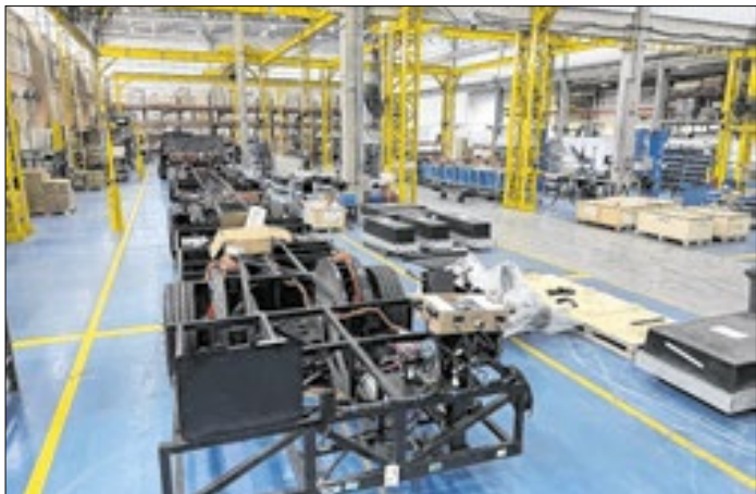
Ônibus 100% elétrico em produção em Campinas (SP)