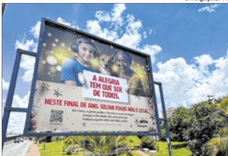
Iniciativa utiliza faixas, outdoors e materiais digitais

Paralelamente à ação educativa, a administração municipal infor-