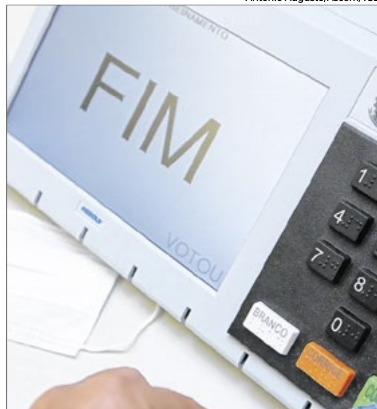
Pesquisa mirou em posicionamento político dos entrevistados