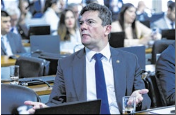
Erros de Moro levaram à anulação da Lava Jato