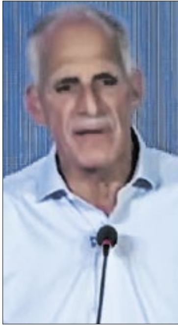
Nasry Asfura foi eleito presidente, confirmando a guinada à direita em Honduras