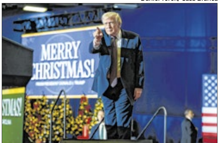
Donald Trump valorizou conquistas de seu mandato