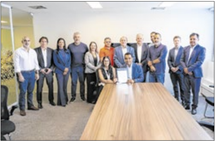
Assinatura da ata com representantes do país vizinho