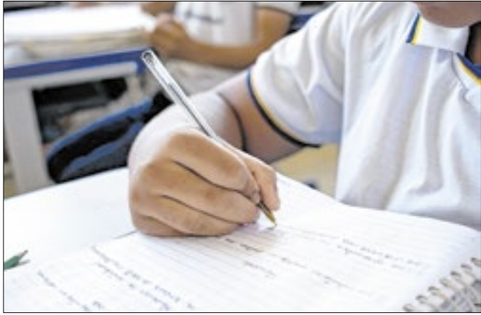
Sistema fará automaticamente a conversão de textos