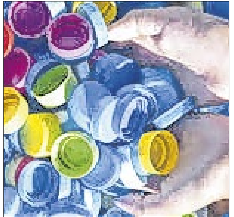
Abiplast trabalha para reduzir poluição plástica

O governo deixou para 2026 a indicação dos novos nomes para a cúpula do BC devido ao clima conturbado entre Executivo e Senado e ao prazo apertado até o fim do ano legislativo, encerrado na última segunda (22). Os escolhidos precisam passar por aprovação dos senadores. (Com Nathalia Garcia, Folhapress)