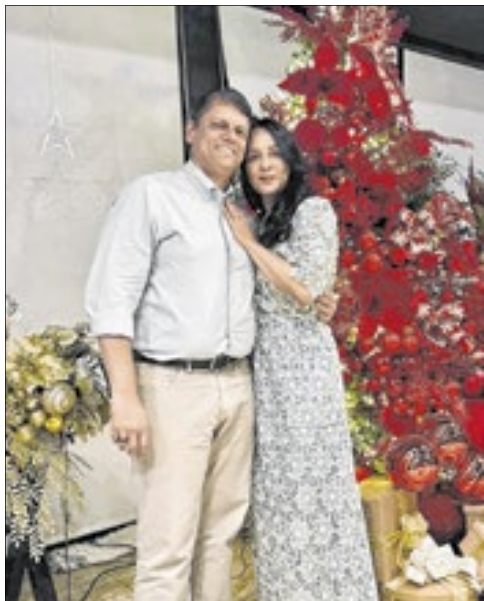
Em São Paulo, o governador Tarcísio de Freitas com a primeira-dama Cristiane durante a noite de natal