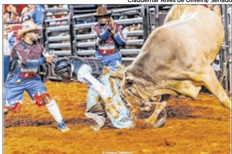
Advogada entrou com pedido de informação, que foi negado

li, que encabeça o movimento contra o rodeio na cidade, afirma que “na campanha de reeleição, o prefeito (Dário Saadi - Republicanos/ SP) assinou uma carta compromisso com