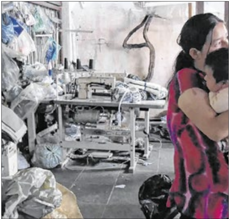
Conscientização via internet auxilia no combate ao crime

O restaurante popular do Programa Bom Prato terá um menu especial para celebrar o Ano Novo. O cardápio inclui suíno assado com molho de champignons e castanhas, salada, farofa e mousse de maracujá de sobremesa. O almoço será servido no dia 31 de dezembro na Avenida Doutor Moraes Sales, nº 384.