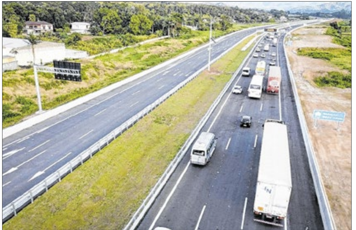
Quando totalmente finalizada, a obra promoverá a interligação aos trechos Oeste, Sul e Leste

O novo trecho de 24 quilômetros deve reduzir a circulação de caminhões em São Paulo