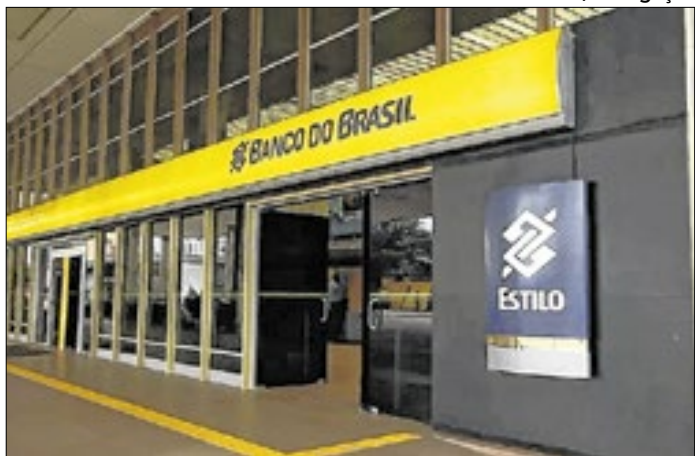
No Banco do Brasil, pagamento por TED ou PIX