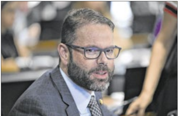
Seif: medidas darão maior segurança aos aposentados