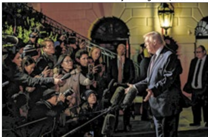
Presidente usou termos discriminatórios na mensagem