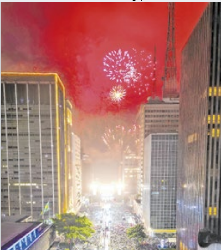
Fogos silenciosos serão usados na hora da virada

O Réveillon da Avenida Paulista reunirá 14 horas de shows gratuitos, com atrações que vão da música religiosa ao sertanejo e ao pop. Entre os nomes confirmados estão, Simone Mendes, João Gomes, Frei Gilson e outros