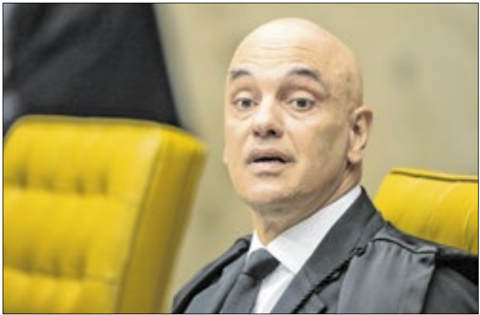
Alexandre de Moraes teria pressionado BC pelo Master