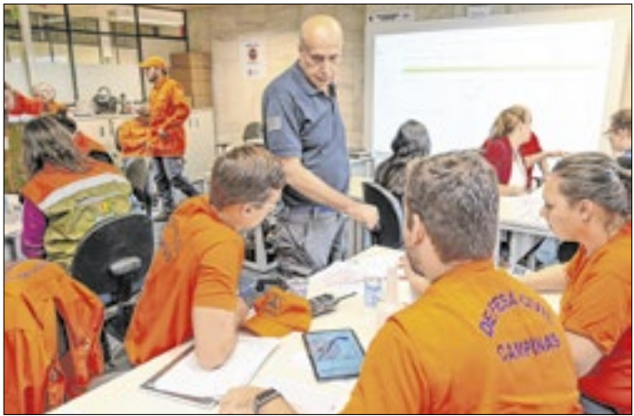
Ferramenta permite fazer diagnósticos