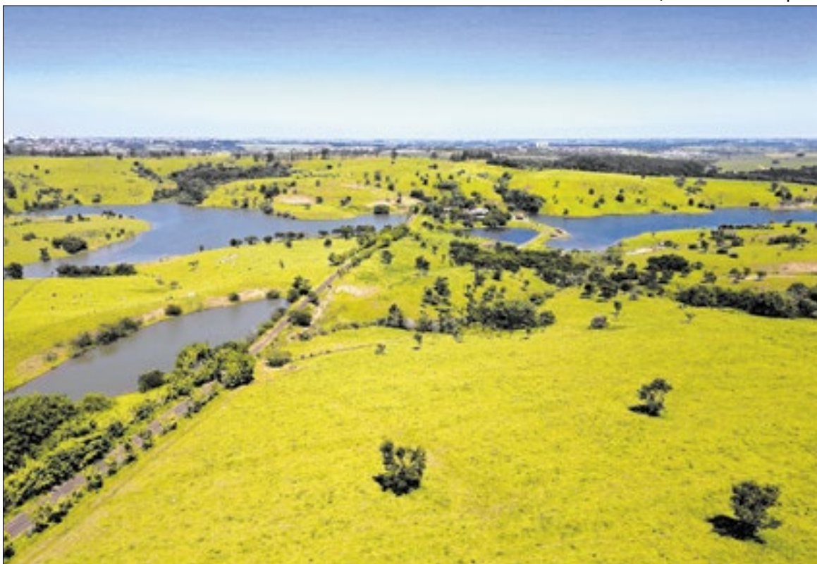
A Coordenadoria de Fiscalização Ambiental intensificou suas ações ao longo de 2025

A Coordenadoria de Fiscalização Ambiental (CFA) da Prefeitura de Campinas intensificou suas ações ao longo de 2025 e contabilizou, até o mês de novembro, 2.751 vistorias ambientais realizadas em todo o município. De acordo com a Prefeitura, no total, foram 7.397 atendimentos, 23,3% a mais que os cerca de 6 mil registrados no mesmo período de 2024.