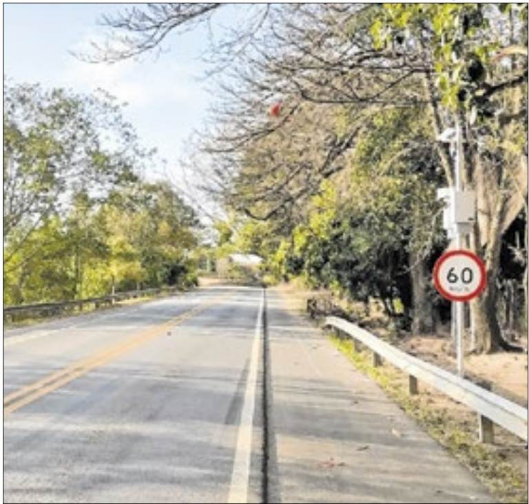
15 novos radares foram instalados em trechos estratégicos

O Sesc abre inscrições para o Curso de Gestão Cultural 2026, voltado à qualificação de gestores e profissionais da área cultural de instituições públicas, privadas e do terceiro setor. Com carga horária de 250 horas, o curso ocorre de 14 de março a 24 de outubro, com encontros presenciais semanais. Inscrições de 5 a 21 de janeiro.