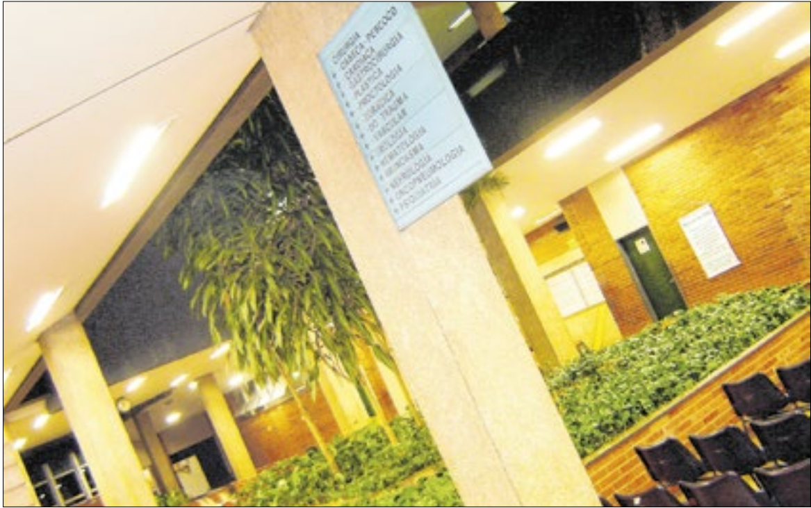
Corredor interno do Hospital das Clínicas (HC) da Unicamp

A autorização para submissão do projeto ao governo foi aprovada em reunião do Consu na última quinta-feira (18), que ocorreu de forma remota após duas sessões anteriores terem sido interrompidas por manifestações e invasões à sala do Conselho. Mesmo com novos protestos durante a reunião on-line, a matéria foi votada e recebeu 41 votos favoráveis, 34 contrários e duas abstenções. O reitor Paulo Cesar Montagner defende a proposta e afirma que o modelo é decisivo para a sustentabilidade financeira do setor de saúde. Segundo ele, a universidade não teria outra alternativa para custeio do sistema. Após a aprovação, os conselheiros