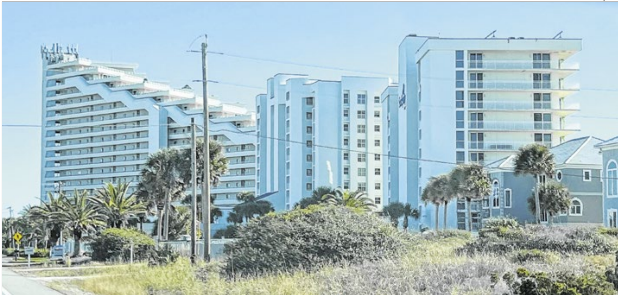
Valor compra vários imóveis, carros e até se equipara a algumas obras públicas em São Paulo