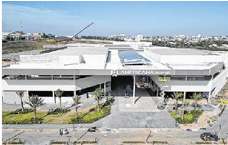
Prefeitura de Americana

“A inauguração do Americana Shopping confirma que nossa cidade está preparada para receber grandes investimentos. É um empreendimento que gera em-