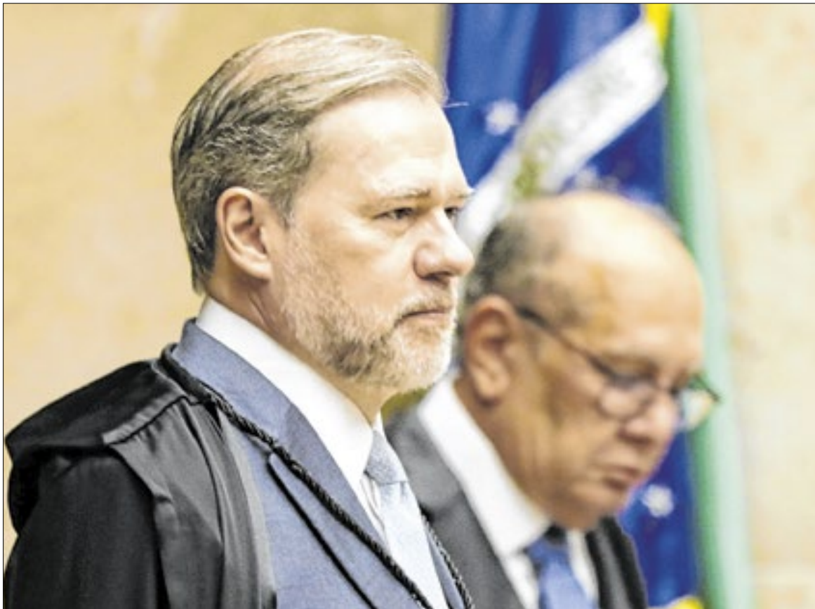
Ministro Dias Toffoli é o relator do caso no STF, que tramita em sigilo

A convocação da acareação contrariou integrantes do BC e provocou uma reação da PGR (Procuradoria-Geral da República). O procurador-geral Paulo Gonet pediu a suspensão da audiência, sob o argumento de que sua realização seria precipitada antes da tomada