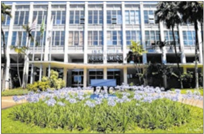
Fachada da sede do Instituto Agrônomo, em Campinas