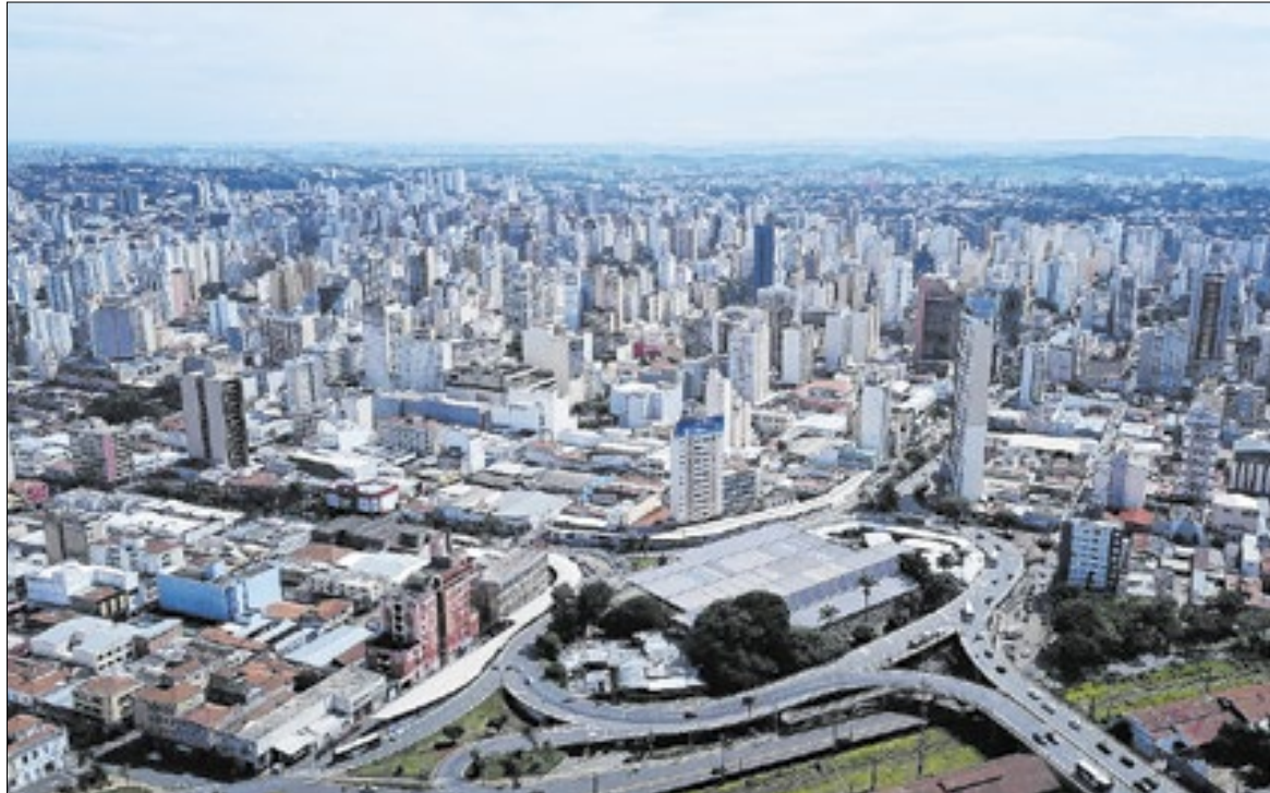
Prefeitura de Campinas

Levantamento da Fundação Seade indica que Campinas lidera a geração de postos de trabalho na RMC, com saldo positivo de 8.886 vagas no acumulado do ano. No ranking estadual, o município aparece na quarta colocação, atrás apenas da capital paulista, Osasco e Guarulhos. Na sequência regional, Sumaré registrou 2.602 novos empregos, ocupando a 31ª posição entre os municípios paulistas.