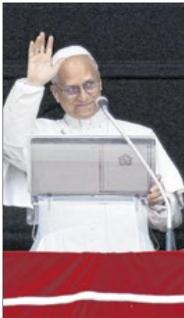
Papa falou na Missa do Galo

Nascido em Chicago e com dupla cidadania americana e pe-