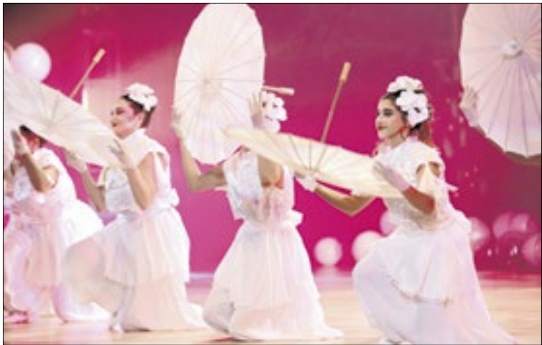
Espetáculo Quebra-Nozes foi apresentado em dezembro

Entre os destaques gratuitos da programação piloto estão a palestra e apresentação da atriz Zezé Motta, o concerto de Zeca Baleiro com a Orquestra Sinfônica de Campinas, o espetáculo Comédia 019 e o histórico Con-