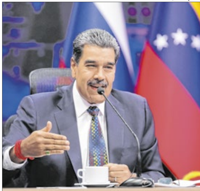
Venezuela possui as maiores reservas de petróleo do mundo