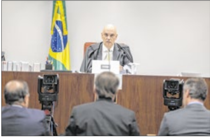
Ação contra o golpe: de novo a construção vira ruína?