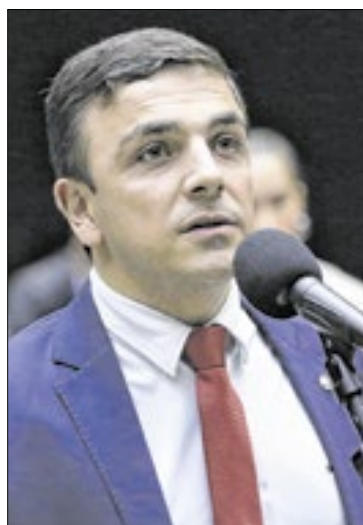
Aliel: “Melhor mais tempo que votar com pressa”

“Externamente, o governo americano age contra regulação, porque as empresas geram lucro e eles têm toda uma preocupação que elas não podem ter restrição. Mas, internamente, eles têm os