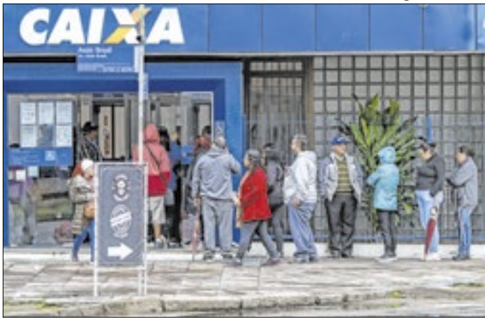
Saques podem ser feitos nas agências da Caixa