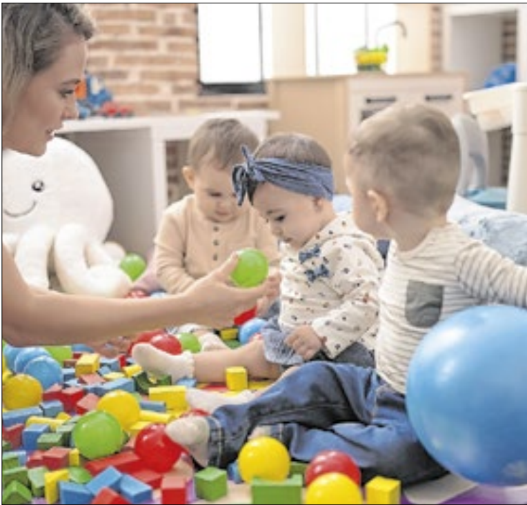
Mais de 330 mil bebês e crianças pequenas são atendidos

Prefeitura apresenta ações de combate às enchentes aos moradores do Jardim Vista Alegre, na Zona Norte. Projeto de drenagem no Córrego Bananal inclui canalização, nova travessia e contenção de margens. A comunidade da Subprefeitura Freguesia-Brasilândia conheceu o conjunto de obras para combate.