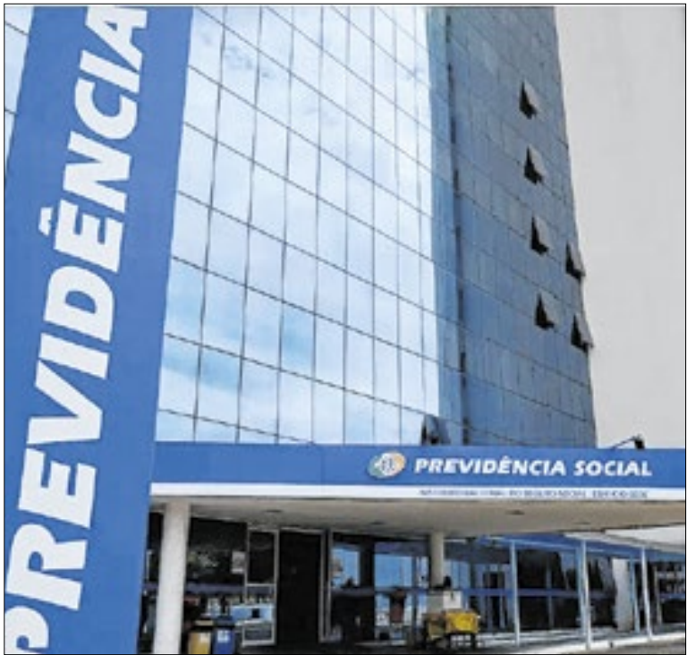
Novas regras mudam cálculos da aposentadoria

Desenvolvida pela AGU, a Pacífica é um sistema digital integrado ao INSS que agiliza acordos extrajudiciais com apoio de inteligência artificial e cruzamento de dados. A expectativa é que a Pacífica inaugure um novo modelo de desjudicialização no país, trazendo mais eficiência para a administração pública.