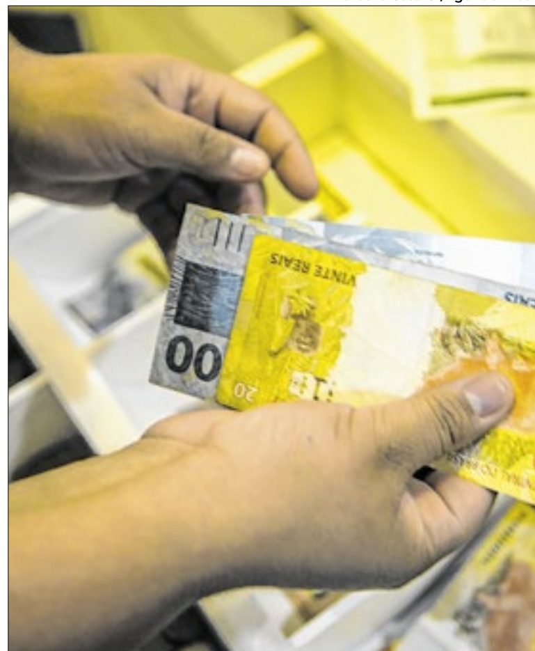
Regras visam dar mais segurança aos consignados