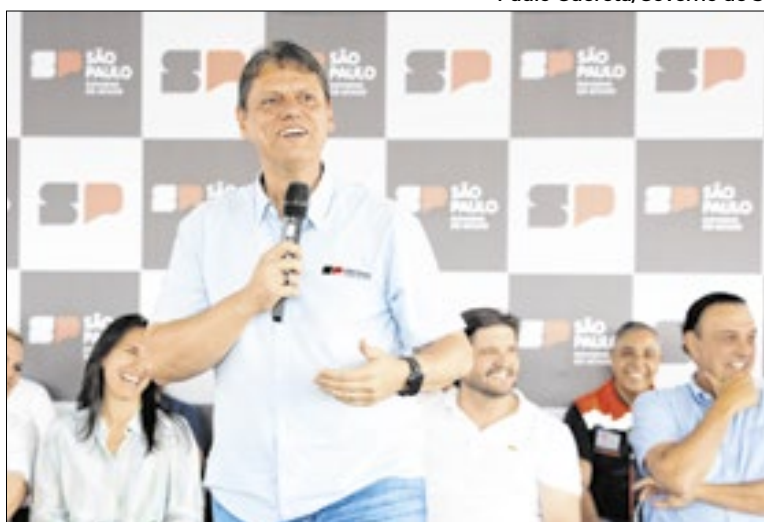
Afastamento será de 26 de dezembro a 11 de janeiro de 2026

O governador deve retornar ao cargo no dia 12 de janeiro,