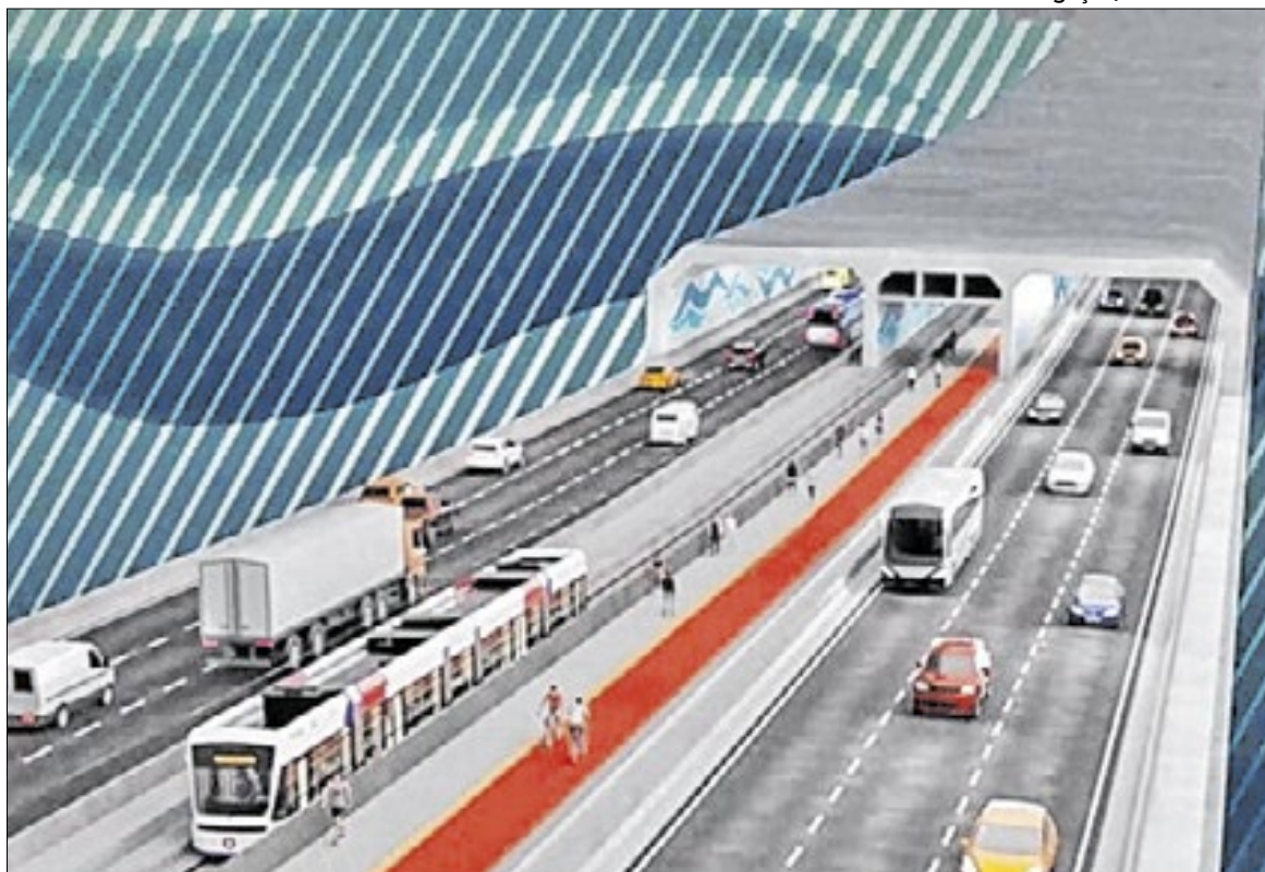
Visão artística do projeto do novo túnel Santos-Guarujá