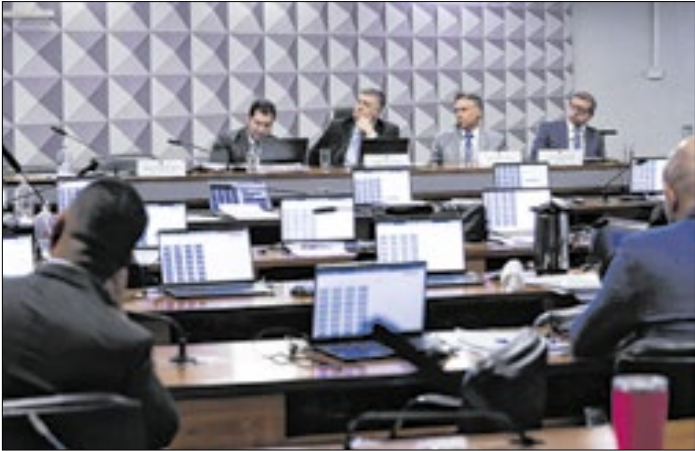
Fraudes no INSS são tema de uma CPMI no Congresso