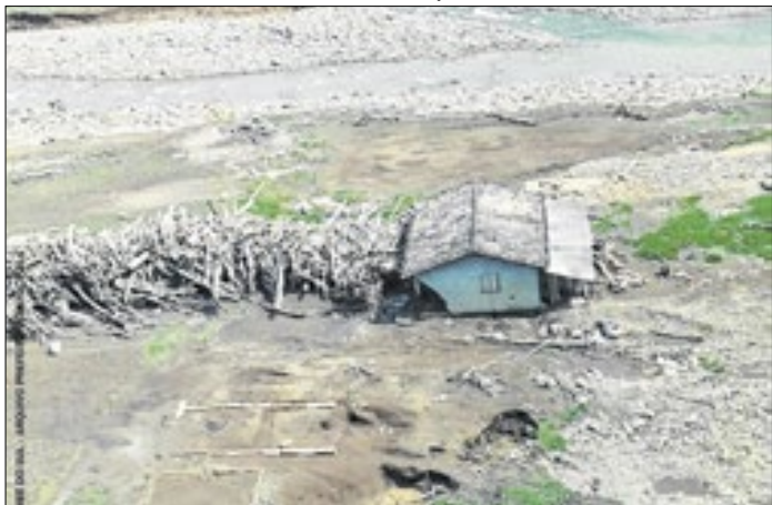
Tragédia deixou 28 mil desabrigados em 50 municípios