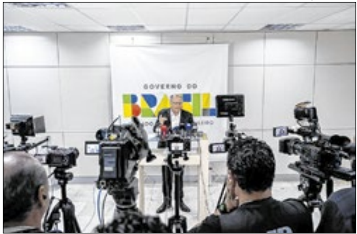
Para Alckmin, Brasil encerrará o ano com bons números