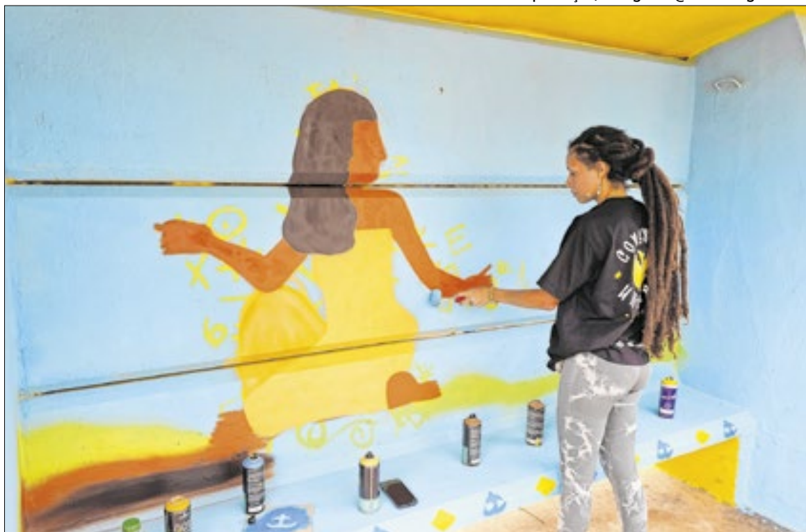
Murais em paradas de ônibus valorizam identidade negra local

O projeto conta com apoio do Fundo de Apoio à Cultura (FAC-DF), principal mecanismo de fomento a atividades artísticas da Secretaria de Cultura e Eco-