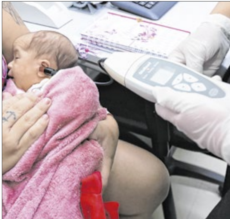
Exame é realizado ainda na maternidade da rede pública

Ao realizar esses protocolos no espaço público e na internet, ele transforma esses ambientes em “campo sensível”, onde os trabalhos convidam o espectador a “desacelerar, observar e refletir sobre modos de estar no mundo”.