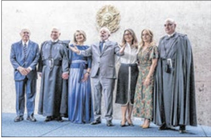
Oposição pode trazer problemas para Lula e o STF