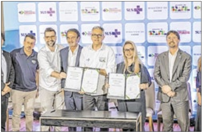
Hospitais vão garantir mais cirurgias cardíacas