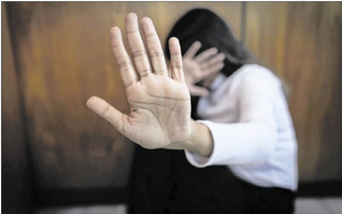
Medida prevê remoção automática em casos de medida protetiva que comprove risco à vida

A portaria determina que a remoção deve ser concedida automaticamente quando houver