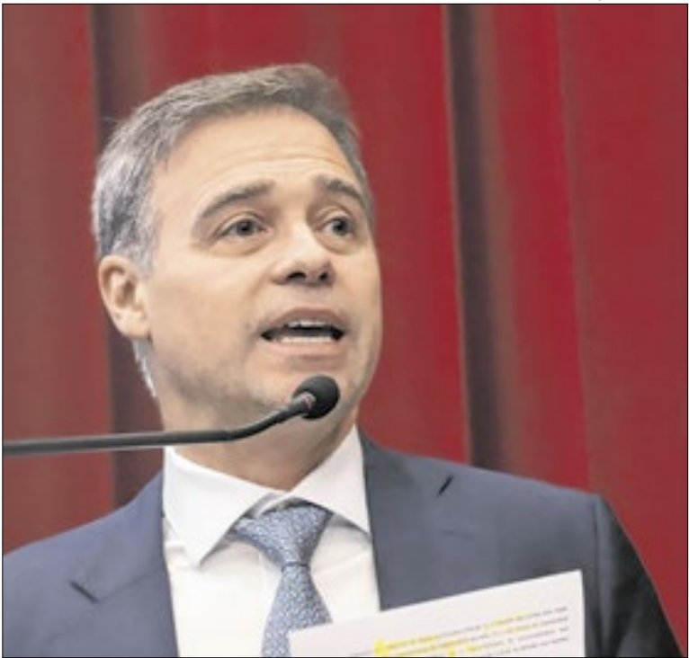
Ministro André Mendonça

O número de vagas do novo concurso da Câmara Federal ainda será definido. Atualmente, a instituição tem 767 cargos desocupados e 838 servidores aptos à aposentadoria até 2030. O último certame aconteceu em 2023. As remunerações iniciais chegam a R$ 29,4 mil para analista e R$ 19,6 mil para técnico.