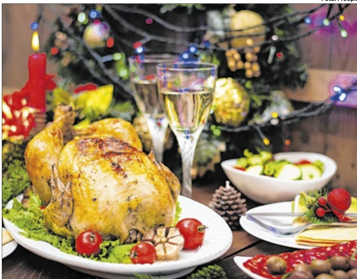
Cardápio deve ser organizado com antecedência com versões leves das receitas tradicionais