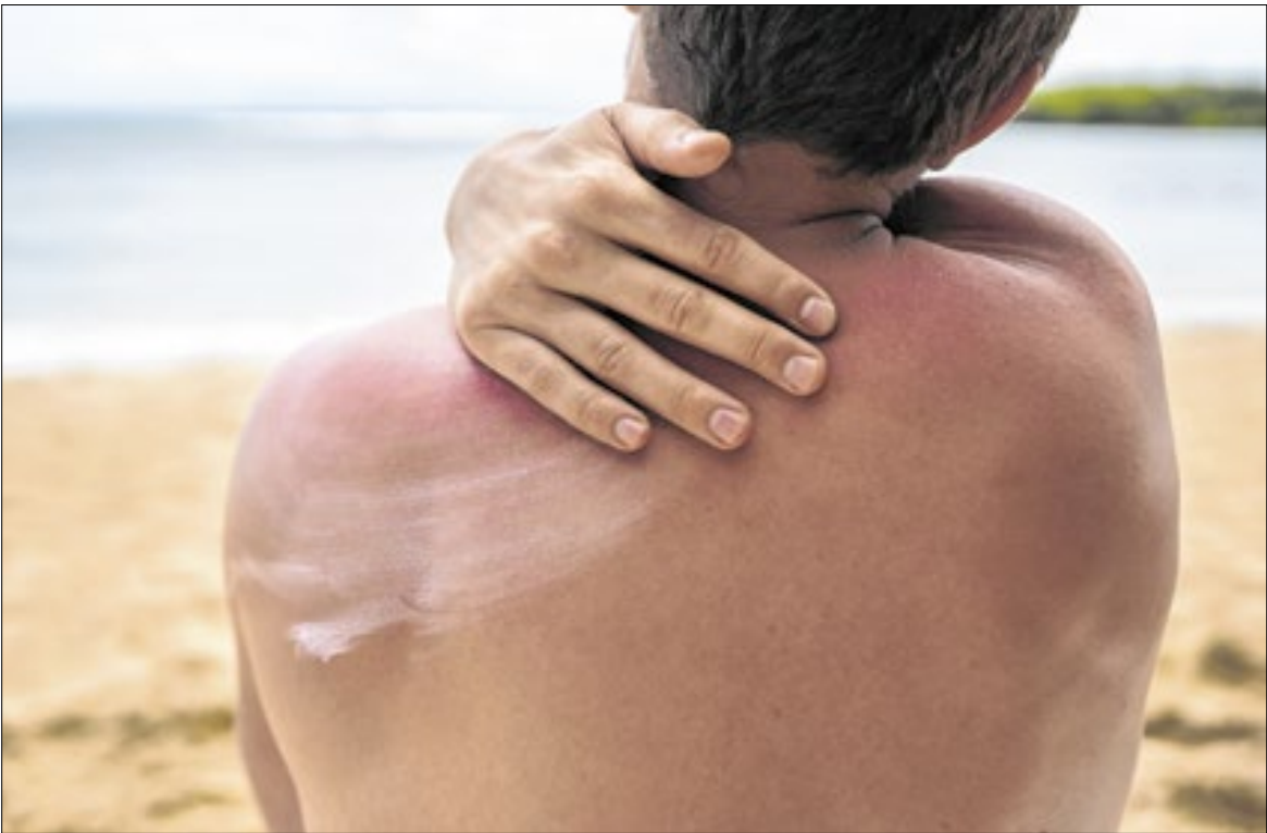
Verão começou no último domingo e motivou o alerta

solar com FPS 50, aplicado antes de sair de casa e reaplicado ao longo do dia, especialmente após suar, entrar na água ou praticar atividades ao ar livre, inclusive em dias nublados. Além do protetor, é recomendado o uso de roupas com proteção UV, óculos escuros, chapéu e a preferência por locais com sombra, como barracas, sombrinhas ou árvores. Outro ponto de atenção é o horário de exposição ao sol, ideal antes das 10 horas da manhã e após as 16 horas. A dermatologista reforça ainda que o câncer de pele é o tipo mais frequente no país e surge, principalmente, pela falta de proteção contra a radiação ultravioleta ao longo dos anos. Entre os sinais de alerta estão lesões que formam crostas, sangram, não cicatrizam ou persistem por muito tempo. Nesses casos, a orientação é procurar uma Unidade Básica de Saúde (UBS) assim que o sintoma for percebido.