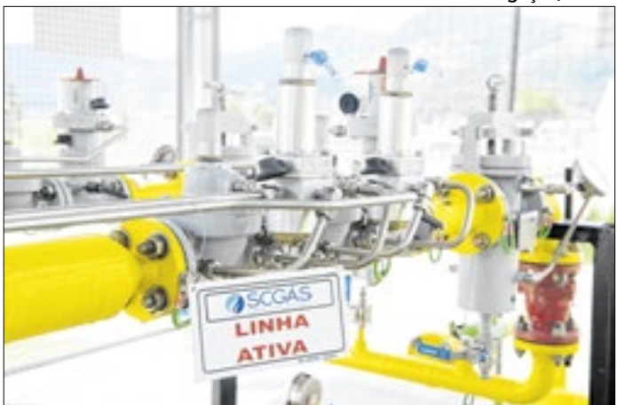
Corte médio de 12% começa a valer em janeiro