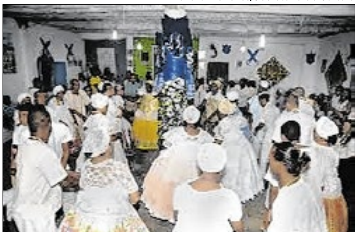
No DF, o estudo mostra um setor diverso