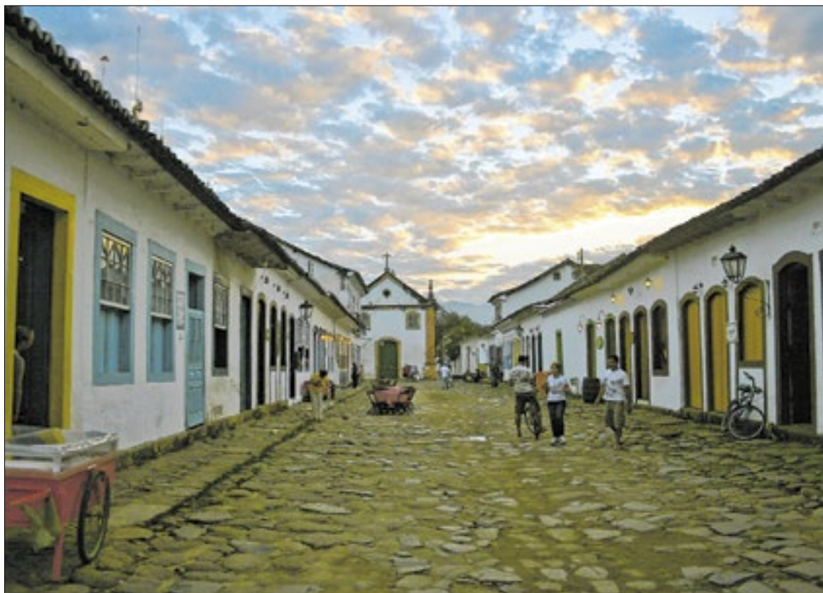
A histórica Paraty com suas ruas de pedras que exalam cultura e arte

A primeira das praias da enseada é a do Laboratório, nome que foi de certa forma trocado pelo apelido praia de Águas Quentes,