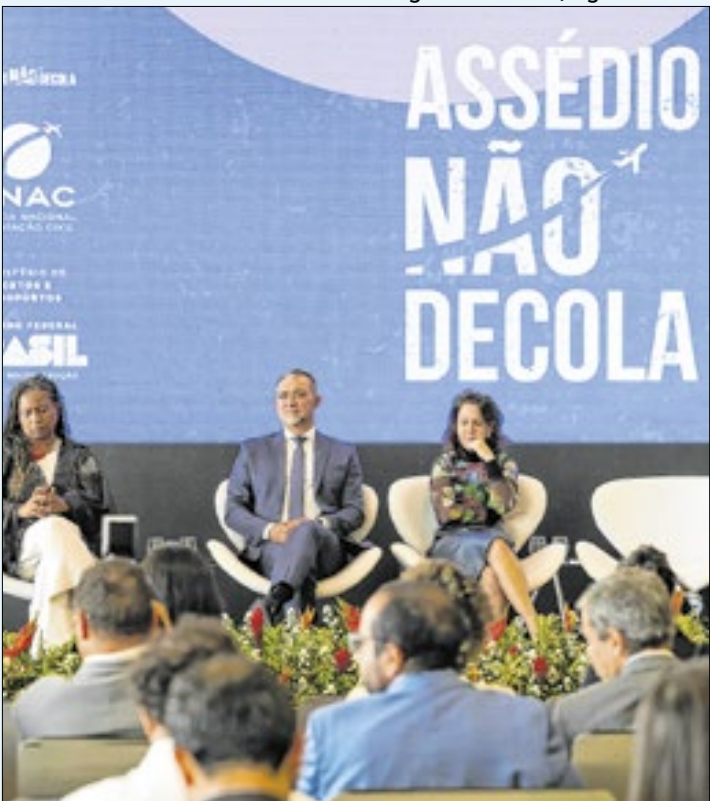
Ação foi lançada pelo Ministério de Portos e Aeroportos

A iniciativa de combate à violência contra as mulheres foi lançada pelo Ministério de Portos e Aeroportos, em São Paulo. Em uma das peças da campanha, o vídeo exibe uma mulher com o passaporte nas mãos e o olhar apreensivo