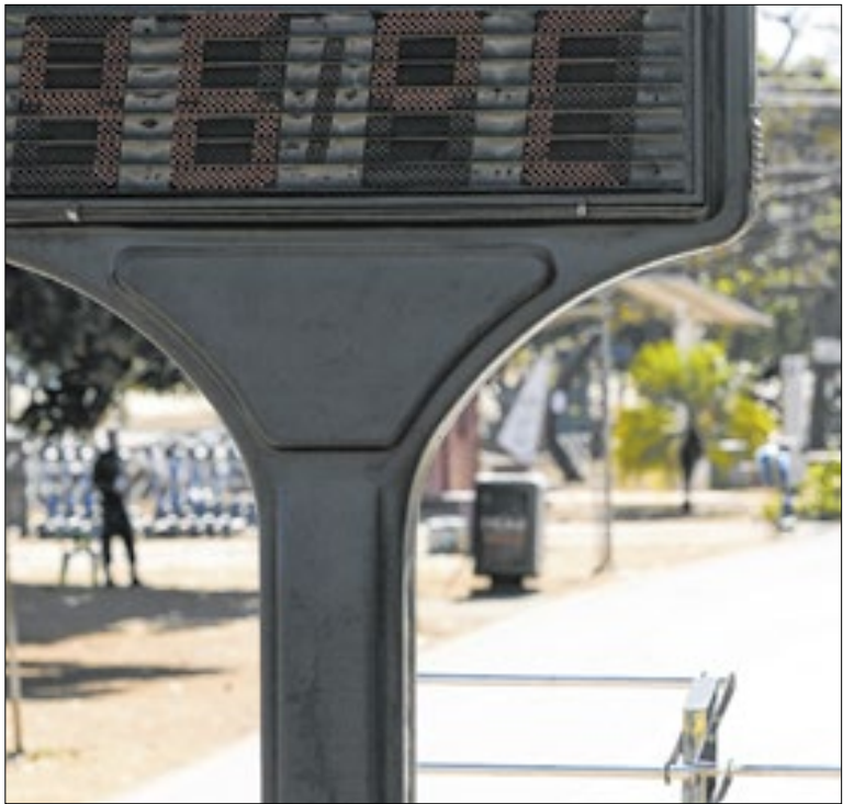
Médico pede atenção à pressão arterial

Brasil acaba de lançar um documentário especial, que marca a conclusão de 15 anos de apoio brasileiro ao fortalecimento do sistema de saúde do Haiti. A iniciativa de cooperação Sul-Sul foi realizada pelo Ministério da Saúde, em parceria com o Ministério das Relações Exteriores, via Agência Brasileira de Cooperação.