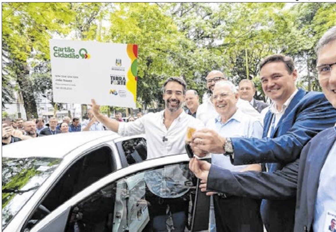
Foram entregues 121 veículos para ampliar assistência técnica no meio rural a agricultores

Os equipamentos serão utilizados principalmente nas atividades de orientação, diagnóstico e planejamento das intervenções produtivas, ainda de acordo com