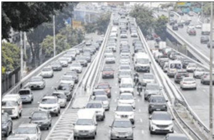
Restrição para carros voltará no dia 12 de janeiro