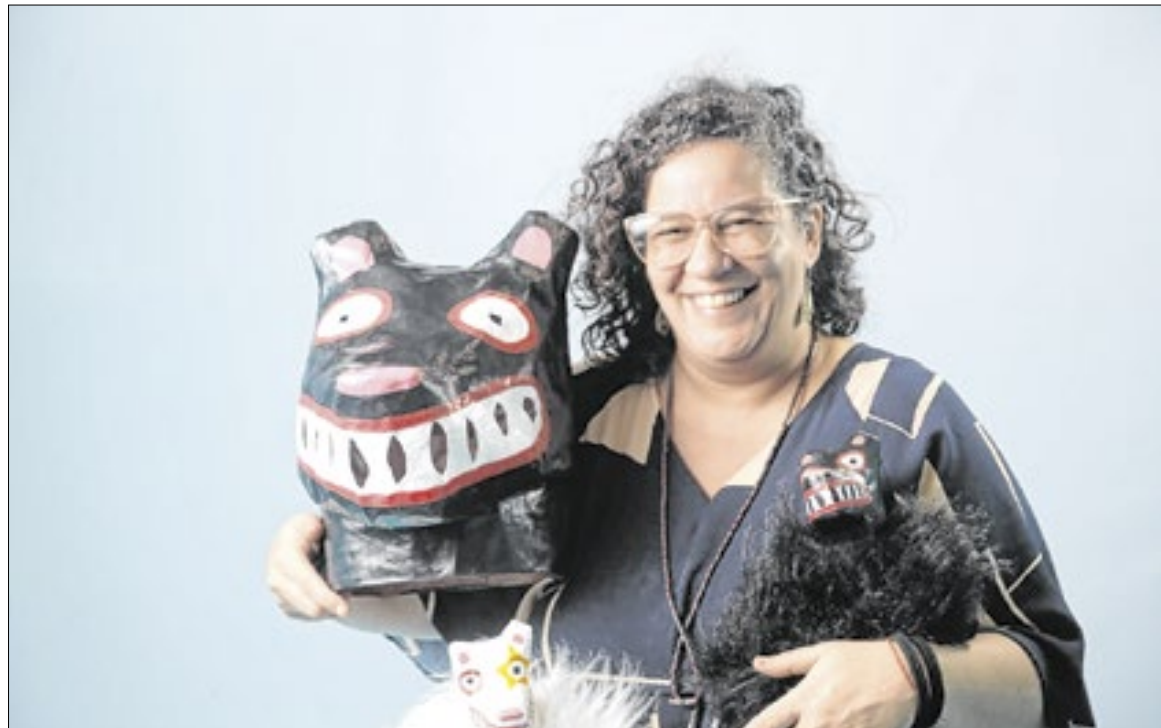
Secretaria de cultura PE

Além do impacto visual, a obra oferece uma experiência sensorial. Moradores, turistas e visitantes poderão acessar a escultura e entrar na cabeça da La Ursa Gigante. No interior, o público encontrará registros