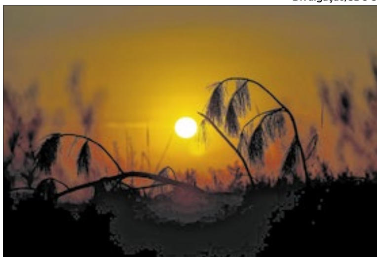
Instabilidades aumentam risco de chuva forte no estado

Entre hoje (23) e quinta-feira (25), data do Natal, o calor se intensifica. As maiores temperaturas são esperadas no litoral, especialmente na faixa norte, onde os