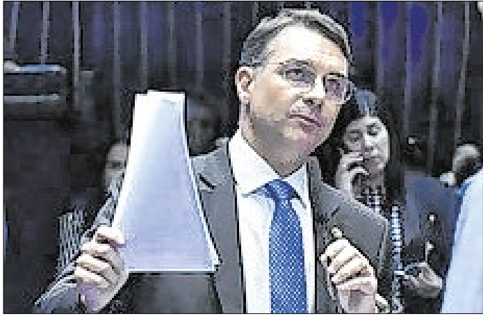
Partidos não têm pressa para decidir