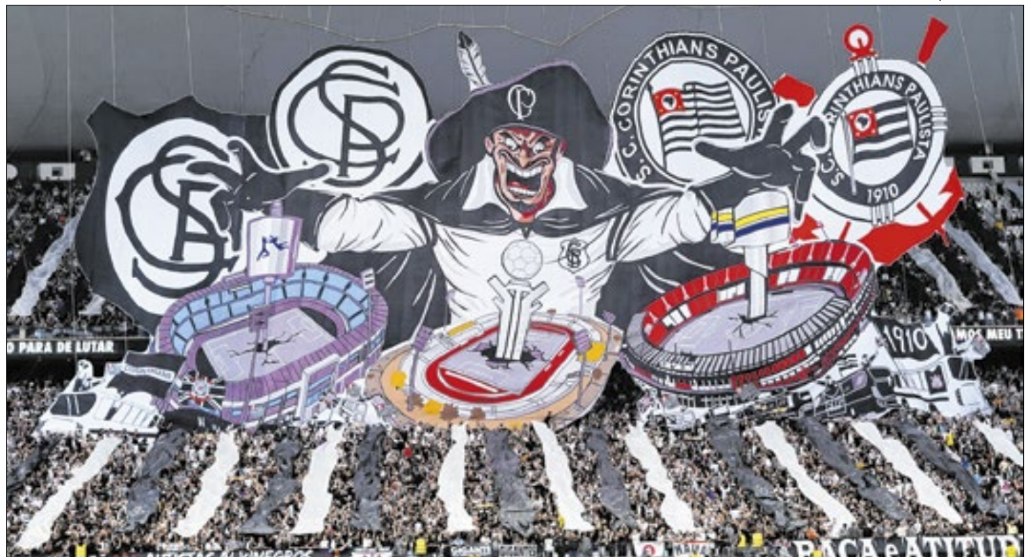
Título da Copa do Brasil premiou ano de futebol irregular e polêmicas extra-campo do Corinthians