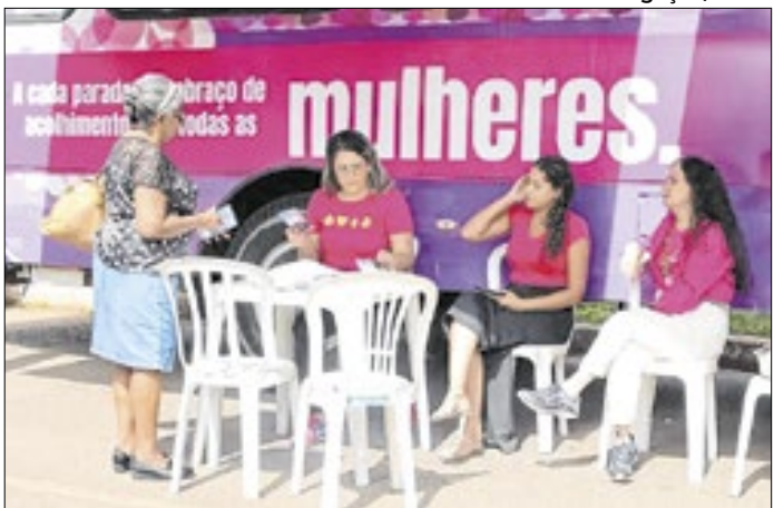
62,3% dos trabalhadores do são mulheres