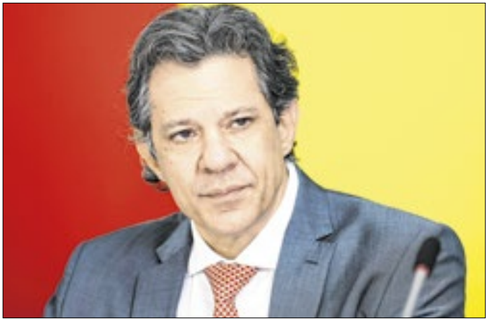
Haddad pode se eleger senador em São Paulo