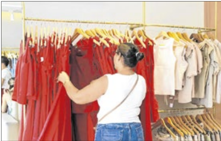
Mácia do Carmo/Governo estadual

A movimentação nas ruas de Macapá é visível, com lojas cheias, vitrines temáticas e um ambiente festivo. O aumento nas vendas é impulsionado, principalmente, pela chegada de turistas no estado e pelo pagamento de salários e benefícios de fim de ano, fatores que