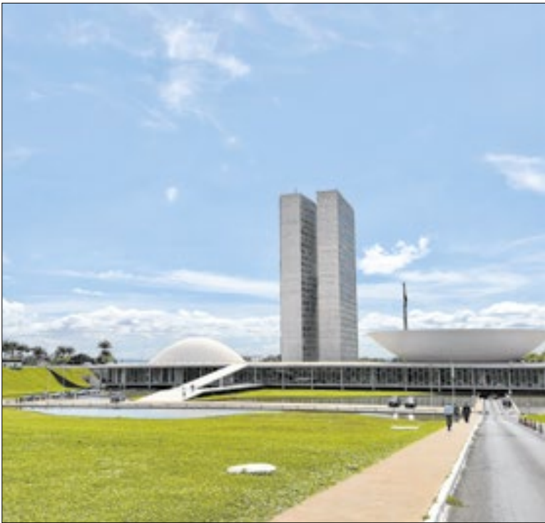
Período legislativo será atípico devido a ano eleitoral

E alguns estados do Nordeste continuam mostrando a força do governo. Em Pernambuco, onde deve ser eleito governador o prefeito do Recife, João Campos (PSB), lidera para novo mandato o senador Humberto Costa (PT). O ministro da Casa Civil, Rui Costa (PT) é nome cotado para uma vaga na Bahia.