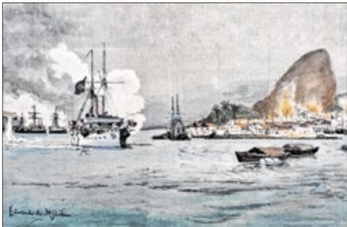
"Ataque da Armada à Capital" de Eduardo de Martino