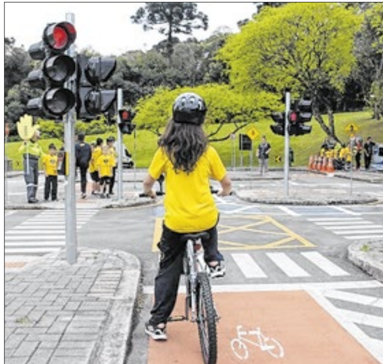
Nova sinalização e campanhas ampliam controle viário

As equipes de futsal de Chapecó (SC) e Jaraguá (SC) decidem nesta terça-feira (23) o título estadual da categoria de base, às 19h, no ginásio da Associação Atlética Banco do Brasil (AABB), em Chapecó. Após derrota por 5 a 2 no primeiro jogo, o chapecoense precisa vencer no tempo normal para forçar prorrogação.