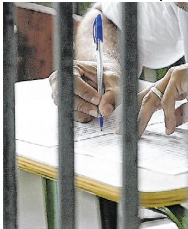
Encceja PPL 2025 registra crescimento de 24,6%

O crescimento alcançado é fruto do trabalho integrado das equipes pedagógicas, gestores escolares e parceiros institucionais, que acreditam na educação como instrumento de transformação social”.