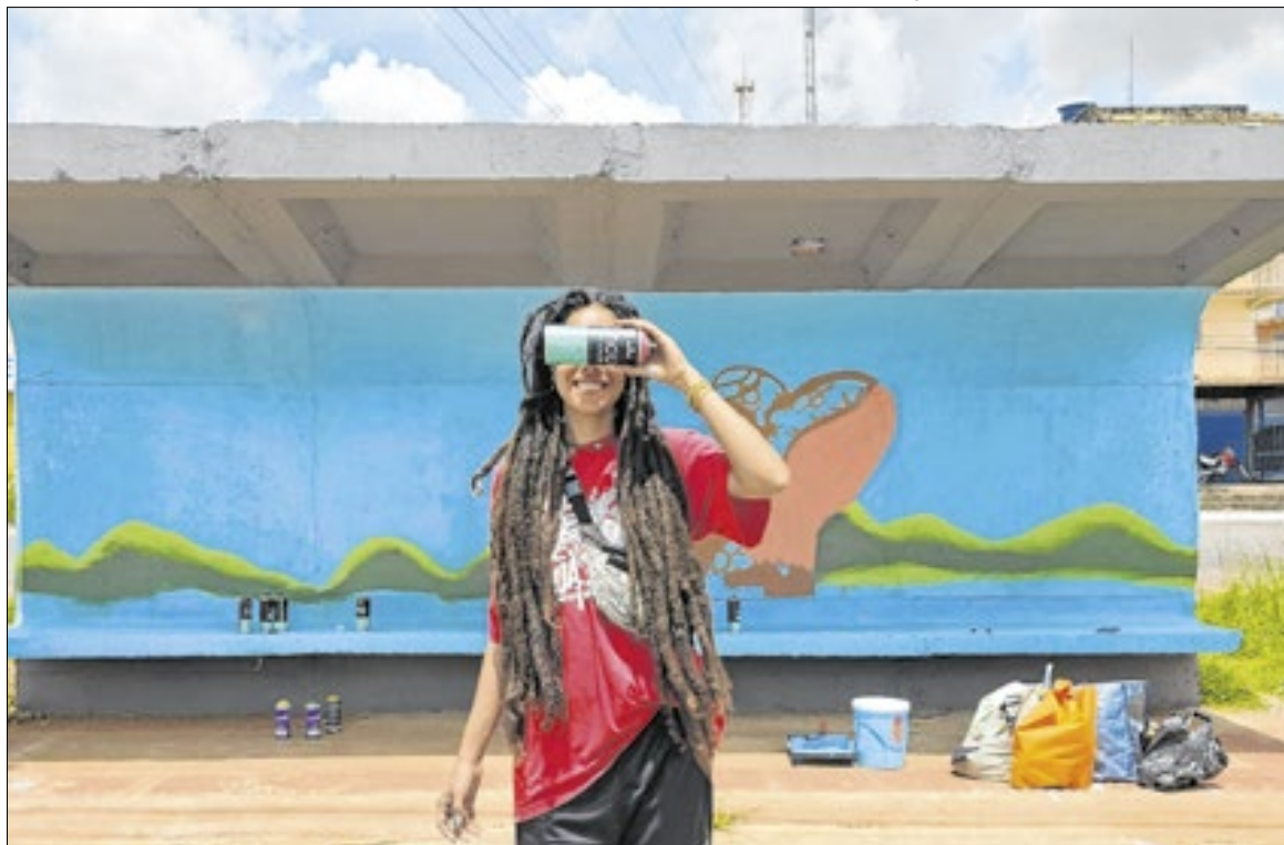
Artista colocou em suas pinturas a representação da própria trajetória na periferia de Brasília