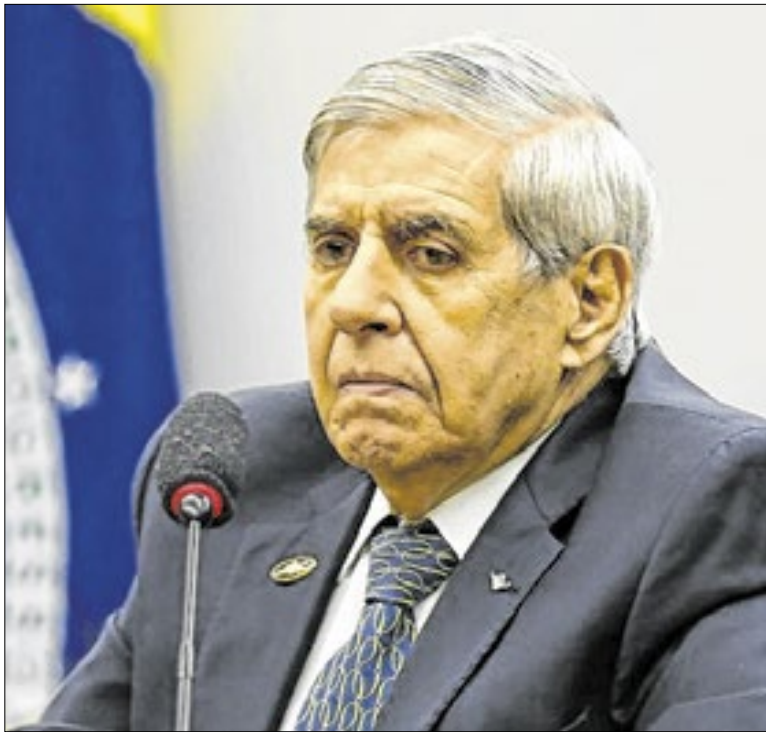
Augusto Heleno tem 78 anos e quadro inicial de demência

O presidente Lula tem até o próximo dia 12 para, como anunciou, vetar o projeto de lei que reduz penas e o prazo de progressão de regime para condenados por golpismo. Ou seja, poderá mesmo fazer isso no dia 8, aniversário da Intenção de 2023, como anunciou o líder do governo no Senado, Jacques Wagner.