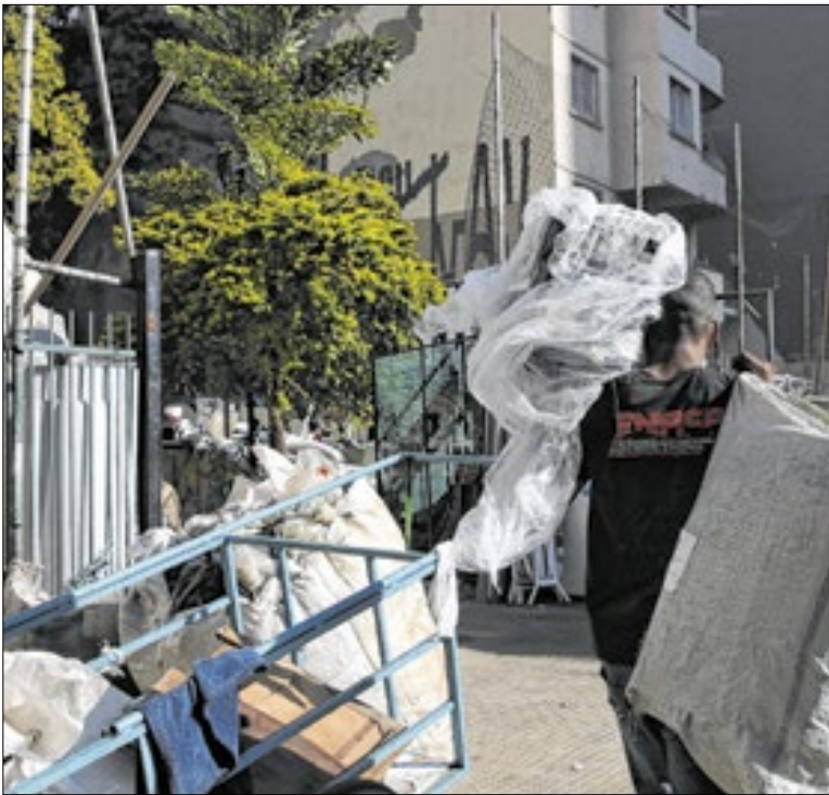
Foram analisadas 20 organizações de catadores

A unidade oferece serviços fundamentais de acolhimento, documentação e inclusão social.