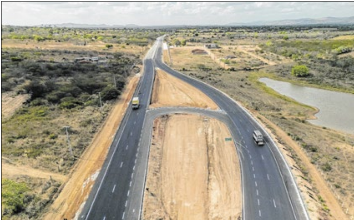
Trecho de 15 quilômetros da duplicação da AL-115

“Nós já temos garantidos para o próximo trecho, de Igaci a Arapiraca, outros R$ 100 milhões. A