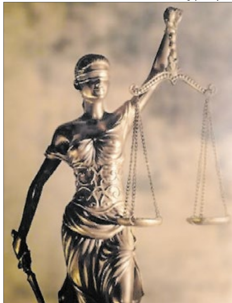
Técnicos do Judiciário com graduação continuam recebendo o adicional