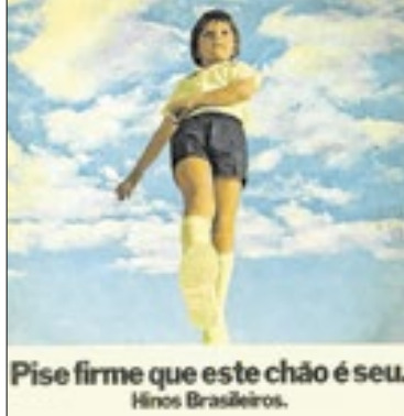
Capa do disco lançado em 1972, no auge da ditadura