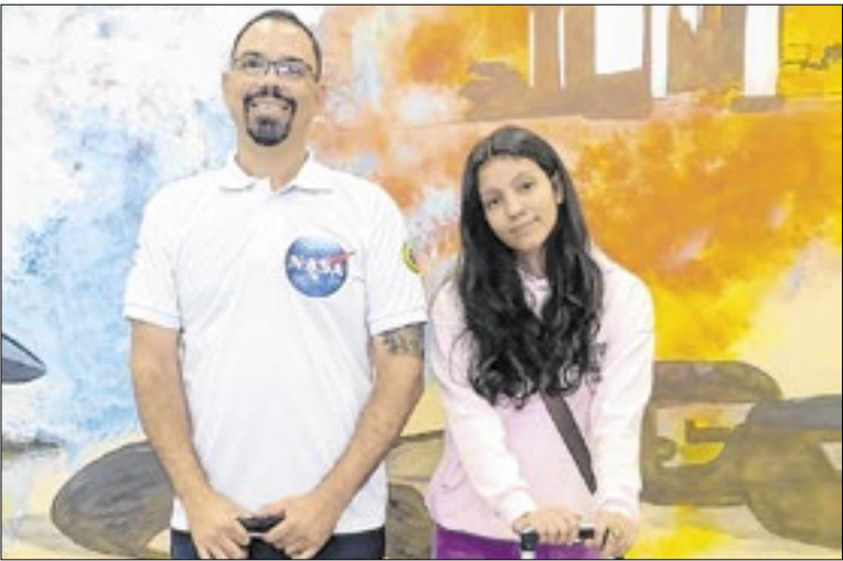
Seleção aconteceu após rigoroso processo internacional