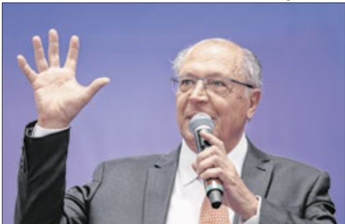
Alckmin destacou vantagens do acordo para o comércio