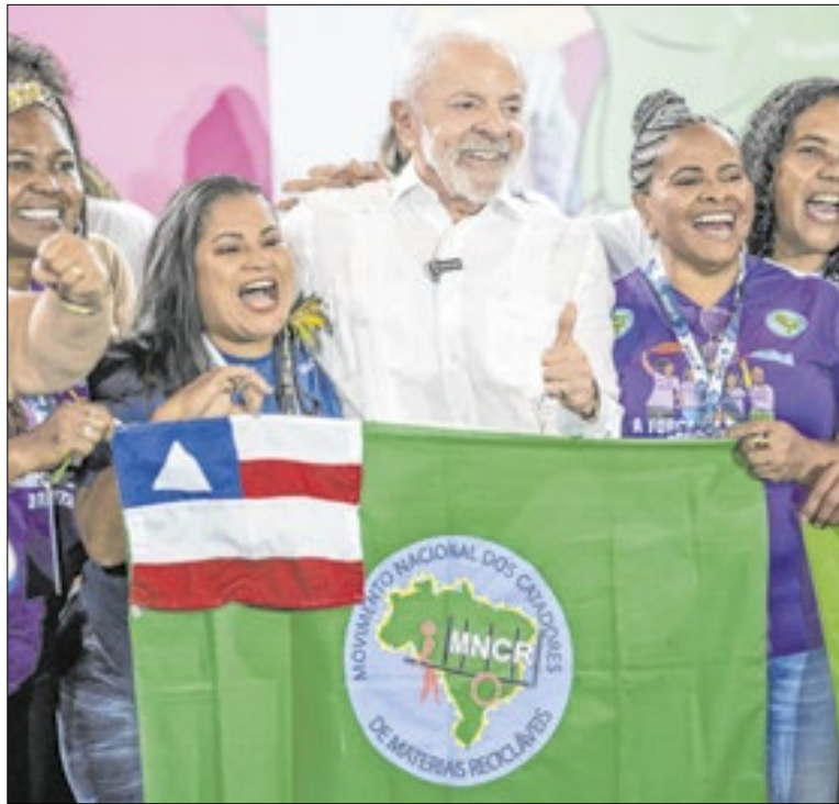
Presidente Lula participa do Natal das catadoras, no Anhembi

Alckmin lembrou que, em 2023, foi firmado o acordo entre Mercosul e Singapura. No segundo semestre deste ano, ocorreu a assinatura com a Associação Europeia de Livre Comércio, que reúne Noruega, Suíça, Liechtenstein e Islândia. Já o entendimento com a União Europeia segue em adiamento temporário.