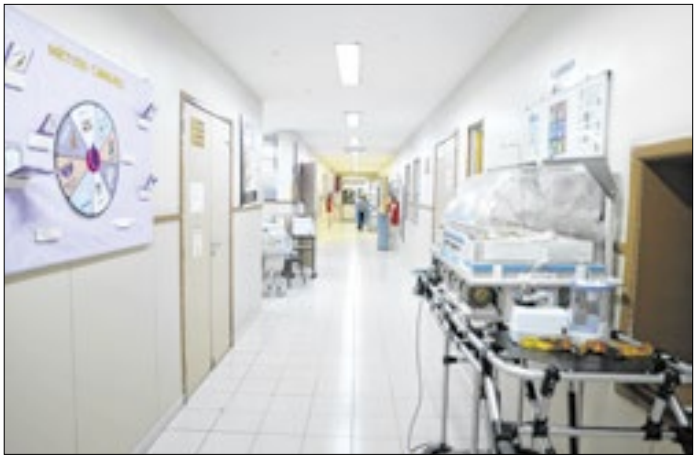
Entre os meninos, Ravi é o mais comum em 2025