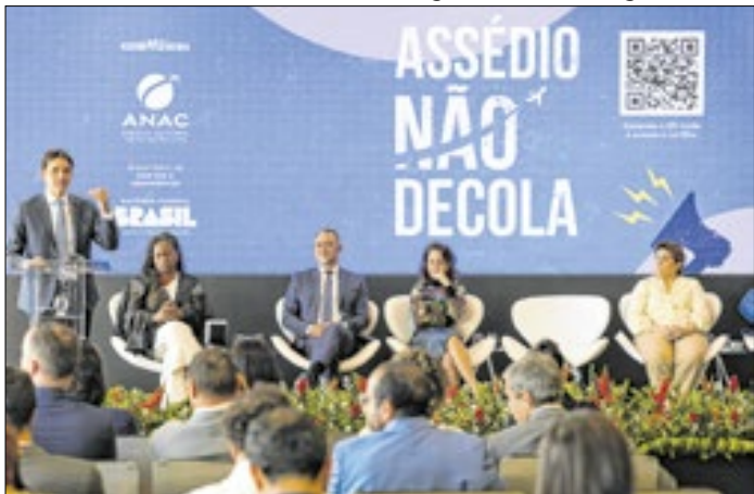
Ação foi lançada pelo Ministério de Portos e Aeroportos