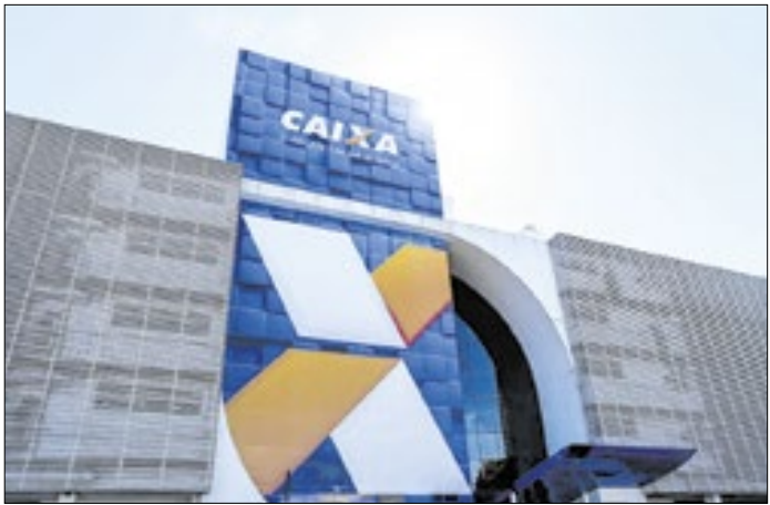
Cada vaga será disputada por, ao menos, 106 candidatos