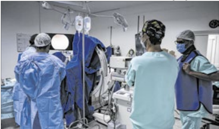
Adultos entre 18 a 39 anos, 7,3% já apresentam hipertensão