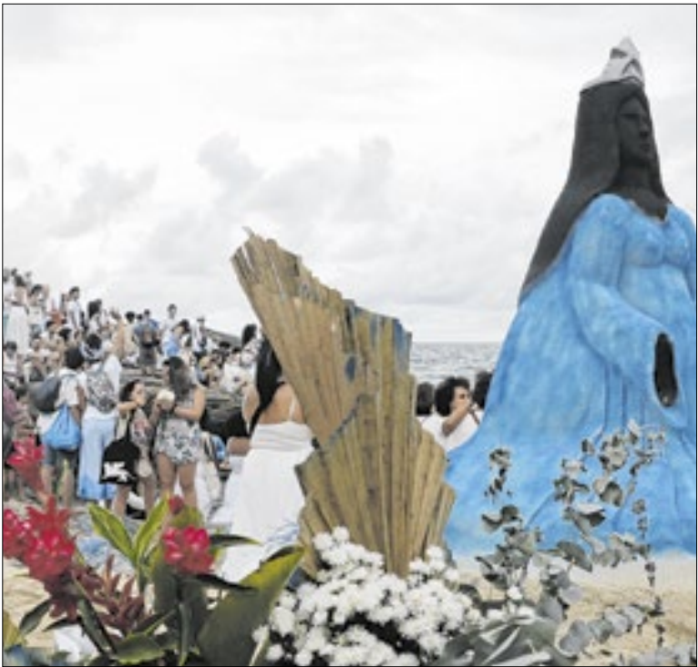
A medida foi aprovada pela Alerj e sancionada pelo governo

O Governo de São Paulo empossou 524 novos delegados de polícia nesta sexta-feira (19), durante cerimônia realizada no Palácio dos Bandeirantes. Com as nomeações feitas, referente ao edital de 2023, o estado passa a contar com cerca de 4,5 mil policiais em formação.