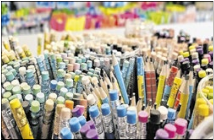
Pesquisa mostra diferenças em papelarias da capital