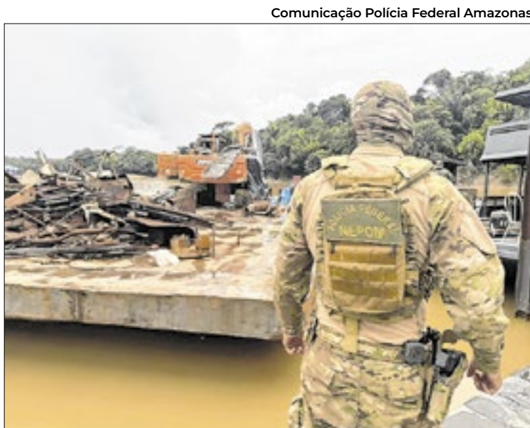
Comunicação Polícia Federal Amazonas

No total, foram apreendidas seis embarcações que já estavam sendo utilizadas ou seriam destinadas ao garimpo ilegal, duas dragas completas, um rebocador novo sem motor e duas balsas/