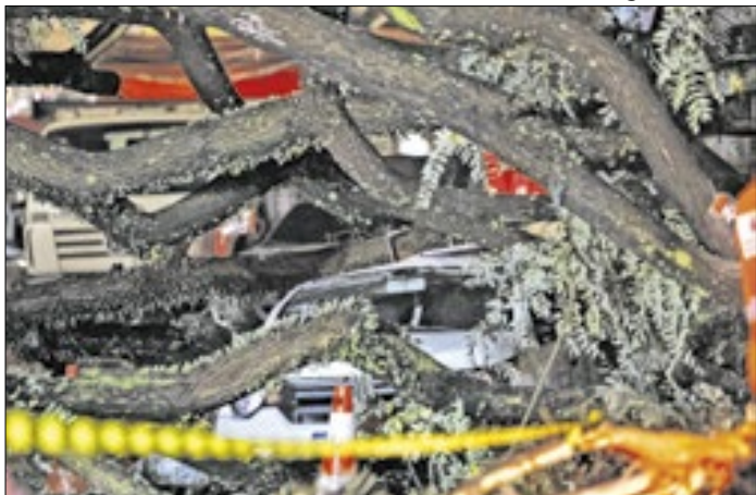
Corpo de homem sumido desde terça foi encontrado