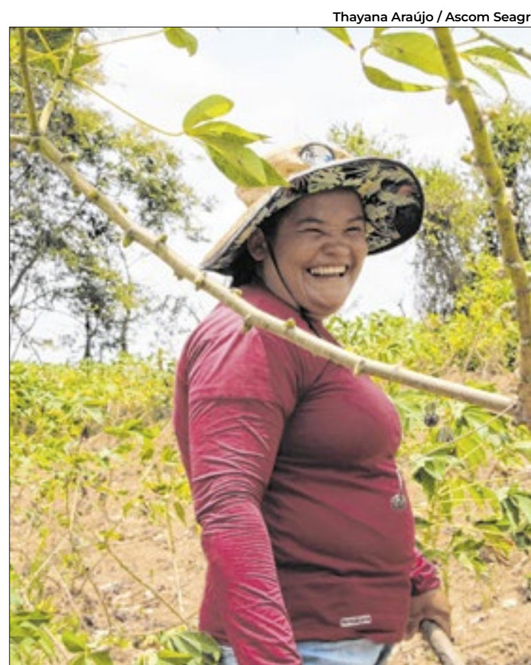
A pesquisa do IBGE mostra que o crescimento dos municípios