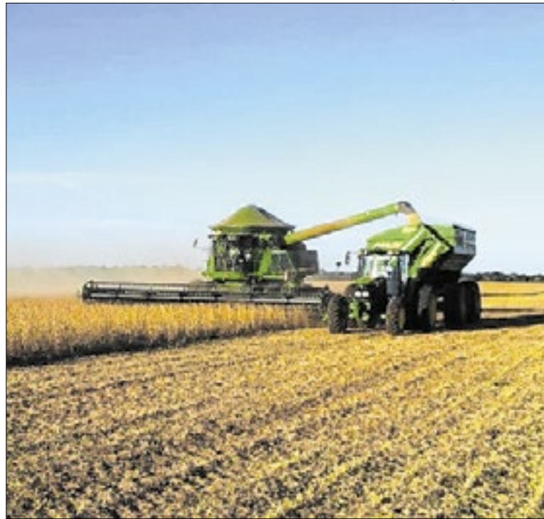
Produção e investimentos ampliam renda no interior

A prefeitura de Dourados (MS) informou que a Feira Central João Totó Câmara terá horário especial antes do Natal e do Ano Novo. Nos dias 23, 24, 30 e 31 deste mês, o local abrirá das 6h às 22h. A Praça de Alimentação da Feira Central funciona de quarta a sexta-feira, das 17h às 22h, e, aos sábados, das 6h às 22h.