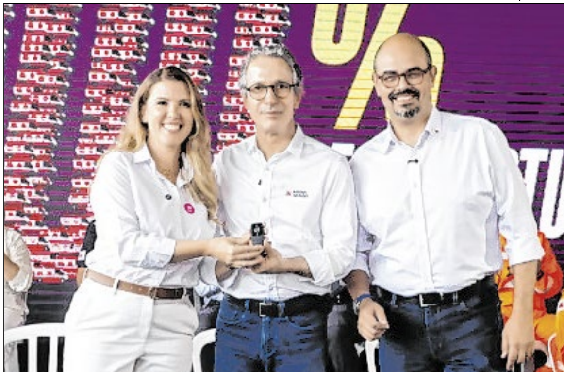
Com a presença do governador, inauguração da Central de Regulação aconteceu em Uberaba

Os 27 municípios da macrorregião Triângulo do Sul, que ainda não tinham cobertura do Samu, serão atendidos pelo serviço a partir do início das operações nas bases, programado para a próxima segunda-feira (22/12).