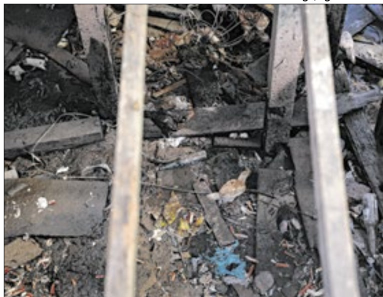
MPF cobra medidas por danos ambientais em Cabo Frio

De acordo com a educadora socioambiental e coordenadora executiva da Coordenação Nacional de Articulação das Comu-