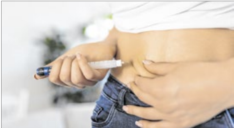
Agência emitu alerta sobre compra e consumo