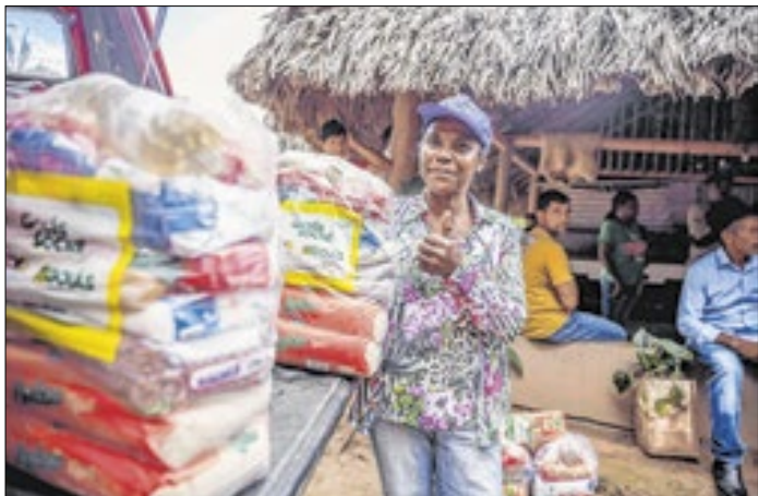
Programa distribuiu cestas e brinquedos neste mês