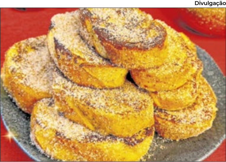
Rabanadas, as estrelas da mesa de Natal

go do ciclo”, analisa Fercher. “Essa assimetria traduz porquê não estamos diante apenas de um Natal mais caro, mas de um período em que o consumidor encontrará comportamentos de preço muito distintos dentro da mesma cesta.”