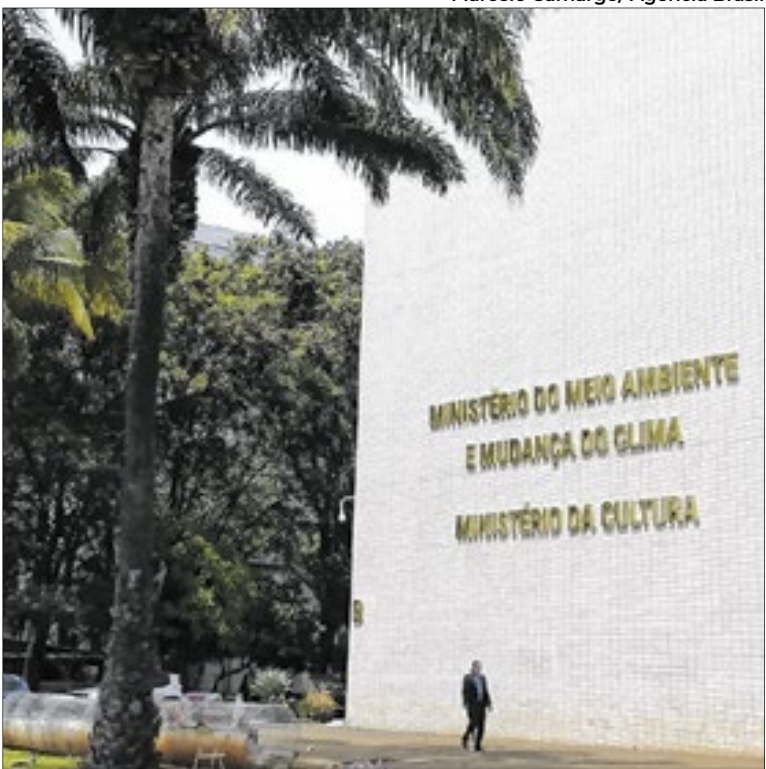
MinC: caos administrativo herdado da gestão anterior

A operação de lançamento, que é coordenada pela FAB, será transmitida ao vivo, pelo canal da empresa sul-coreana Innospace.