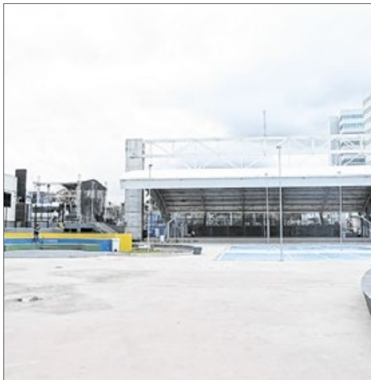
O investimento do Estado foi de R$ 34 milhões

O vice-governador pontuou que a infraestrutura escolar dá suporte ao bom trabalho dos professores da Rede Estadual, que alcança resultados relevantes no país. “Em fevereiro essa escola estará cheia de vida e sonhos.