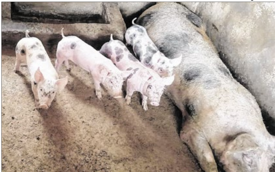
O programa orienta os produtores a priorizar animais com desempenho comprovado

Além da aquisição dos animais, Simone também realizou melhorias estruturais na pro-