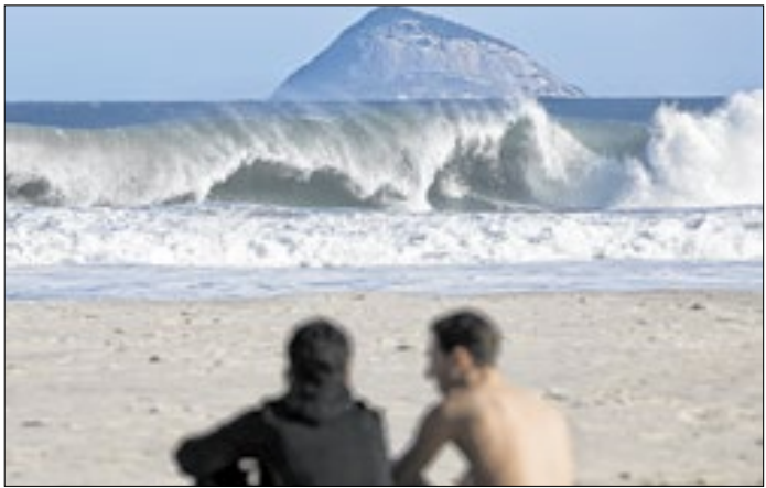
Objetivo é um atendimento rápido e mais eficaz