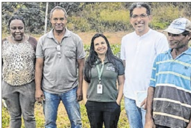
Programas prioritários passaram por avaliação da CGE