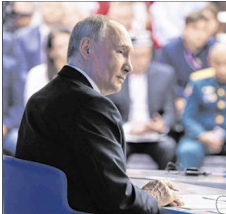
Países europeus, a contragosto, deu razão ao presidente russo

A coalizão vem fazendo ataques aéreos e operações terrestres contra suspeitos do E.I. nos últimos meses, com a participação das forças de segurança sírias. O Ministério do Interior sírio informou que o autor do ataque em Palmira integrava as forças de segurança do país, suspeito de simpatizar com o Estado Islâmico.