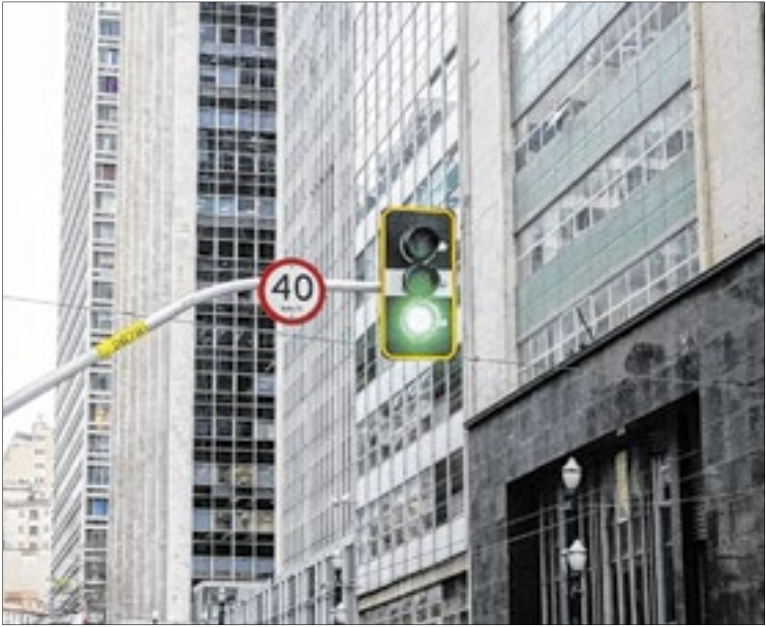
Detran lançou, nesta semana, a página especial CNH Paulista