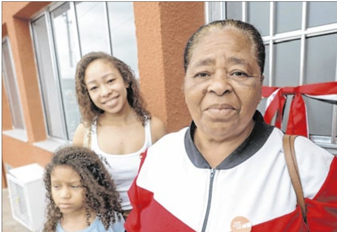
Família contemplada com uma casa no residencial

As unidades habitacionais contam com infraestrutura básica, incluindo rede de água, esgoto, energia elétrica e pavimentação, além de áreas de lazer e espaços comunitários. As casas variam entre 54 m², com dois dormitórios, e 66 m², com três dormitórios, todas proje-