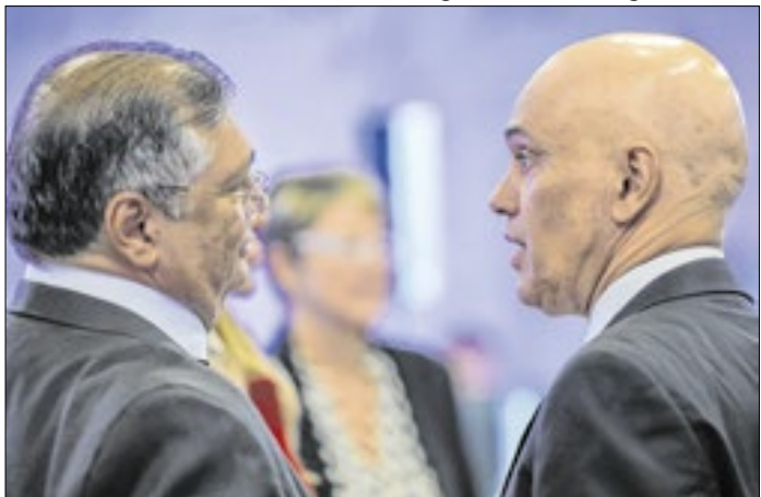
Dino toma o lugar de Moraes como alvo das insatisfações