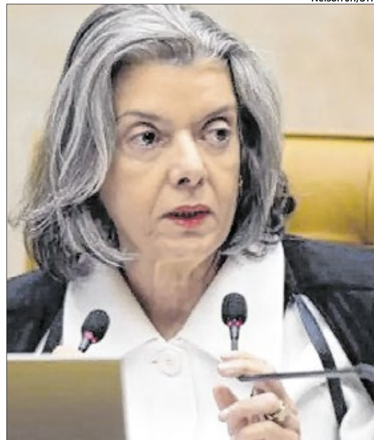
Ministra Cármen Lúcia se manifestou contra benefícios fiscais

Embora aumentem a produtividade no agronegócio, podem trazer riscos sérios à saúde humana, como intoxicações agudas, problemas neurológicos, câncer e danos ao fígado e rins.