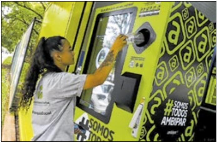
O equipamento funciona como um ecoponto inteligente