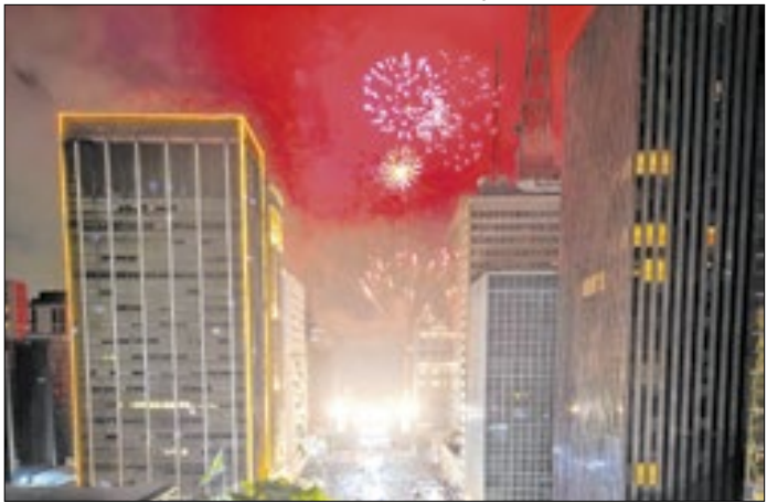
À meia-noite haverá 15 minutos de fogos silenciosos