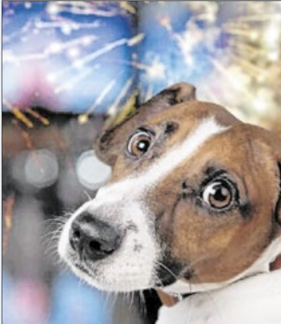
Audição de bicho é mais potente que a humana

Barulho intenso gerado pelos fogos de artifício pode causar estresse agudo, taquicardia, tentativa de fuga e até morte, segundo médico-veterinário