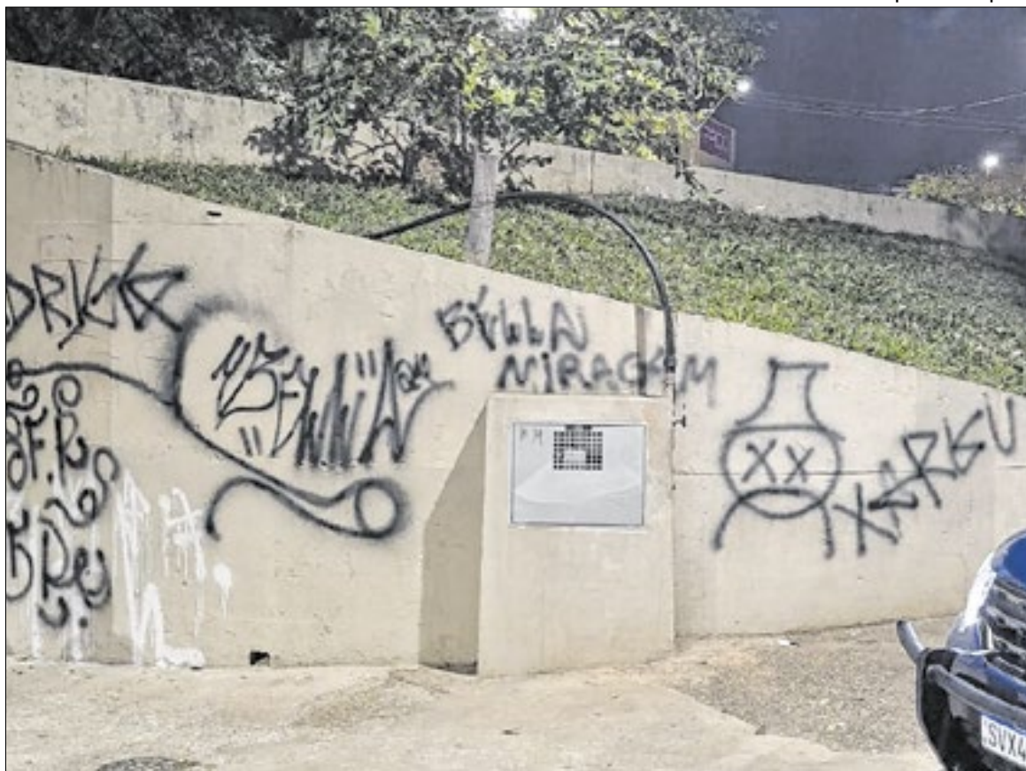
Guarda Municipal de Campinas

Objetivo é ampliar penalidades aplicadas a casos de vandalismo e danos ao patrimônio