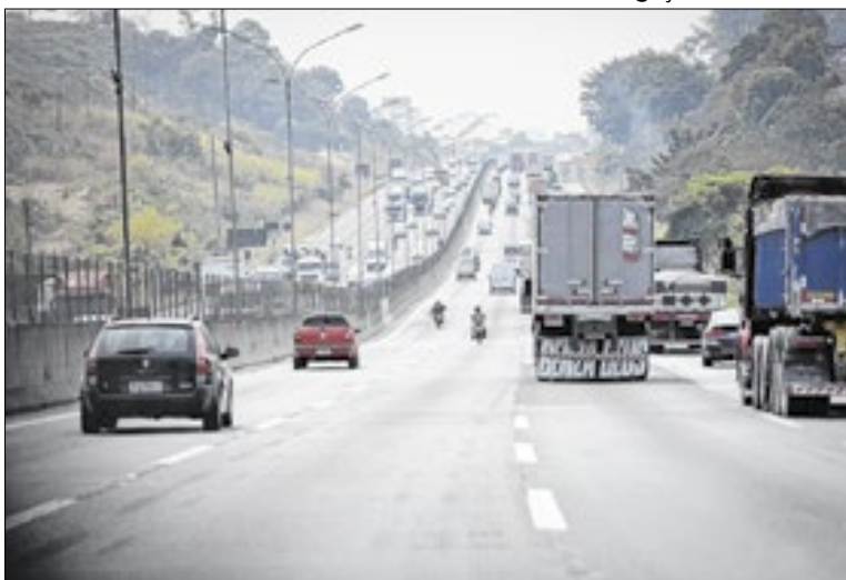
A previsão indica a circulação de mais de 40,5 mi de veículos

Para atender à demanda, será adotado o Planejamento Operacional Especial (POE), com operação plena das equipes de atendimento, pedágios e centros de controle, podendo haver reforço conforme necessidade. No Sistema Anchieta-Imigrantes, haverá guinchos adicionais e esquemas de reversão de pistas na Serra, enquanto a Tamoios seguirá com duas faixas em cada sentido. Trechos como SP-055 e SP-098 também podem ter operações especiais. Os corredores com maior fluxo incluem AutoBan (mais de