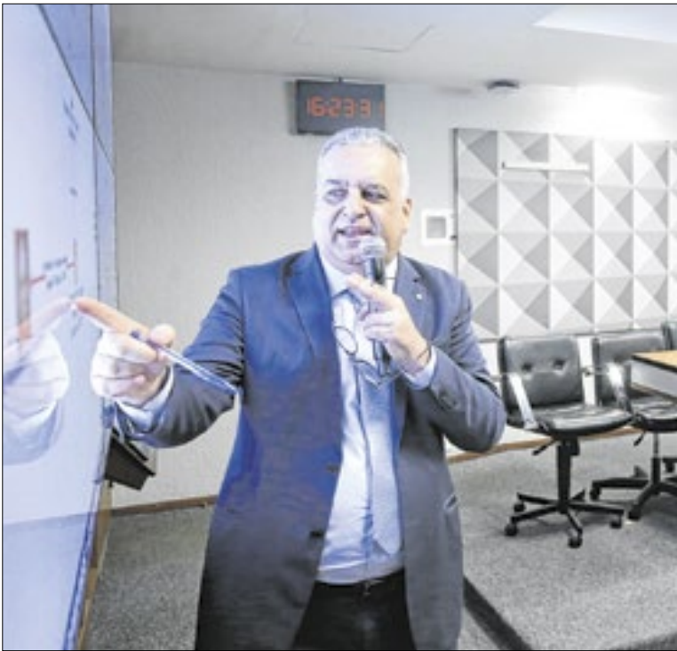
Gaspar: nova tentativa de ouvir filho do presidente na CPMI