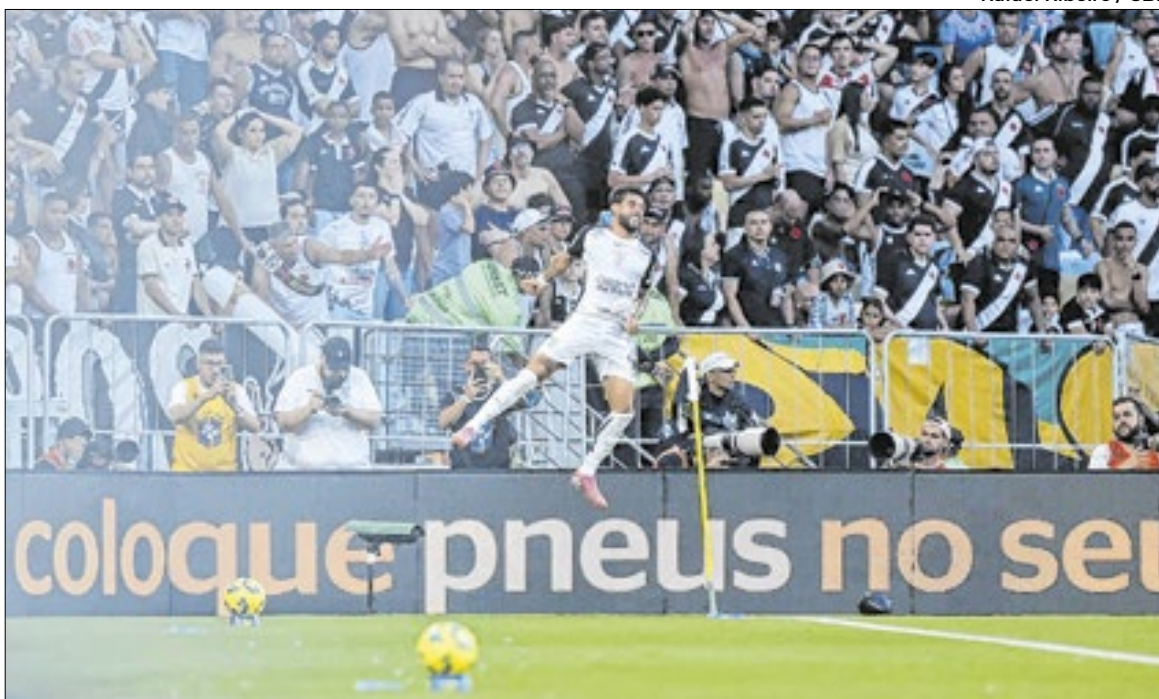
Corinthians fatura um título que não conquistava desde 2009