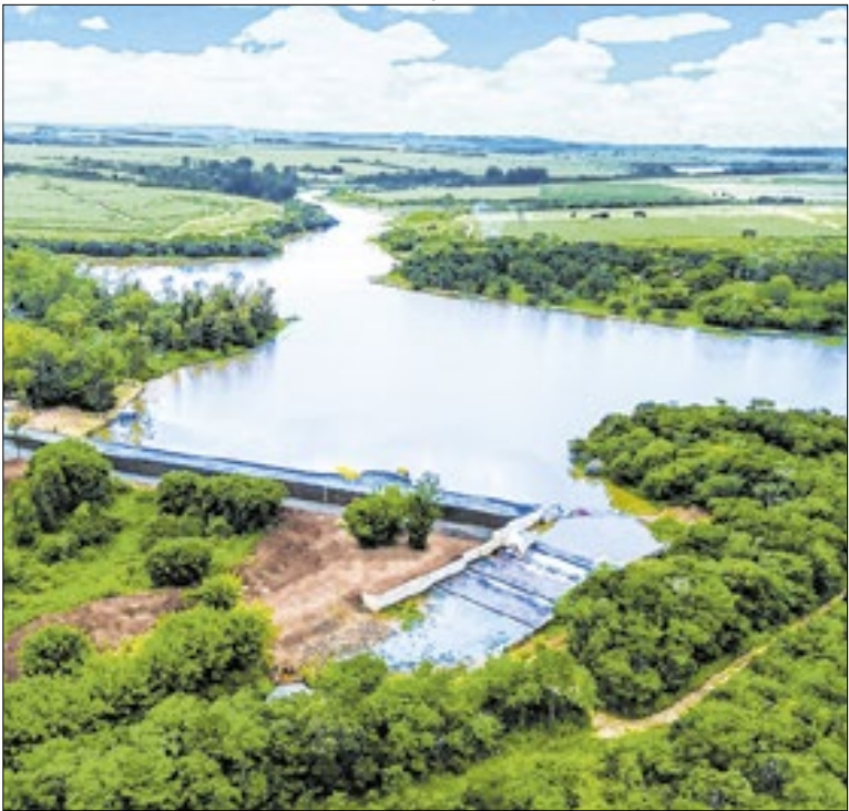
Obra garante abastecimento por até 50 anos no município