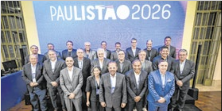
Conselho divulgou as datas do Campeonato Paulista de 2026