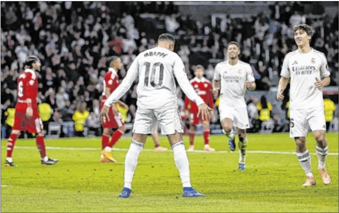
Mbappé já marcou 59 gols pelo Real em 2025