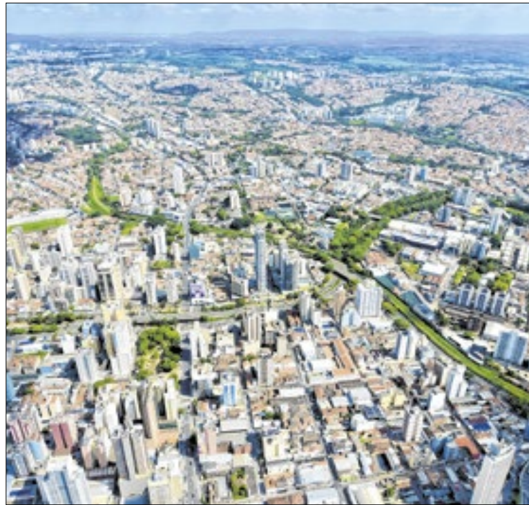
Imagem aérea com destaque para a avenida Aquidabã

Valorizar quem transforma o dia a dia no trânsito, com destaque na condução segura e qualidade do serviço prestado à população, é o foco da premiação da categoria “Motorista Nota 10”, do “Prêmio Boas Práticas”, que teve cerimônia de entrega realizada esta semana na sede do SestSenat Campinas, nos Amaraís.