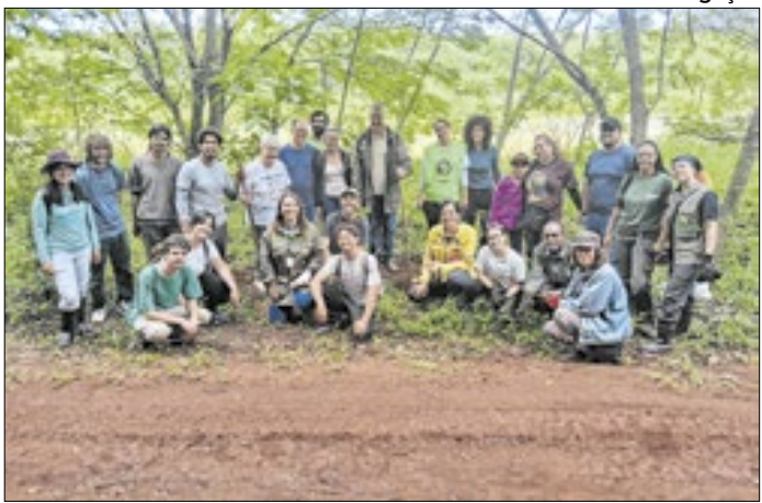
Voluntários realizam plantio de 800 mudas de espécies