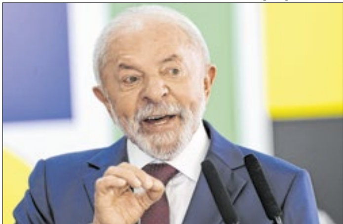
Lula teme indícios de participação do filho no caso INSS