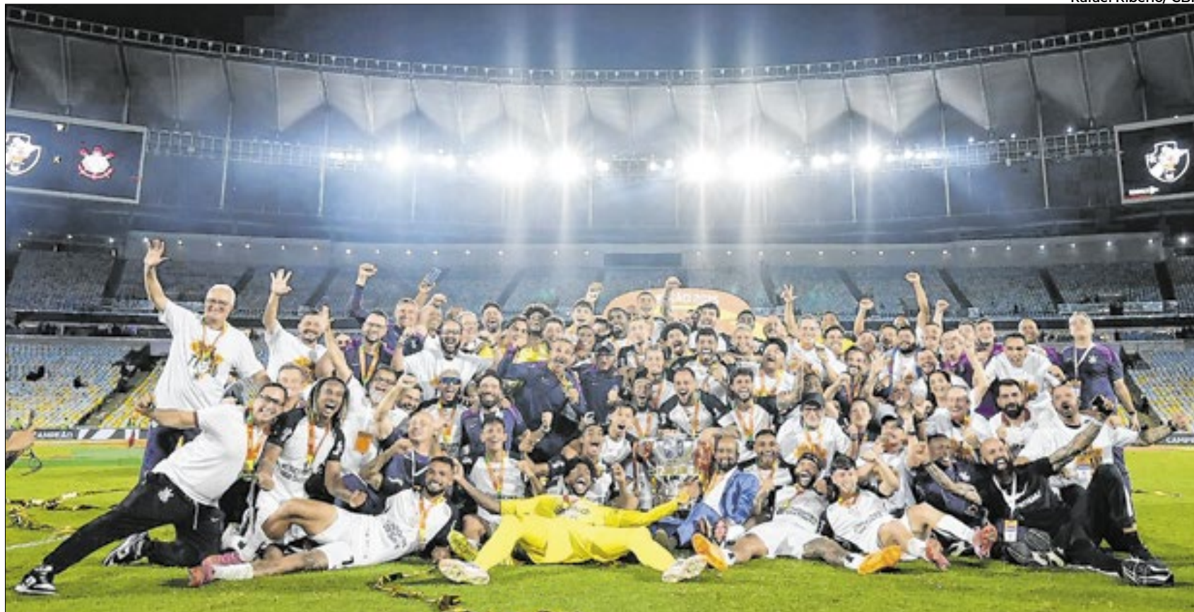
Corinthians repete o feito como em 2000 e ganha do Vasco em pleno Maracanã