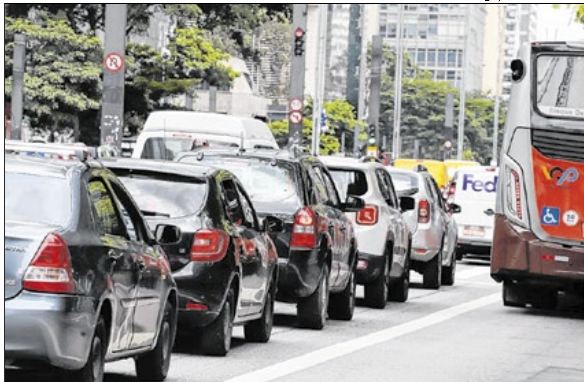
A frota total no estado de São Paulo é de aproximadamente 30,1 milhões de veículos

O calendário completo de vencimento do IPVA 2026 está disponível no portal da Sefaz-SP, permitindo que os contribuintes planejem a quitação do imposto de acordo com o final da placa do veículo e o tipo de pagamento escolhido.