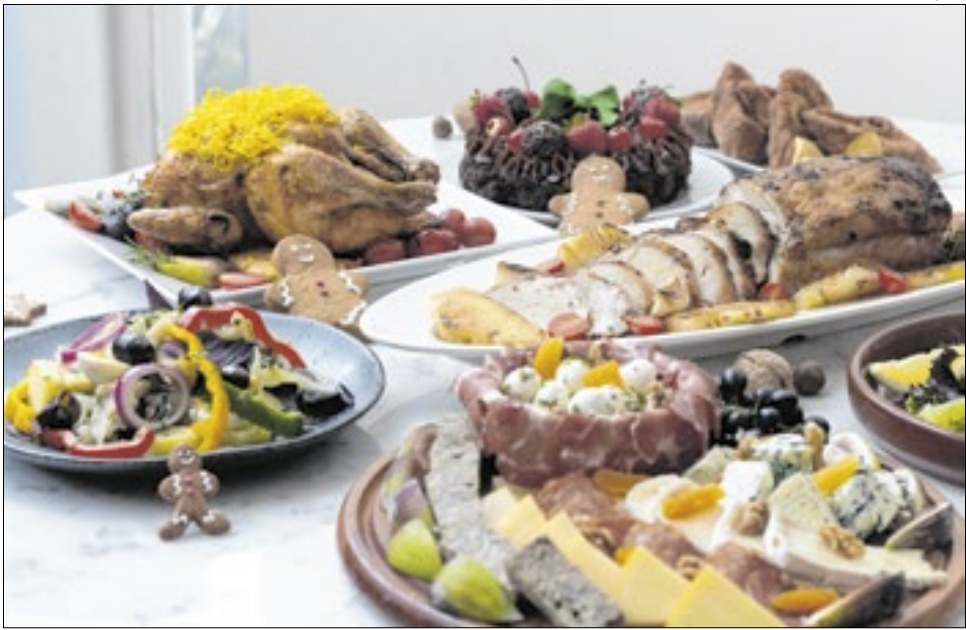
Moderação e equilíbrio são os pilares para as festas de fim de ano

Segundo a nutricionista, o pão de rabanada pode ser substituído pelo francês,