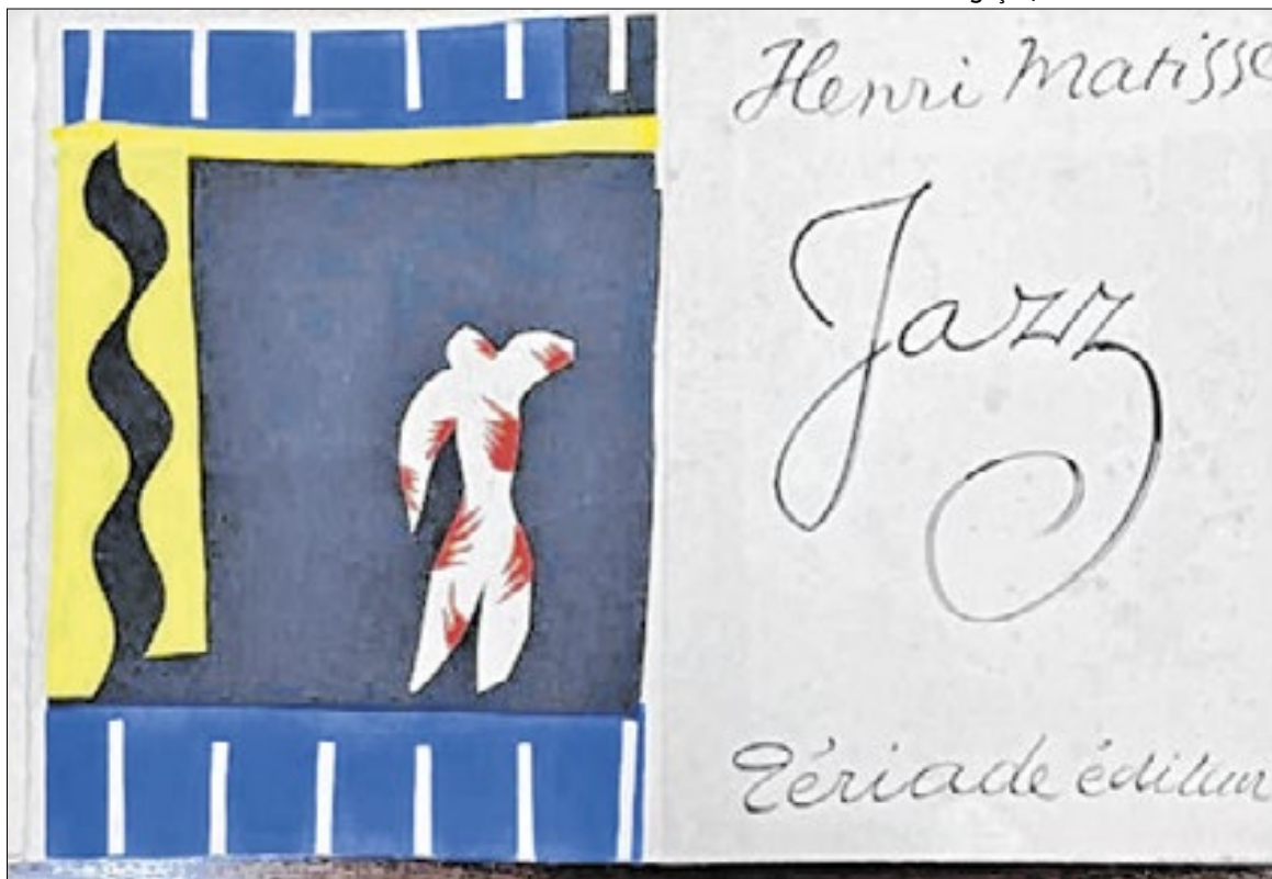
Uma das obras de Matisse roubada da Biblioteca Mário de Andrade, em São Paulo

A Interpol possui um aplicativo e um banco de dados global para