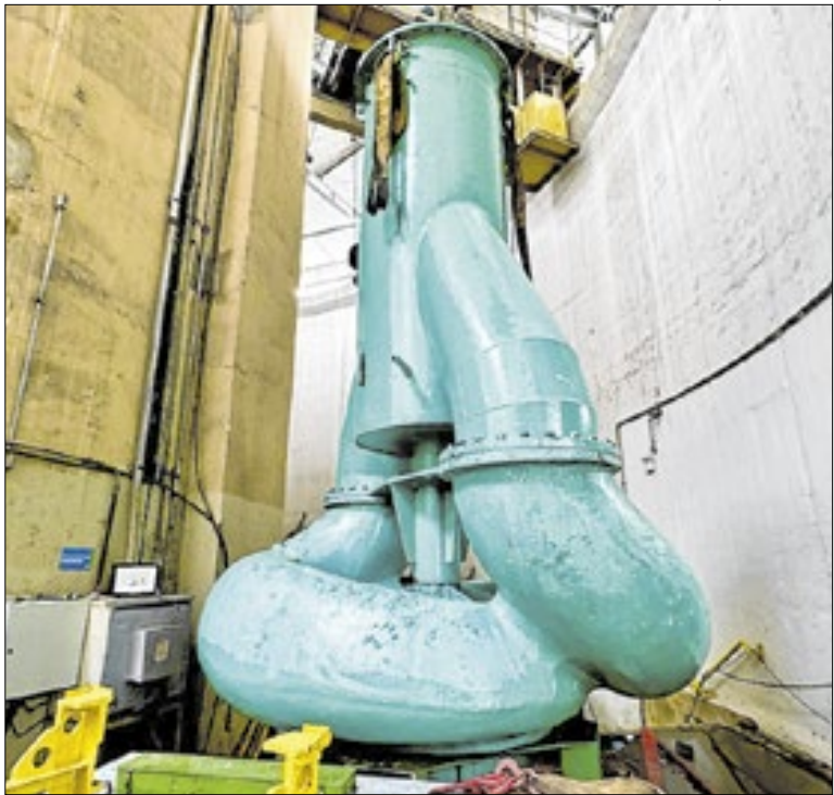
Equipamento tem 13 metros de altura e 15 toneladas