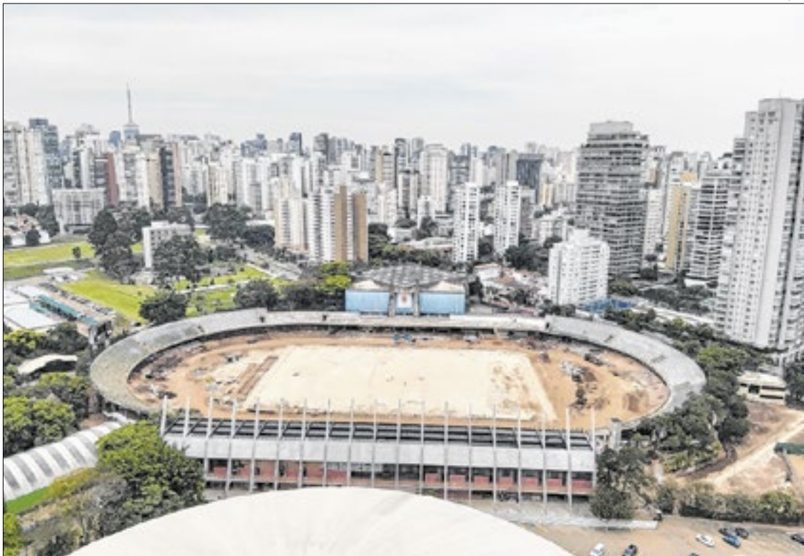
A modernização abrange pista, banheiros, arquibancadas e canteiros

O projeto de modernização inclui a reforma da pista de atletismo, arquibancadas, banheiros, canteiros e vestiários, além de áreas de apoio aos atletas. Serão instalados dois telões, novos guarda-corpos, sanitários acessíveis e uma plataforma destinada a pessoas com deficiência, ampliando a acessibilidade do espaço. A capacidade do estádio será de mais de 11 mil espectadores, e a pista contará com a construção de uma 9ª raia e uma área exclusiva para aquecimento. Além disso, a reforma prevê a recuperação da estrutura histórica em concreto, preservando os elementos tombados pelo Instituto do Patrimônio Histórico e Artístico Nacional (Iphan).