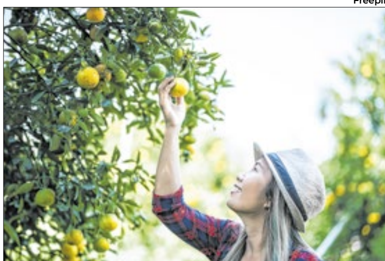
Brasil: maior produtor e exportador mundial de suco de laranja

O trabalho identificou que o patógeno “hackeia” a planta,