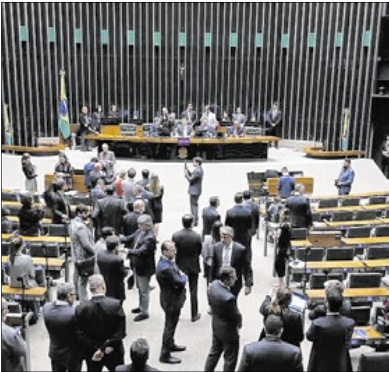
Alvo de polêmicas, emendas serão ainda maiores em 2026