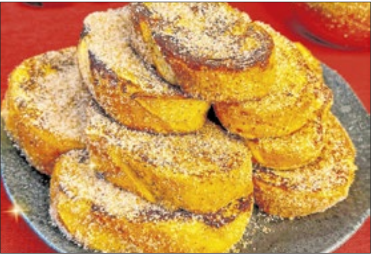
Rabanadas, as estrelas da mesa de Natal

go do ciclo”, analisa Fercher. “Essa assimetria traduz porquê não estamos diante apenas de um Natal mais caro, mas de um período em que o consumidor encontrará comportamentos de preço muito distintos dentro da mesma cesta.”