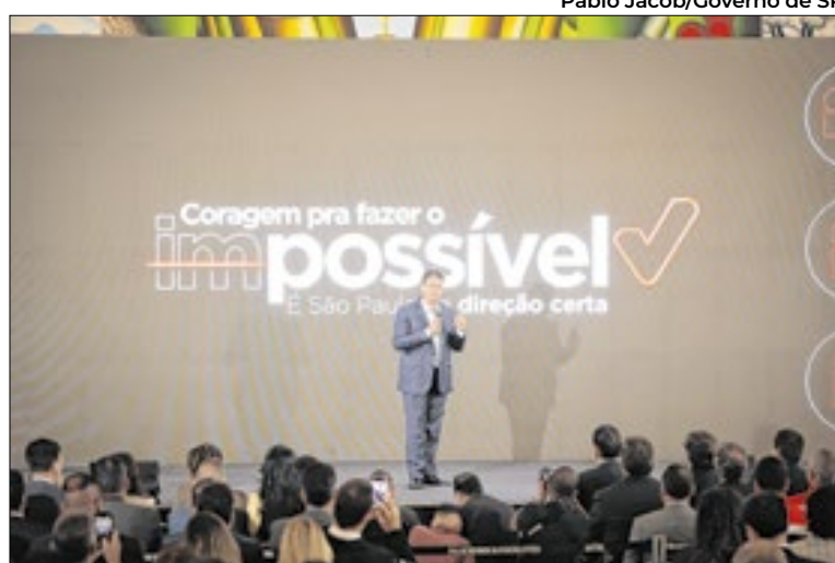
Segundo o governo, ações refletem na geração de empregos

do setor privado. O impacto desses investimentos é observado no crescimento econômico do estado. Dados da Fundação Seade indicam que o Produto Interno Bruto (PIB) paulista avançou 1,4% nos nove primeiros meses de 2025, com destaque para o setor de Serviços, que cresceu 2,7%. O superávit da balança comercial do agronegócio também contribuiu para os resultados. O mercado de trabalho apresenta números recordes: nos dez primeiros meses de 2025, foram geradas mais de 500 mil vagas formais, quase 30% do total nacional. A taxa de desemprego chegou a 5,1%, a menor desde 2012, com 24,3 milhões de pessoas ocupadas. Iniciativas como a plataforma Trampolim e os Postos de Atendimento ao Trabalhador (PATs) ofereceram cerca de 350 mil vagas,