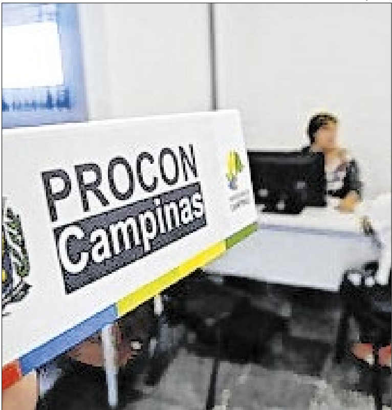
Processo seletivo é realizado integralmente pela internet

Tanto o edital, quanto o link de inscrição estão disponíveis em: https://pp.ciee.org.br/vitrine/13768/detalhe