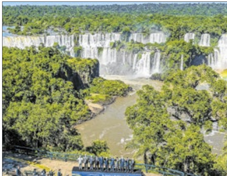
Divergência sobre a Venezuela marcou a Cúpula do Mercosul

O presidente brasileiro também cobrou coragem e vontade política dos líderes europeus depois de dizer