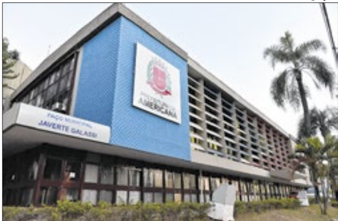
superou em 56,3% a expectativa