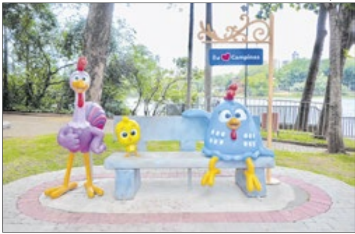
Galinha Pintadinha: restaurada após vandalismo