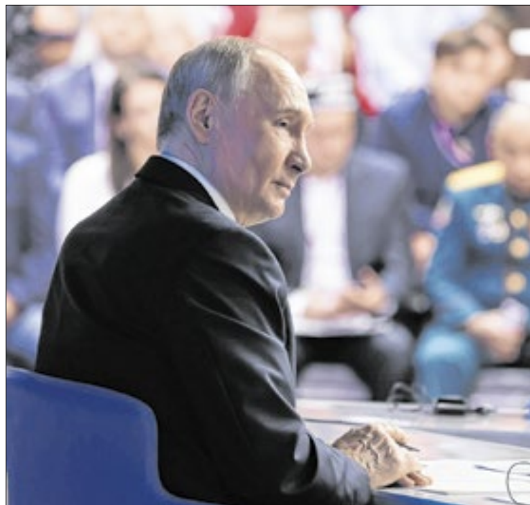
Países europeus, a contragosto, deu razão ao presidente russo

A coalizão vem fazendo ataques aéreos e operações terrestres contra suspeitos do E.I. nos últimos meses, com a participação das forças de segurança sírias. O Ministério do Interior sírio informou que o autor do ataque em Palmira integrava as forças de segurança do país, suspeito de simpatizar com o Estado Islâmico.