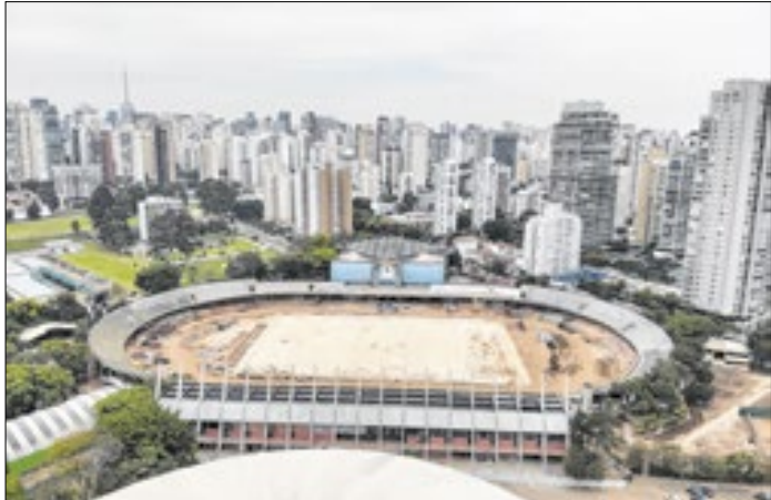
Modernização abrange pista, banheiros e outras partes

Secretaria de Desenvolvimento Urbano e Habitação