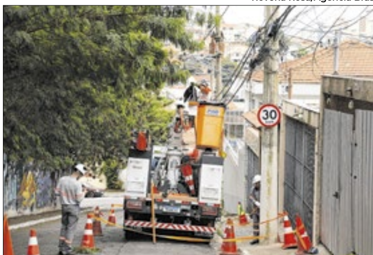
Executivo quer que o procedimento seja mantido sem sigilo

No pedido, a Prefeitura solicita que a Aneel antecipe a conclusão da análise sobre a caducidade, indicando o menor prazo possível para a deliberação final, e esclareça se ainda considera a prorrogação ante-