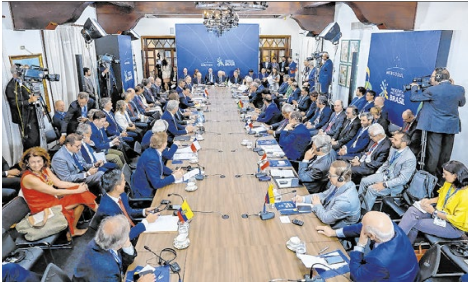
Presidentes e Chefes de Delegação dos Estados do Mercosul e dos Estados Associados se reuniram no Mirante das Cataratas