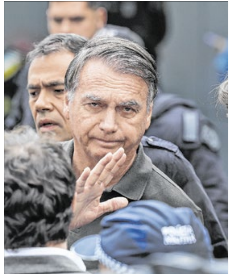
Bolsonaro precisa realizar cirurgia para corrigir duas hérnias