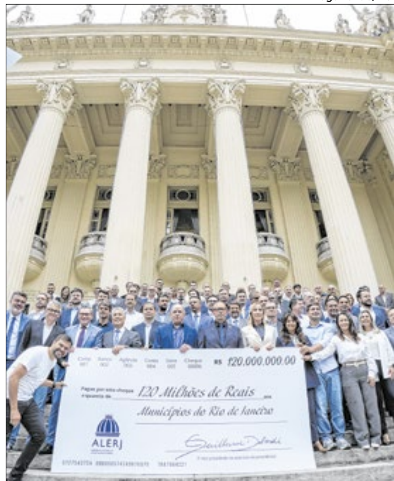
Entrega simbólica do cheque aconteceu no Palácio Tiradentes