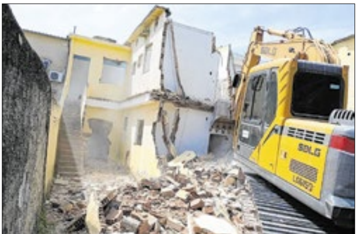
Obras no canal visam melhorar a qualidade de vida