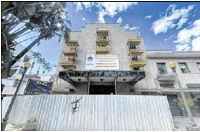
Local esta fechado desde 2019 para obras