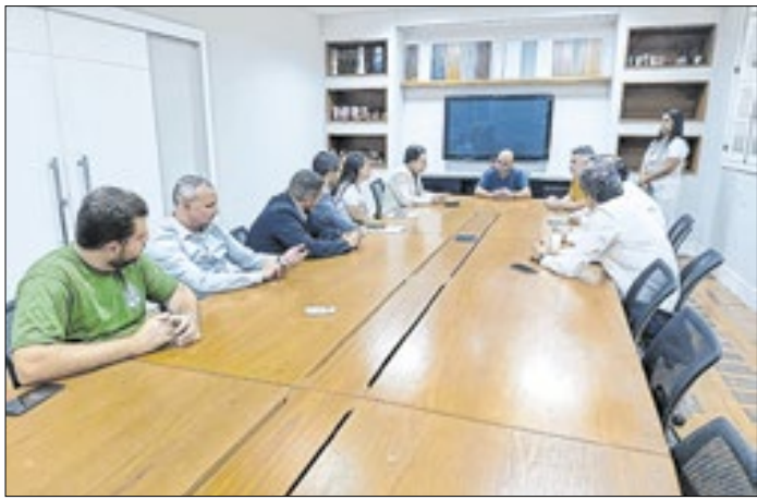
Reunião com o diretor da Faculdade Suprema