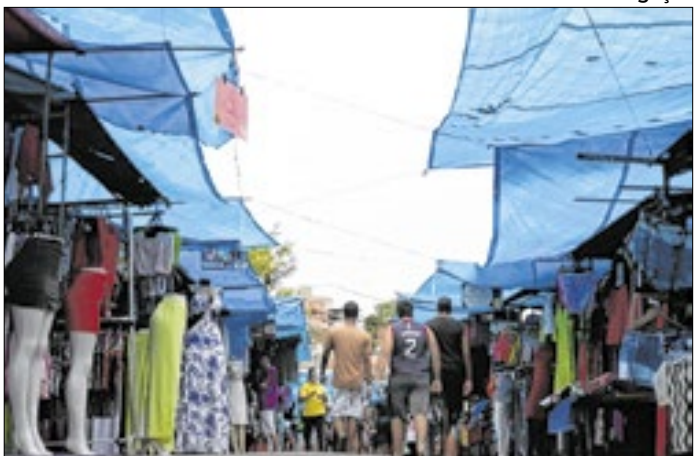
Mais de 300 barracas funcionarão com horário estendido