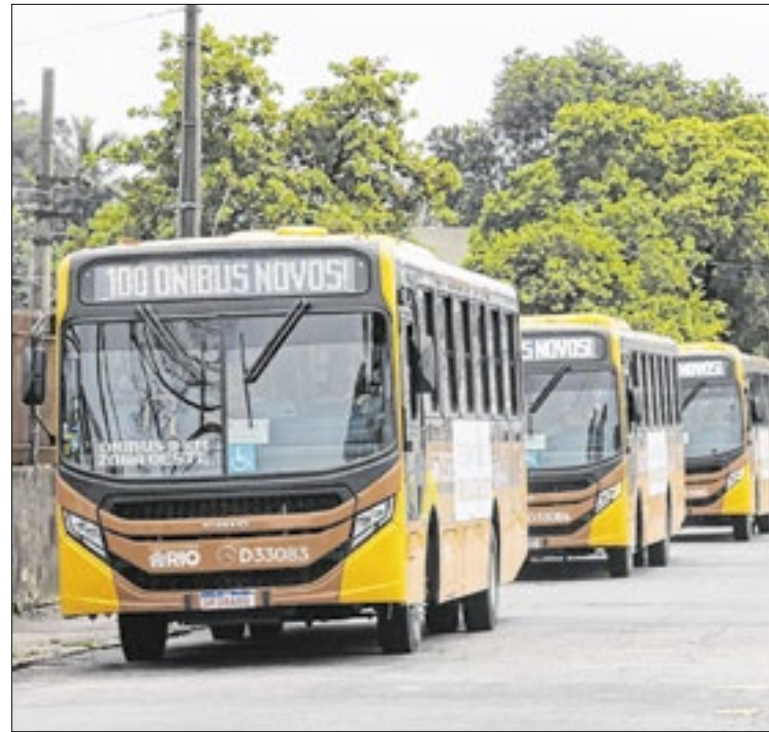
Frota de ônibus apresentada pela Prefeitura na Zona Oeste

O Estado do Rio terá campanha sobre alergia alimentar em pets, com ações educativas para orientar tutores sobre causas, sintomas, prevenção e tratamento. A lei de autoria do deputado Fred Pacheco (PMN) e foi publicada no Diário Oficial. A iniciativa prevê materiais em unidades de saúde, pet shops e UPA Veterinária.