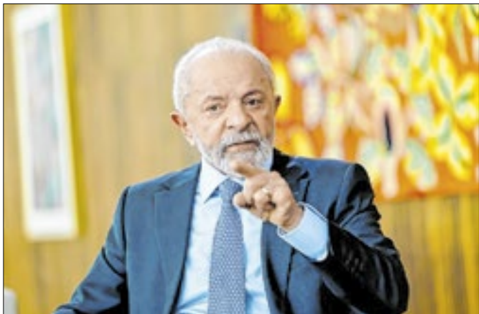
Lula teme indícios de participação do filho no caso INSS