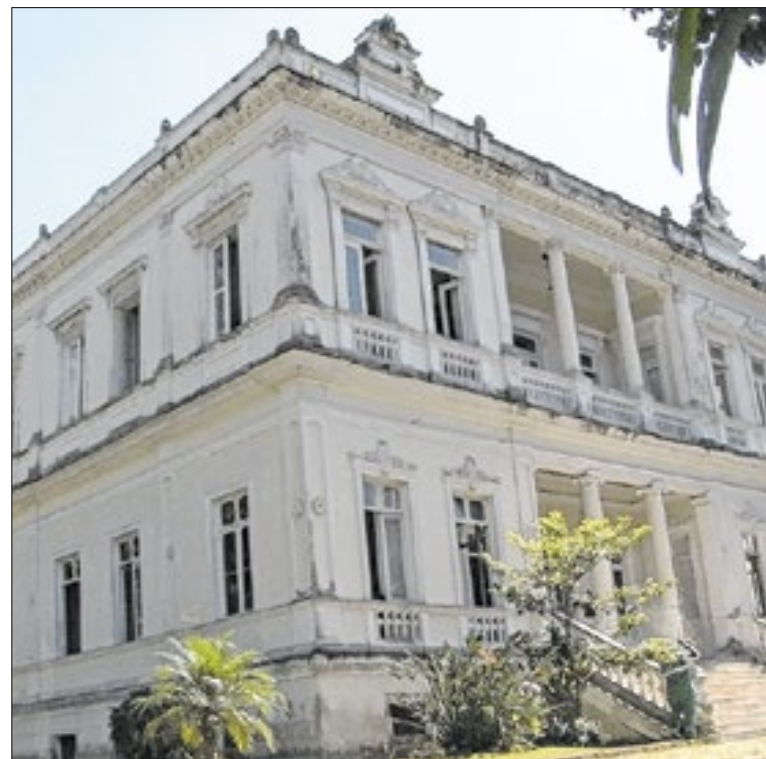
Espaço apresenta procedimentos específicos para emissão

O site reúne ainda informações sobre perfis de contribuintes, inclusive Microempreendedores Individuais, e explica como funcionará o acesso ao emissor nacional, o uso do GOV.BR e as orientações técnicas necessárias. A página de orientação sobre a Nota Fiscal de Serviços Eletrônica Nacional em Petrópolis está disponível no portal da Prefeitura e pode ser acessada pelo link: www.petropolis.rj.gov.br/pmp/index.php/guia-de-migracao-para-a-nfs-e-nacional-em-petropolis .