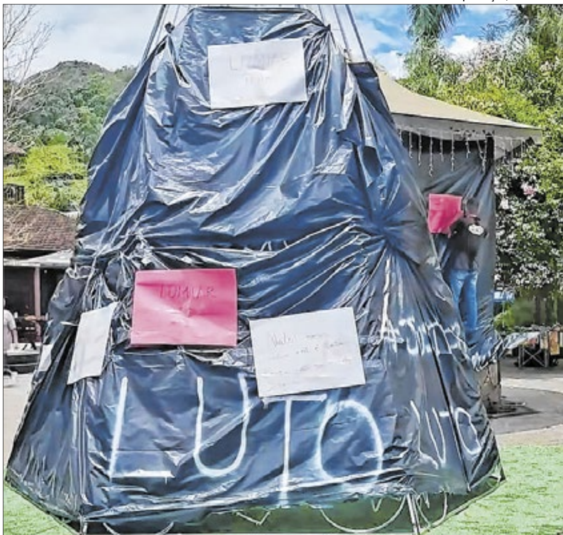
A população, em forma de protesto, cobriu os enfeites de Natal expostos em Lumiar