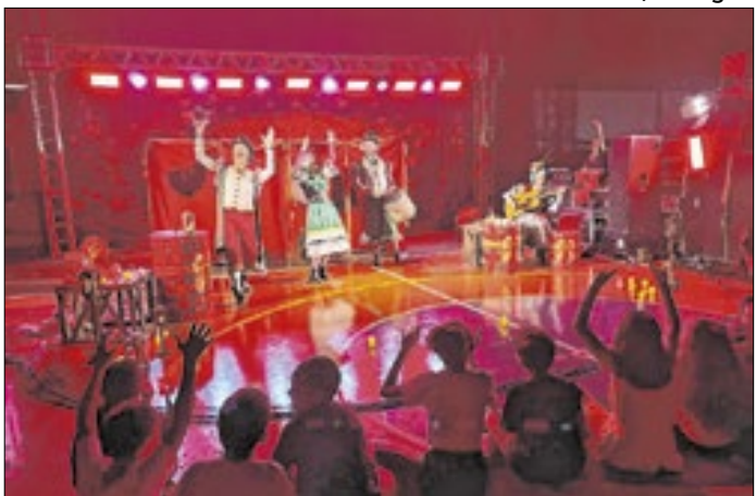
Ação fez parte da programação oficial do Encanto de Natal