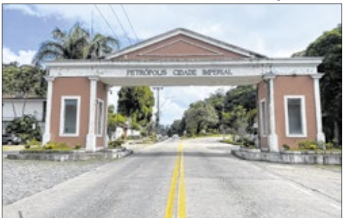
Chuva será abaixo da média para esse ano