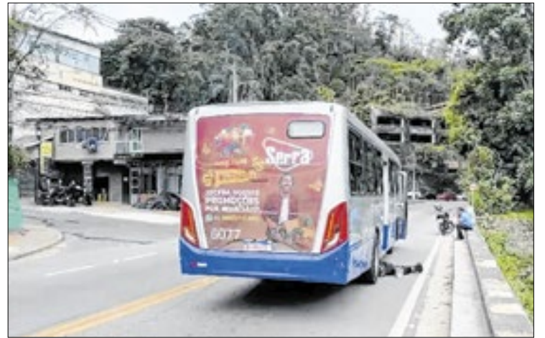
Empresa diz que pagamento de outubro está atrasado

Segundo a Prefeitura de Petrópolis, o edital contempla diversas áreas de expressão artística e tem o objetivo de fortalecer o setor cultural do município, incentivando a criação, a diversidade e a inovação. Podem participar pessoas físicas e jurídicas, incluindo artistas independentes, produtores culturais e coletivos.