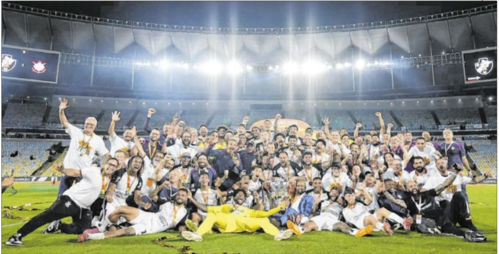
Corinthians repete o feito como em 2000 e ganha do Vasco em pleno Maracanã