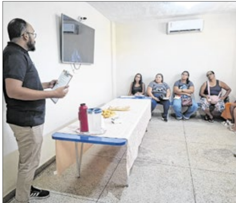
Formação reforçou escuta qualificada e cuidado humanizado

Valorizando talentos da cidade, o evento ainda terá apresentações da Banda Modo On e do DJ Cabelin No Beat, reforçando o compromisso com a cultura local para todos os públicos. Tradicional ponto de encontro na virada do ano, a Praia do Anil mais uma vez será palco do grande encontro entre moradores e turistas.