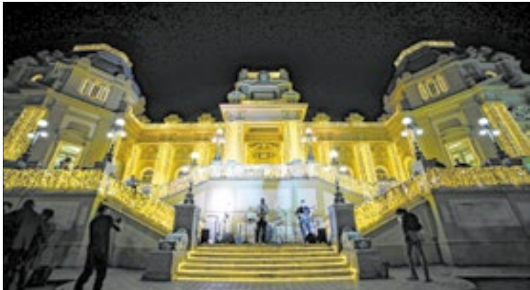
Iluminação do Palácio Guanabara em dezembro