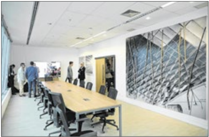
Nova sede foi projetada para a criação de novos negócios