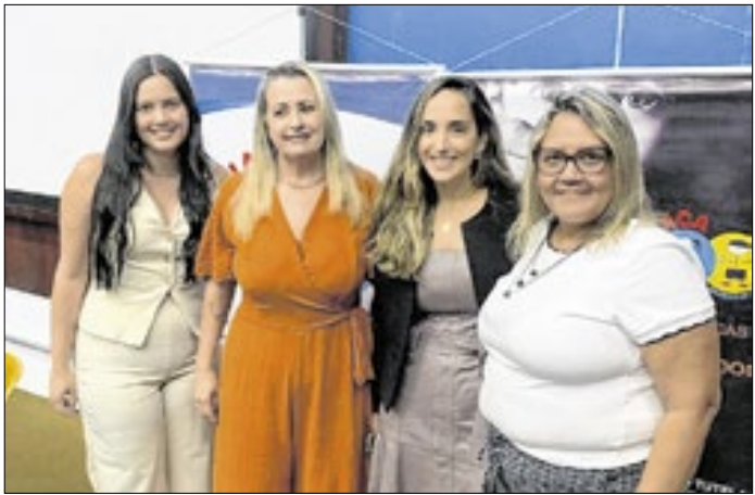
Equipe de Búzios no seminário na UERJ