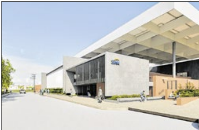
Futura sede do Sesc Volta Redonda