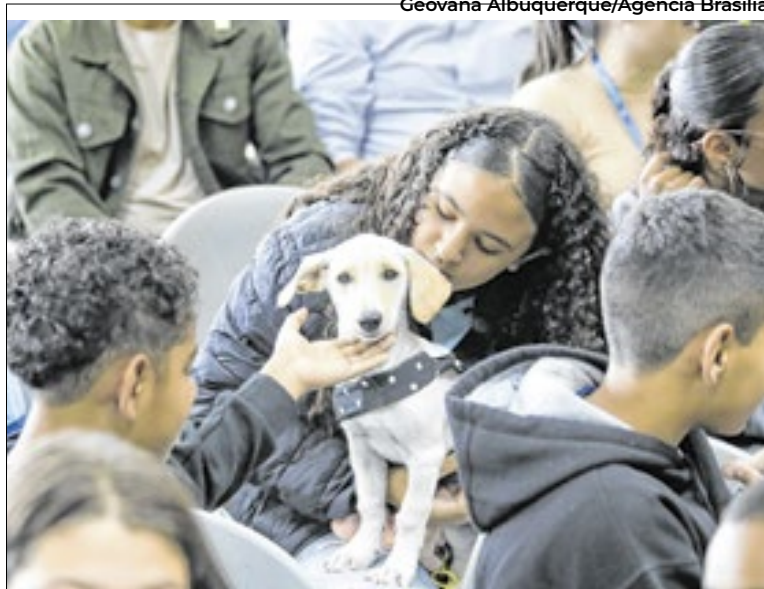
Geovana Albuquerque/Agência Brasília

Para agendar as cirurgias, é preciso apresentar RG, CPF e comprovante de residência do tutor do animal. As castrações serão feitas na sede da Superintendência de Bem-Estar Animal, localizada na Rua Juiz Orlando Caldellas, nº 42, no Parque das Palmeiras. Animais que estejam em um lar temporário também poderão ser castrados.