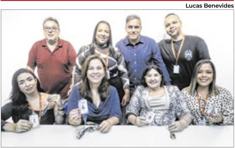
Iniciativa garante identificação e prioridade no atendimento