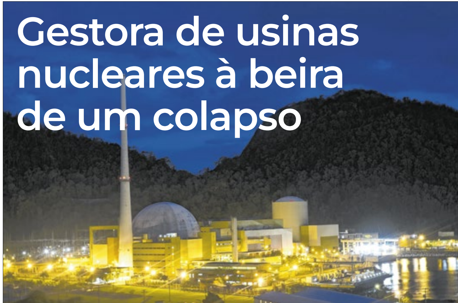
Complexo nuclear em Angra dos Reis, na Costa Verde, tem obras inacabadas e pode virar um mausoléu