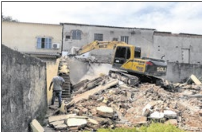
Obras visam melhorar a mobilidade no 2º Distrito