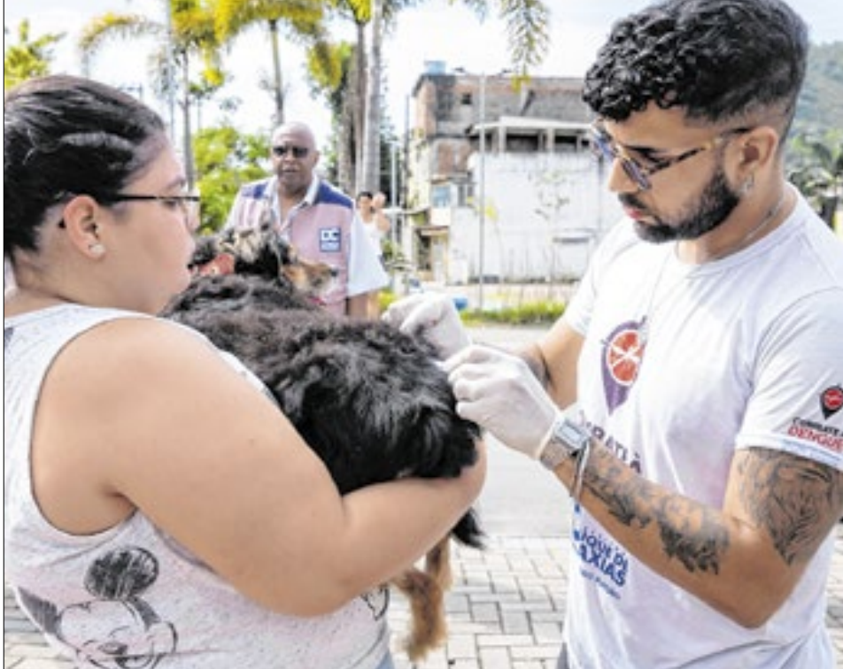
Dentre os avanços do município de Duque de Caxias, a campanha de vacinação antirrábica foi um dos maiores sucessos

Além da promoção de mais de 50 mutirões de conscientização e de combate ao mosquito transmissor da Dengue, Zika e Chikungunya, a SVAVZ realizou diversas outras ações voltadas para garantir o controle de vetores e zoonoses, entre elas: utilização de veículos fumacê (carros e motos), percorrendo mais 360 mil quilômetros de vias muni-