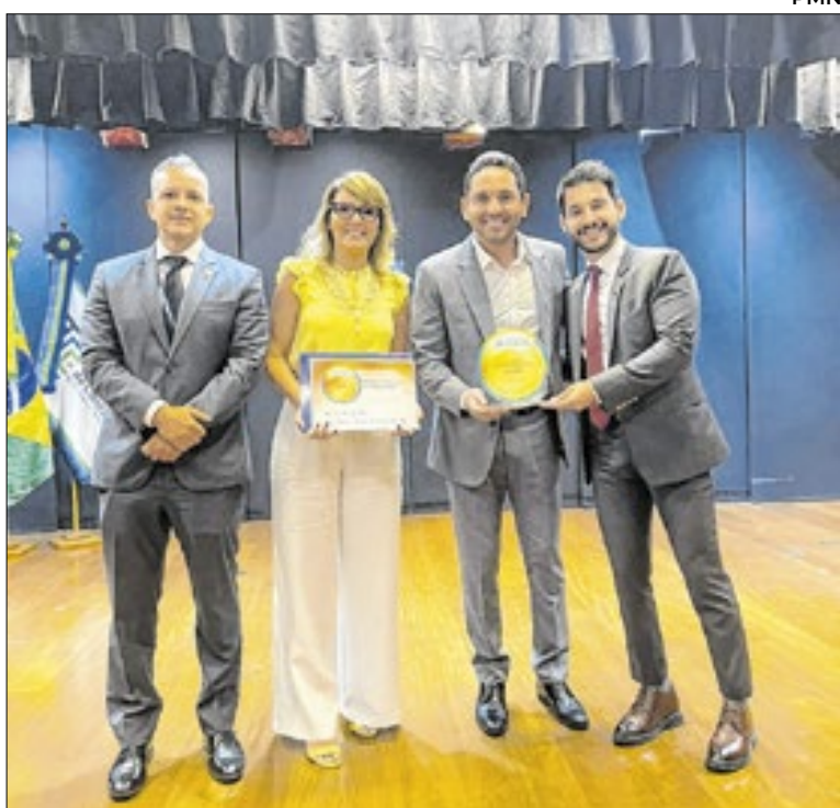
Prêmio gera credibilidade, aproxima o cidadão e fortalece a confiança da população