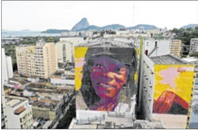
Mural enaltece a cultura afro-brasileira no coração do Rio