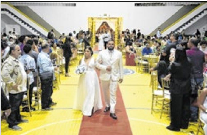
Evento acontece no Automóvel Clube de Campos