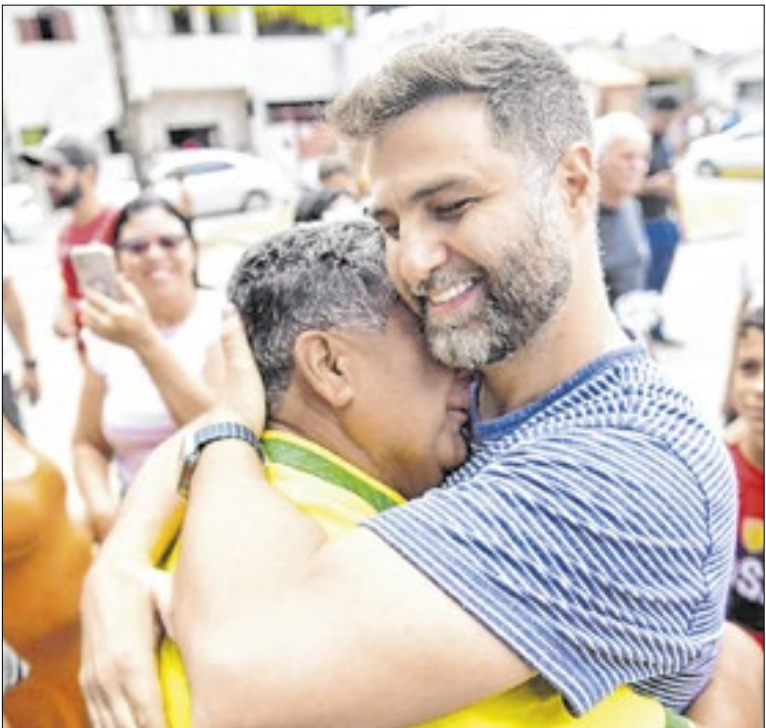
Prefeito Garotinho sendo cumprimentado pela população