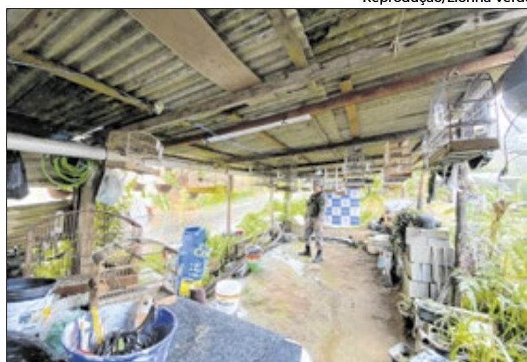
Apreensão foi realizada após denúncia ao Linha Verde

Picos, procederam à Rua José Acidino Pinto, no bairro Sanglar, onde no local denunciado, observaram várias gaiolas penduradas em uma varanda. Um morador, ao se apresentar aos policiais da 5ª UPAM, informou que as aves eram do pai, que não se encontrava no local, e, ao ser questionado sobre as licenças necessárias para manter as aves em cativeiro, o mesmo disse que não tinha ciência das autorizações.