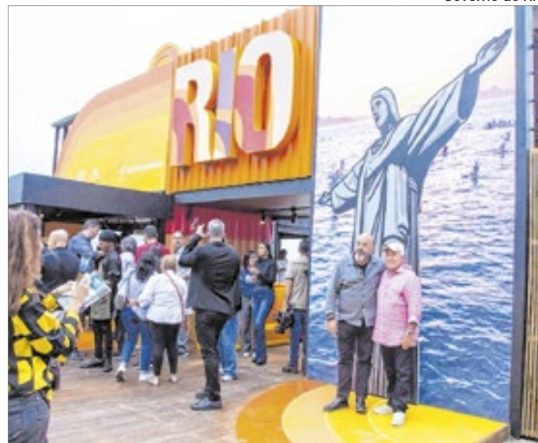
Espaço está no Posto 4 de Copacabana

Atualmente, agentes da Operação Foco recebem R$ 2.200; com a atualização, os policiais do Porto+Seguro, Operação Foco e Segurança Presente passam a receber a mesma gratificação, reforçando a valorização profissional e a equiparação das forças que atuam em áreas estratégicas.