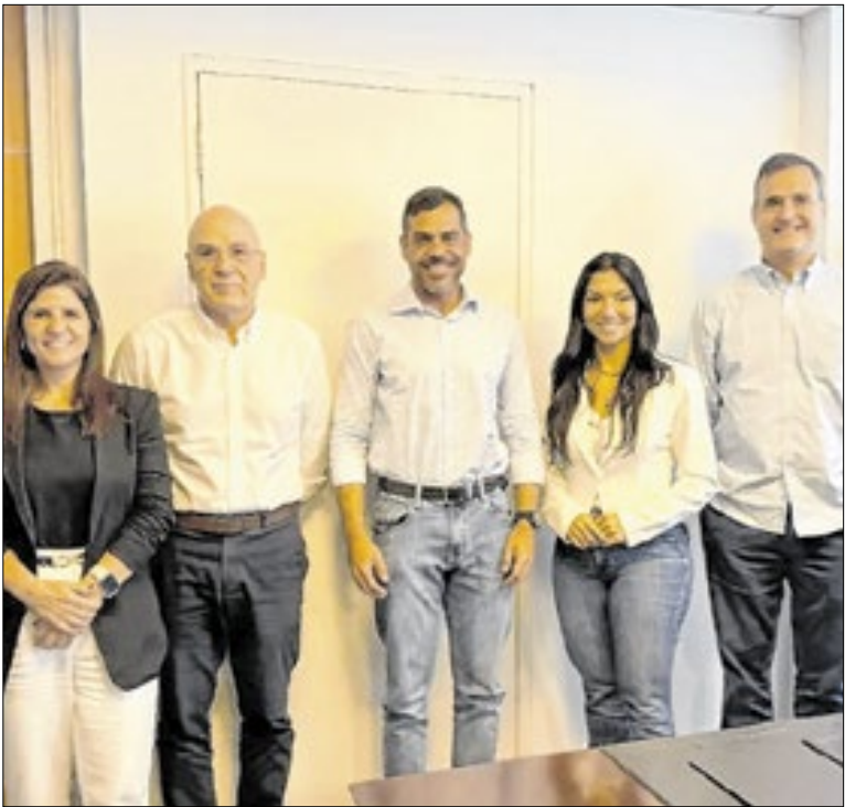
Reunião entre prefeitura e membros da Fecomércio

A Prefeitura de Saquarema está com inscrições abertas para o Curso de Capacitação em Organizador de Eventos, uma oportunidade voltada à qualificação profissional e à ampliação das chances de inserção no mercado de trabalho. O curso oferece 20 vagas por turno e tem início previsto para 19 de janeiro.