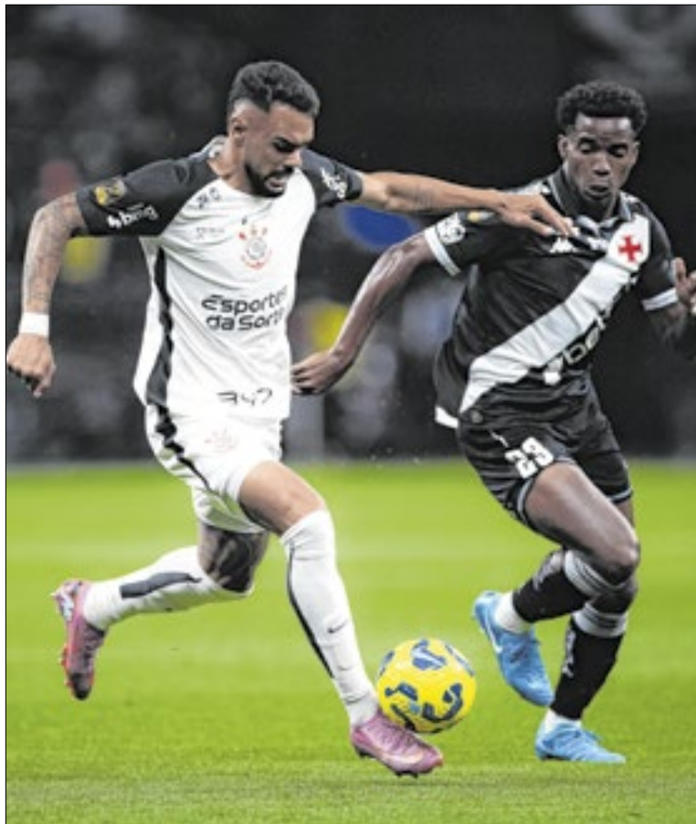
Primeiro jogo das finais ficou marcado por muito nervosismo das equipes e por gols bem anulados para ambos os times