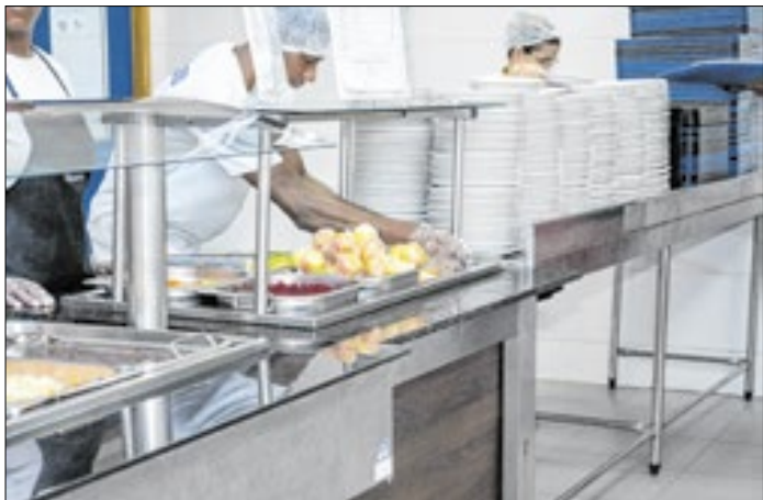
Almoço de natal terá ave assada e torta de bacalhau