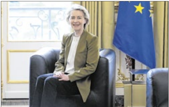
Ursula Von Der Leyen é a principal defensora europeia