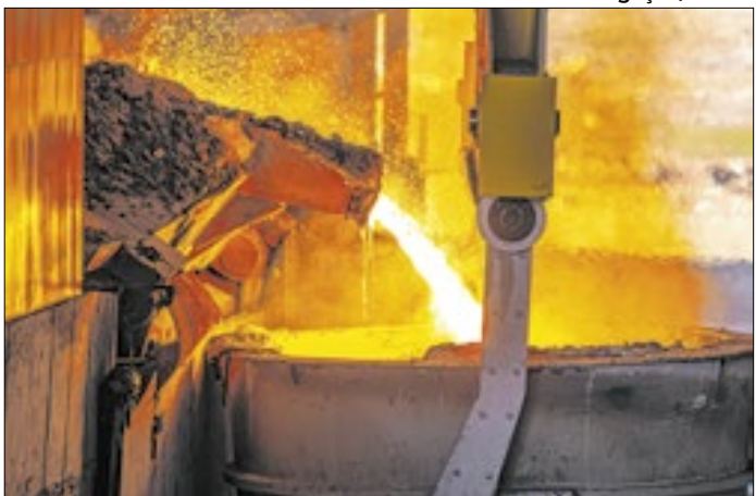
Preocupação é com tarifas impostas pelos EUA