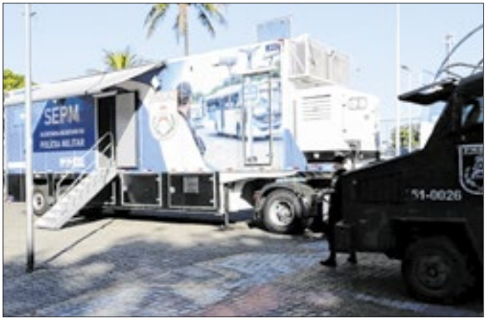
Ação com o Centro Integrado de Comando e Controle Móvel