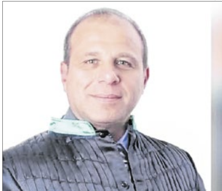
Desembargador foi preso na manhã desta terça, na Barra

A Fundação Geo-Rio concluiu, em dezembro, as últimas obras de contenção de 2025, com intervenções na Rocinha, em Irajá, no Complexo do Alemão e na Estrada Grajaú-Jacarepaguá. Ao longo do ano, foram 95 frentes de serviço e mais de R$ 93 milhões investidos em encostas da cidade do Rio de Janeiro.