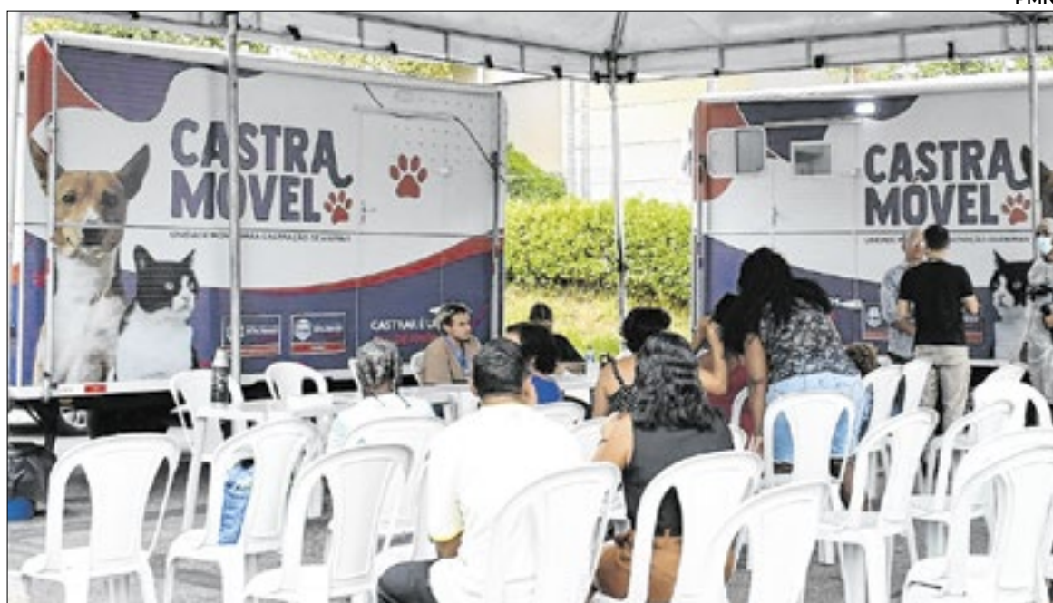
Agenda para novas castrações será aberta em breve

“Nós tivemos uma grande procura nesta primeira semana de agendamentos, acima da nossa