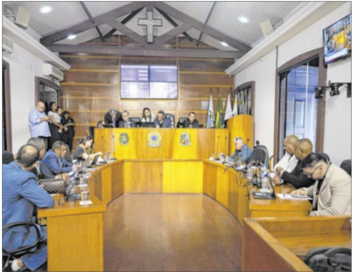
Vereadores aprovam em primeira discussão orçamento do município de Angra

A apresentação do PPA 2026–2029 deu início à audiência, com os programas estratégicos que orientarão as ações do governo nos próximos quatro anos. O documento reúne metas físicas, valores estimados e indicadores de todas as secretarias, com destaque para investimentos em educação, saúde, assistência social, infraestrutura, saneamento, cultura, turismo e esporte. Entre os pontos apresentados, destacaram-se as ações do Fundo Municipal de Educação, os programas de modernização da rede de saúde e as iniciativas do SAAE e da Secretaria de Infraestrutura voltadas à ampliação do abastecimento de água e ao avanço do saneamento básico.