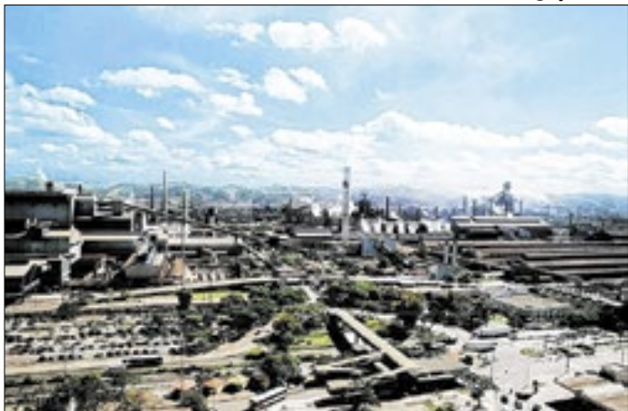
CSN pode ter redução na produção de aço