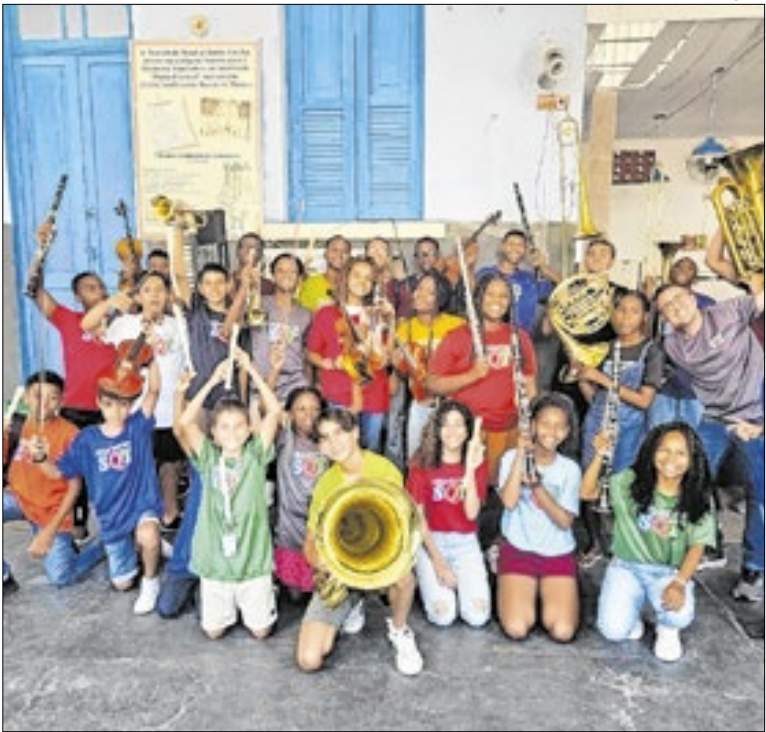
Orquestra promete emocionar o público com os clássicos