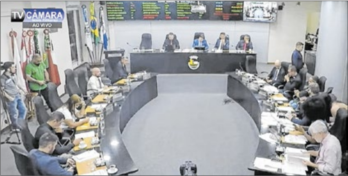
Sindicato dos profissionais criticou o projeto da prefeitura

No projeto enviado para apreciação, o município alterou o artigo 4º da Lei Municipal 4.849, de 22 de dezembro de 2021, que regulamenta a concessão do auxílio em dinheiro pela administração pública. [...] “A proposta visa a adoção de meios seguros e rastreáveis para a concessão do benefício, como cartões eletrônicos, garantindo maior controle,