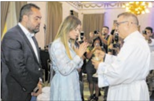
A primeira-dama Analine e o governador Cláudio Castro durante a missa no Palácio Guanabara