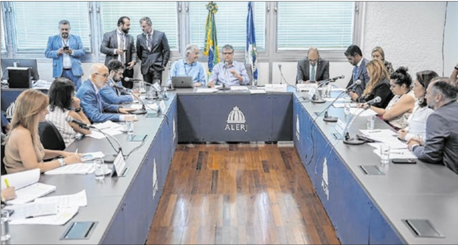
Reunião sobre o Projeto de lei Orçamentária do Estado aconteceu nesta terça-feira (16)