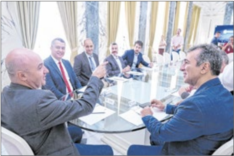
Internet chegará para 500 mil pessoas com o acordo