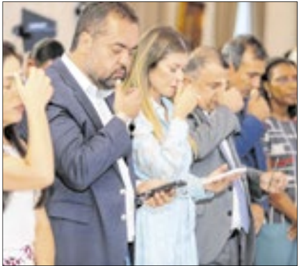
Salão Nobre do Palácio Guanabara se transformou em templo para a profissão da fé