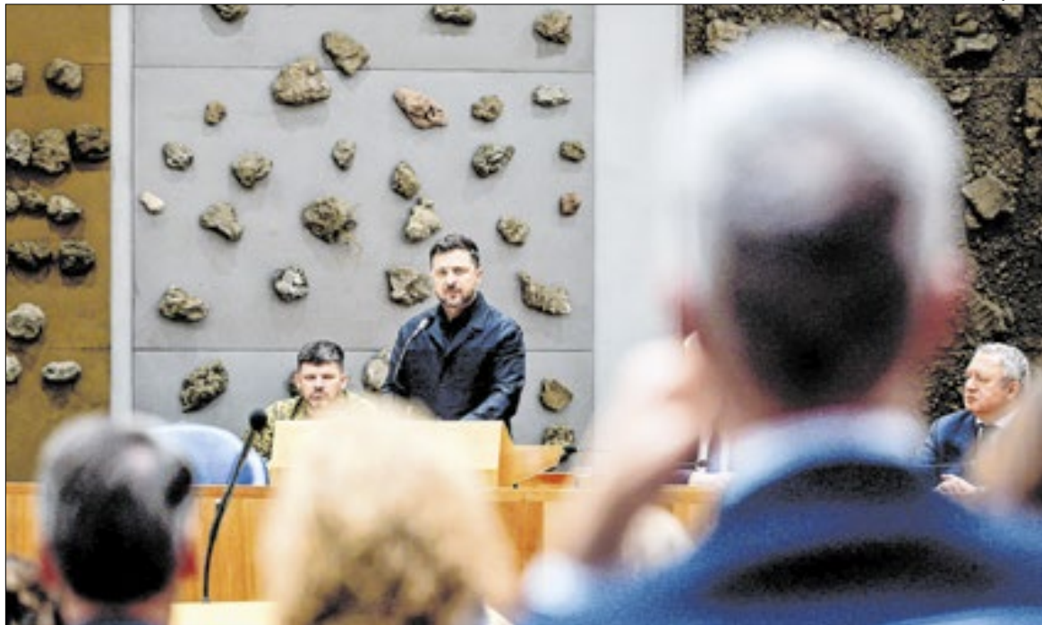
Presidente ucraniano, Volodymyr Zelenski, “falou grosso” em seu discurso no Parlamento holandês