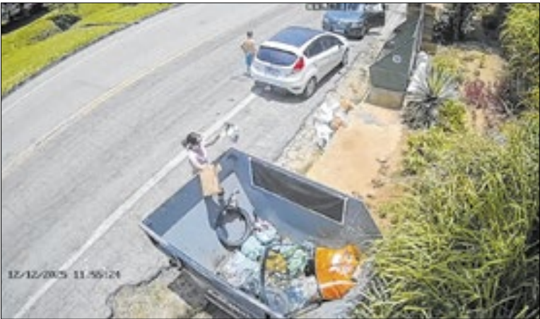
O descarte incorreto também representa risco aos funcionários

Os flagrantes foram registrados pelo sistema de monitoramento da Opensat e reforçam uma situação recorrente enfrentada pelo projeto Conexão Verde: a contaminação das caçambas por materiais inapropriados, o que impede a reciclagem e gera prejuízos ambientais, operacionais e financeiros. Assim como em casos recentes no Catobira e em outras regiões do município, o mau uso dos PEVs compromete