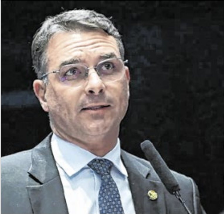
Candidatura de Flávio mexeu no tabuleiro eleitoral à direita