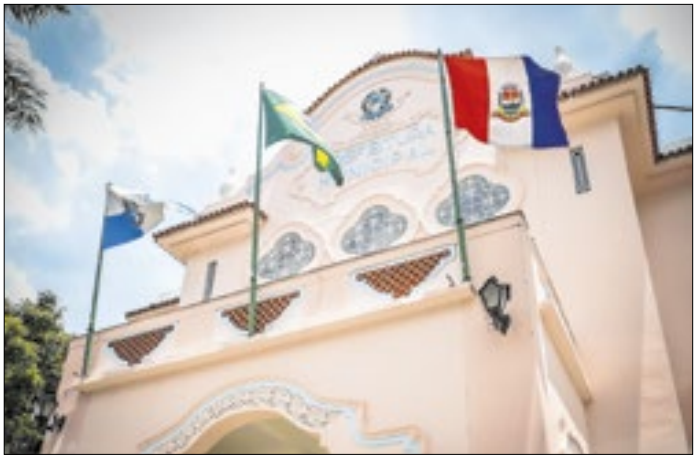
Medida foi publicada no Diário Oficial