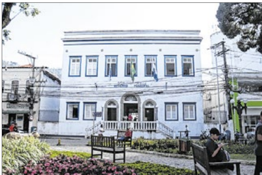
Prefeitura de Angra abre inscrições para concurso público

Os profissionais selecionados irão atuar na Educação Infantil, nos Anos Iniciais e na Educação de Jovens e Adultos (EJA – Etapa I), para o cargo de Docente I; nos Anos Finais do Ensino Fundamental e na EJA – Etapa II, para o cargo de Docente II de Artes; e exclusivamente na Educação Infantil, para o cargo de Berçarista.