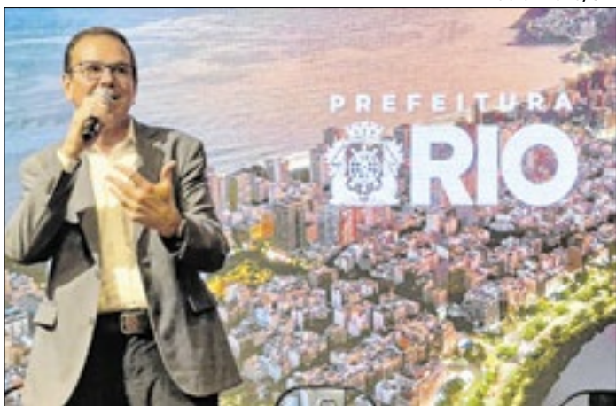
Eduardo Paes tem a preferencia dos eleitores no RJ