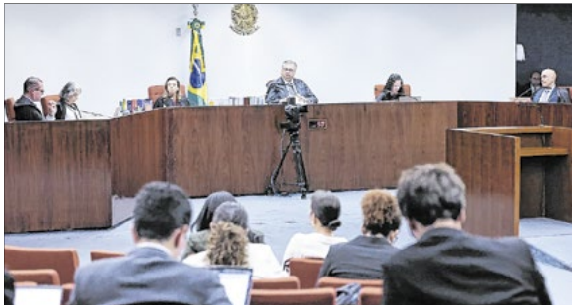
As cinco condenações encerram julgamento da trama golpista

O núcleo dois era responsável pela elaboração da chamada “minuta do golpe”, pelas blitzes realizadas no segundo turno eleitoral de 2022 no Nordeste. Foi dentro desse núcleo que foi elaborado o