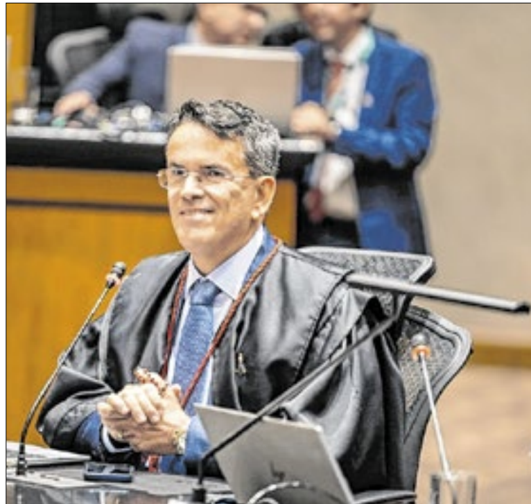
Desembargador do TJ-RJ, Cláudio Mello Tavares

A lei determina que o cônjuge ou companheiro, desde que não esteja separado, seja o curador da pessoa interditada; na ausência dessas pessoas, a função cabe ao pai ou à mãe, e, em seguida, ao descendente mais próximo que se mostre apto. Se nenhuma dessas pessoas puder assumir esse papel, o juiz nomeará o curador.