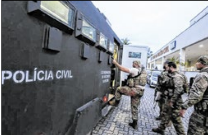
Ação de mandados de busca e apreensão de bens