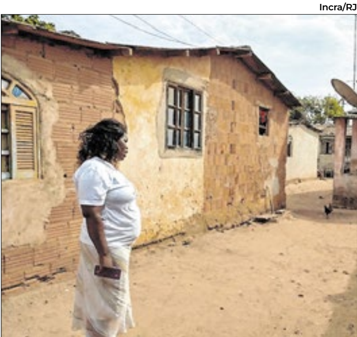
Ação na Comunidade Quilombola Maria Joaquina