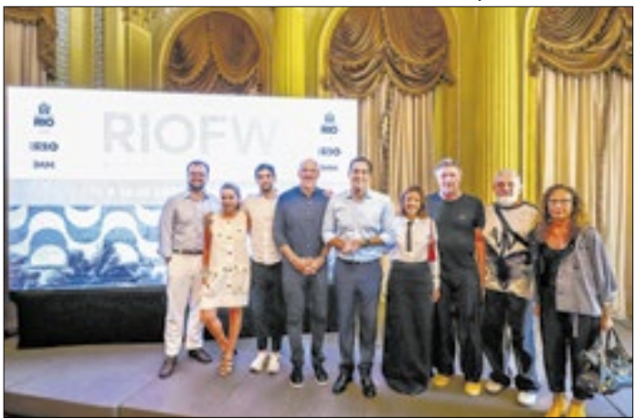
Vice-prefeito Eduardo Cavaliere foi o anfitrião do evento