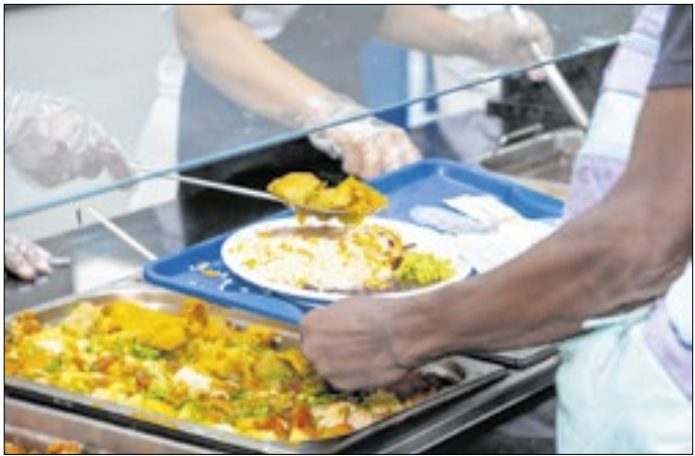
Ano novo terá cardápio especial no Restaurante do Povo

A iniciativa reforça o compromisso do Restaurante do Povo com a segurança alimentar e com a oferta de refeições nutritivas, acessíveis e preparadas com cuidado. Mais do que isso, promover um almoço especial de natal, com pratos tradicionais da época, reforça o sentimento de dignidade para as pessoas em situação de vulnerabilidade social. O cardápio natalino mantém o valor nutricional e adiciona esse gostinho festivo.