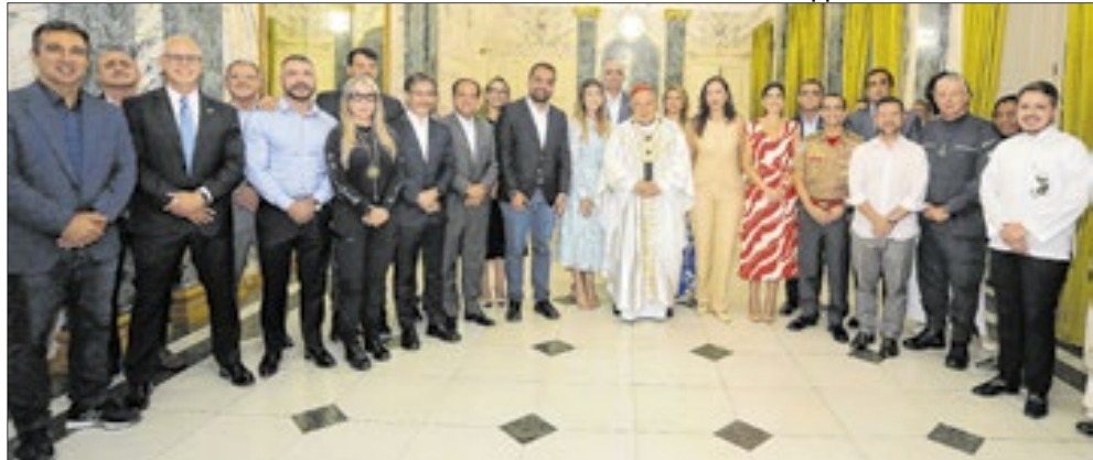
Celebrada pelo cardeal Dom Orani João Tempesta, a tradicional missa em ação de graças pelo ano de 2025, reuniu servidores e autoridades no Guanabara