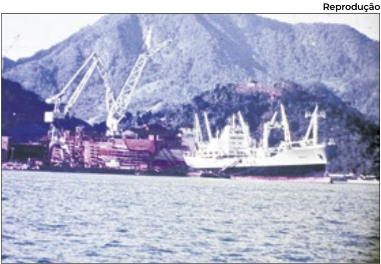
Terminal de Angra dos Reis tem reflexo de greve nacional

A Petrobras afirma ainda que “segue empenhada em concluir a negociação do acordo na mesa de negociações com as entidades sindicais”.