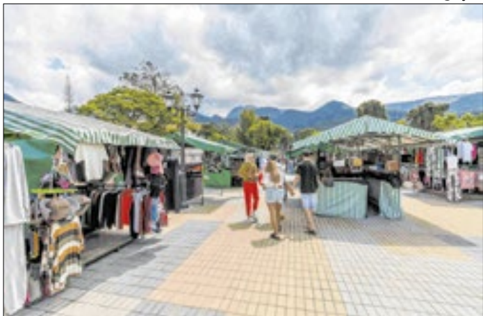
Horário será mantido até o fim do ano