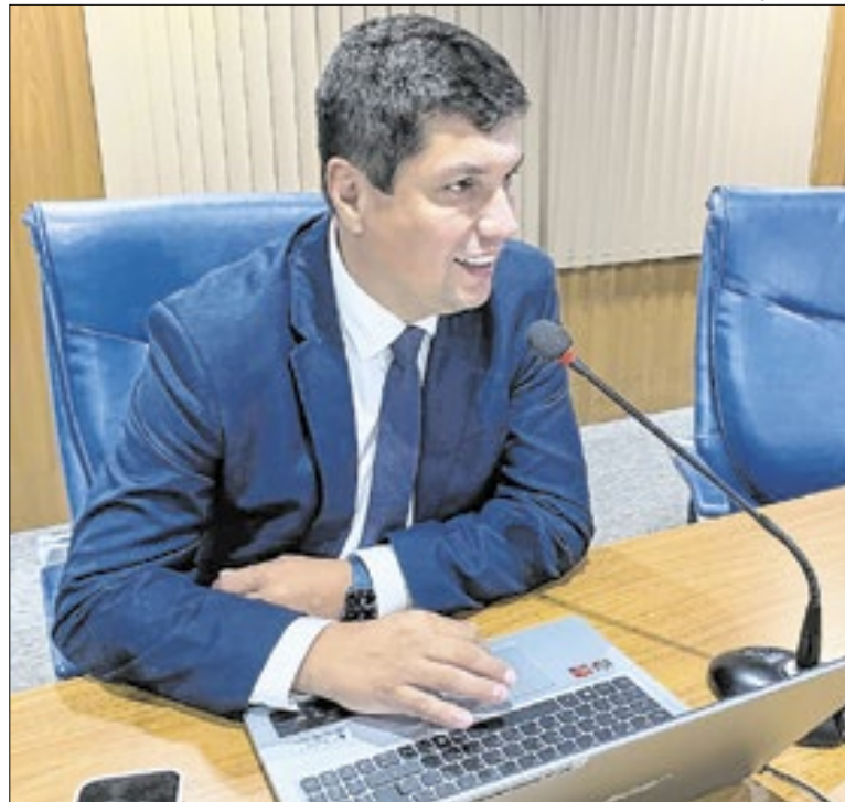
Sandro propõe Recursos Multifuncionais em escolas

O Instituto Aço Brasil atribui esse movimento ao que define como estratégias ilegais do governo chinês. A jornalista, a entidade apresentou dados da Platts que mostram queda acentuada no preço do aço chinês, de US$ 560 por tonelada de bobinas a quente em janeiro de 2024 para US$ 454 em novembro de 2025.