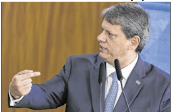
Tarcísio é melhor entre os nem-nem