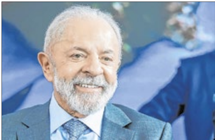
Quaest deixa Planalto otimista