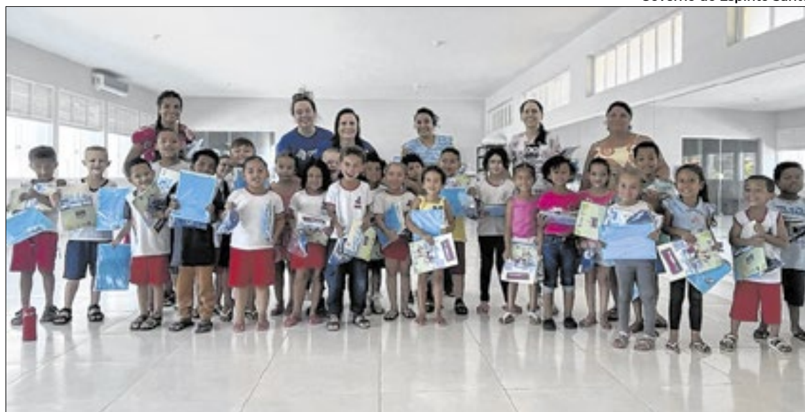
A ação reuniu atividades lúdicas e interativas

A iniciativa integra as ações de educação para o consumo do Procon-ES, por meio do projeto Parceria Legal: Empreendedor & Consumidor, desenvolvido em parceria com a Agência de