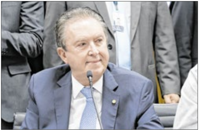
Ducci conseguiu o apoio para fazer tramitar a PEC