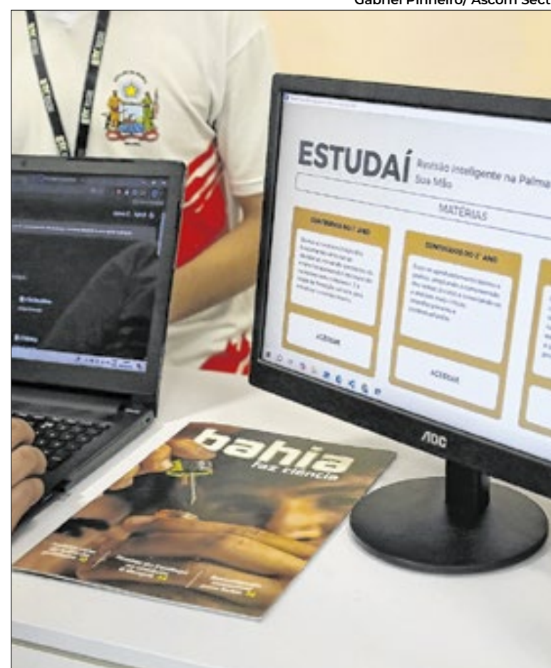
A Secti estreou no Dia Nacional da Ciência e do Pesquisador

As matérias são divulgadas semanalmente, sempre às segundas-feiras, para a mídia baiana, e estão disponíveis no site e redes sociais da Secretaria. Se você conhece algum assunto que poderia virar pauta deste projeto, as recomendações podem ser feitas através do e-mail ascom@secti.ba.gov.br .