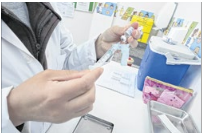
Estado reforça imunização em mulheres grávidas