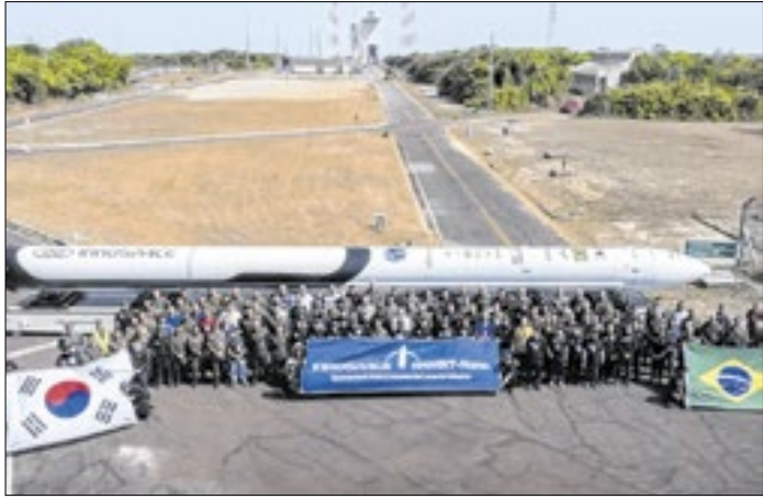
Foguete foi desenvolvido por empresa sul-coreana