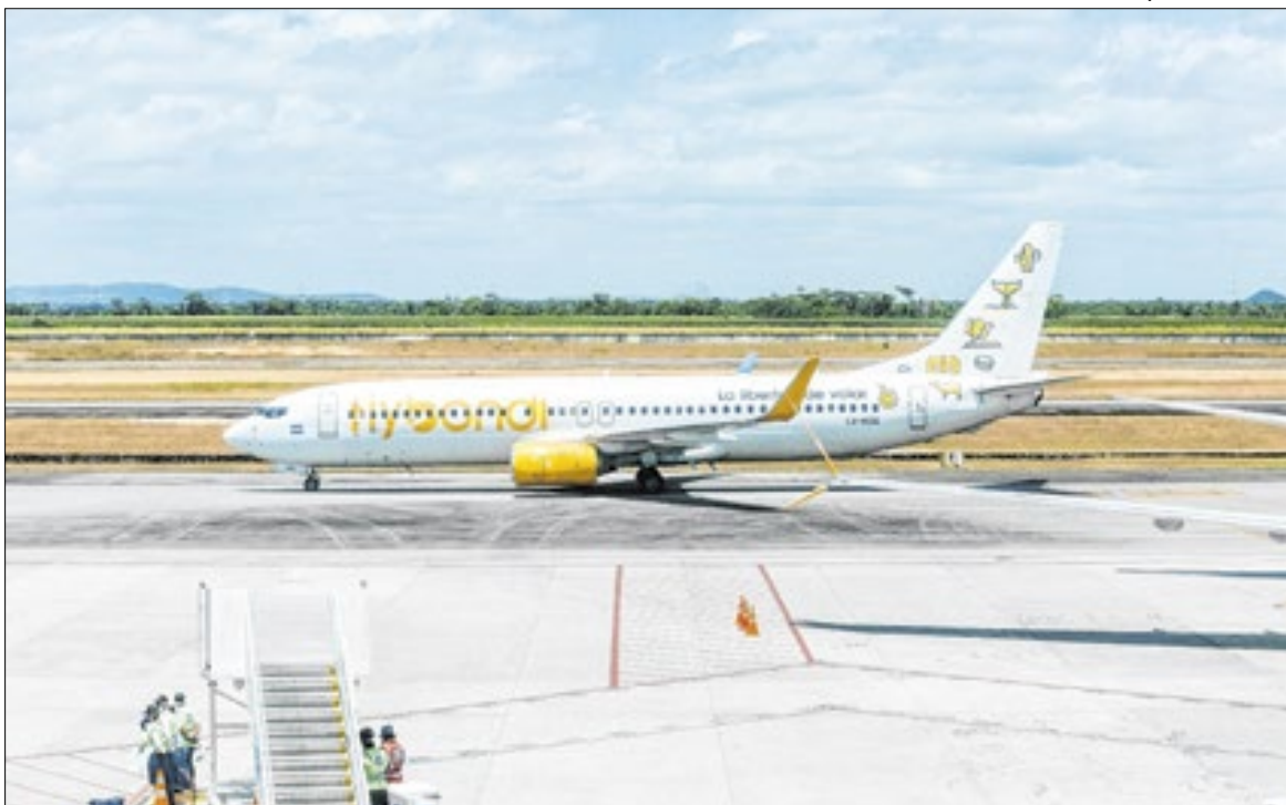
Voos regulares fazem conexão Buenos Aires - Maceió - Buenos Aires