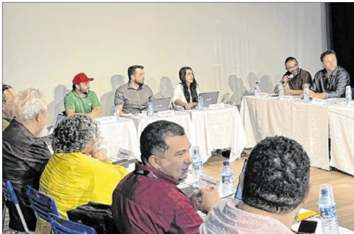
O pleito vai escolher 12 titulares e 12 suplentes

O diferencial desta eleição é que pela primeira vez na história de formação do conselho, povos de tradição étnica, indígenas e quilombolas, estão representados. Uma quilombola e um indígena estão habilitados para concorrer e poderão, como sociedade civil, compor o conselho. A pessoa indígena potiguar é do município de Baía da Traição e a outra pessoa, quilombola, é do município de Dona Inês, da Comunidade Quilombola Cruz da Menina.