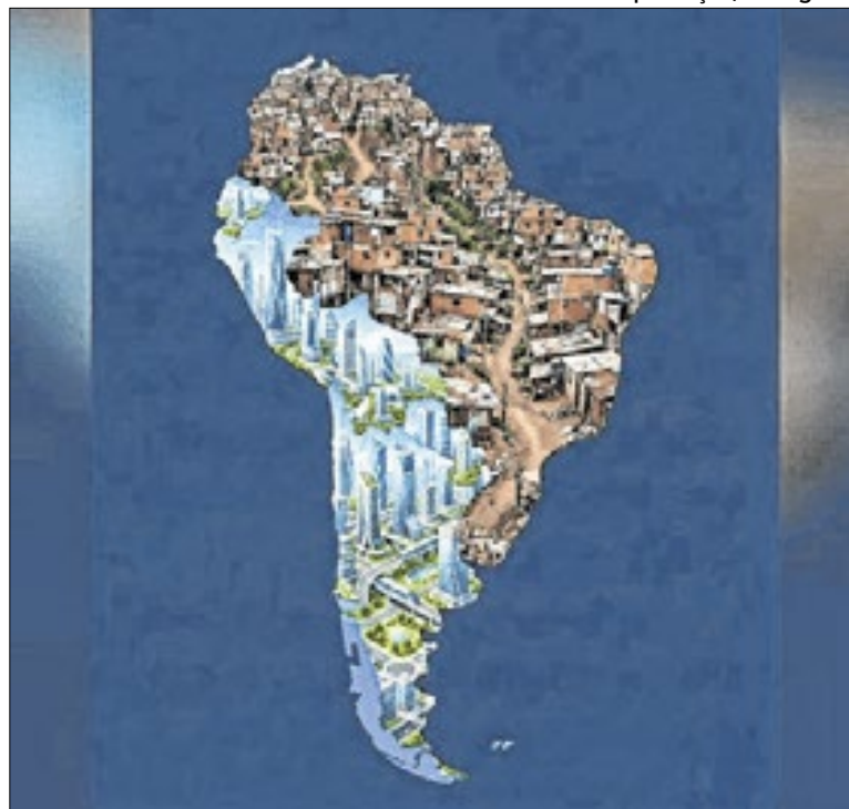
Postagem do presidente teve cunho político contra a esquerda