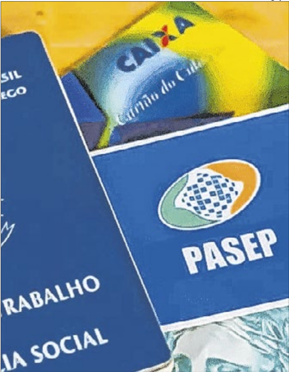
Calendário de pagamentos do Pasep (serviço público) e do PIS (setor privado) vai até o dia 29 de dezembro

A receita informou que já está disponível a nova versão do sistema de procurações eletrônicas da Receita Federal, que agora passou a se chamar Autorizações de Acesso.