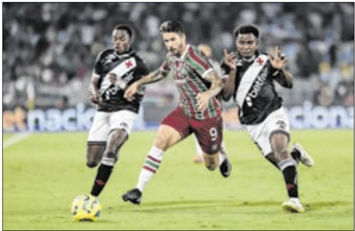
Quase todos os clubes são patrocinados por bets