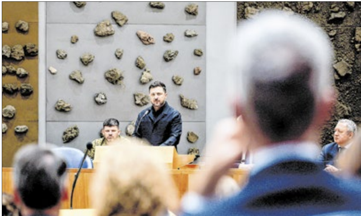
Presidente ucraniano, Volodymyr Zelenski, “falou grosso” em seu discurso no Parlamento holandês