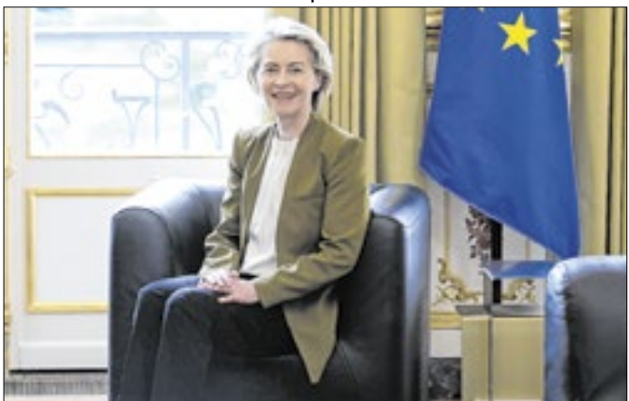
Ursula Von Der Leyen é a principal defensora europeia