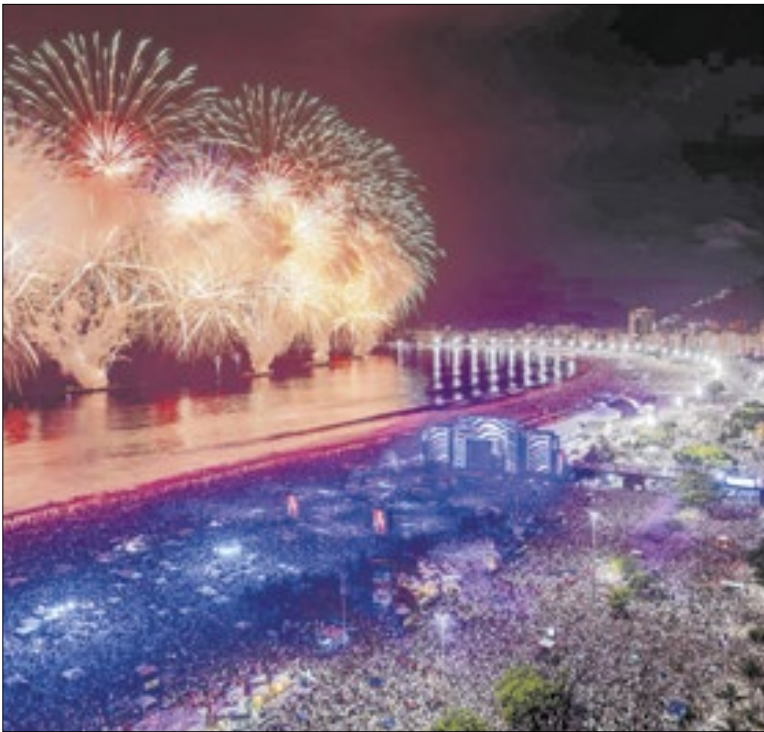
Pelo segundo ano, os bilhetes especiais são digitais

Uma pesquisa do Datafolha com frequentadores do Parque Ibirapuera revela o que o paulistano acha de seu parque favorito. A nota média alcançada pelo parque é de 9,1, sendo que 50% dos entrevistados deram nota 10. Segundo o levantamento, 72% dos entrevistados afirmam que o local melhorou.