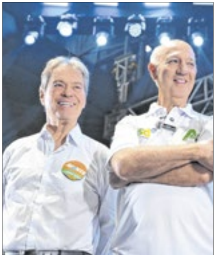
Ao lado do ex-governador José Roberto Arruda, o ex-senador Gim Argelo

■ A LUPA TAMBÉM NO CNJ - O Conselho Nacional de Justiça - CNJ tem investigado a relação deste grupo e surpreendentes decisões judiciais que lhe trouxeram vantagens, como o caso da Economy. Apesar do caso de VR ser uma operação aparentemente pequena, pode revelar detalhes que interessam a investigação, sobre o relacionamento com o judiciário.