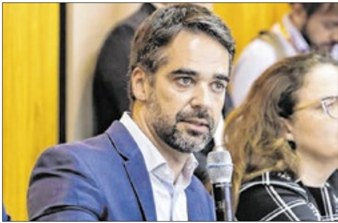
Projeto promove estudo da região hidrográfica do Guaíba