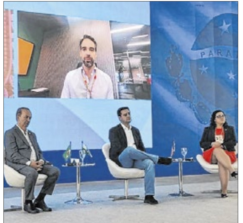
Governo avança em medidas de adaptação à crise climática

O governo do Paraná fortaleceu a infraestrutura rodoviária ao completar 755 quilômetros de rodovias com obras de pavimentação ou duplicação em concreto em diferentes fases de execução em todo o Paraná. O número representa um aumento de mais de 50% em apenas seis meses, no comparativo com os 500 quilômetros.