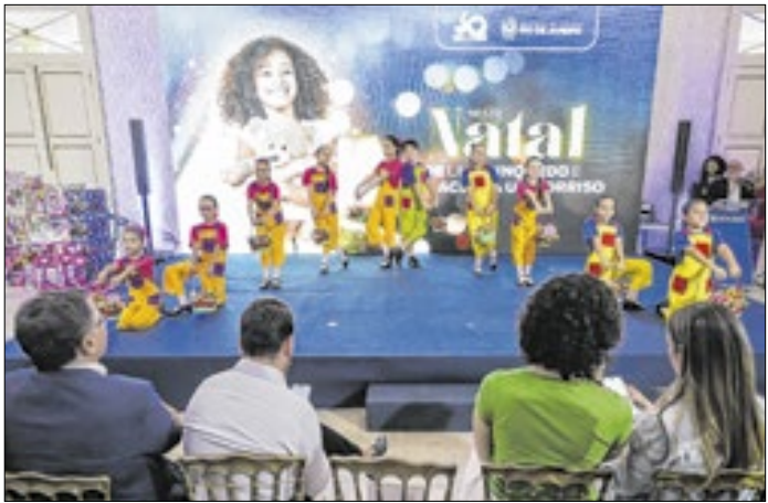
Crianças do projeto realizaram apresentação