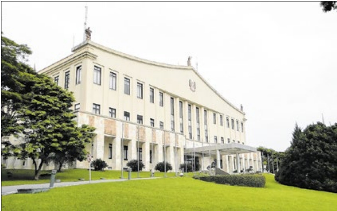
A decisão foi tomada durante reunião realizada no Palácio dos Bandeirantes

Os governos do Estado de São Paulo, federal e a Prefeitura da capital chegaram a um acordo, nesta terça-feira (16), para solicitar à Agência Nacional de Energia Elétrica (Aneel) a decretação da caducidade do contrato da Enel para o fornecimento de energia elétrica em 24 municípios paulistas. A decisão foi tomada durante reunião realizada no Palácio dos Bandeirantes, liderada pelo governador Tarcísio de Freitas, com a presença do ministro de Minas e Energia, Alexandre Silveira, e do prefeito de São Paulo, Ricardo Nunes.