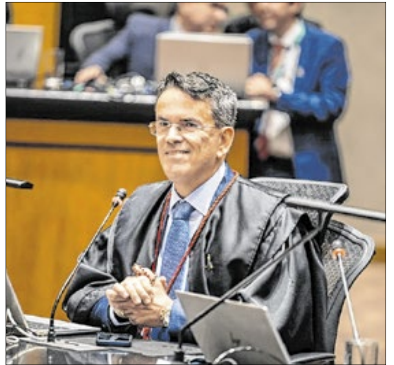
Desembargador do TJ-RJ, Cláudio Mello Tavares

A lei determina que o cônjuge ou companheiro, desde que não esteja separado, seja o curador da pessoa interditada; na ausência dessas pessoas, a função cabe ao pai ou à mãe, e, em seguida, ao descendente mais próximo que se mostre apto. Se nenhuma dessas pessoas puder assumir esse papel, o juiz nomeará o curador.