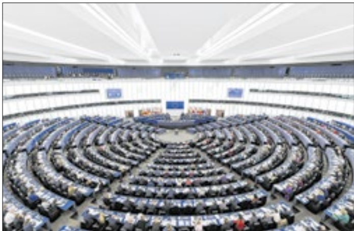
Parlamento Europeu aprovou regra mais severa