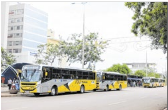
Mais ônibus elevam uso e acesso ao serviço