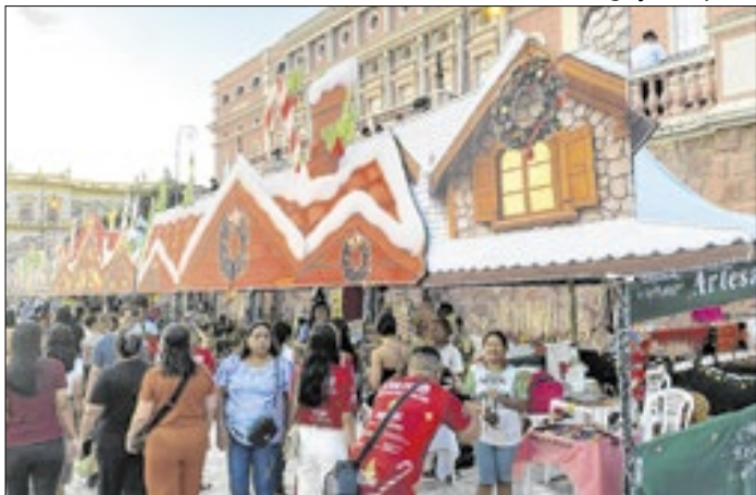
Exposição ocorre em Manaus até janeiro de 2026