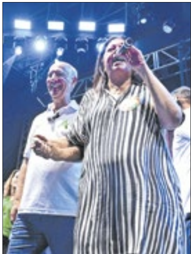
A deputada federal fluminense Laura Carneiro durante discurso na filiação de Arruda ao PSD