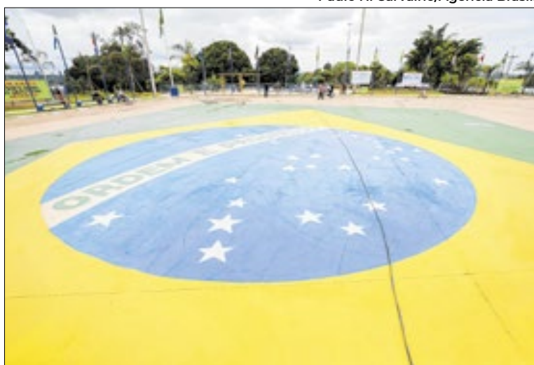
Obra custou R$2 milhões para ampliar e melhorar espaço

Foi construído um estacionamento com pavimentação em blocos, totalizando 40 vagas, sendo duas destinadas a idosos