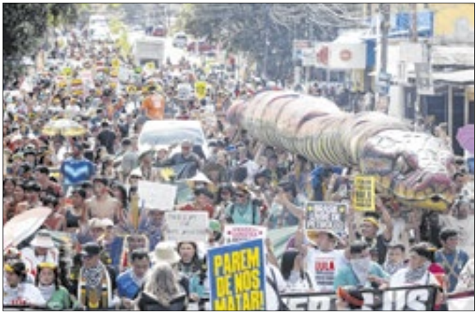
Tese está em debate no STF avança no Congresso