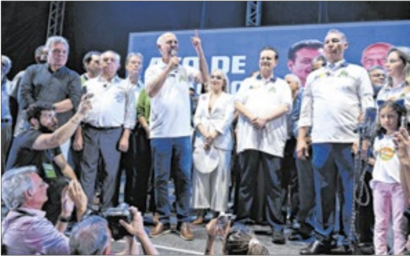
O ex-governador do DF, José Roberto Arruda, durante sua filiação ao PSD, sigla que pretende se candidatar ao governo do Distrito Federal nas eleições do ano que vem. Evento aconteceu no Centro de Convenções Ulysses, em Brasília