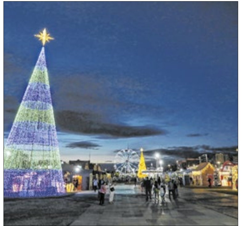
Além dos shows, Nosso Natal tem diversas atrações