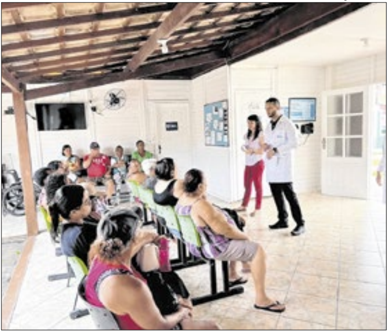
Prefeitura de Quissamã

“A informação é a nossa ferramenta mais poderosa na prevenção. Momentos como este servem para tirar dúvidas e mostrar que o cuidado deve ser constante. É fundamental que a população saiba que o SUS oferece tratamento totalmente gratuito e sigi-