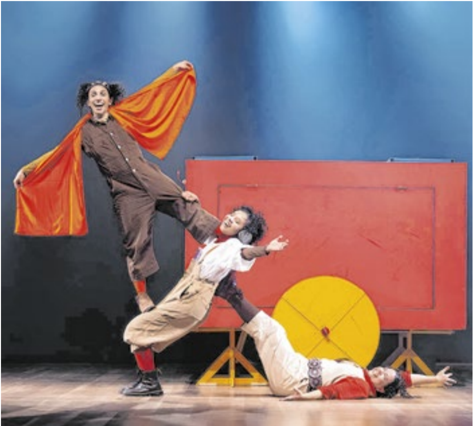
Chuva na Caatinga