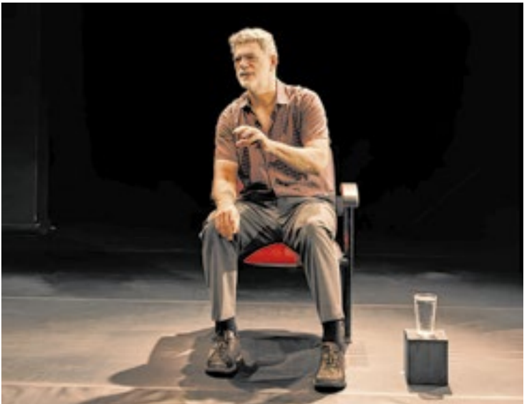
O Motociclista no Globo da Morte

✱Espetáculo infantojuvenil baseado no universo criativo do cartunista Henfil. As tirinhas dos personagens Graúna, Zeferino e Bode Orelana são o ponto de partida de um espetáculo que prega a esperança. Até 1/2/2026, com interrupção entre 22/12 e 16/1, sáb e dom (16h). Teatro III do CCBB RJ (Rua Primeiro de Março, 66, Centro). R$ 30 e R$ 15 (meia)