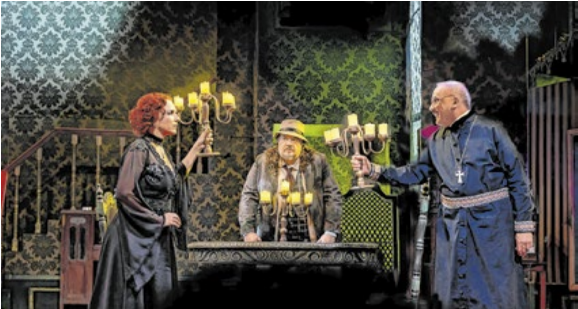
De perto ninguém é normal