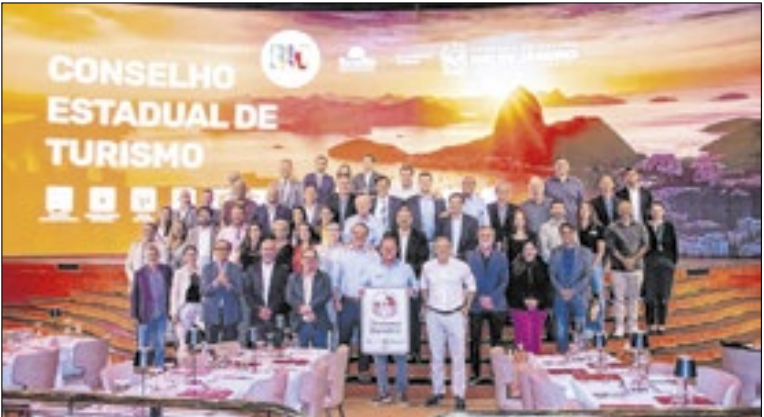
A reunião encerrou as atividades do Conselho Estadual apresentando um panorama otimista e estruturado para o próximo ano

O Conselho Estadual de Turismo se reuniu nesta semana, no Roxy Dinner Show, em Copacabana, em um encontro que marcou a apresentação dos resultados do setor em 2025 e as perspectivas do turismo fluminense para 2026. Conduzido pelo secretário de Estado de Turismo, Gustavo Tutuca, o evento reuniu representantes do trade, gestores públicos, entidades setoriais e lideranças das 12 regiões turísticas do estado. Durante a reunião, Tutuca apresentou os resultados que consolidam 2025, antes mesmo de o ano acabar, como o melhor ano do turismo internacional no Rio de Janeiro em mais de três décadas. Até outubro, o estado recebeu 1.796.520 turistas estrangeiros, um crescimento de 48% em relação ao mesmo período de 2024, ultrapassando, em apenas dez meses, todo o fluxo registrado no ano passado. A meta de 2 milhões de visitantes internacionais, inédita na história do estado, será batida até dezembro, segundo as projeções. Outro destaque foi o desempenho do RIOgaleão, que totalizou 14,5 milhões de passageiros entre janeiro e outubro, crescimento de 24% frente a 2024. A projeção oficial indica que o aeroporto deve fechar o ano com mais de 17 milhões de passageiros, reforçando sua recuperação e seu papel como porta de entrada para turistas do mundo inteiro.