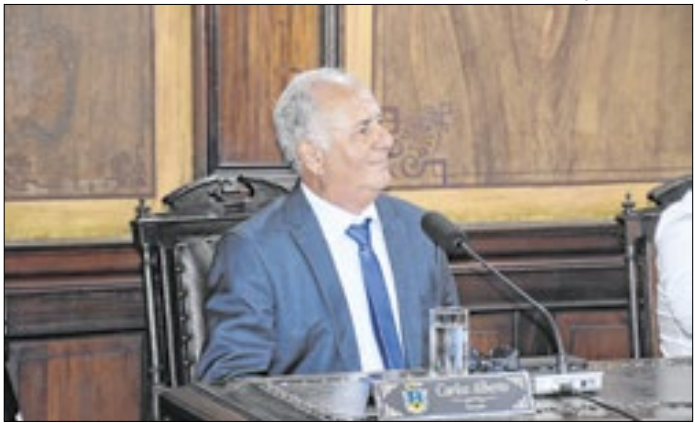
O Projeto de Lei segue agora para sanção do executivo.