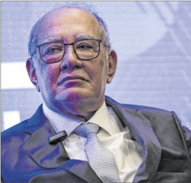
Gilmar poderá rever pontos da sua decisão