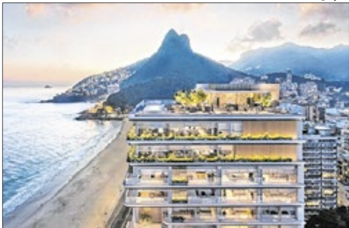
Hotel, onde ficava o Marina Palace, está previsto para 2029