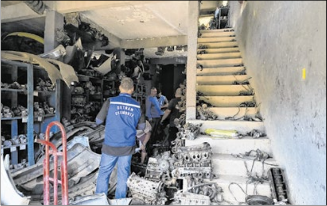
Criada em 2023, a operação já interditou 138 ferros-velhos irregulares