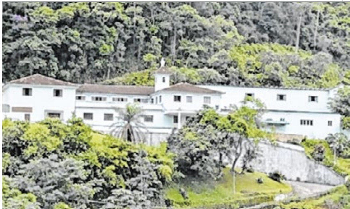
Hospital Psiquiátrico Santa Mônica em Petrópolis, localizado em Corrêas