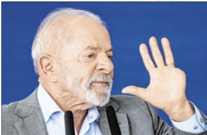
Lula: conselho para manter discrição