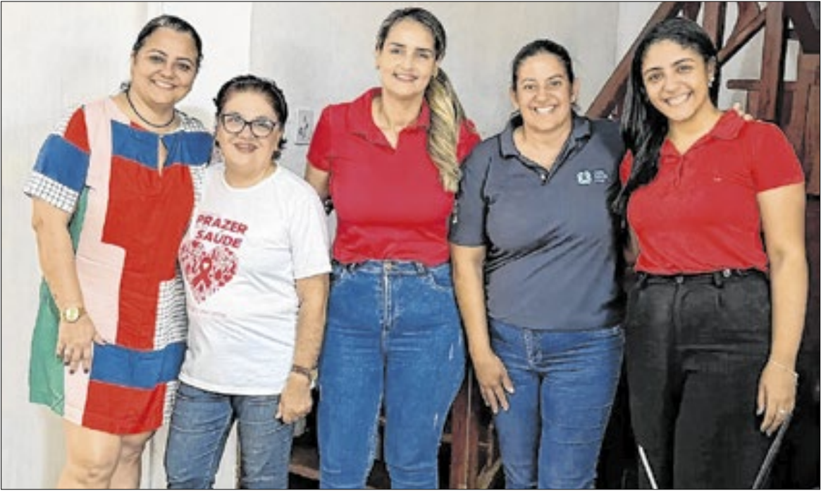
Além da roda de conversa, a equipe realizou atendimentos individualizados