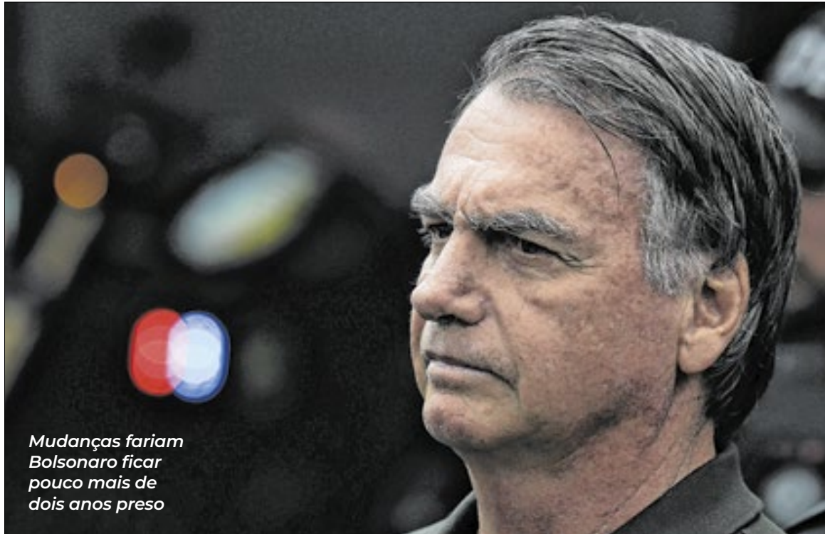
Mudanças fariam Bolsonaro ficar pouco mais de dois anos preso