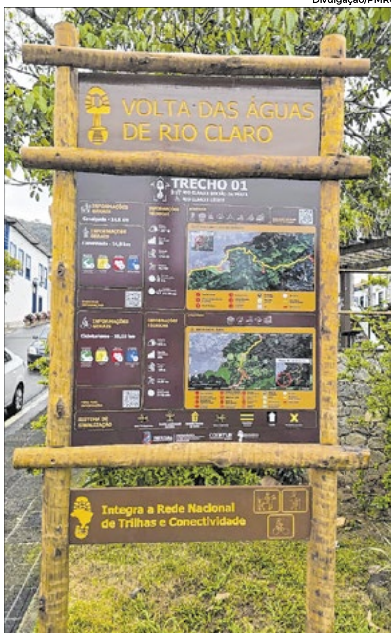
A Trilha Volta das Águas percorre todas as regiões de Rio Claro

Serão instaladas placas com informações completas sobre o trecho