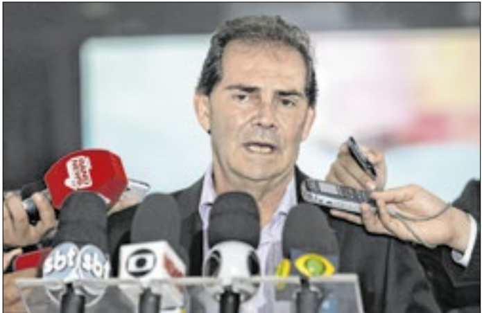
Paulinho da Força redigiu o projeto das penas