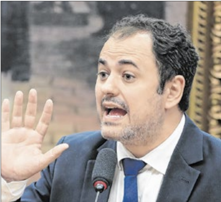
Negociação em plenário trocou cassação por suspensão

Paraná Pesquisas divulgada na quarta (10) mostra que Tarcísio venceria no primeiro turno com 52% em um cenário no qual não estivessem na disputa nem o ministro da Fazenda, Fernando Haddad, nem o vice-presidente Geraldo Alckmin. Tarcísio venceria os dois. Mas, nos casos, haveria segundo turno.