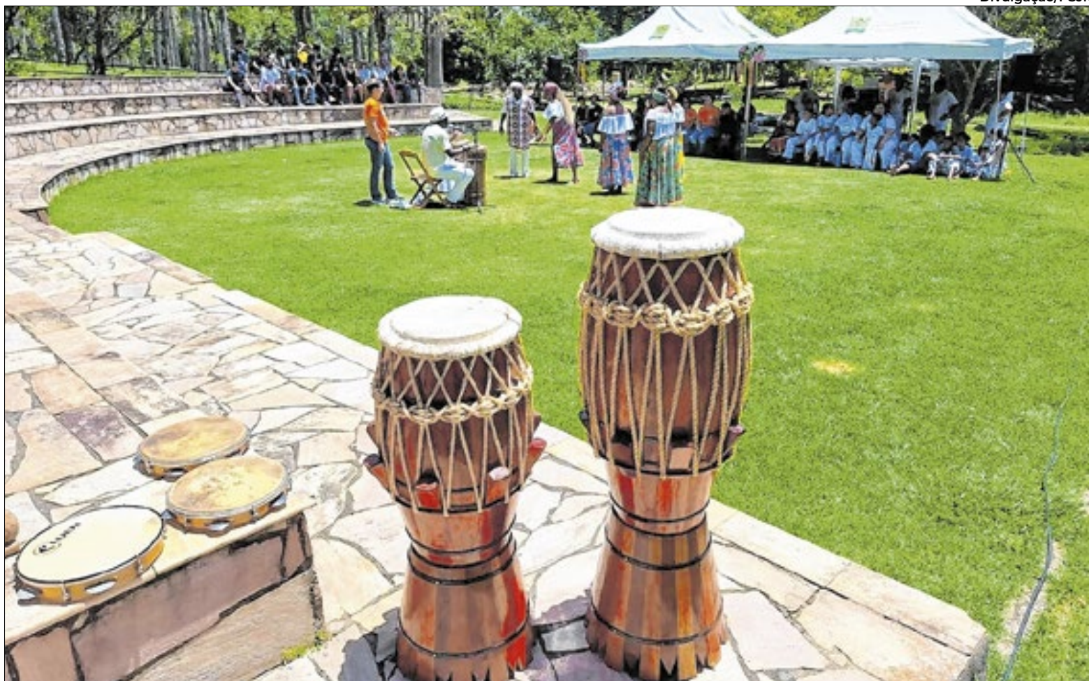
Em homenagem ao Mês da Consciência Negra, parque teve Festival Sons e Sabores Afromarcossenses