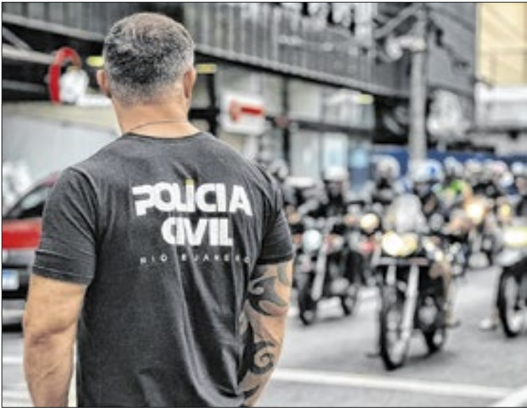
55 multas foram aplicadas durante a ação dos agentes