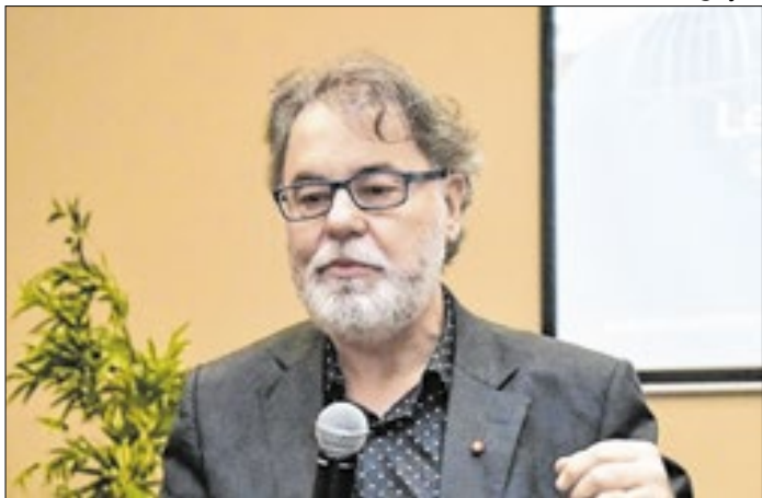
Streck ressalta que o caso já transitou em julgado