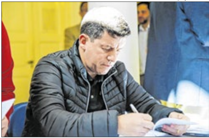
Foram 10 votos contra e 3 a favor