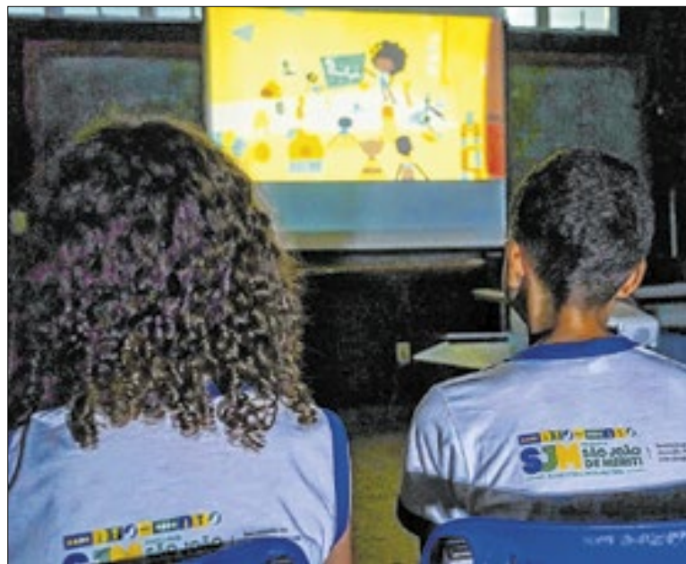
Estudantes participaram de uma sessão especial de cinema

O agressor destruiu o aparelho para impedir que ela buscasse ajuda. Após tomar ciência do crime, a equipe da 66ª DP iniciou diligências imediatas e localizou o criminoso na região. Ele foi autuado pelos crimes de injúria, ameaça e lesão corporal, todos cometidos no contexto de violência doméstica.