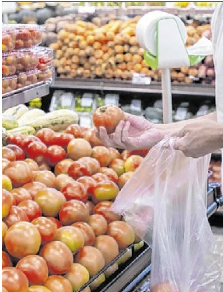
Tomates despontam novamente no cenário econômico

O IPCA apura o custo de vida das famílias com renda de um a 40 salários mínimos. O IBGE pesquisa o preço de 377 produtos e serviços. O grupo alimentos e bebidas responde por 21,5% da cesta de consumo das famílias, segundo o instituto.