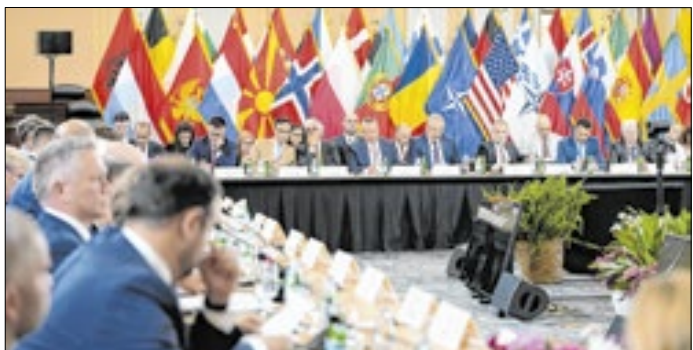
Líderes evitaram abordar a polêmica na nota emitida