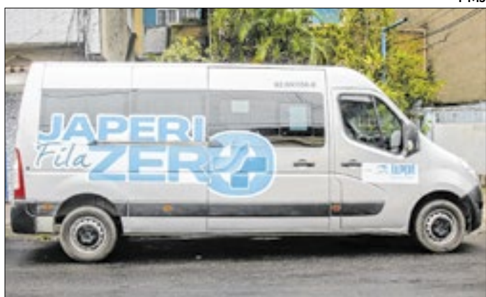
Programa Fila Zero agiliza exames e cirurgias eletivas