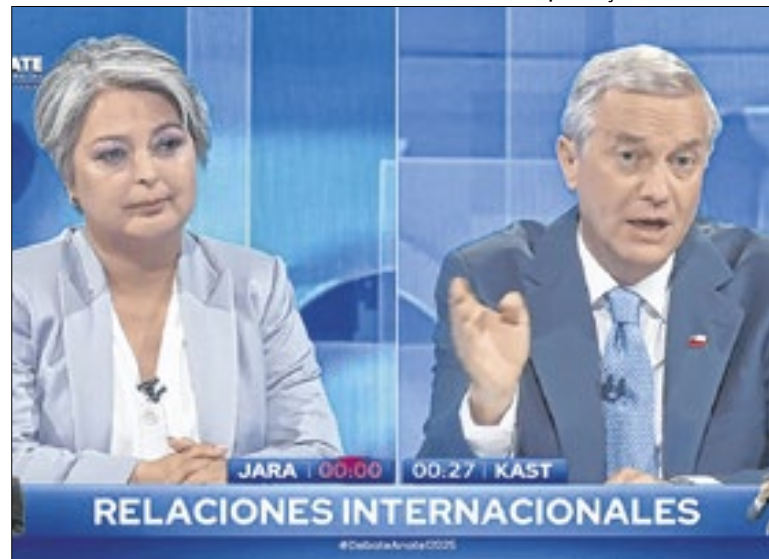
Jara e Kast tiveram debate acalorado na TV chilena

“Fomos claros, já dissemos que apoiaremos e reconheceremos todos os resultados”, afirmou o chefe do Estado-Maior Conjunto. Manifestantes bloquearam uma ponte que liga Tegucigalpa à cidade vizinha de Comayagüela, após a presidente Xiomara Castro afirmar que havia uma “adulteração dos resultados”.