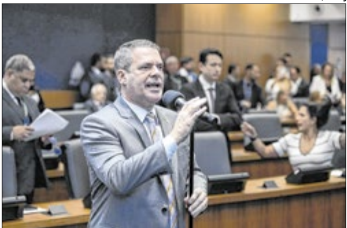
Deputado propõe ações para reduzir roubo de cargas