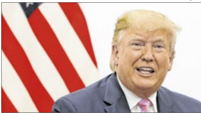
Em entrevista, Trump chamou líderes europeus de “fracos”