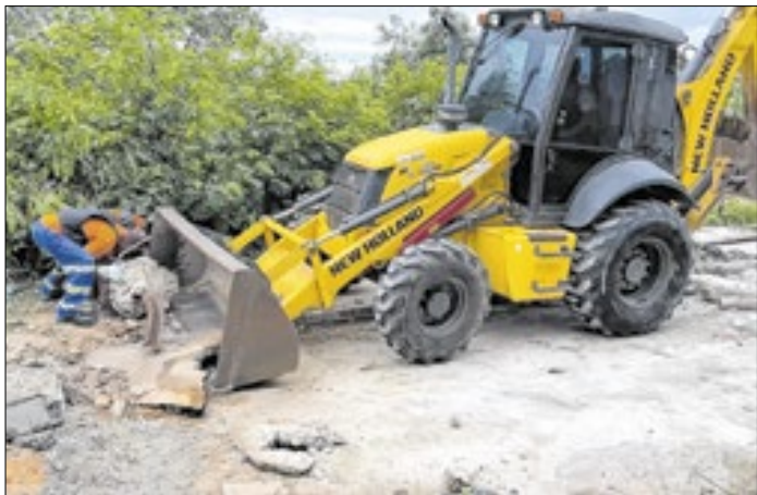
Equipes seguem trabalhando nas comunidades