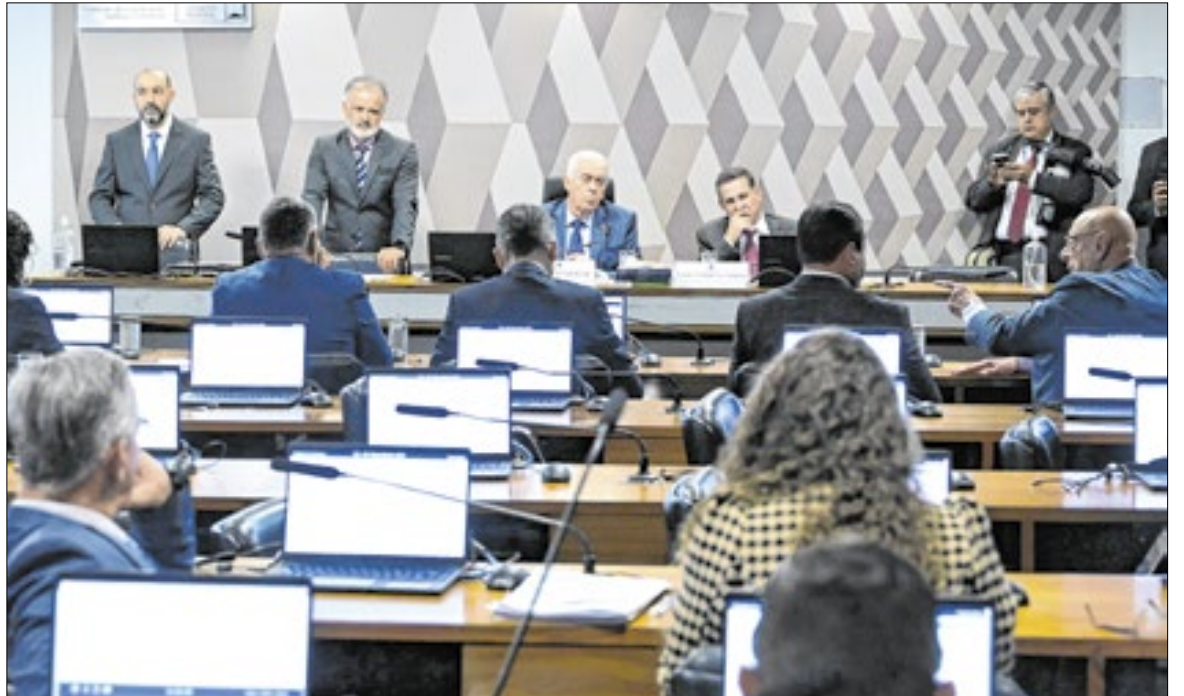
Deliberação foi simbólica, ou seja, sem contagem de votos

Caio Spechoto e Mariana Brasil (Folhapress)