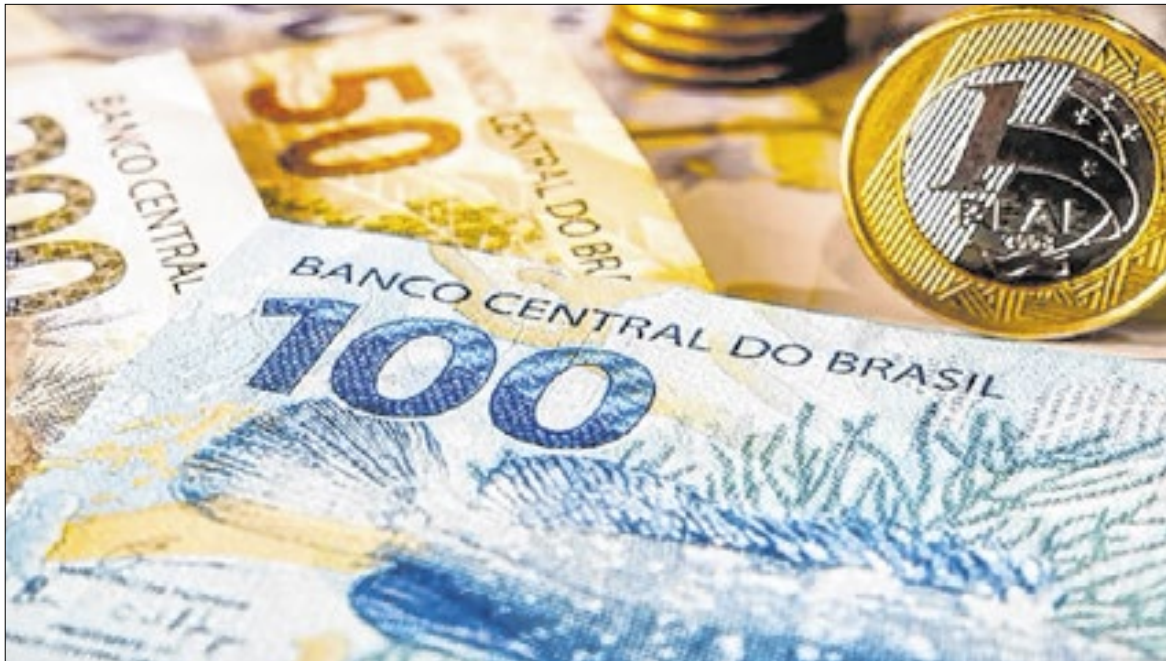
Trabalhadores, aposentados e pensionistas já podem ter uma noção do quanto vão receber