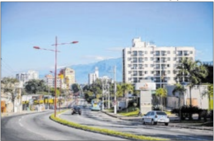
Resende pode ter novo programa de saúde