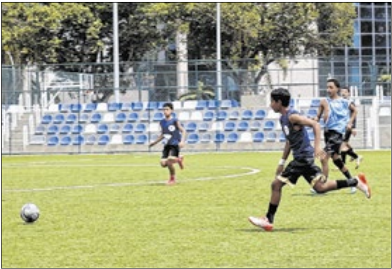
Projeto da Prefeitura gera oportunidades para os jovens

O projeto vai oferecer bolsas para formação de pilotos (curso de 1 ano) e de mecânicos aeronáuticos (curso de 2 anos). O primeiro edital vai disponibilizar 20 vagas para pilotos e 50 para mecânicos. Ao final dos cursos, os alunos selecionados serão automaticamente contratados como monitores da própria escola.