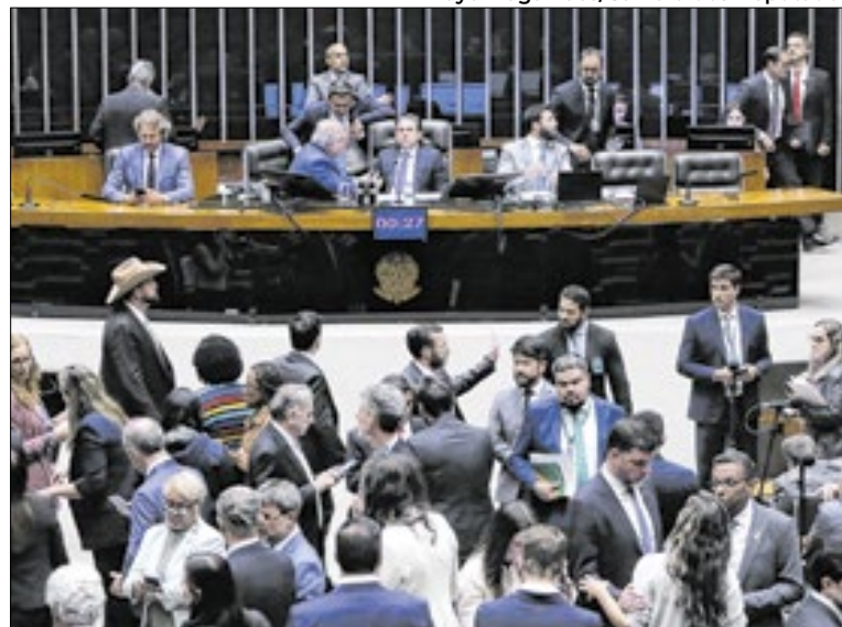
Projeto foi aprovado por volta de 2h30 de quarta