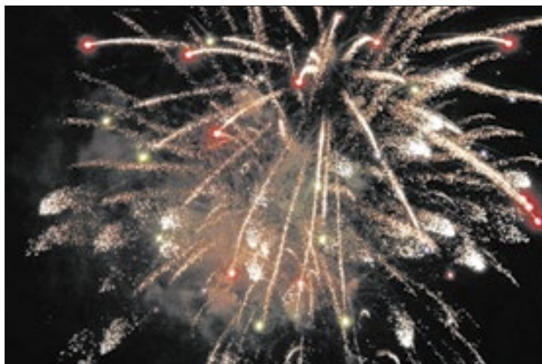
Prefeitura proíbe uso de fogos de artifício com estampido

Com base neste risco, o município de Volta Redonda adotou em 2025 uma lei que proíbe fogos de artifício com estampido, incentivando a utilização de alternativas silenciosas. Segundo a lei municipal Nº 6603, é proibida a fabricação, o comércio, manuseio e utilização de fogos de artifício que causem poluição sonora, sob pena de multa. A medida teve como objetivo reduzir os danos causados pelo som alto de fogos de artifício.