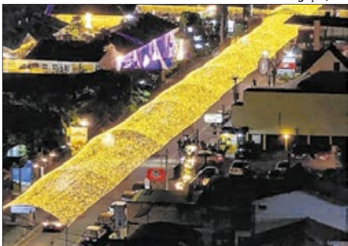
Penedo, em Itatiaia, tem túnel de luz como atração