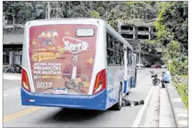
Empresa diz que pagamento de outubro está atrasado