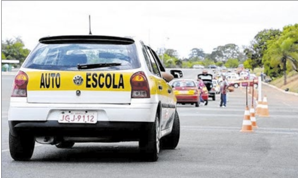
Contran aprovou o fim da obrigatoriedade de frequentar autoescola para obter a habilitação

- Nós viemos de décadas de enrijecimento de regras. Cada vez