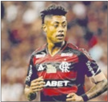
Histórico contra times mexicanos não é bom

O Flamengo estreia na Copa Intercontinental nesta quarta (10), contra o Cruz Azul, campeão da Concacaf. Para levar o “Dérbi das Américas”, o rubro-negro busca quebrar um retrospecto negativo contra times mexicanos, que conta até com uma ferida histórica.