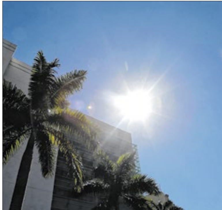
Risco de morte pelo calor excessivo é maior entre idosos

“Todos nós podemos lutar contra o ICE se você souber seus direitos”, afirmou. A gravação, legendada em inglês e espanhol, foi publicada no Instagram. “O ICE não pode entrar em propriedades privadas como sua casa, escola ou qualquer área privada do seu trabalho sem um mandado judicial assinado por um juiz”, disse.