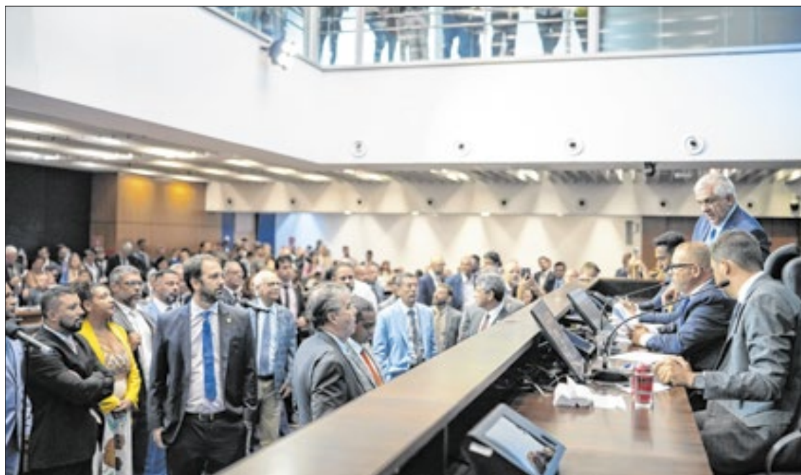
Votação na Alerj teve discussão entre deputados favoráveis e contra a medida de soltura Bacellar

Ministro do STF confirmou decisão da Alerj para soltar parlamentar nesta terça-feira