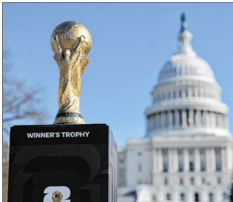
Mundial terá o maior número de jogos da história das Copas

Em entrevista ao TNT Sports, Marcelo, ex-lateral de Seleção Brasileira, Real Madrid e Fluminense fez um apelo ao atual técnico da Seleção, seu antigo comandante, Carlo Ancelotti, que convoce o zagueiro Thiago Silva, capitão do Fluminense, para a Copa do Mundo de 2026. "Ele [Thiago Silva] tá jogando muito", disse.