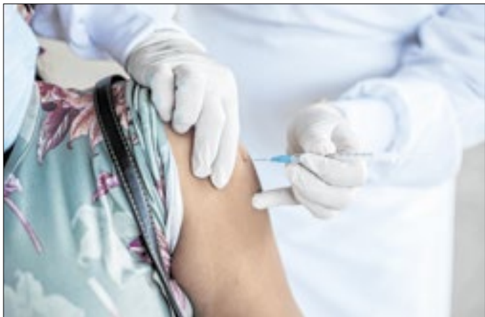
Gestantes em trabalho de parto não devem receber a dose