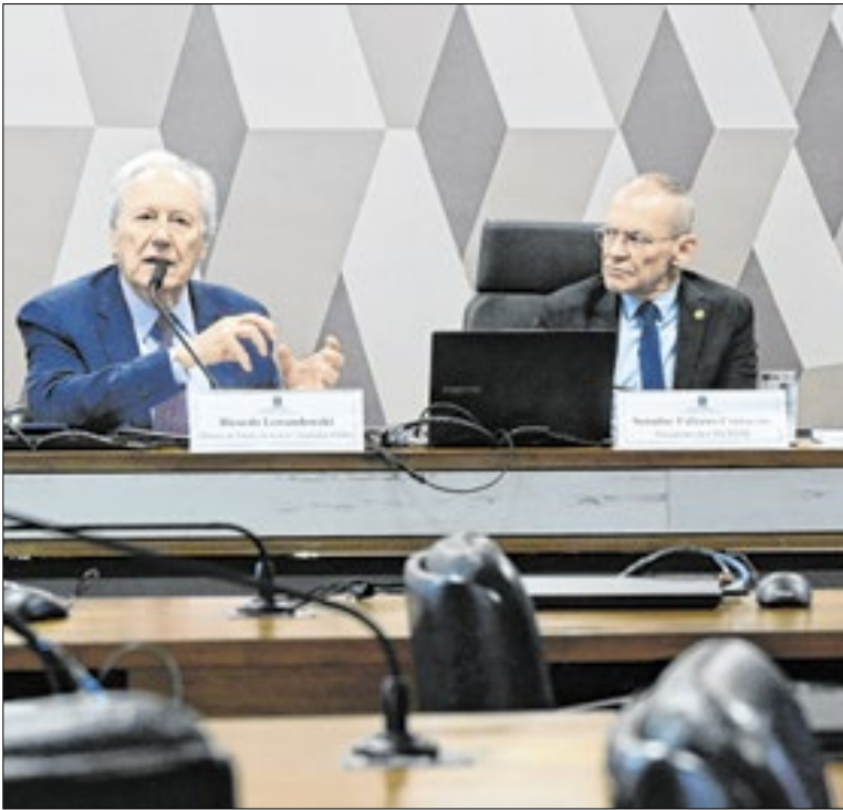
CPI ouviu o ministro da Justiça, Ricardo Lewandowski