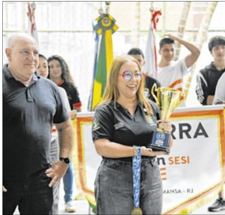
O torneio teve participação de mais de 20 unidades de ensino

Todos os atendimentos do mutirão foram agendados previamente. Ainda nesta semana, o Instituto de Olhos Parolin vai ofertar, também entre esta terça-feira e quinta, 128 exames de OCT (Tomografia de Coerência Óptica), que permite avaliar as estruturas oculares e diagnosticar diversos tipos de doença.