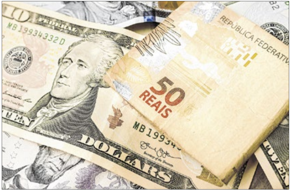
Super Quarta decidirá rumo de juros da economia do Brasil e dos Estados Unidos

Expectativa é de manutenção no Brasil e corte nos EUA, Copom e Fomc se reunirão amanhã