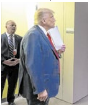
Trump também teceu críticas aos líderes europeus