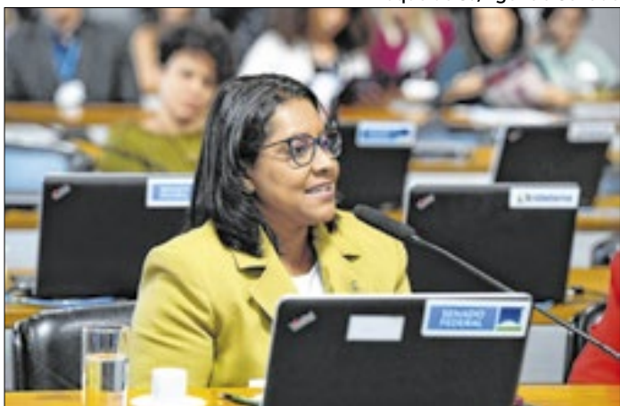
Deputada Gisela Simona (União-MT)