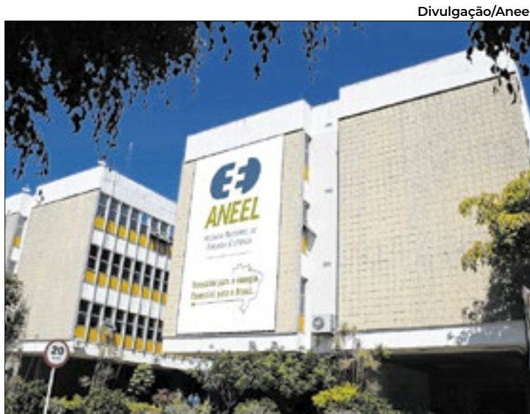
Aneel abre consulta sobre novas regras do fundo de usinas nucleares

A diretoria da Aneel confirmou que a gestão financeira do fundo não é de sua competência, e sim da Autoridade Nacional de Segurança Nuclear (ANSN), mas ressaltou que a receita destinada ao FDES integra o processo tarifário e precisa refletir de forma adequada os custos regulatórios.