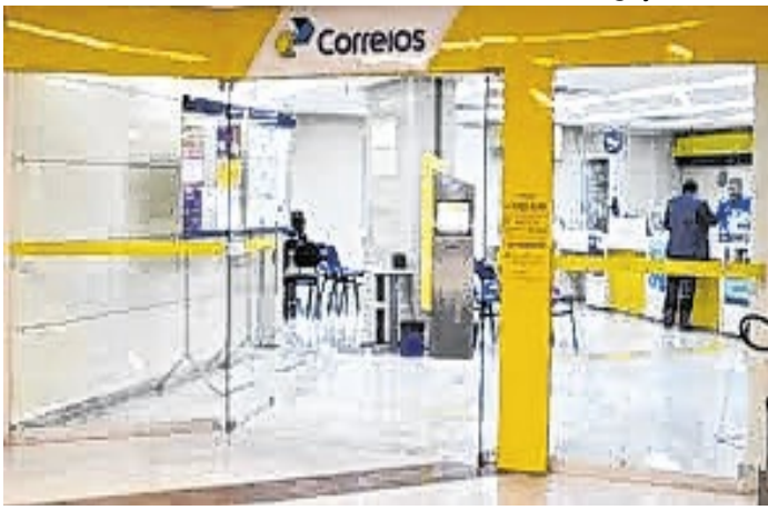
Consulta de dívida pode ser feita nos Correios