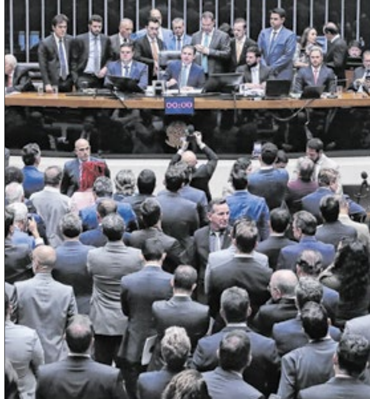
Câmara virou a noite discutindo o PL da Dosimetria

No mesmo pacote, Motta recolocou na agenda os pedidos de cassação de quatro parlamen-