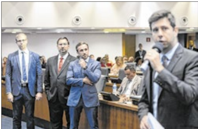
Plenário aprovou projeto em discussão única