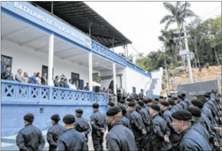
Cerimônia teve a presença do governador Claudio Castro

A Prefeitura de Maricá promove nesta quarta-feira (10), das 10h às 15h, mais uma edição da campanha de doação de sangue, na quadra Escola de Samba União de Maricá. Durante a iniciativa, serão disponibilizados 120 cadastros para moradores que desejam participar, contribuindo com esse ato que salva vidas.