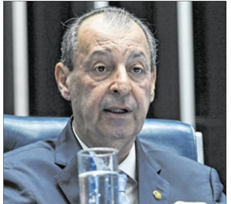
Senador Omas Aziz presidiu a sessão de votação na Casa

O presidente do STF, Edson Fachin, falou em criar um código de ética para os tribunais superiores. Houve reação dos colegas. Se Fachin não conseguir estabelecer tais limites pelo Judiciário, quem sabe talvez haja por aí a possibilidade de a CPI relatada por Alessandro Vieira não ser mais uma a acabar em pizza.