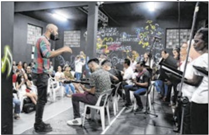
Alunos vão se apresentar nos dias 9 e 10 de dezembro