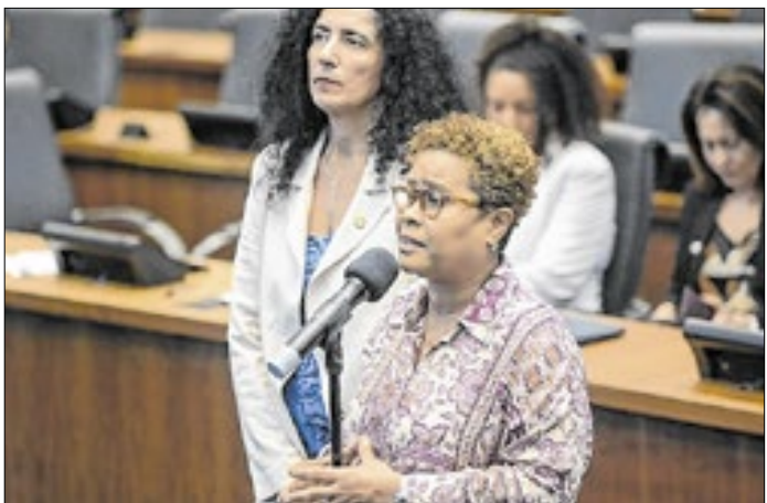
Medida será promulgada pela presidência da Alerj