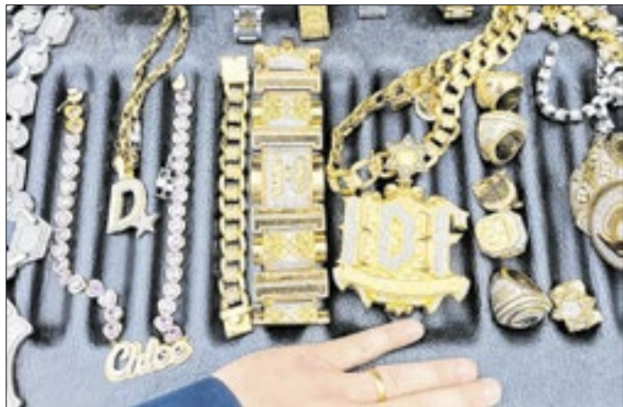
Relógios e joias foram apreendidos com a família