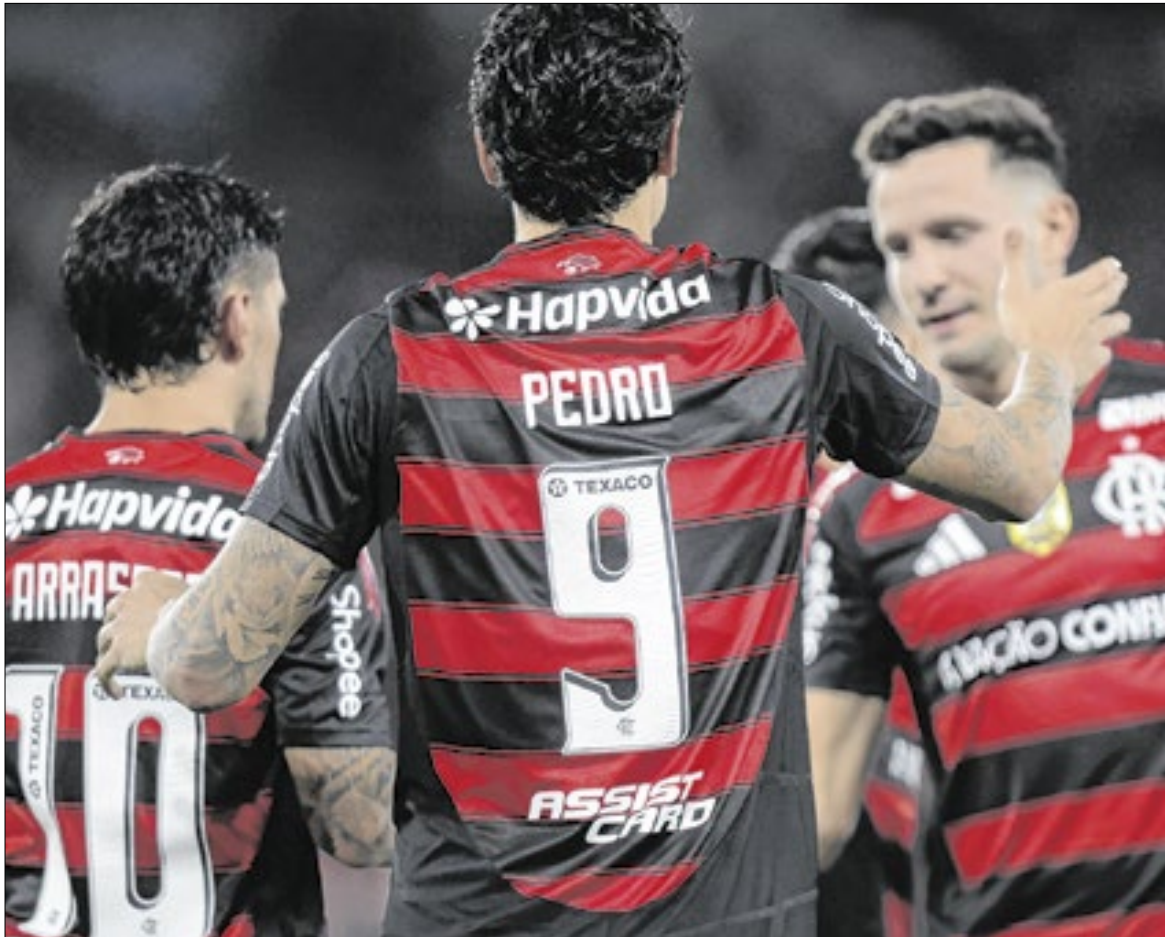
Prioridade da diretoria do Flamengo é encontrar um reserva confiável para Pedro e reforçar o setor do ataque