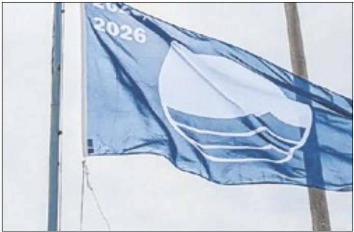
Cabo Frio tem três praias com a Bandeira Azul