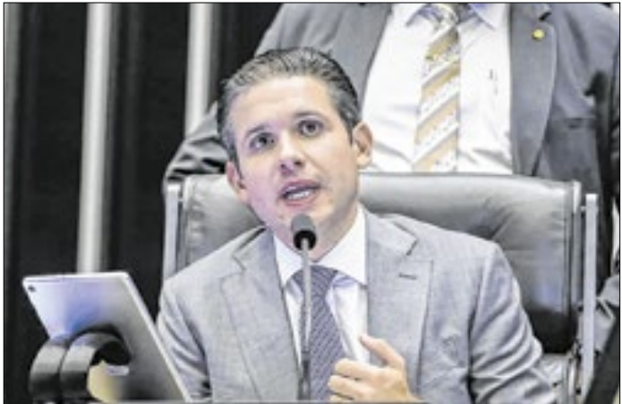
Motta é responsável pela pauta da Câmara