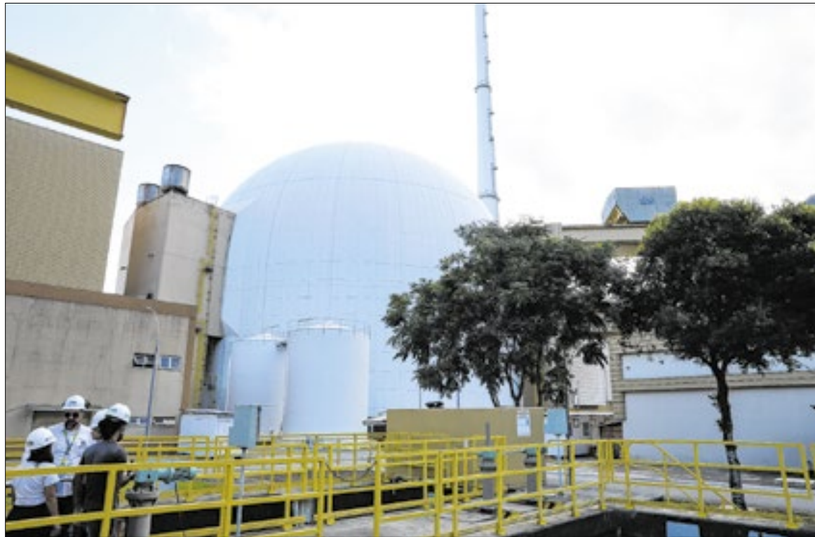
Eletronuclear recebe combustível da INB para a parada programada de Angra 2

A execução dessas ações é fundamental para assegurar a confiabilidade da usina, que desempenha papel estratégico no fornecimento de energia ao país. As paradas programadas fazem parte da rotina do setor nuclear em todo o mundo e no caso brasileiro reforçam o compromisso da Eletronuclear com a segurança, a transparência e a excelência operacional.