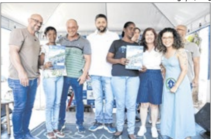
Moradores do Recanto dos Ipês 1 e 2 receberam títulos