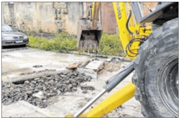
Operação acontece em seis municípios do estado