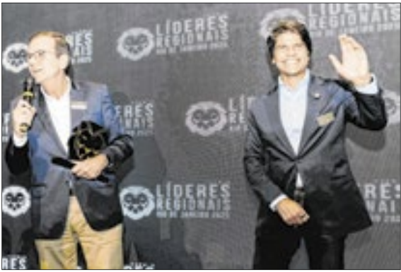
O deputado federal Pedro Paulo foi escolhido como Personalidade Pública. Recebeu a homenagem das mãos do prefeito do Rio, Eduardo Paes