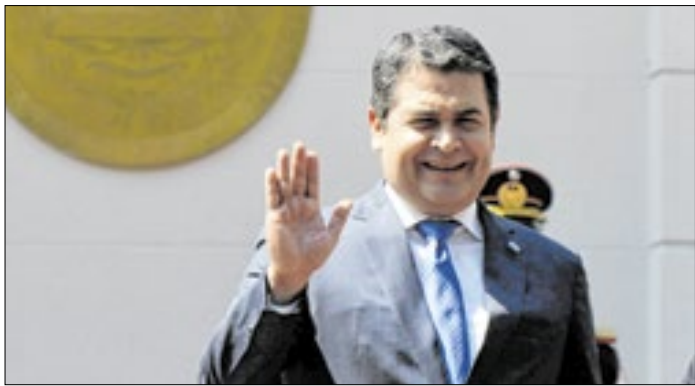
Juan Orlando Hernández teve sua prisão decretada