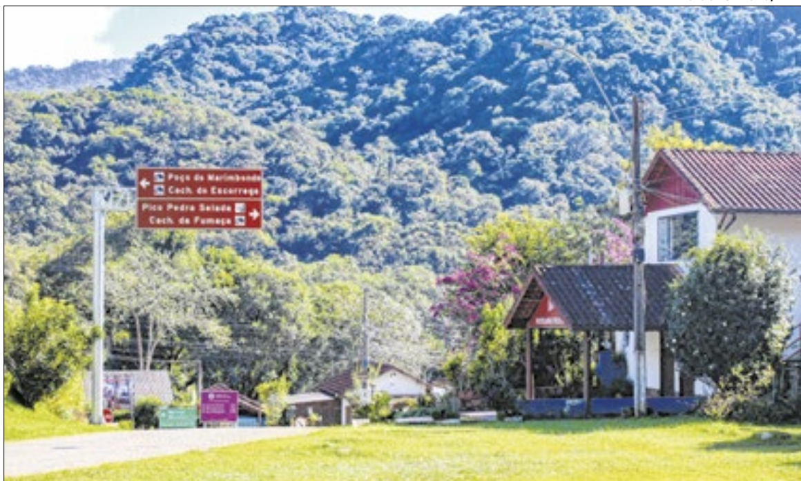
Objetivo é apresentar os projetos de intervenções planejados para região

- As intervenções que estamos apresentando foram pensadas para potencializar tudo o que Mauá representa, com uma natureza preservada, uma cultura forte e um grande potencial turís-