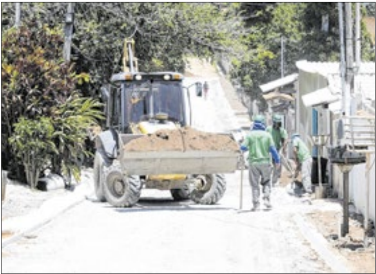
Pavimentação, drenagem e calçamento no bairro Areal

A Prefeitura de Porciúncula publicou o Decreto nº 3.180/2025, que estabelece a proibição temporária da realização de aterros em terrenos urbanos, além do depósito e descarte de resíduos sólidos, entulhos e materiais inertes em áreas públicas ou privadas localizadas na zona urbana do município. A restrição valerá por até dois anos.