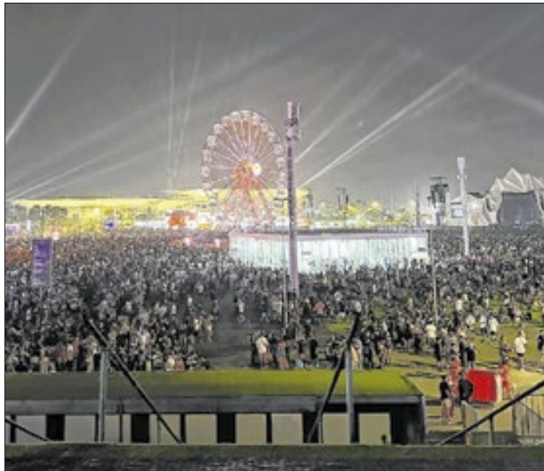
41ª edição do festival acontece em setembro de 2026

A CET-Rio montou esquema de trânsito para o clássico entre Vasco e Fluminense, nesta quinta-feira (11), às 20h, no Maracanã, pela semifinal da Copa do Brasil. As interdições ao tráfego de veículos na região começam a partir das 17h e vão até as 23h59. Outras vias também estarão restritas ao estacionamento.