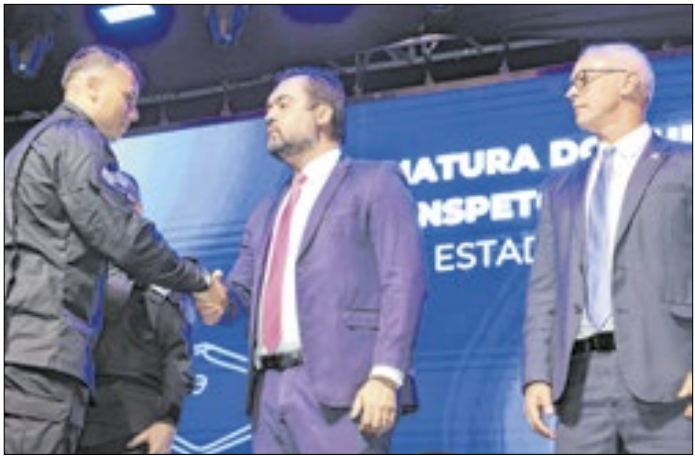
Governador Claudio Castro participou da cerimônia