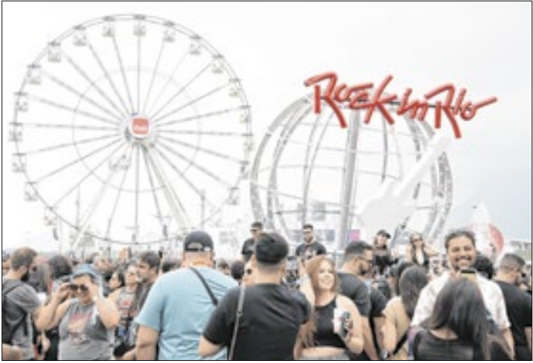
41ª edição do festival acontece em setembro de 2026

Já para o público em geral, começam a partir de 16 de dezembro, até o preenchimento das vagas. O projeto é voltado a crianças de 6 a 12 anos, com atividades no turno da tarde, das 13h às 17h. As inscrições devem ser feitas diretamente na unidade escolhida. Mais informações no site do Sesc RJ.