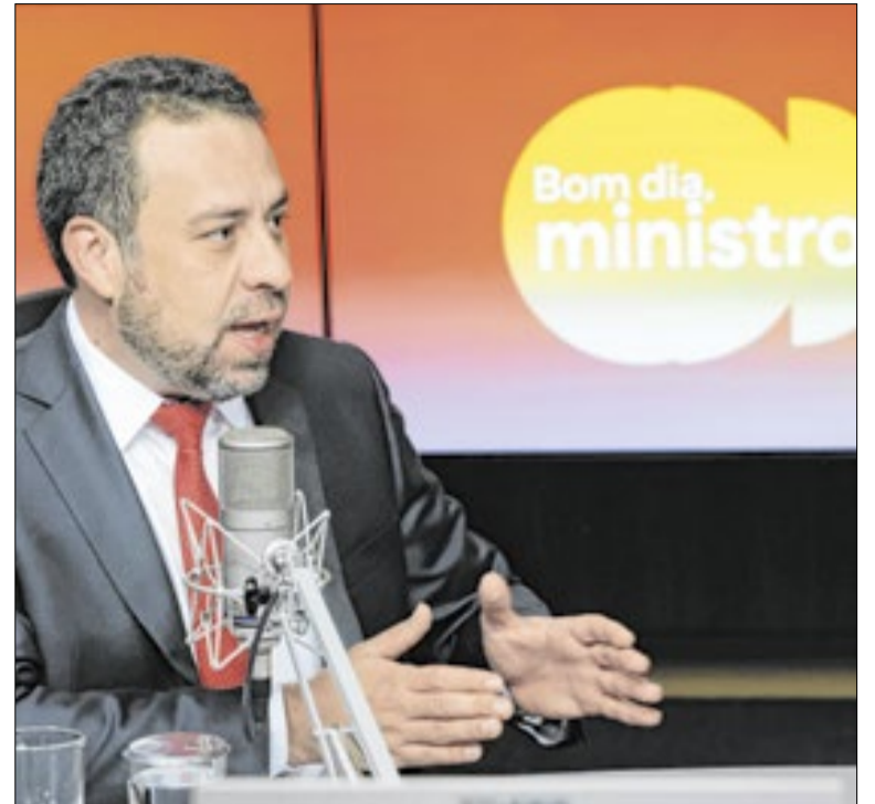
Ministro da Secretaria-Geral, Guilherme Boulos

O aplicativo está disponível para Android e iOS. Assim como os aplicativos comerciais já conhecidos do mercado, o msg.gov possibilita aos usuários enviar e receber mensagens de texto e multimídia, realizar chamadas de voz e vídeo, compartilhar arquivos e documentos, além de criar grupos.