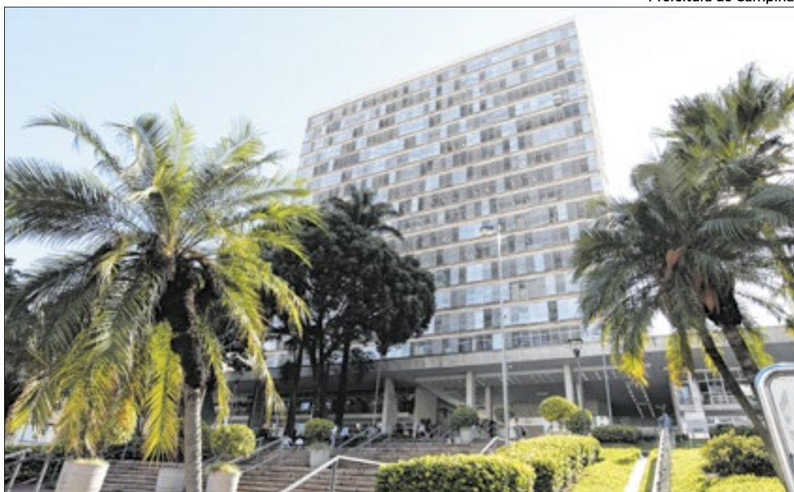
Prefeitura de Campinas

O estado de greve foi aprovado em assembleia geral extraordinária no Paço Municipal na sexta-feira, 5.