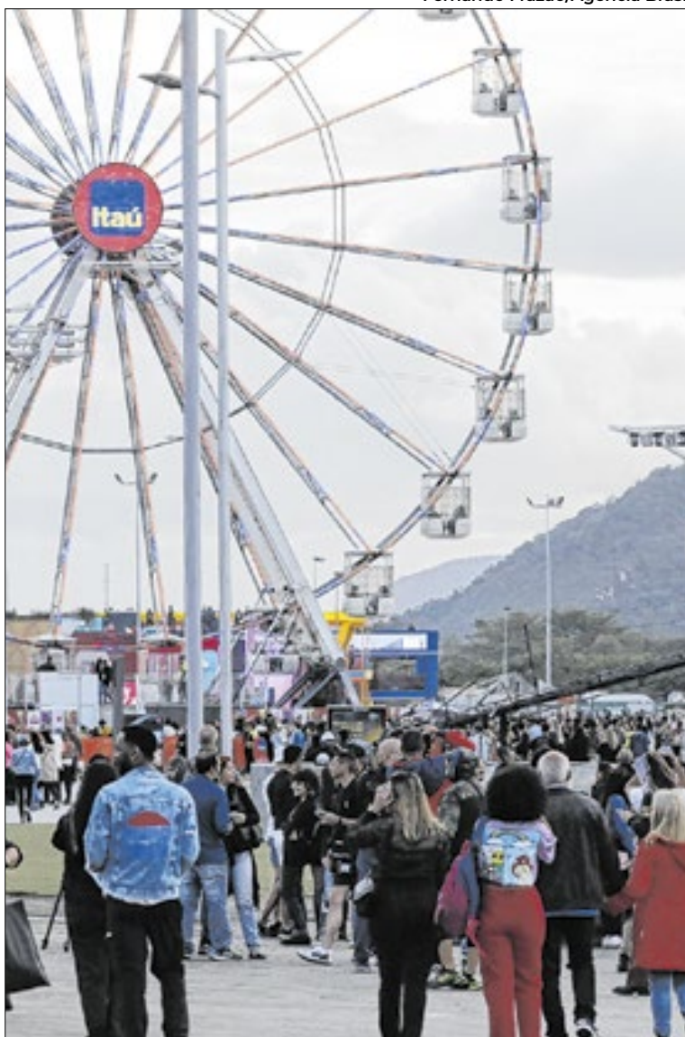
41ª Edição do Rock in Rio acontecerá no mês de setembro de 2026, no Parque Olímpico do Rio de Janeiro

Para 2026, os valores do Rock in Rio Card serão de R$ 795 na entrada inteira, R$ 397,50 na meia-entrada e R$ 675,75 no Ingresso Itaú, destinado a pagamentos com cartões de crédito emitidos pelo Itaú Unibanco Holding S.A. Não haverá cobrança de taxa de serviço. O pagamento poderá ser feito com cartão de crédito ou PIX. Clientes Itaú contarão com 15% de desconto, benefício não cumulativo com meia-entrada, além de parcelamento em até oito vezes sem juros. Nos demais cartões aceitos, o parcelamento será de até seis vezes sem juros. Cartões internacionais não terão opção de parcelamento. Para pagamento via PIX, o comprador deverá utilizar o QR Code exibi-