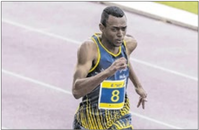
Nascido em Santo André, atleta conquistou três medalhas