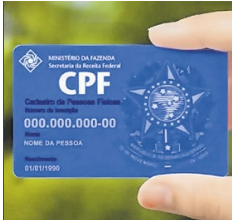
Criminosos estão usando CPF e o nome da Receita Federal

Em setembro, o índice havia marcado 0,48%. Em outubro de 2024, a variação foi de 0,56%. Com esse resultado, a inflação acumulada em 12 meses é 4,68%, a primeira vez, em oito meses, que o patamar fica abaixo da casa de 5%. No entanto, ainda acima do teto da meta.