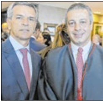
O ministro do STJ Marco Aurélio Bellizze com o des. Mauro Martins