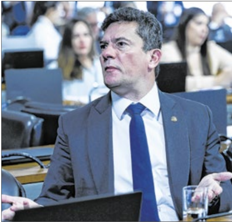
Por aliança com Ratinho Jr., PP veta Sergio Moro

A fria recepção a Flávio anima a centro-direita na busca de uma candidatura alternativa. O grande problema é fazer isso sem ser chamada de traidora por Bolsonaro e seus eleitores — sem estes não dá para ganhar. Há, porém, a expectativa de que bolnaristas aceitem tudo para impedir o PT de ficar no Planalto