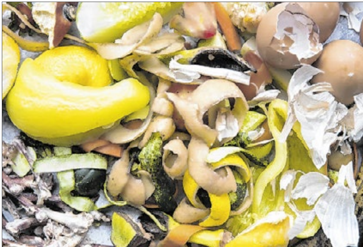
Iniciativa utiliza sobras do Restaurante Universitário e material vegetal do Campus

A equipe trabalha com biodigestão anaeróbia — processo em que microrganismos degradam matéria orgânica sem presença de oxigênio, originando biogás. A partir disso, são examinadas diferentes combinações de substratos, formas de pré-tratamento e condições operacionais para aprimorar o desempenho do sistema.