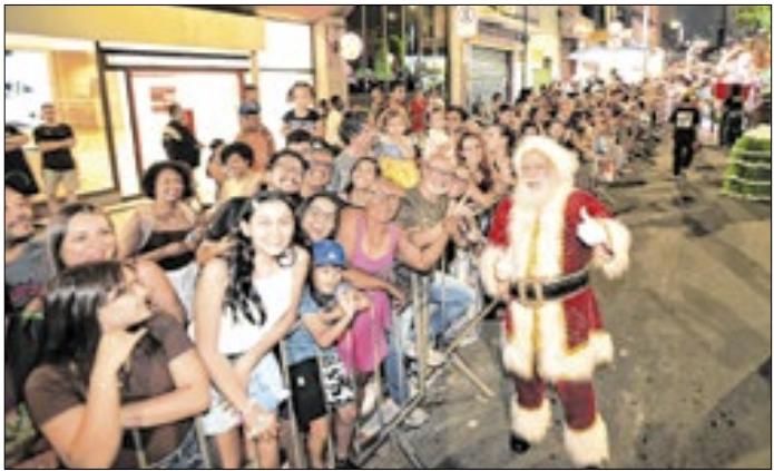
Parada de Natal da Avenida Francisco Glicério