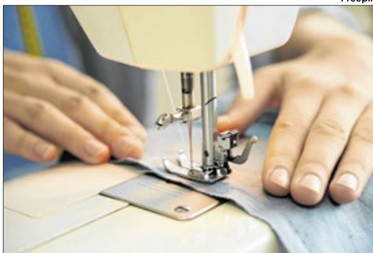
Parte das peças utiliza materiais reciclados da universidade

O desfile reúne 13 participantes do curso de Modelagem e Costura do Momunes, que produziram roupas em alfaiataria para a apresentação. A top model Keila Fogaça fará a abertura do evento. Pelo projeto Mundos Possíveis, serão exibidos itens em crochê e macramê confeccionados por mulheres atendidas por instituições como ONG Luar, Instituto Empodera, comunidade Rosa de Luxemburgo, SOS Sorocaba e a