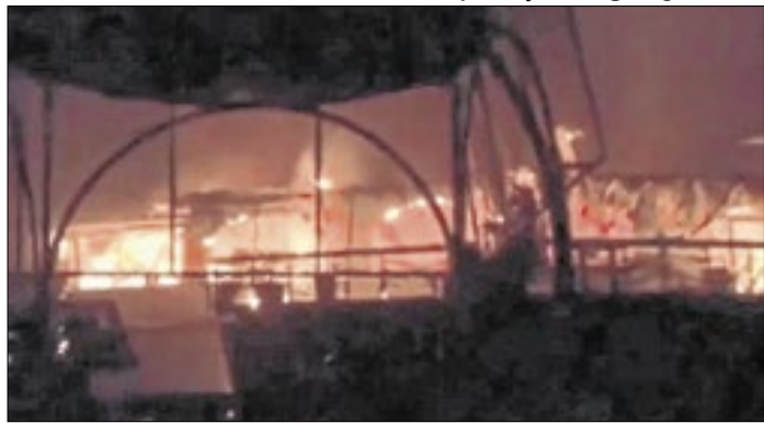
Incêndio está sob investigação das autoridades do país