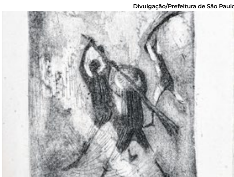
Reprodução de uma das obras roubadas no domingo (7)

volvidos no roubo das 13 obras de arte subtraídas da Biblioteca Mário de Andrade, no centro da capital paulista. O crime mobilizou policiais e desencadeou uma operação para impedir que as gravuras deixem o país. Segundo a investigação, dois homens armados invadiram o prédio histórico por volta das 10h, renderam uma vigilante e também um casal que visitava a exposição em cartaz. Em poucos minutos, os criminosos retiraram das molduras oito gravuras da série Jazz, do francês Henri Matisse, e cinco litografias de Cândido Portinari, incluindo peças da coleção Menino de Engenho. As obras integravam a mostra Do livro ao museu: MAM São Paulo e a Biblioteca Mário de Andrade, uma parceria entre a instituição municipal