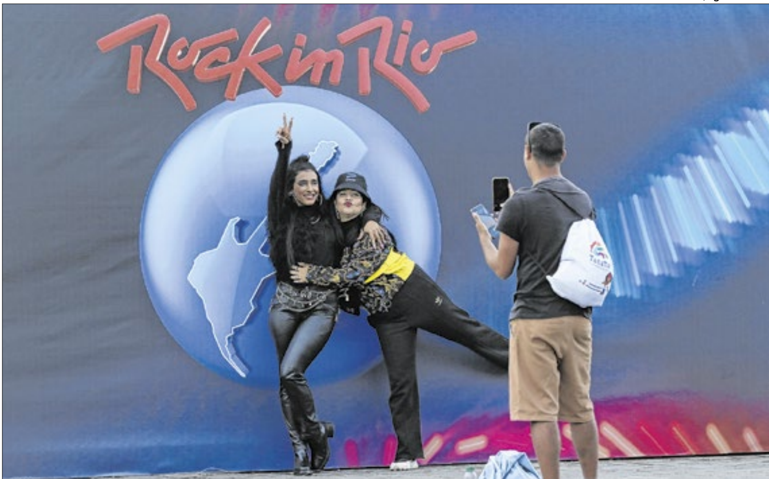
Em 2024, quando o festival celebrou seus 40 anos, 180 mil Cards esgotaram em 2 horas e 4 minutos

Marcado para acontecer na Cidade do Rock, no Parque Olímpico do Rio de Janeiro, o festival será realizado nos dias 4, 5, 6, 7 e 11, 12 e 13 de setembro. A partir desta terça-feira, às 19h, tem início a venda do Rock in Rio Card, que garante presença em um dia do festival antes do anúncio completo da programação. Quem adquirir o Card assegura imediatamente sua vaga e, posteriormente, poderá escolher a data desejada dentro do período de seleção dedicado, com garantia de disponibilidade durante essa janela. Cada Card dá direito a uma entrada no setor Gramado, permitindo circulação livre e acesso a todos os shows e atrações. A organização recomenda que os interessados façam cadastro antecipado na plataforma para agilizar o processo de