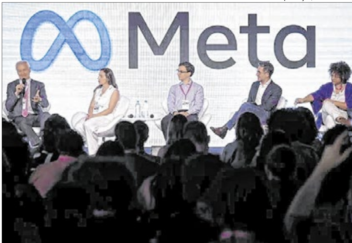
A FecomercioSP defende um marco legal que estimule inovação e proteja direitos