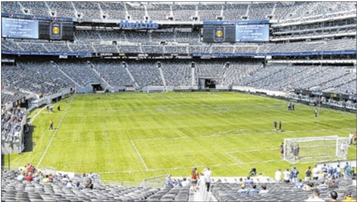
Assim como em 2022, o Brasil vai estrear no estádio da final da Copa. Desta vez, no MetLife Stadium

Na sequência, o time verde-amarelo vai à Filadélfia, onde enfrentará o Haiti no dia 19, uma sexta, às 22h (de Brasília), no Lincoln Financial Field. E encerrará sua participação no Grupo C no dia 24, uma quarta, diante da Escócia, no Hard Rock Stadium, às 19h (de Brasília), em Miami Gardens, nos arredores de Miami.