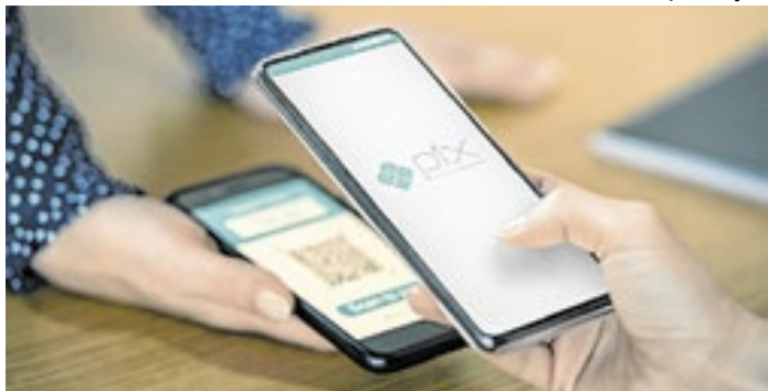
Pix, originalmente brasileiro, se consolida