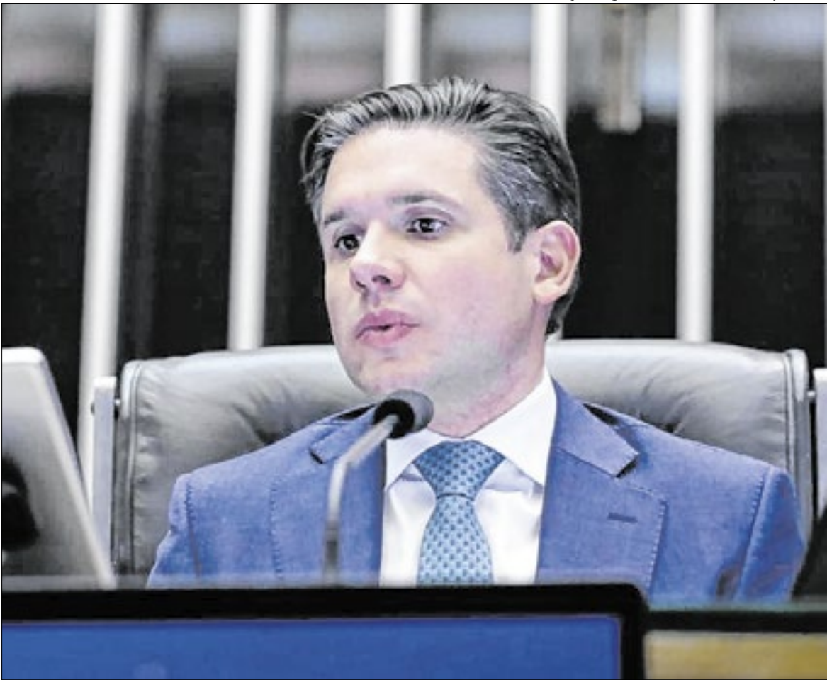
Presidente da Câmara, Hugo Motta, mesmo com retirada de assinaturas mantém projeto

A resposta de Motta é dobrar a aposta: nessa quinta-feira (4), segundo o Federação Nacional dos Trabalhadores e Trabalhadoras do Judiciário Federal e do Ministério Público da União (Fenajufe), ele reafirmou sua ameaça de acelerar a tramitação. Em entrevista ao Estadão/Broadcast na