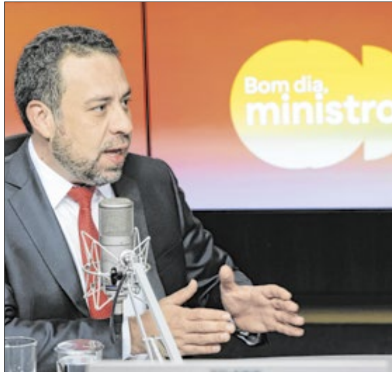
Ministro da Secretaria-Geral, Guilherme Boulos

O aplicativo está disponível para Android e iOS. Assim como os aplicativos comerciais já conhecidos do mercado, o msg.gov possibilita aos usuários enviar e receber mensagens de texto e multimídia, realizar chamadas de voz e vídeo, compartilhar arquivos e documentos, além de criar grupos.