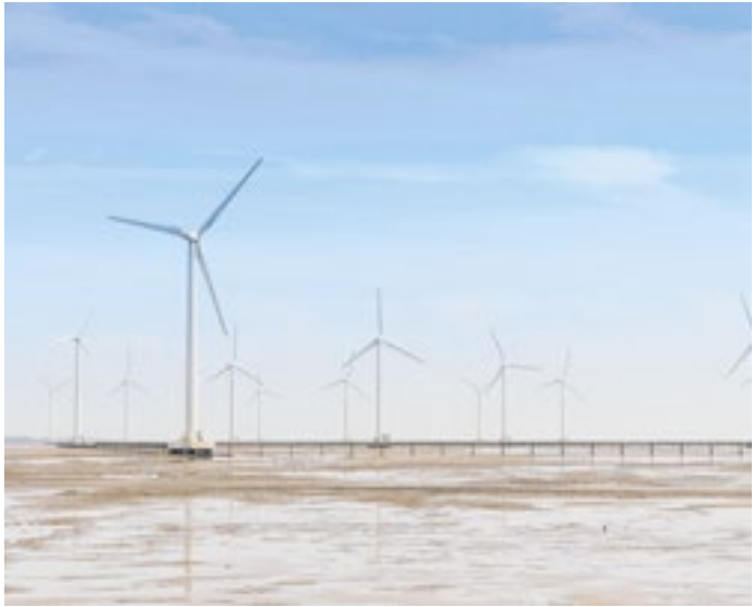
Energia limpa (do oceano) será produzida offshore