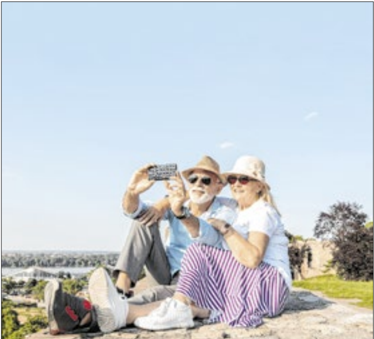
Iniciativa oferece roteiros gratuitos com hospedagem e passeios

Estudantes das Etecs do Centro Paula Souza conquistaram 11 prêmios na Feira Virtual InovaMente 2025, iniciativa do Instituto InovaMente que reúne jovens de todo o país para desenvolver projetos com abordagem STEM (ciência, tecnologia, engenharia e matemática). Entre 103 trabalhos, 52 eram das Etecs.