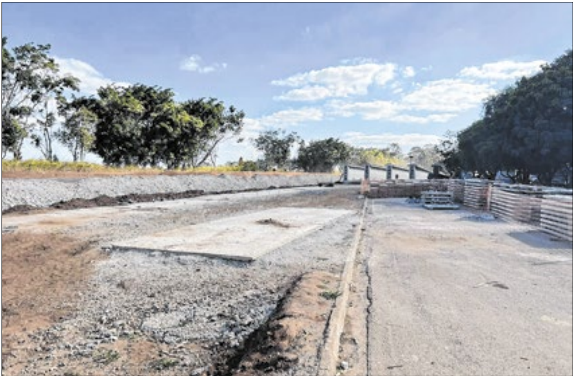
Rodovia Engenheiro Miguel Melhado Campos (SP-324) está em obras desde 2022

Reassentamento O ponto central da reunião é a situação das famílias removidas para a continuidade da obra. O Departamento de Estradas de Rodagem (DER) cadastrou 137, embora o levantamento indique até 139 imóveis lindeiros à estrada. Mas, o número não seria preciso. Das cerca de 137 famílias, 88 constariam como elegíveis, ou seja, preencheriam os critérios da Companhia de Desenvolvimento Habitacional e Urbano (CDHU), como limite de renda e o fato de não possuir nenhum imóvel. As demais seriam consideradas não elegíveis, tendo como motivos, por exemplo, inadimplência anterior na compra de imóveis populares (COHAB, Minha Casa, Minha Vida etc.). Apesar disso, o Departamento de Estradas e Rodagem (DER) se comprometeu a arcar com o reassentamento dessas famílias, conforme o convênio