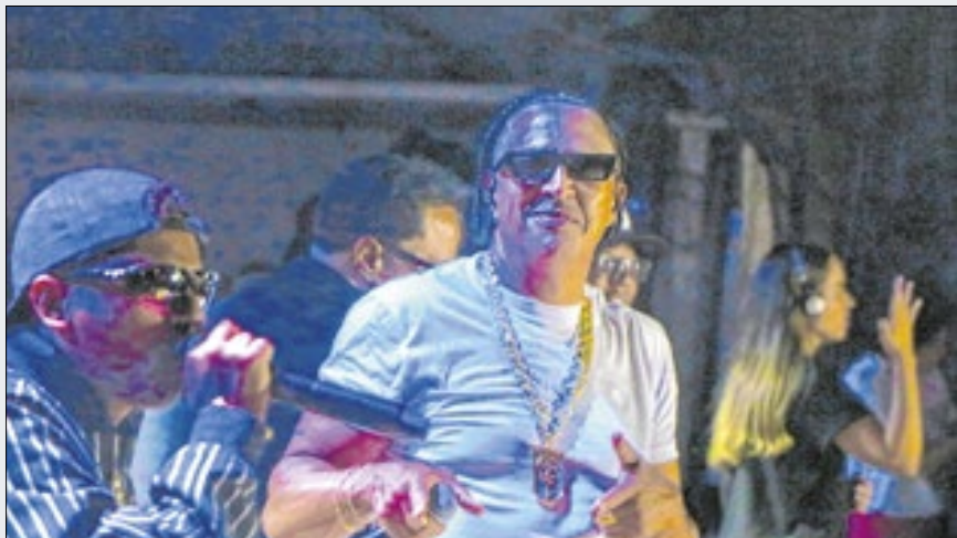
Mano Brown, no Campinas Hip Hop Festival

O Campinas Hip Hop Festival reuniu mais de 25 mil pessoas e se transformou grande ponto de encontro da cultura urbana