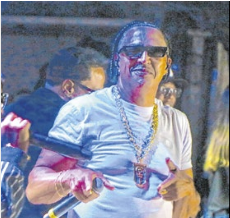
Mano Brown, no Campinas Hip Hop Festival

A inauguração da Vila do Papai Noel, no Largo do Rosário, ganhou destaque especial com a apresentação da Orquestra dos Patrulheiros de Campinas. Formado por jovens atendidos pelo projeto social, o grupo encantou o público que lotou a praça para acompanhar o início da programação de Natal.