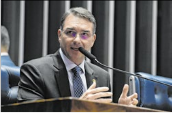
Centrão aposta em desgaste e desistência do senador