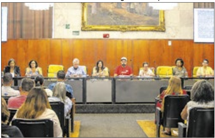
Evento reuniu comunidade escolar