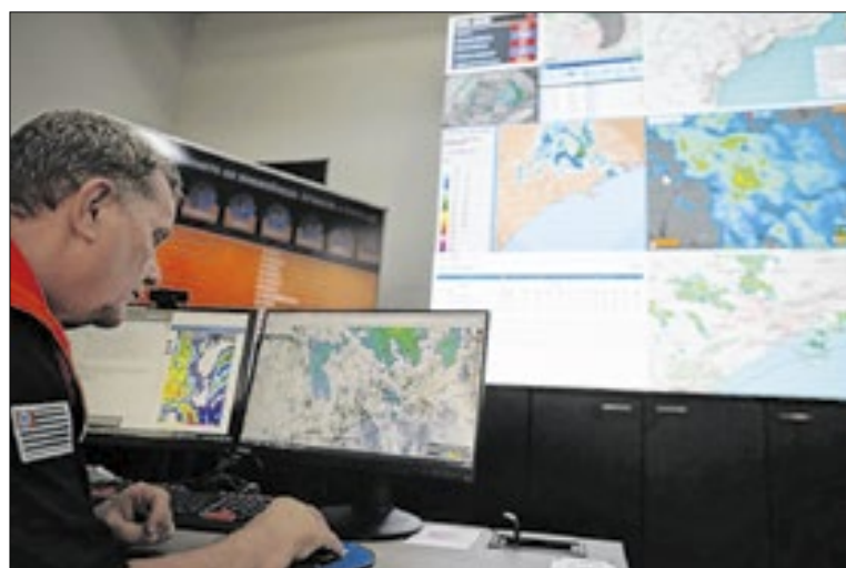
Defesa Civil ativará o gabinete de crise no período mais crítico

A partir de quinta-feira (11), o ciclone começa a se afastar, reduzindo significativamente o risco de temporais. Ainda assim, podem ocorrer rajadas isoladas em áreas como Campinas, Região Metropolitana da Capital, Baixada Santista e Vale do Paraíba. Os acumulados de chuva previstos variam por região: muito alto na Serra da Mantiqueira; alto no Vale do Ribeira, nas regiões de Itape-