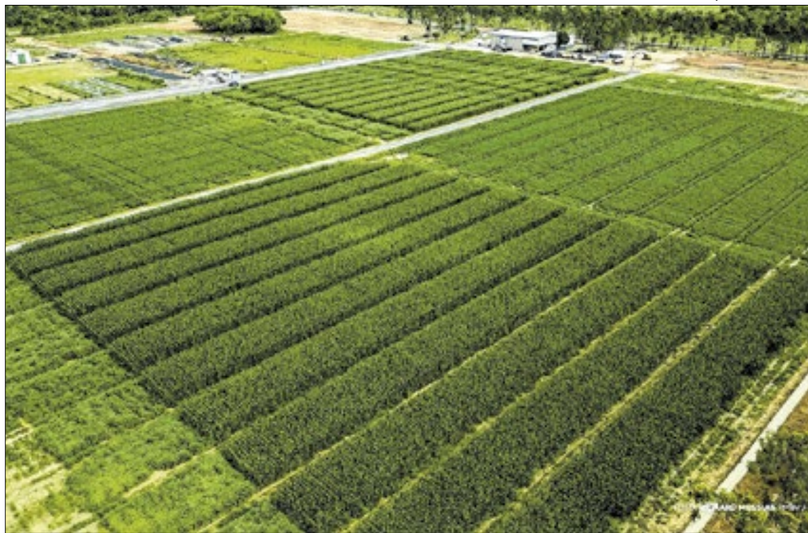
Linha de crédito deve priorizar o atendimento de beneficiários do Pronaf e do Pronamp

No acumulado do ano, o lucro líquido das seguradoras atingiu R$ 29,3 bilhões, alta de 8,4%