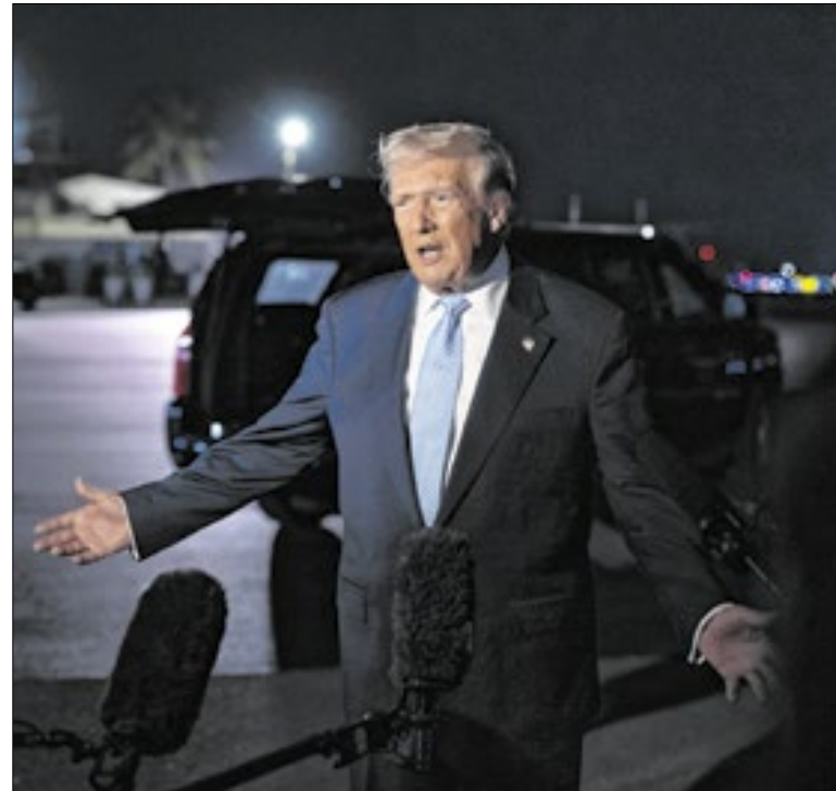
Presidente americano, Trump foi defendido por Alex Karp

O ferro reforça e mantém os dentes afiados, transformando-os em armas altamente eficazes, comparáveis às estruturas dentárias de antigos dinossauros. A presença de ferro abriu novas questões sobre a evolução dentária de répteis e outros animais carnívoros, inclusive de ancestrais extintos há milhões de anos.