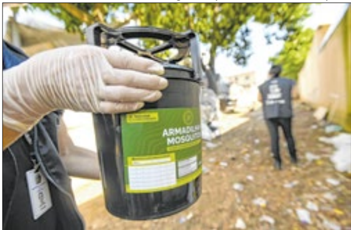
Moradores devem deixar agentes façam manutenção