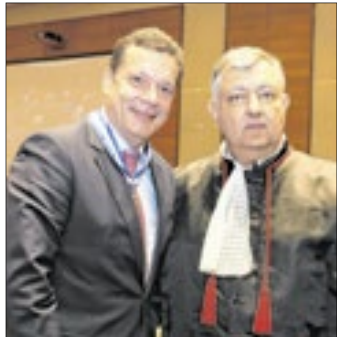
O des. do TRF2 Alfredo Hilário de Souza com o des. Cláudio Brandão, Corregedor-geral do TJRJ