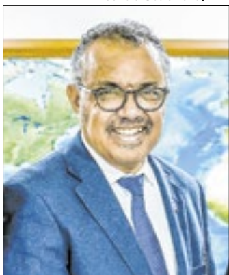
Tedros Adhanom denunciou o massacre