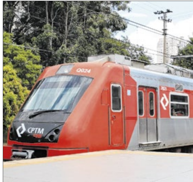
Estações da companhia cadastram estudantes

A 1ª madrugada de operação 24 horas nas linhas operadas pelo Metrô registrou a entrada de 13,8 mil passageiros em 66 viagens realizadas no período, entre 0h e 4h40. A Linha 3-Vermelha registrou o maior movimento, (7,5 mil embarques), seguida das linhas 2-Verde (3,8 mil) e 1-Azul (2,6 mil).