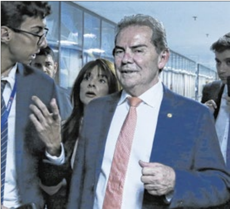
Para Paulinho da Força, chance de aprovação seria “zero”

Enquanto isso, uma insistência na candidatura de Flávio poderia ser o caminho mais fácil para Lula talvez obter uma inédita, para ele, vitória presidencial ainda no primeiro turno. Na simulação que o Datafolha fez com o senador como o nome principal da direita para a disputa em 2026, Lula teria 49%, e ele 22%.