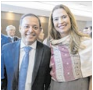
O prefeito de Niterói, Rodrigo Neves, com a vice-prefeita Isabel Swan