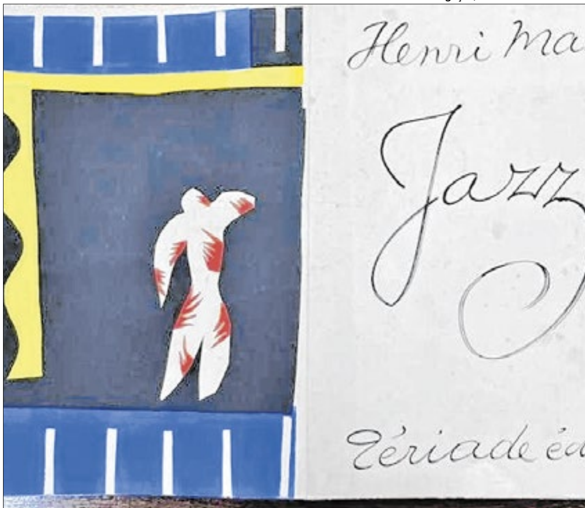
Uma das obras de Matisse roubada da Biblioteca Mário de Andrade, em São Paulo

A Polícia Civil de São Paulo identificou os dois suspeitos en-