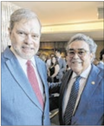
O ministro do STF Dias Toffoli; com o ministro aposentado do TST Aloysio Corrêa da Veiga