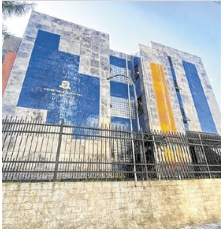
Secretaria objetiva planejamento para 2026