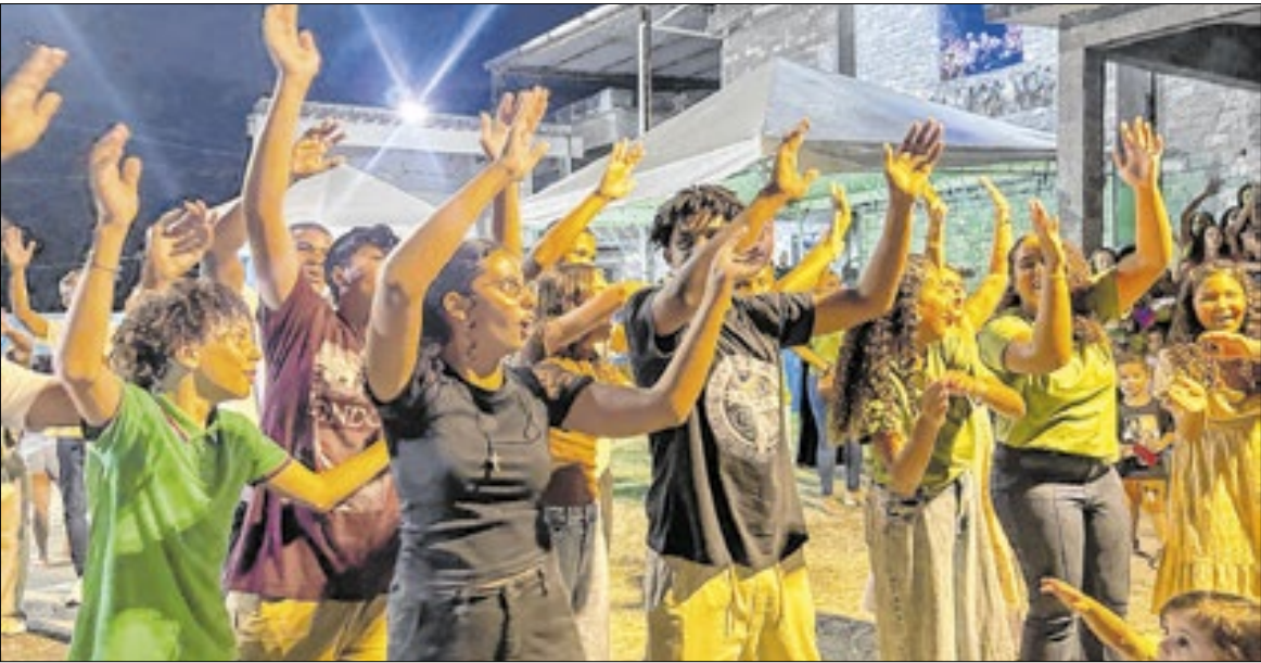
Celebração começou na sexta (5) e só terminou ao fim do domingo (8)

Festejos conseguiram contar com participação da comunidade