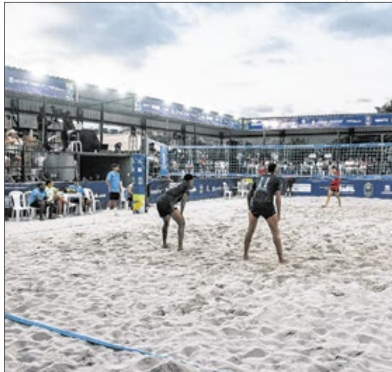
Evento ocorreu na Arena Barra Beach, no bairro Vila Helena

Medida semelhante já foi colocada em prática na capital do estado do Rio de Janeiro, como parte do projeto “Aqui Tem Memória”, que disponibilizou QR Codes em pontos turísticos. O projeto teve início no centro da cidade e se expandiu para as zonas sul e norte do Rio de Janeiro.