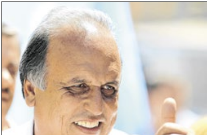
Pezão tira do papel uma das promessas do governo