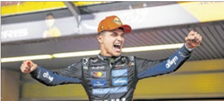
Lando Norris se tornou o 35º piloto campeão da Fórmula 1

Apesar de não ter vencido o Grande Prêmio de Abu Dhabi, o piloto britânico da McLaren chegou em terceiro e conquistou a pontuação necessária para se tornar campeão mundial da Fórmula 1 pela primeira vez.