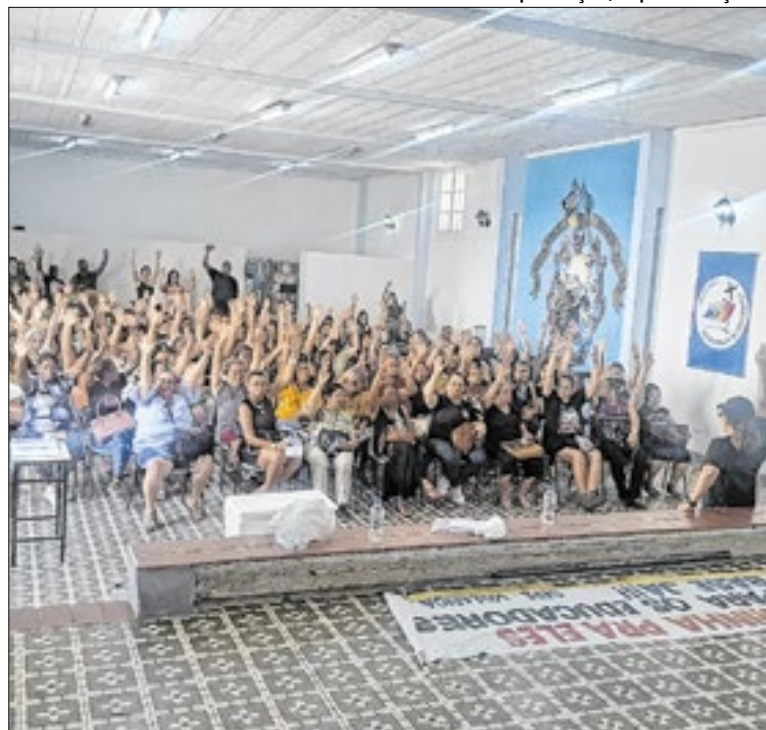
Categoria decidiu por greve em assembleia na última semana

Os cursos integram o programa “Empregos Azuis – Um Mar de Oportunidades”, que tem como objetivo fortalecer a empregabilidade local, oferecendo qualificação profissional focada em áreas estratégicas da economia angrense, especialmente ligadas ao setor marítimo, industrial e de serviços.