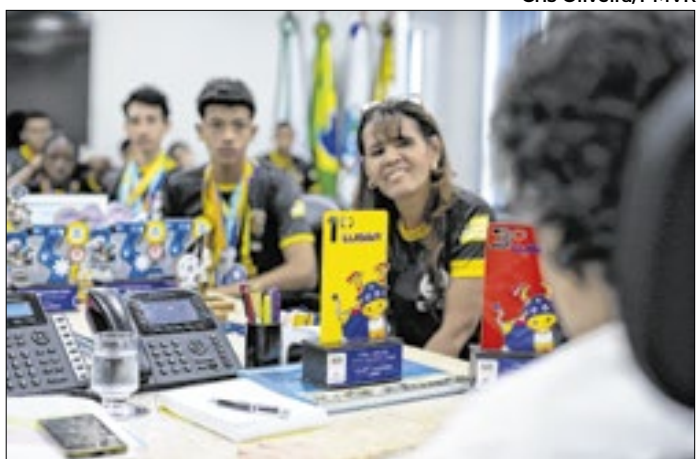
Equipe de robótica Thunderbots visitou prefeito