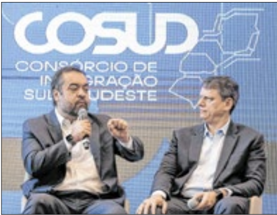
O governador do Rio, Cláudio Castro, com o governador de São Paulo, Tarcísio de Freitas