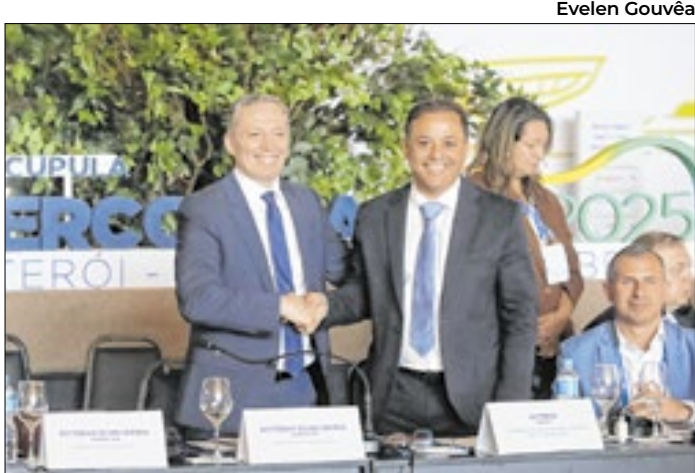
Prefeito de Niterói vai comandar rede da América Latina