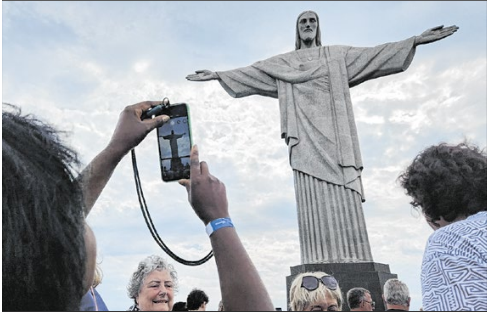
Grupo do quilombo de Lídice-RJ que foi ao Cristo contou com crianças, adolescentes e adultos