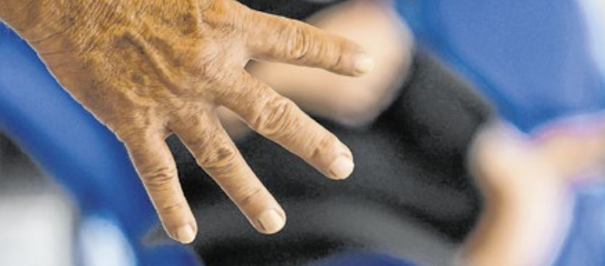
Especialista diz que realidade dos crimes de ódio contra a mulher é diária e avassaladora

Os números de crimes de ódio cometidos contra mulheres estão em ascensão a cada ano no Brasil. Dados do Fórum Brasileiro de Segurança Pública indicaram que, somente nos sete primeiros meses de 2024, os índices de feminicídio ba-