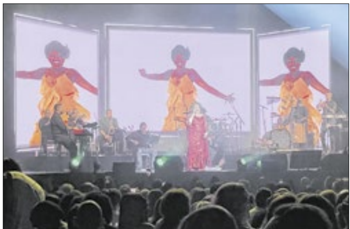
Alcione faz um grande espetáculo