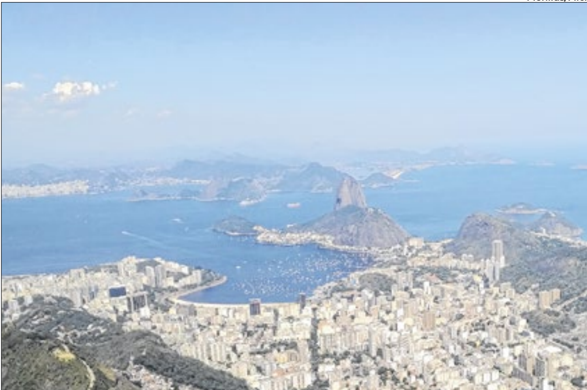
Visitantes relatam experiência única ao chegarem no topo do Morro do Corcovado