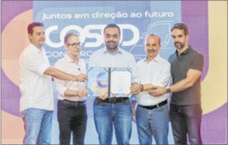
Governadores do Sul e Sudeste com a carta compromisso

A prefeitura de Rio Bonito realiza obras no Parque Municipal da Caixa D'Água com recursos oriundos do governo federal. Entre as principais, está a construção do muro de contenção na Rua Cortines Laxes, para prevenir riscos e melhorar a infraestrutura local e da rede de saneamento básico.