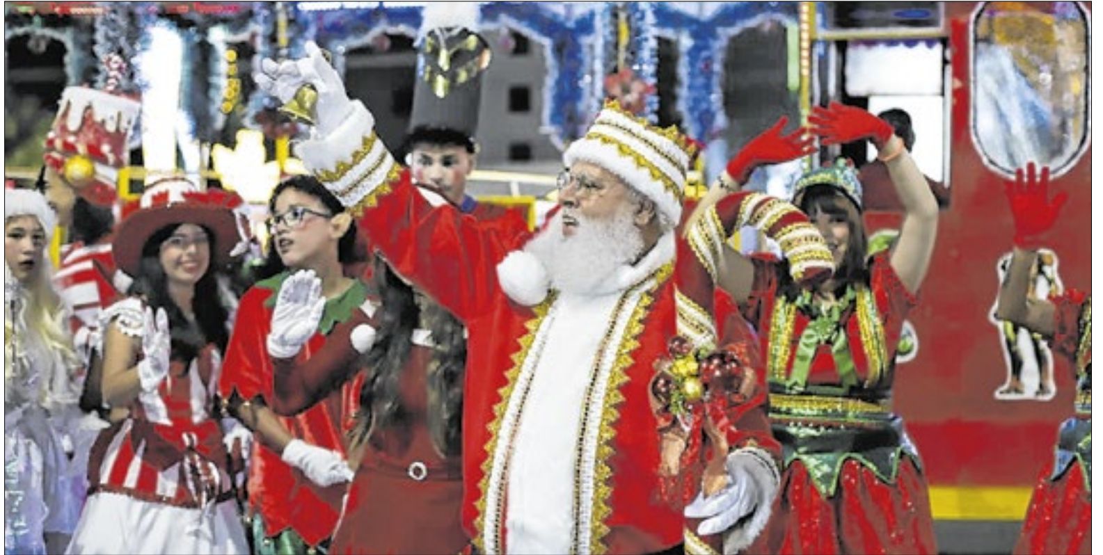
Cerimônia contou ainda com a abertura da Casinha do Papai Noel

Por volta das 19h, o momento tão esperado pelas famílias, principalmente as crianças: a chegada do Papai Noel, que, a bordo de um trenzinho e acompanhado das noelitas (assistentes) e de personagens fantasiados, percorreu ruas no entrono da praça, incluindo uma parada na fonte luminosa para a queima de fogos de baixo ruído, e seguiu até a Praça Brasil, onde foi recepcionado ao som da Fanfarra da Apae-VR (Associação de Pais e Amigos dos Excepcionais