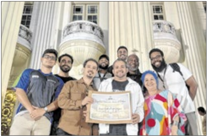
O AfroReggae promove a cidadania por meio da arte