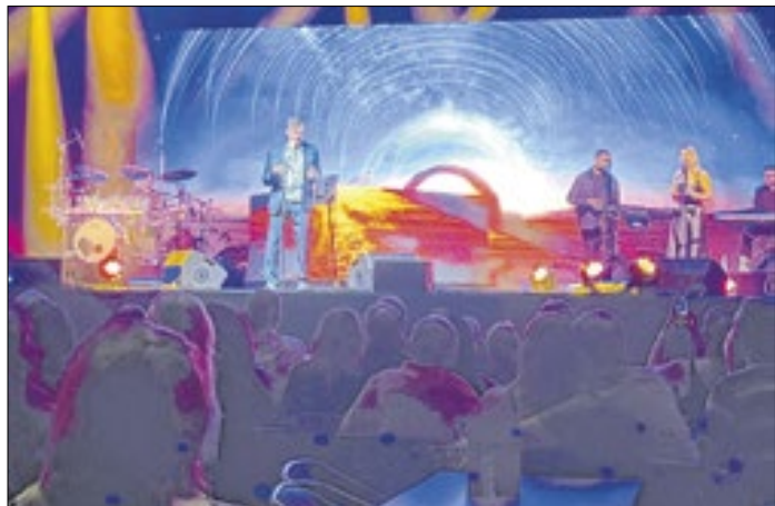
Flavio Venturini faz um show de hits