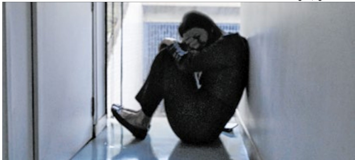
Maioria dos casos de violência partem de familiares ou parceiros íntimos da vítima

teram recorde de crescimento em um período de nove anos, apresentando 1.492 casos. Dados do Ministério da Justiça e Segurança Pública, registrados de janeiro a setembro deste ano, indicam que mais de mil mulheres já foram vítimas de homicídio motivado pelo ódio ao gênero.