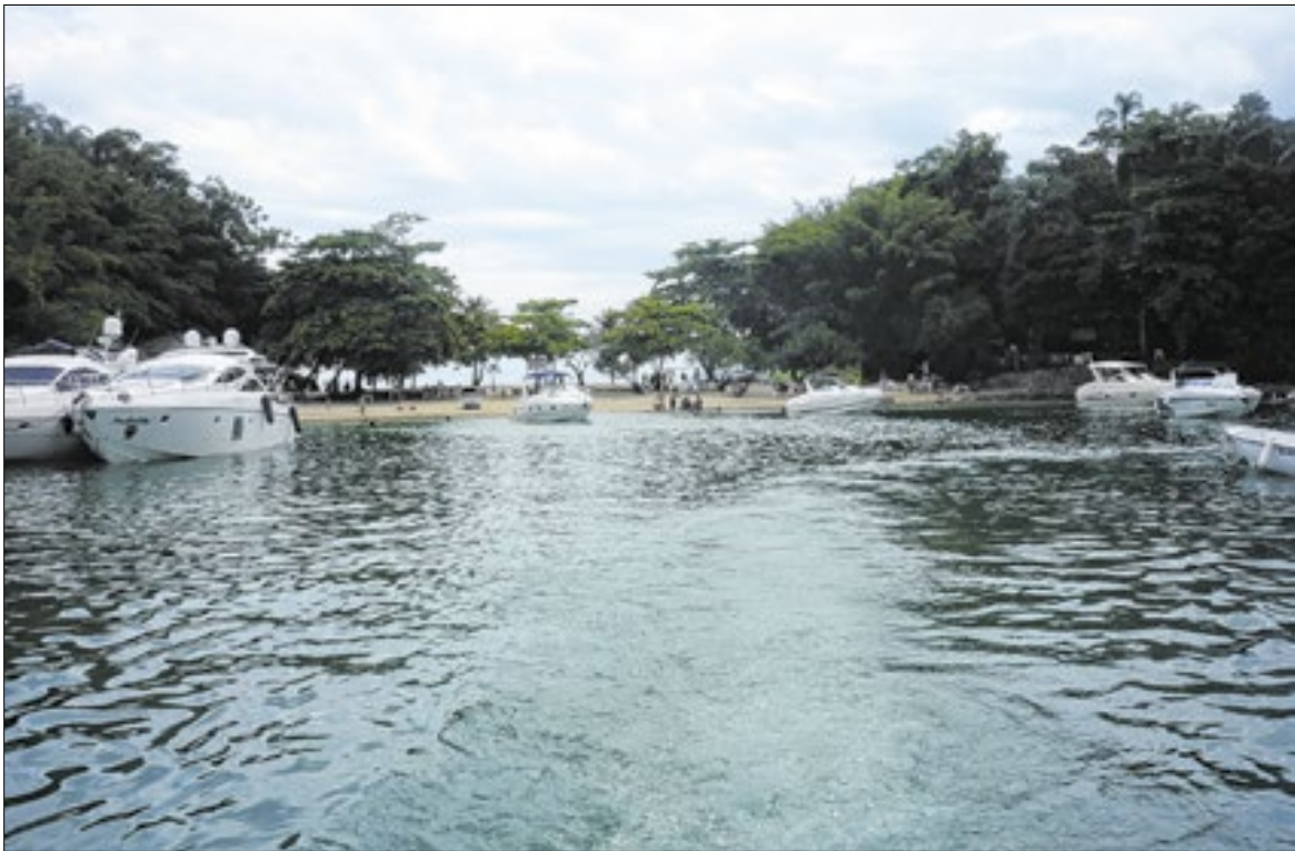
Turistas terão que pagar para visitar ilhas e município de Angra dos Reis, na Costa Verde

O Correio Sul Fluminense fez a leitura do texto legal referente a TTS e, embora nenhuma secretaria municipal tenha sido apontada conforme afirmado pelo Deputado, o artigo 9º estabelece que a receita da taxa poderá ter dois destinos: o custeio de atividades do Instituto Municipal do Ambiente