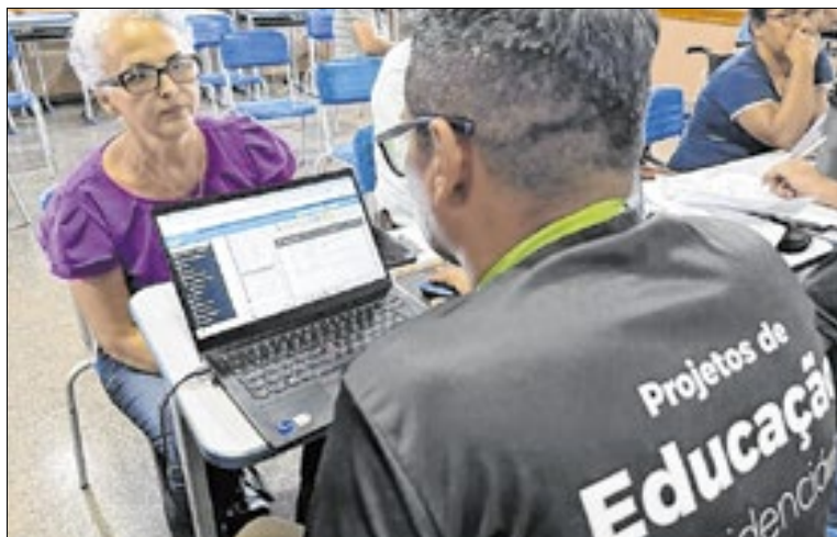
Governo de Rondônia

Mais do que uma avaliação técnica, o ISP avalia um conjunto de indicadores que refletem a qualidade da gestão, incluindo a si-