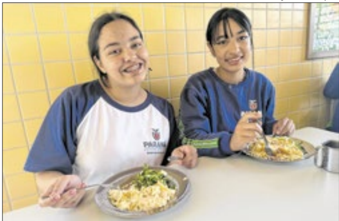
Estado adquiriu 5 mil toneladas de alimentos orgânicos