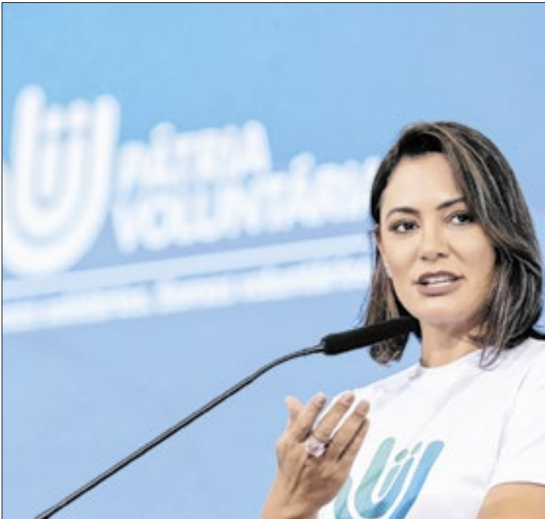
Michelle teria desempenho melhor, segundo Datafolha

Erros cometidos pelo Ministério Público do Rio impediram o avanço do processo e anularam provas. Mas isso não impede a veracidade do que foi apurado nas investigações, como o fato do assessor Fabrício Queiroz ter quitado com dinheiro vivo contas da família de Flávio. A grana não saíra da conta do 01.