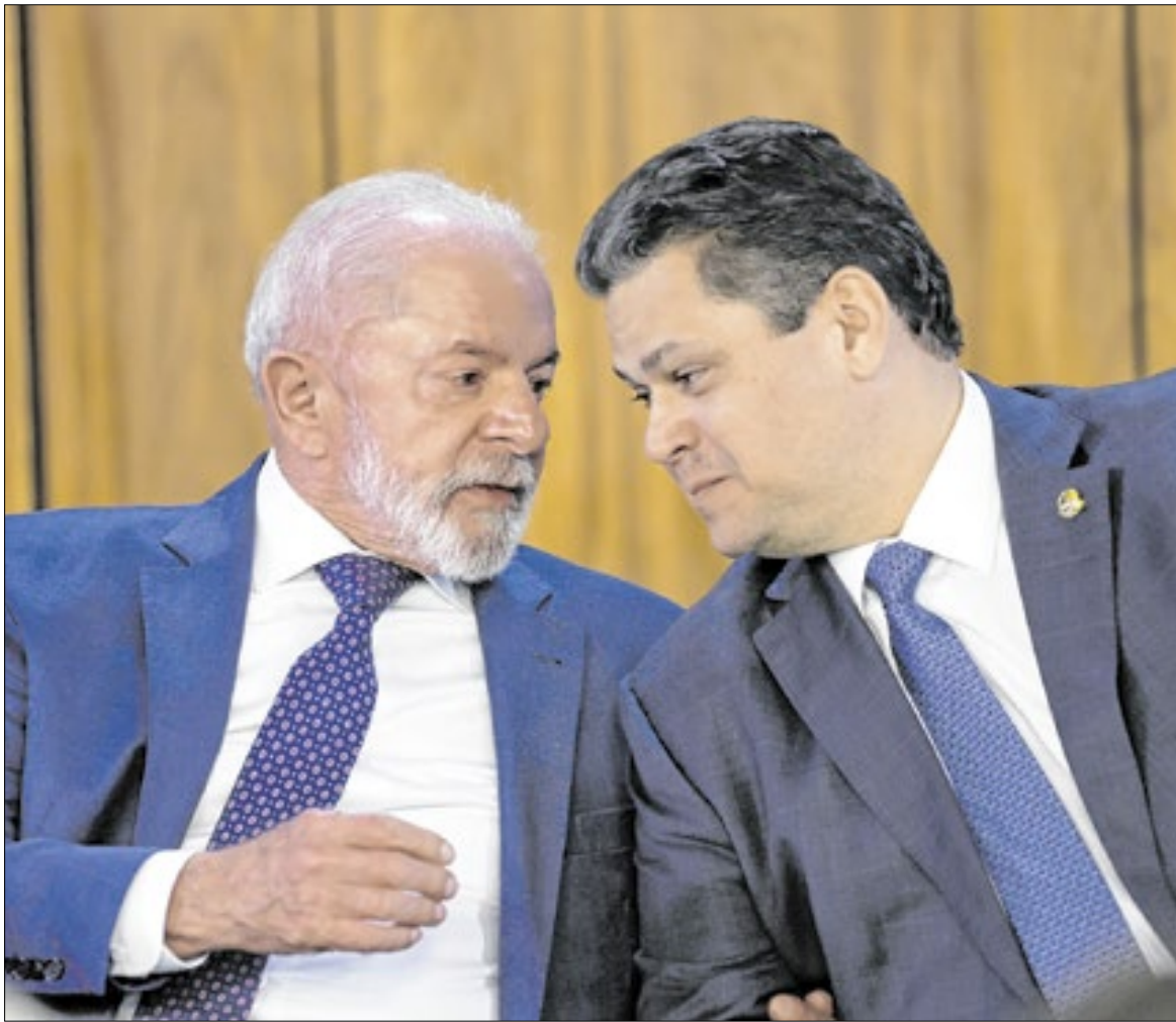
Alcolumbre acena bandeira branca para Lula

A mudança de postura de Alcolumbre, ao elogiar Lula em um evento público, foi interpretada como um recuo calculado. Para o sociólogo Clésio Arruda, o tensionamento dos últimos dias era difícil de se sustentar. “Sus-