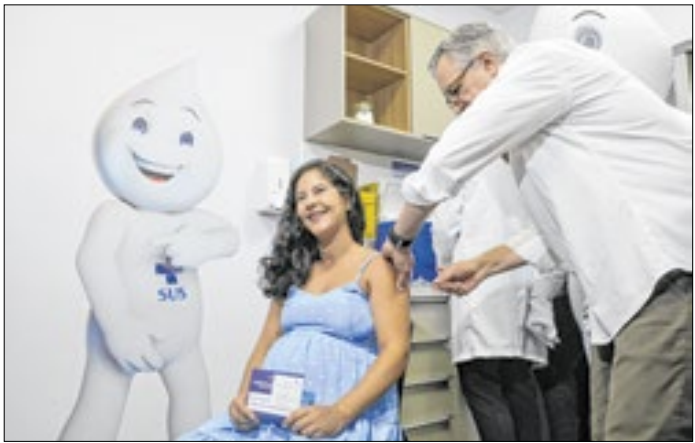
Ministro alerta gestantes para proteção