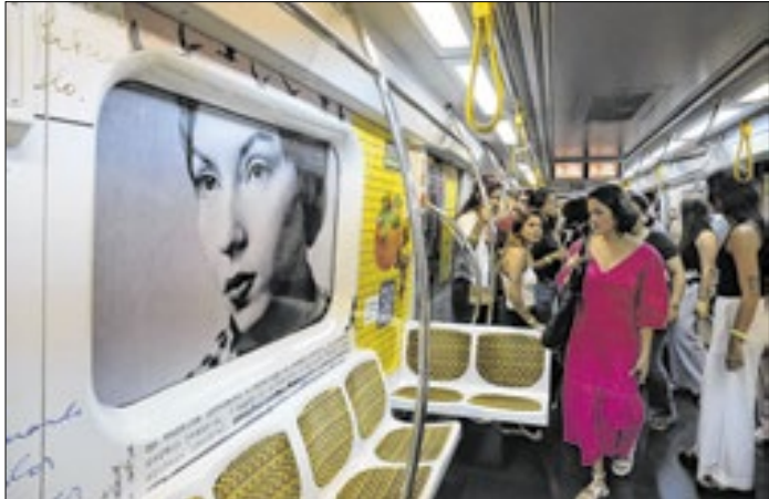
Decisão inclui a 1-Azul, 2-Verde, 3-Vermelha e 15-Prata