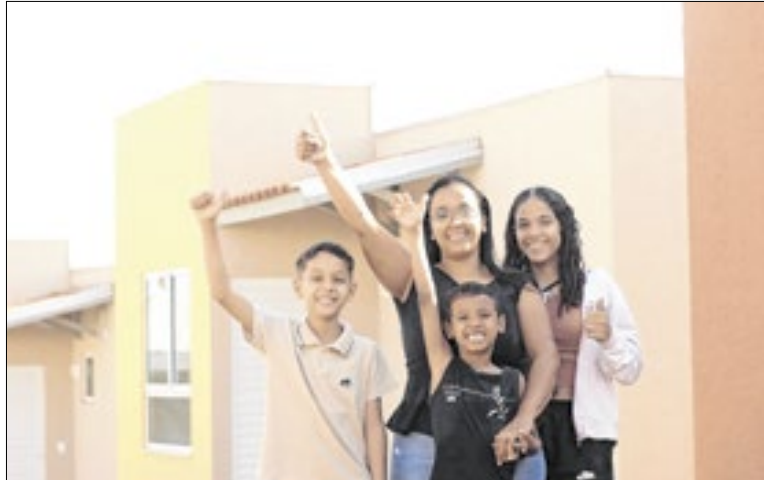
Programa de moradia a custo zero é inédito em todo o país

“A cada casa que chega às mãos de uma família, entregamos também segurança, dignidade e um novo horizonte. O impacto desse programa emociona e nos impulsiona a seguir avançando, levando transforma-