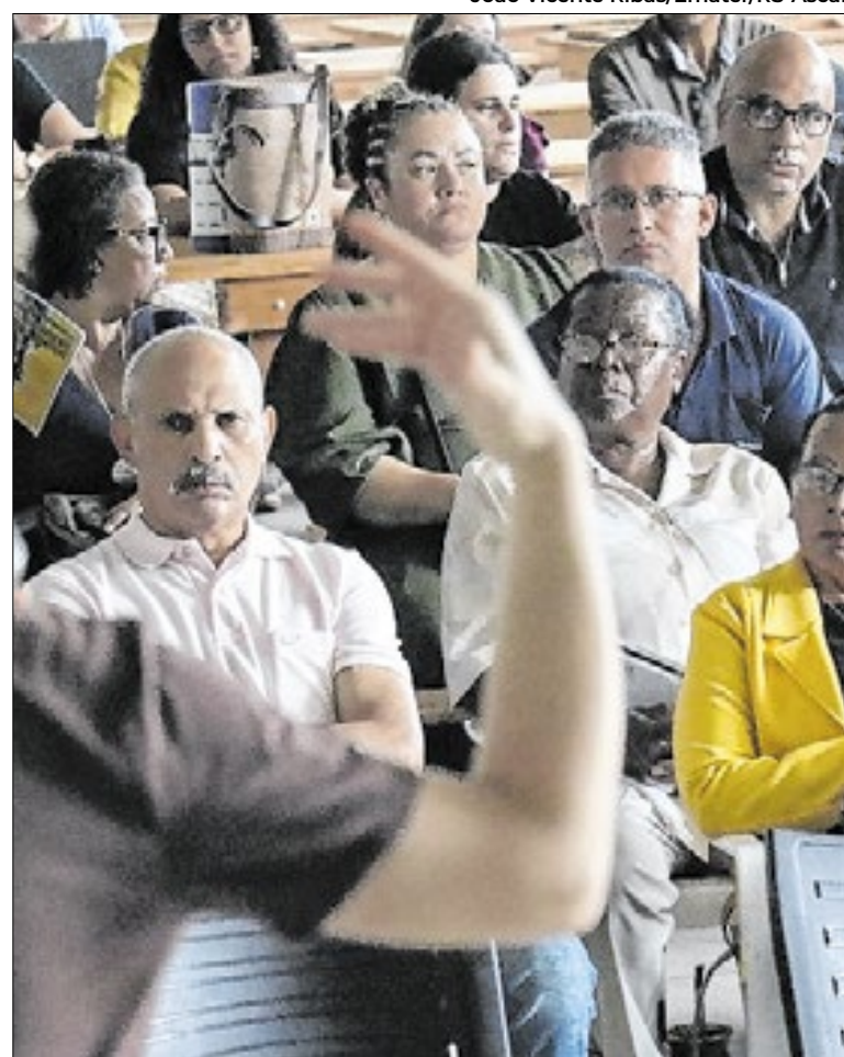
O livro “Comunidades Quilombolas do Litoral” foi apresentado

O registro de bens culturais imateriais no Rio Grande do Sul está previsto na Lei nº 13.678/2011, atualizada pela Lei nº 14.155/2012, e regulamentada pelo Decreto nº 54.763/2019. Mesmo com o marco legal estabelecido, antes de 2023 nenhum registro foi oficializado. Atualmente, o Estado conta com cinco bens imateriais reconhecidos. O primeiro foi o Sistema Cultural e Socioambiental da Erva-mate Tradicional.