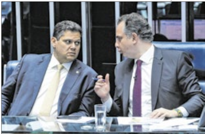
Alcolumbre quer Pacheco no STF