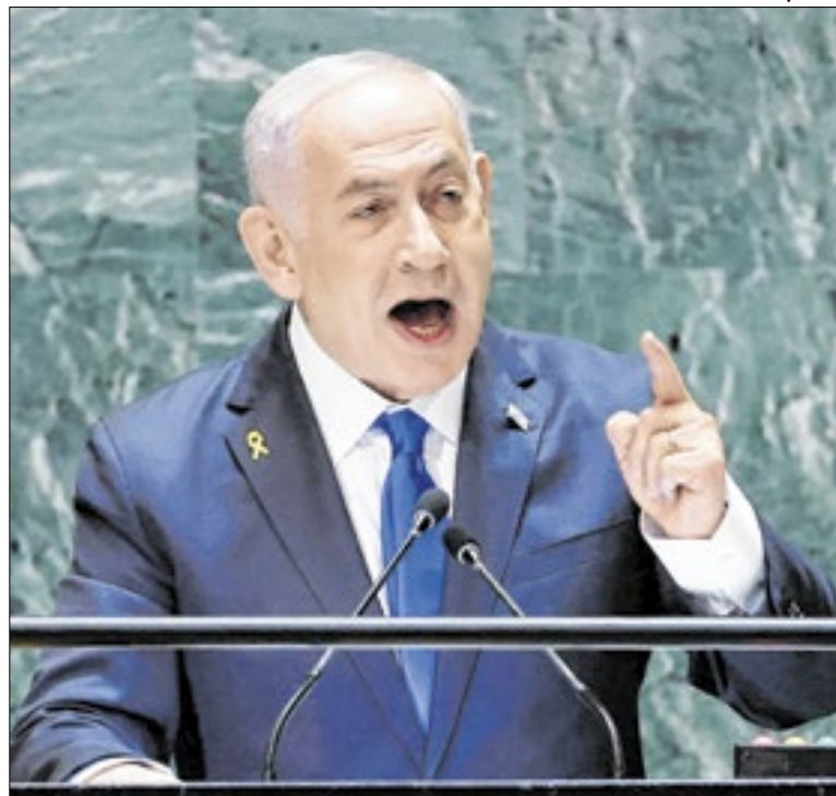
Afirmção de Binyamin Netanyahu esquentou polêmica

“Há uma tentativa, mas a situação está sob controle. Uma grande parte do Exército ainda é leal e estamos assumindo o controle da situação”, disse Bakari. Ele afirmou que os soldados que tentaram o golpe só obtiveram controle da TV estatal, cujo sinal foi cortado mais tarde na manhã de domingo.