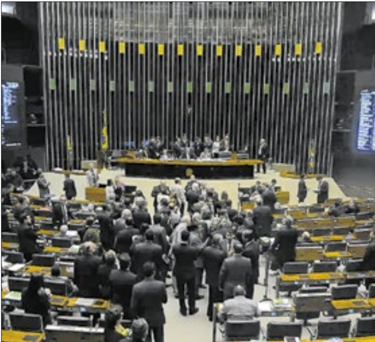
Segurança e STF nos alvos de interesse do Congresso