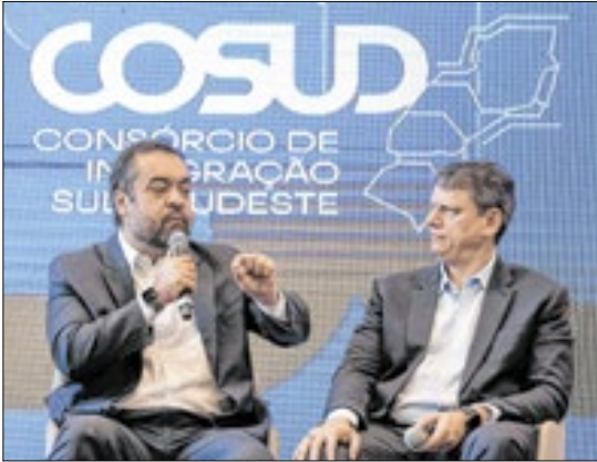
O governador do Rio, Cláudio Castro, com o governador de São Paulo, Tarcísio de Freitas