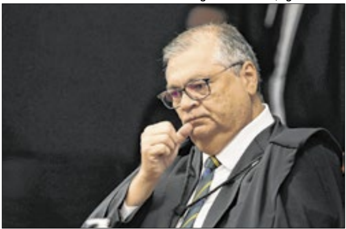
Mais de 30 parlamentares investigados