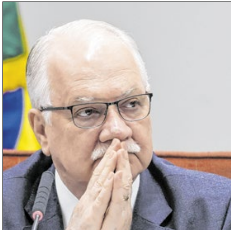
Fachin tenta diminuir a temperatura da crise com o Congresso