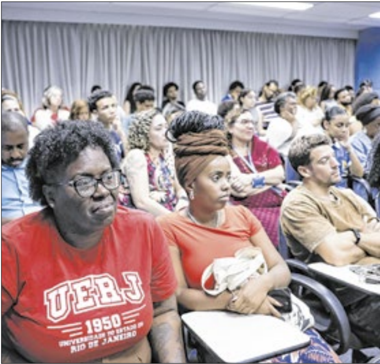
Sistema passará por uma segunda revisão legislativa

O Casa Paulista investiu R$ 1,5 mi e viabilizou que 99 famílias na cidade de São Paulo, na Barra Funda, conquistassem o apartamento próprio por meio de subsídios estaduais. A Secretaria de Desenvolvimento Urbano e Habitação participou da cerimônia de entrega de chaves do Residencial Mapp Barra Funda.