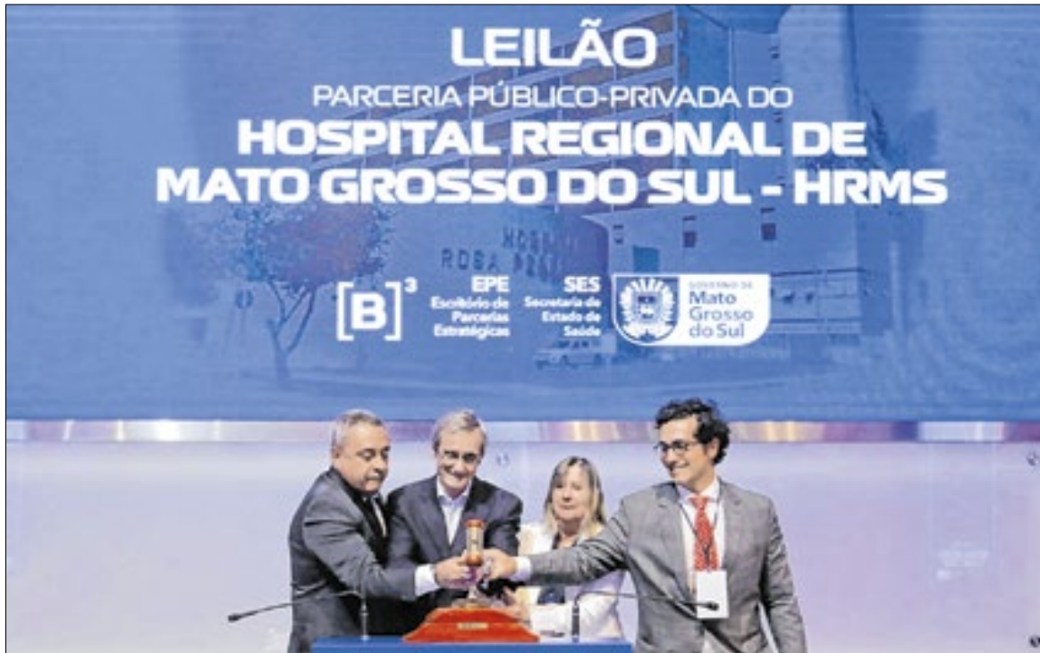
Governador bate o martelo do início da parceria para o hospital

“O Brasil precisa de soluções e quem deve buscá-las é o poder público. Estamos quebrando esse paradigma. Houve um envolvimento de nossa equipe, muito comprometimento de todos para chegar ao dia de hoje. Acredito muito que esse modelo, de uma PPP de cunho social, vai entregar qualidade superior a existente hoje. O Estado está crescendo cada vez mais rápido e esses avanços em áreas como a saúde se fazem urgentes”, frisou o governador Eduardo Riedel durante o discurso antes de bater o martelo na B3.