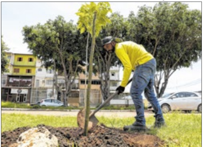
No DF, 69,1% dos moradores de favelas e comunidades urbanas residem em vias com presença de árvores