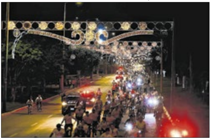
Iluminação foi inaugurada com passeio ciclístico