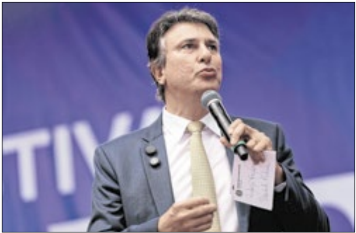
Ministro da Educação cumpre agenda em Santa Catarina