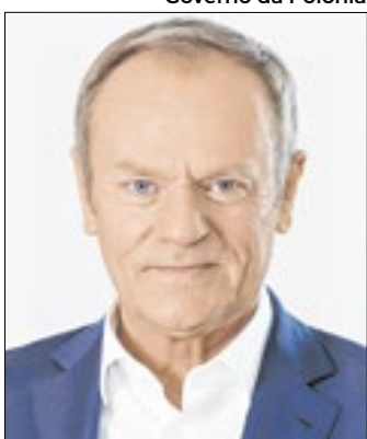
Donald Tusk segue com o temor da expansão russa