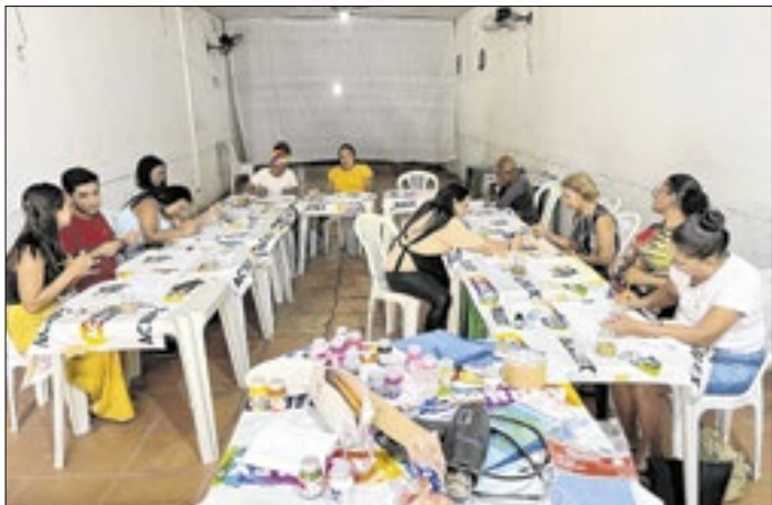
Técnicas de pintura em tecido entre as habilidades