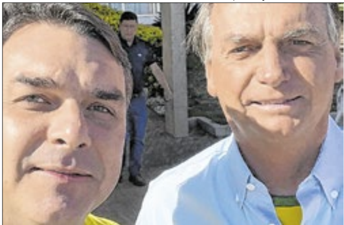
Flávio Bolsonaro foi colocado na sala de visitas pelo pai