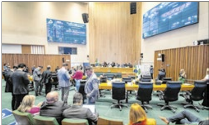
Plenário da Câmara Legislativa do DF durante sessão que derrubou 19 vetos, semana passada