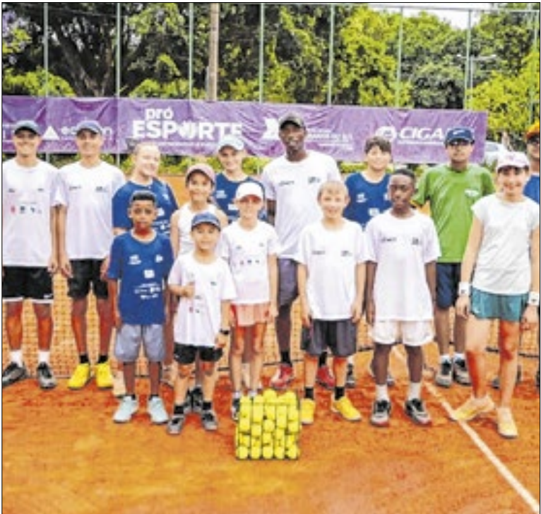
60 modalidades recebem recursos do governo do estado

O governo do Rio Grande do Sul assinou o contrato para a construção da nova ponte sobre o Rio Taquari, ligando as rodovias ERS-130, em Cruzeiro do Sul, e ERS-129, em Estrela, no estado. O serviço será executado pelo Departamento Autônomo de Estradas de Rodagem. O investimento é de mais de R$ 288 milhões.