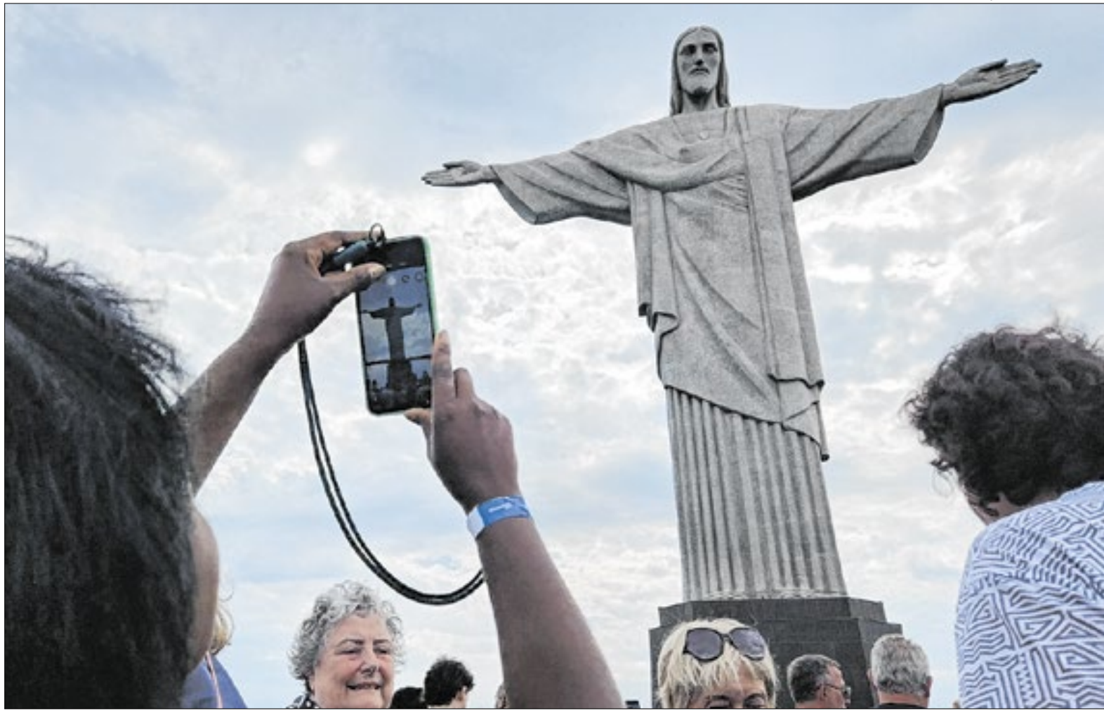
Grupo do quilombo de Lídice-RJ que foi ao Cristo contou com crianças, adolescentes e adultos