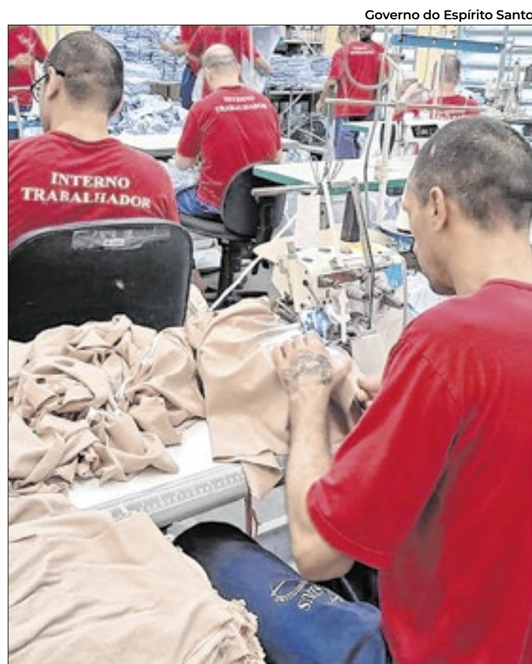
Governo do Espírito Santo

Nesses locais, são oferecidos serviços de atendimento psicossocial, qualificação profissional e encaminhamento ao mercado de trabalho, contribuindo para a reconstrução de trajetórias e a redução da reincidência.