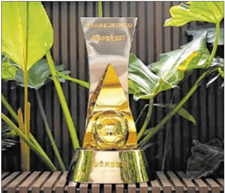
Internacional e Vitória se salvaram ‘no apagar das luzes’

O Cruz Azul embarcou para o Intercontinental no domingo, em voo fez escalas em Toronto e Paris. A diretoria do clube mexicano fretou um avião de mais de R$ 5 milhões. O duelo entre Flamengo e Cruz Azul será na quarta (10). A bola rola às 14h (de Brasília), no Qatar. O clube carioca já está treinando em Al-Rayyan.