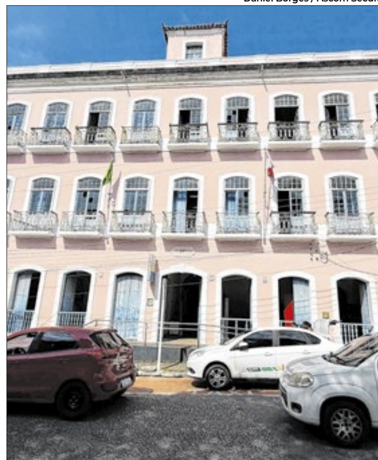
Secult realiza “Dezembro Literário: Natal em Capítulos”