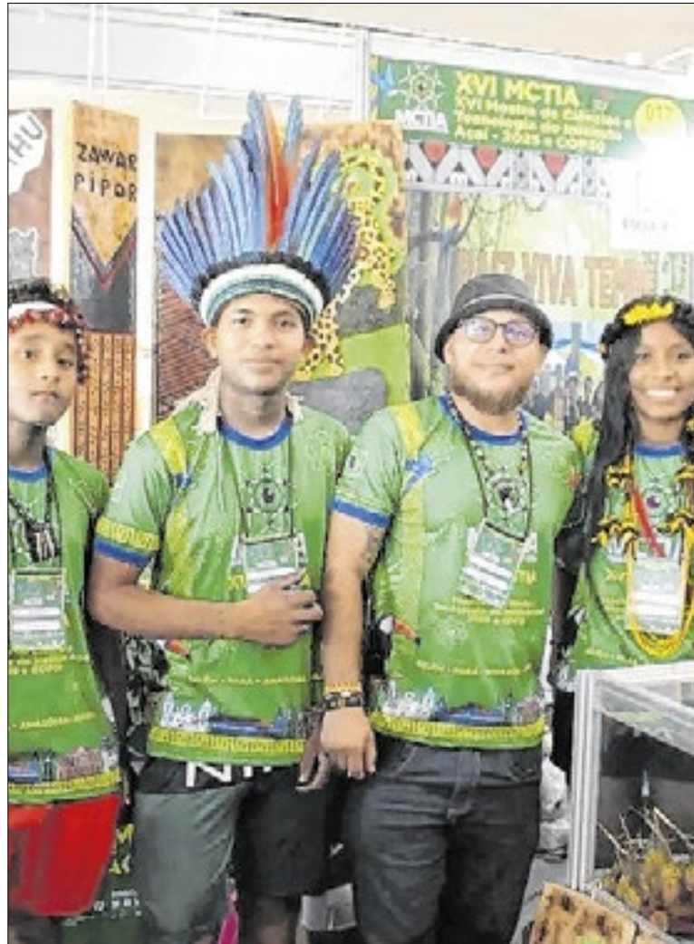
Alunos das aldeias obtiveram o primeiro prêmio da mostra

O governo de Roraima recebe o Expresso Natalino. A programação começou neste domingo, 7, com dois pontos de embarque: Parque do Rio Branco e Germano Augusto Sampaio. As famílias poderão visitar os principais pontos decorados de Boa Vista até o próximo domingo (14). Em 2024, mais de 5 mil pessoas visitaram os pontos decorados.