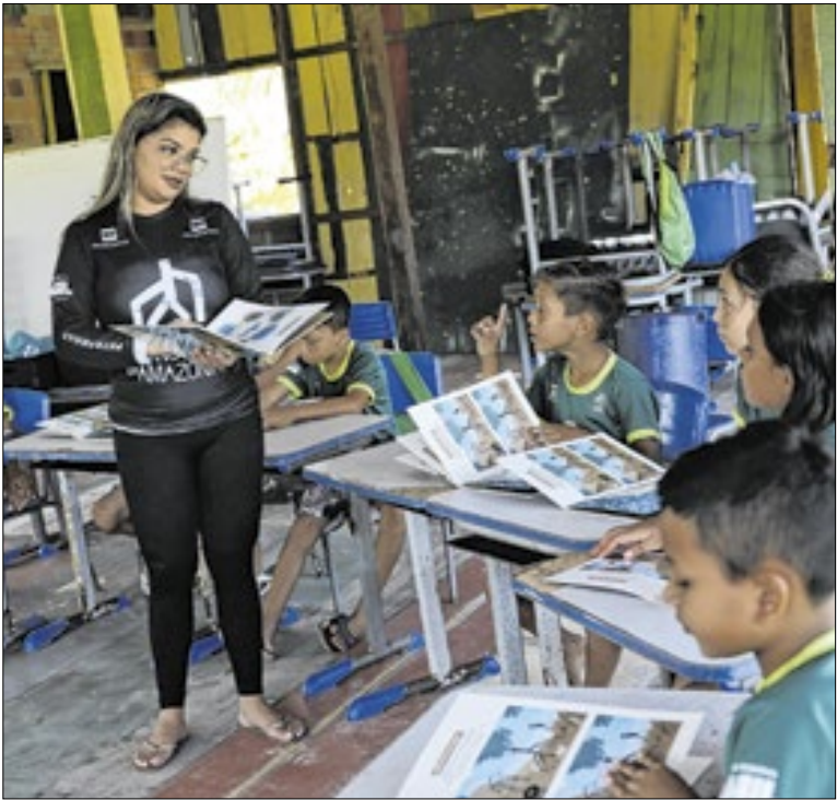
Participaram do levantamento 3.012 profissionais

O Exército Brasileiro integrou o segmento militar da comitiva brasileira na 30ª Conferência dos Estados Partes da Organização para a Proibição de Armas Químicas, realizada de 24 a 28 de novembro de 2025 e reforçou o protagonismo nacional na capacidade de Defesa Química, Biológica, Radiológica e Nuclear.