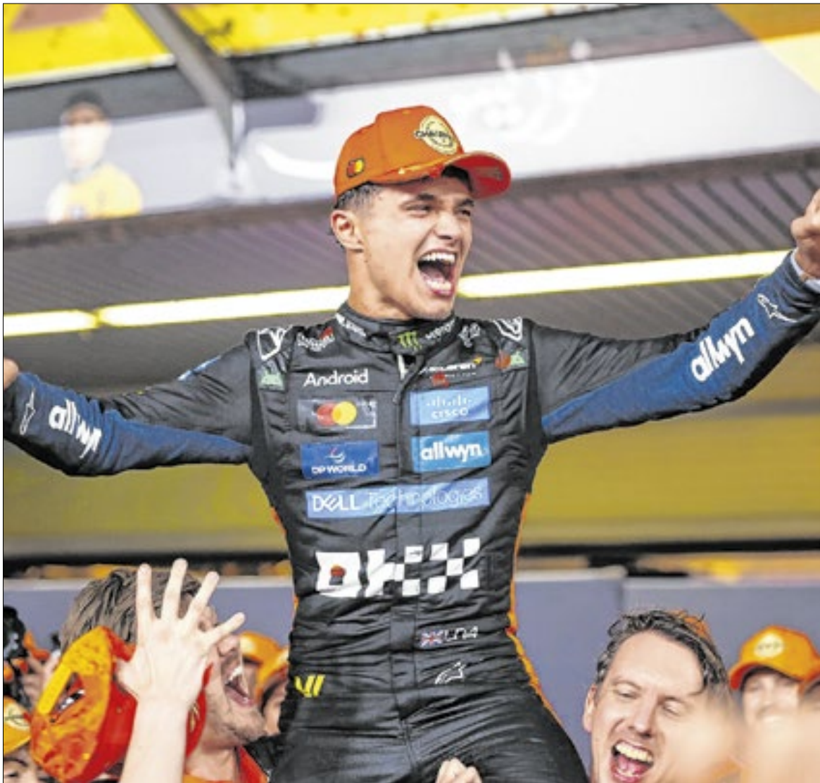
Com a conquista, Lando Norris se tornou o 35º piloto a integrar a lista de campeões da Fórmula 1

A corrida começou interessante, com Piastri escolhendo uma estratégia diferente, largando com pneus duros, e ultrapassando Norris por fora na curva 9 na primeira volta. O inglês, que precisava de um terceiro lugar para ser campeão sem depender de nenhum outro resultado, passou a ficar perigosamente perto de ser ultrapassado por Charles Leclerc, que vinha em quarto, a 1s da McLaren.