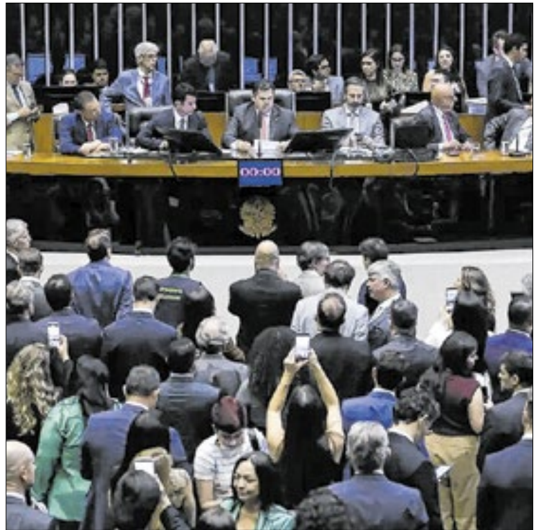
Votação na Câmara dos Deputados, em Brasília (DF)