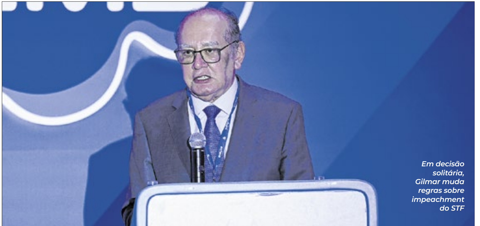
Em decisão solitária, Gilmar muda regras sobre impeachment do STF

A ação foi apresentada em setembro, quando já corria na Câmara a informação de que Paulinho seria o relator do projeto de lei da anistia, em uma articulação para que a Casa aprovasse apenas uma redução de penas, não um perdão total, a condenados pela tentativa de golpe no governo Bolsonaro.