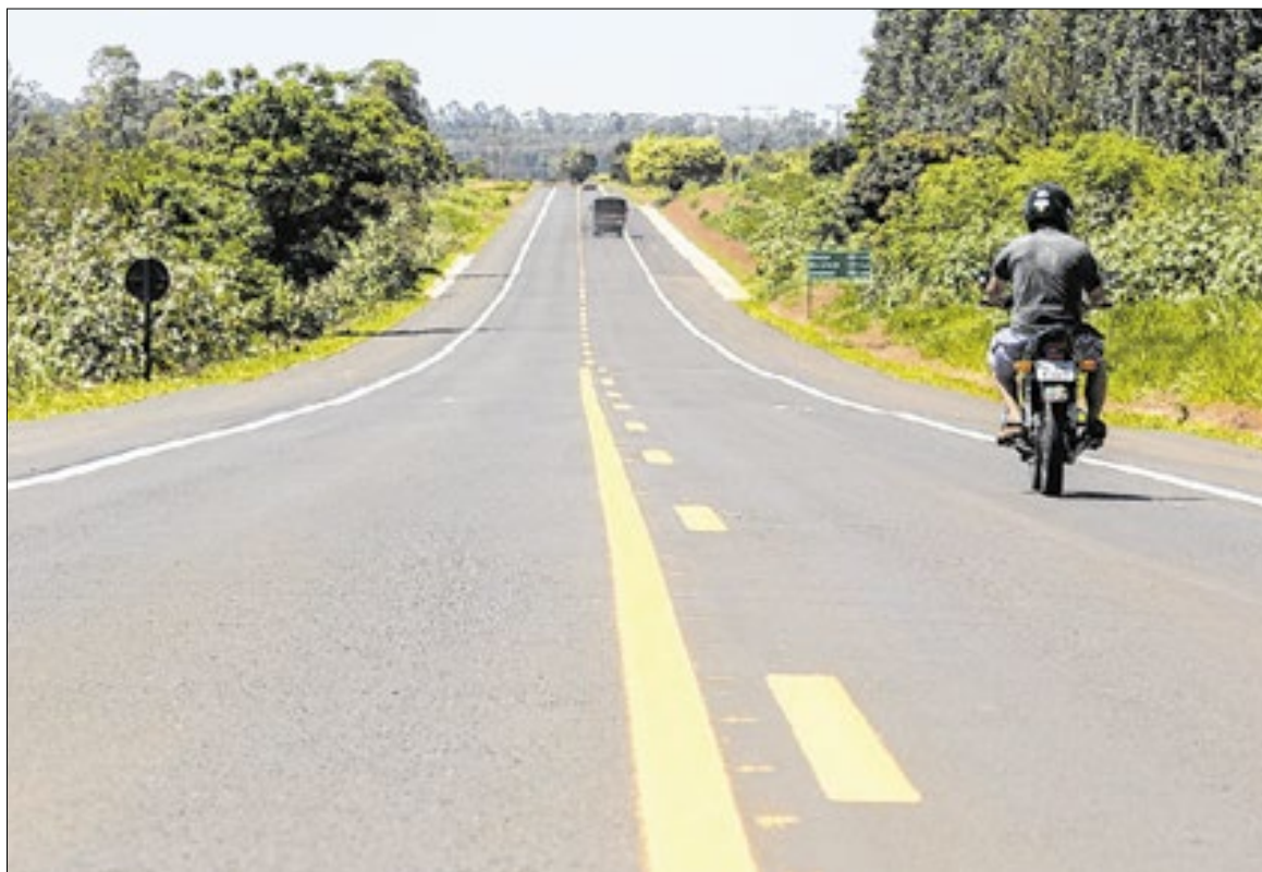
Governo de SP