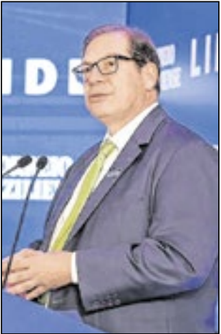
O ministro e vice-presidente do Superior Tribunal de Justiça (STJ), Luís Felipe Salomão