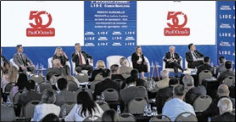
O evento reuniu autoridades, líderes do agronegócio, representantes do setor público e executivos para debater os desafios e caminhos para fortalecer a segurança jurídica no agro brasileiro