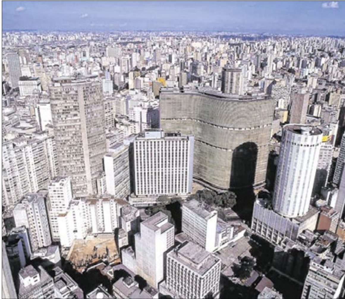
Lançamentos de imóveis residenciais em outubro registraram um salto de 88,8%

Mas o crescimento do estoque sugere que, apesar da alta