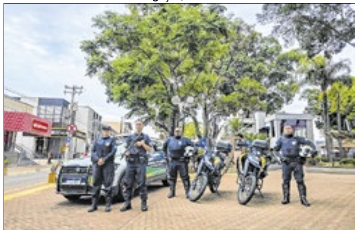
GCM intensificou o patrulhamento no Centro e bairros