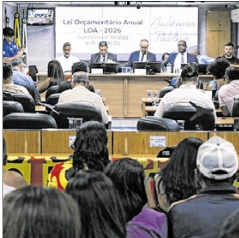
Esta foi a 2ª Audiência sobre a Lei Orçamentária de 2026