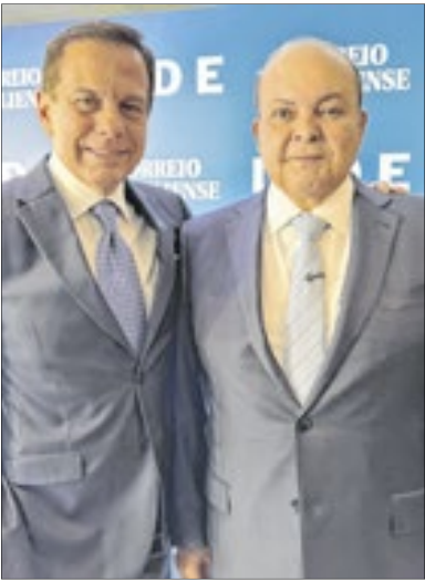
Fundador e copresidente do Conselho do Lide, João Dória com o governador do Distrito Federal, Ibaneis Rocha, durante o Brasília Summit