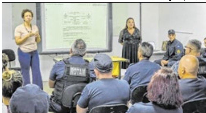
Capacitação conduzida pela Delegada da Mulher