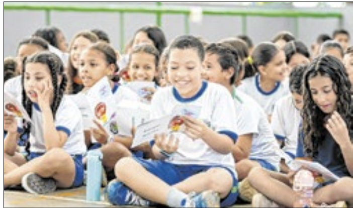
Projeto cria instrumentos para a comunidade escolar