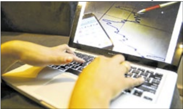
Haverá investimentos internos para capacitação