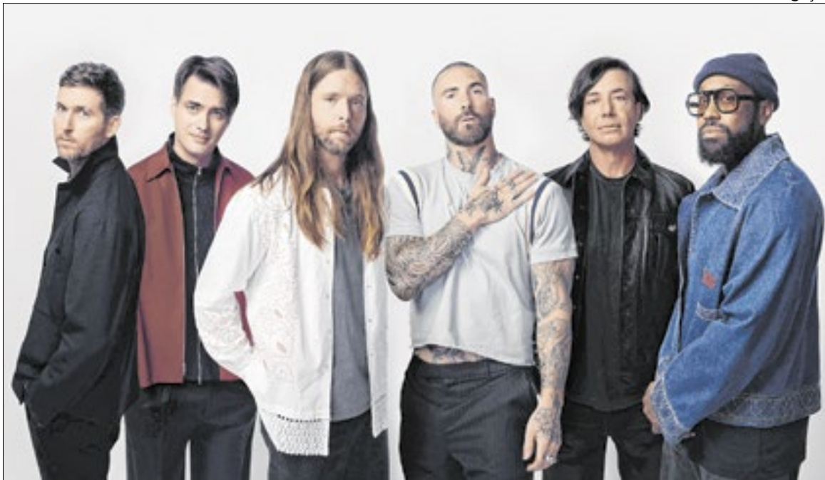
A banda californiana retorna ao evento em um momento de grande visibilidade

anos 1990. Liderado por Jay Kay, o grupo acumula sucessos como Virtual Insanity e Cosmic Girl . O trabalho mais recente, Automaton , mostra que o grupo continua expandindo sua sonoridade. No mesmo dia, Stray Kids assume o Palco Mundo, reunindo diferentes gerações de público.