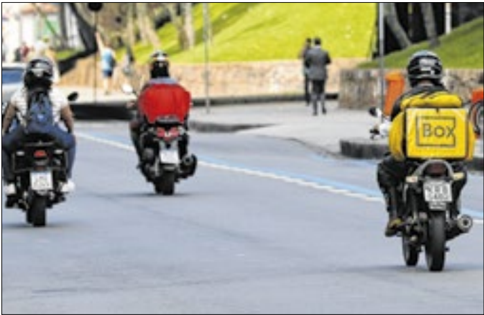
Entregadores de aplicativo são razão da audiência