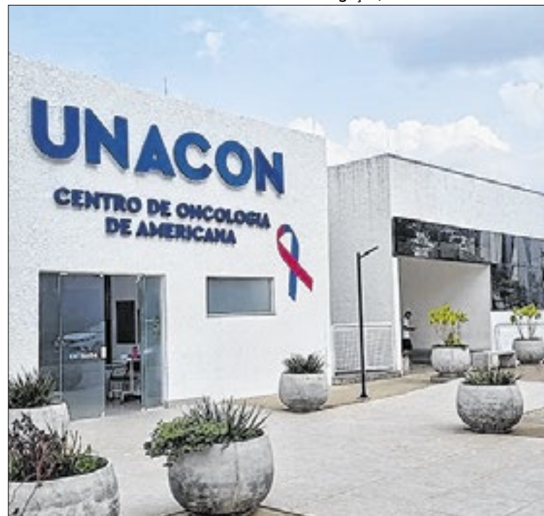
Reconhecimento atesta qualidade na gestão assistencial