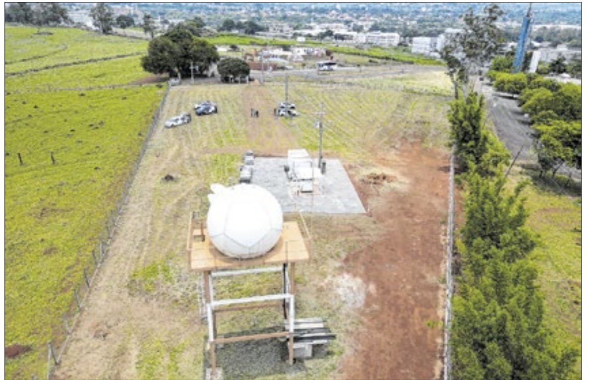
Novo Radar Meteorológico instalado no Cepagri, da Universidade Estadual de Campinas

O custo foi de aproximadamente de R$ 4,5 milhões, dos quais 3 milhões oriundos do Fundocamp - vinculado à Agên-