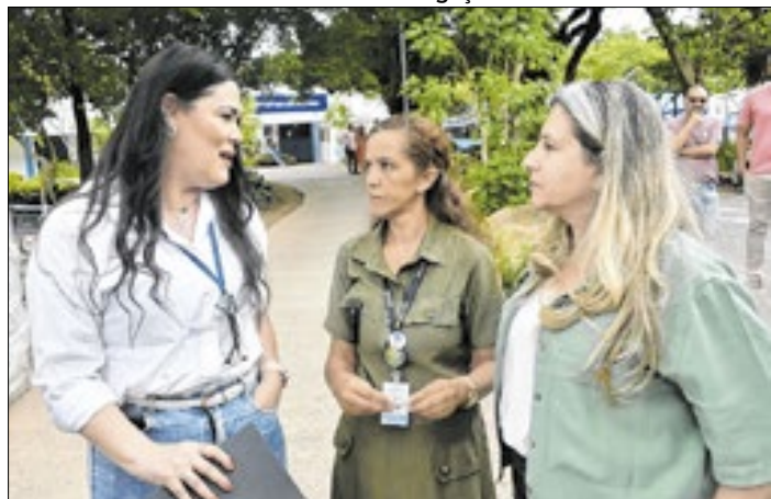
A primeira troca do Moeda Verde ocorreu em 2017