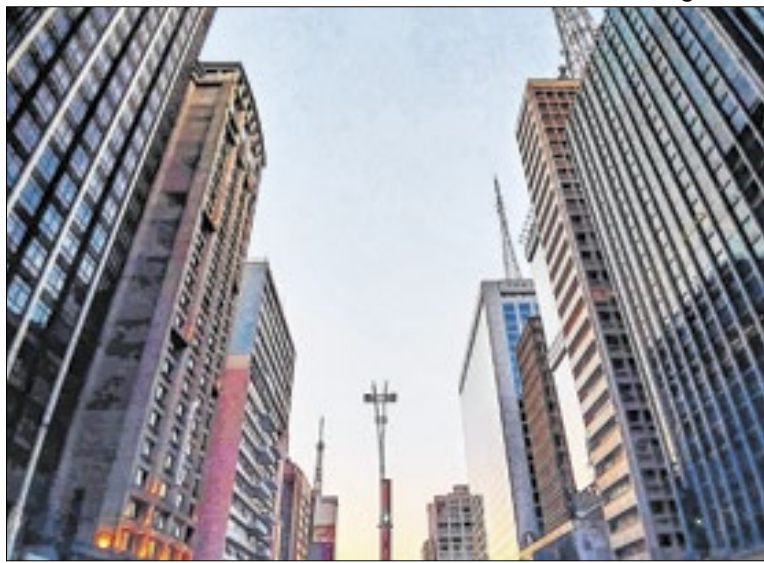
Em 12 meses, as vendas somaram 111,9 mil imóveis.

nas vendas, a oferta está crescendo mais rápido, o que pode significar concorrência maior entre empreendimentos, possibilidade de negociações mais agressivas para quem compra, e até pressão para moderar preços dependendo da demanda.