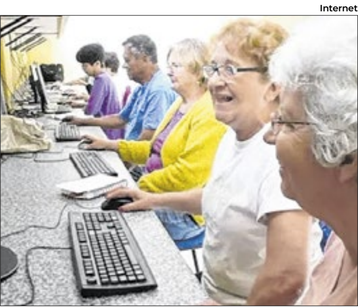
O número de idosos no mercado de trabalho é recorde