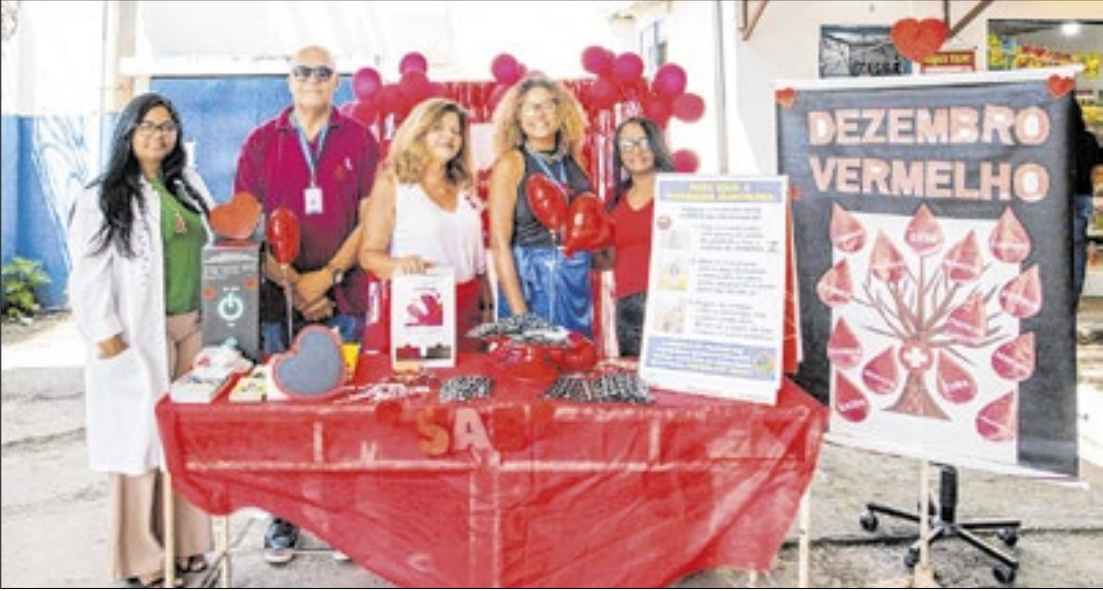
O projeto “Dezembro Vermelho” incentiva a prevenção e combate o preconceito