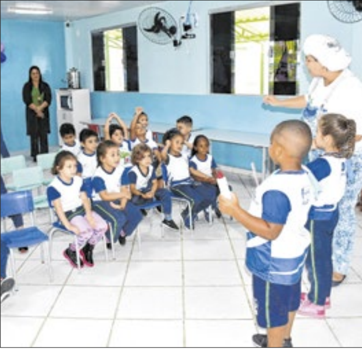
Inscrições vão até dia 31 de dezembro na internet

As inscrições para o Concurso Público nº 001/2025, voltado ao preenchimento de vagas na área da educação em Resende, vão ser abertas nesta quinta-feira (04). De acordo com o edital, o certame contempla 130 vagas para o cargo de auxiliar de creche, sendo 123 de ampla concorrência e sete reservadas para Pessoas com Deficiência.