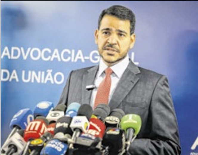
Messias sabe que o problema não é exatamente ele