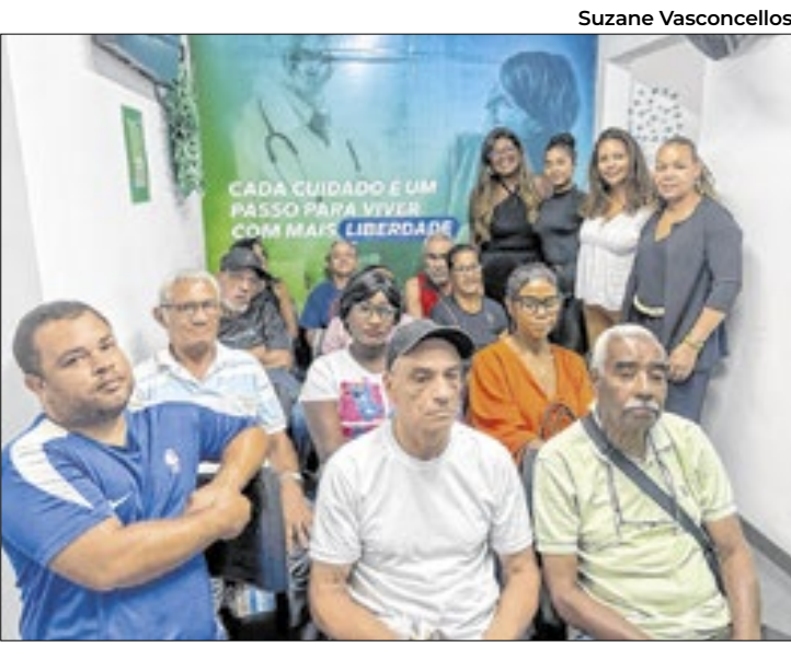
Encontro orientou sobre cuidados necessários aos pacientes