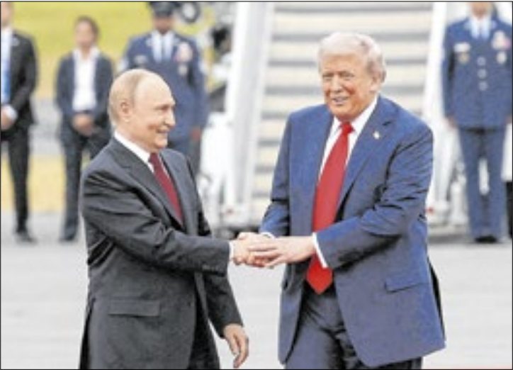
Trump e Putin estão ‘alinhados’, mas acordo segue distante

Após cinco horas de conversas entre Rússia e Estados Unidos em Moscou, o assessor internacional de Vladimir Putin disse à imprensa que a paz na Ucrânia não está mais próxima -mas tampouco está mais distante. Segundo Iuri Uchakov, os dois lados não conseguiram chegar a um acordo a respeito de questões como a transferência de território. Pelos primeiros sinais disponíveis, o pêndulo da negociação parece ter voltado para o lado do Kremlin, dado que Putin passou o dia asseverando uma posição de força militar no país que invadiu em 2022, enquanto Volodimir Zelenski pedia para que a Ucrânia não fosse deixada de lado no debate. Pelo lado americano, participaram do encontro o enviado Steve Witkoff e o genro de Donald Trump Jared Kushner, que costuma envolver-se em acordos