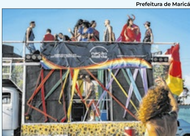
Prefeitura de Maricá