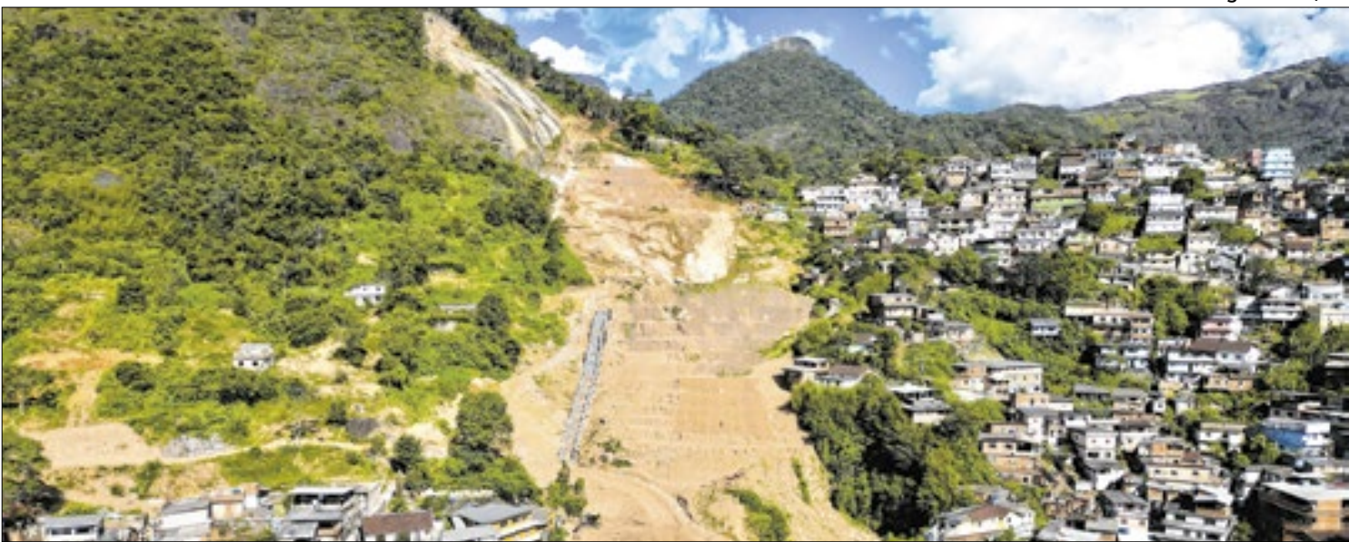
Entre 2011 e 2024, Petrópolis registrou o maior número de mortes decorrentes de tragédias