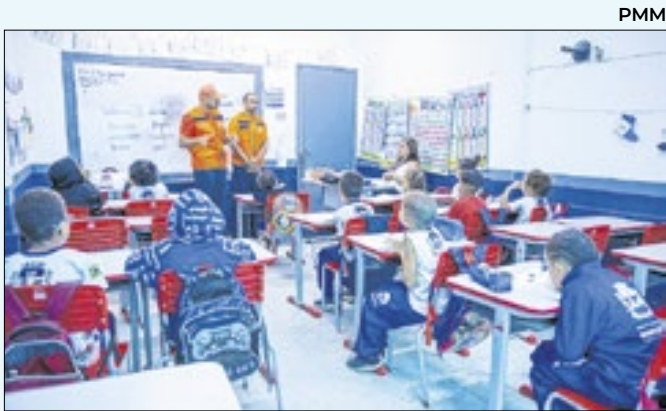
Escola Ernesto Che Guevara recebeu simulado

cluindo ameaças, invasões de domicílio, lesão corporal, roubo e perseguição. Diante dos fatos, a autoridade policial da 52ª DP apresentou pela prisão do criminoso. Contra ele, os agentes cumpriram mandado de prisão preventiva pelo descumprimento de medidas protetivas.