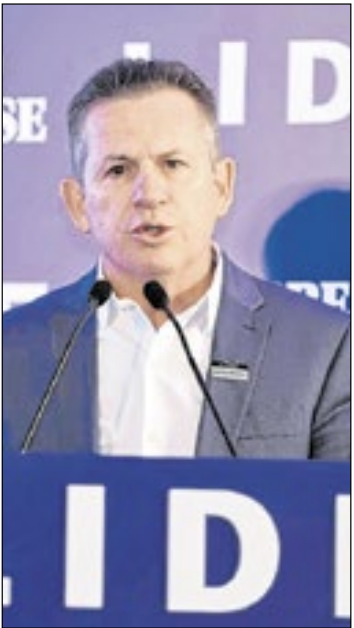
Durante o Brasília Summit, o governador do Mato Grosso, Mauro Mendes

O encontro teve como objetivo debater os desafios do agronegócio brasileiro, destacando fraudes em instrumentos de crédito rural, restrições de financiamento, pressão ambiental e riscos à segurança jurídica, além de discutir soluções para garantir a sustentabilidade, o acesso ao crédito e a competitividade do setor.