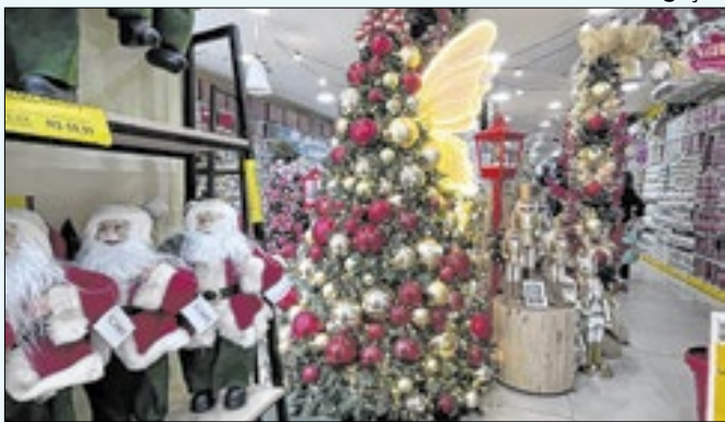
123 milhões de consumidores devem ir às compras