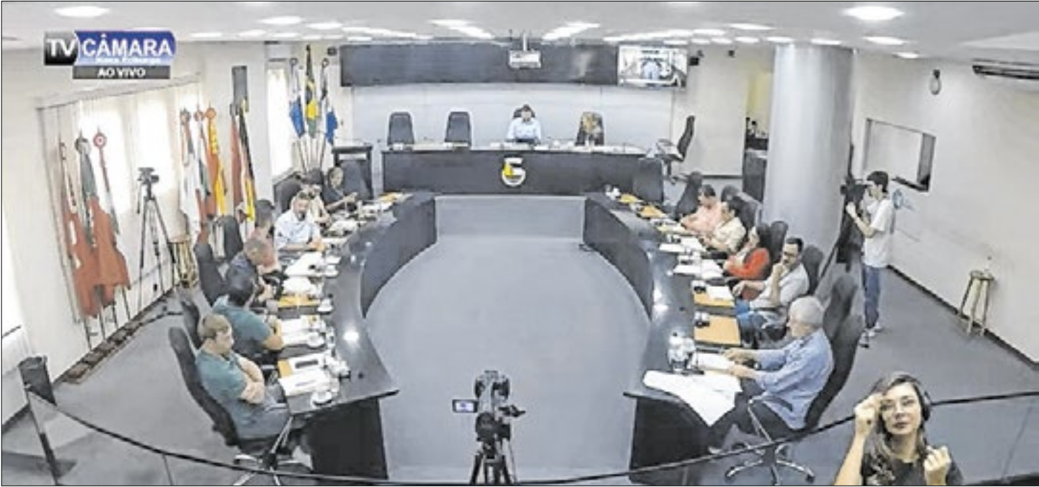
Após críticas em outras audiências, pastas sofreram reformulações

O reajuste equivale a 11,37% e o novo valor glo- bal do contrato passa a ser de R$ 1.902.178,47. A renovação foi realizada por meio da Secretaria Municipal de Segurança Pública.