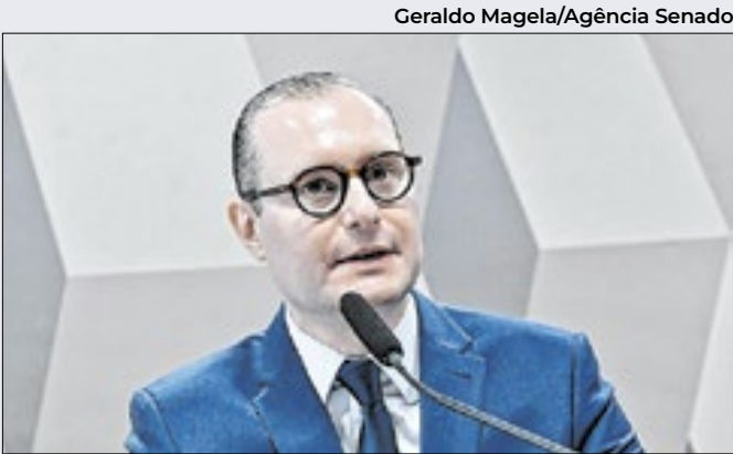
Geraldo Magela/Agência Senado

privatização é a redução no quadro de empregados, sob a justificativa da necessidade de cortar custos. “Isso pode ser vantajoso para os novos acionistas da empresa, mas prejudicial para o consumidor ou usuário do serviço público”, afirmou Petecão.