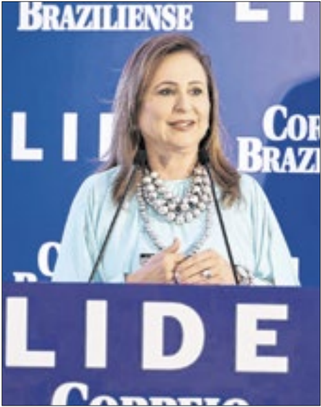
A ex-ministra e ex-senadora Kátia Abreu destacou que o país já construiu um arcabouço robusto de governança e rastreabilidade, com georreferenciamento, Cadastro Ambiental Rural (CAR) e monitoramento remoto por satélites