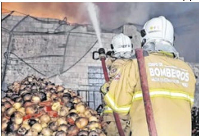
110 agentes participaram da ação para conter o fogo