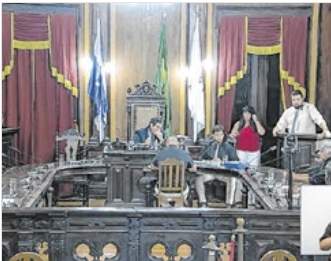
Sessão foi suspensa por duas vezes