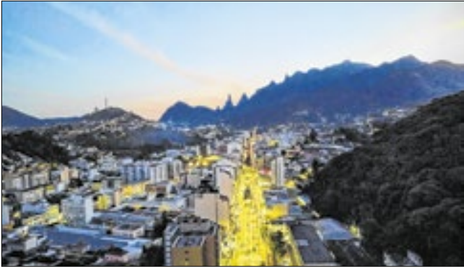
Leilão será realizado no dia 18 de dezembro