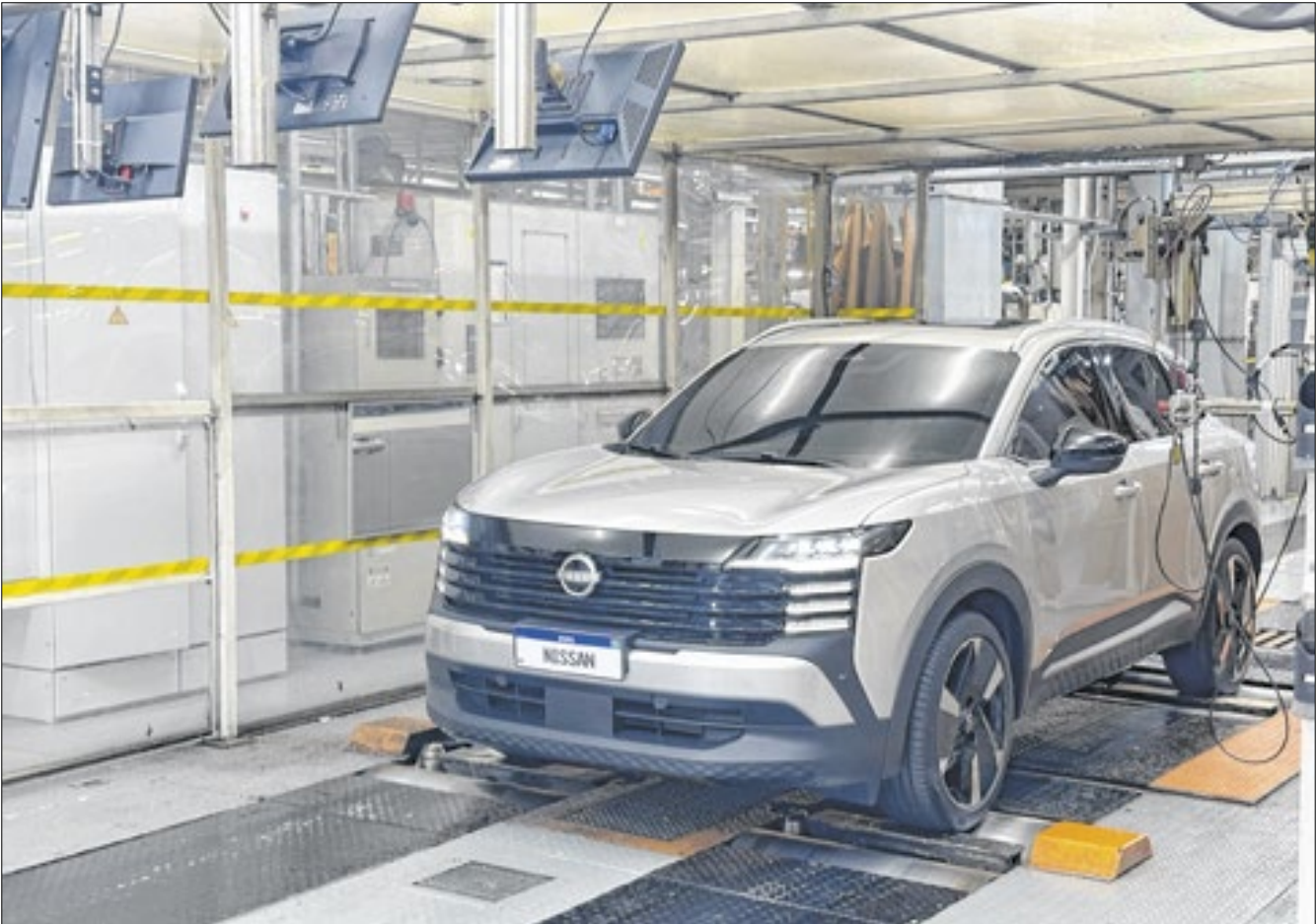
Correio Sul Fluminense testou e aprovou o Nissan Kicks produzido na unidade da montadora em Resende-RJ