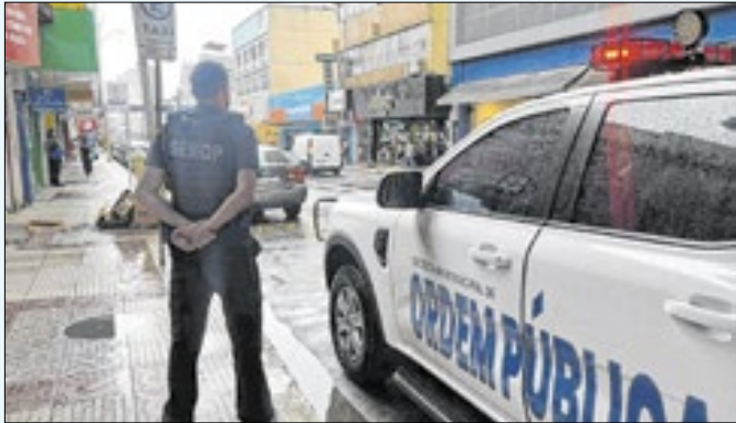
Roubos a estabelecimentos comerciais e carga zeram