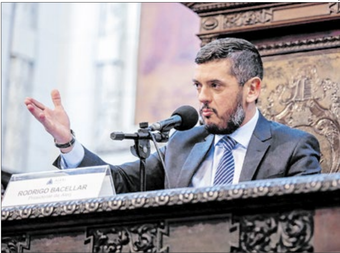
Parlamentar teve a prisão preventiva ordenada pelo ministro do STF Alexandre de Moraes

A investigação aponta que o vazamento ocorreu dias antes da deflagração da Operação Zargun, permitindo que TH Joias fugisse de sua residência na Barra da Tijuca. Bacellar e o ex-deputado mantinham uma relação como aliados políticos. As investigações apontam que