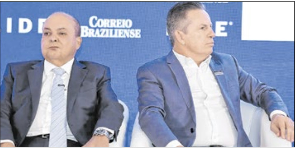
Os governadores do DF, Ibaneis Rocha (e), e do Mato Grosso, Mauro Mendes (d)