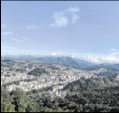
Mudanças serão para o Natal

A Secretaria de Mo- bilidade e Urbanis- mo de Nova Fribur- go informa que a interdição realizada na Avenida Alberto Braune, no Centro, será estendida por mais uma madru- gada. A medida é necessária para a continuidade da instalação da estrutura e da ornamentação de Natal no lo- cal. A via ficará interditada ao tráfego de veículos das 23h59 às 6h, na madrugada de quarta (03/12) para quinta-feira (04/12), período destinado à conclusão dos trabalhos.