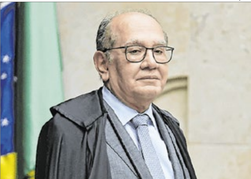
Em decisão solitária, Gilmar muda regras sobre impeachment do STF

Uma decisão liminar de Gilmar Mendes em uma ação movida pelo Solidarieidade que limita a possibilidade de processos de impeachment contra ministros do STF produziu