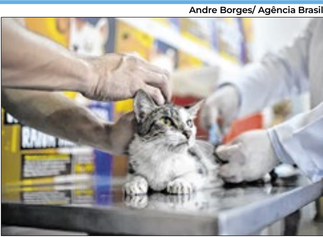
Andre Borges/ Agência Brasil