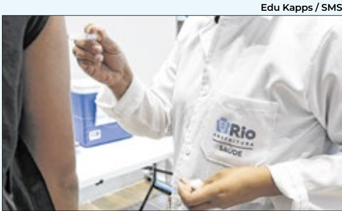
É necessário apresentar documento de identificação

de 15 a 45 passageiros. A lei foi criada para organizar o serviço. Contudo, houve mudanças em relação a matéria aprovada na Câmara, com veto ao texto que determinava o credenciamento dos barqueiros que atuam no trecho e a participação de cooperativas na gestão do serviço.