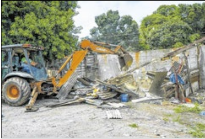
A área será destinada ao serviço público de saúde

A Prefeitura de São João de Meriti realizou a desapropriação de um terreno localizado na Rua Sebastião Carvalho Bastos, no bairro Vila Tiradentes, com o objetivo de construir uma nova unidade de saúde no formato de Clínica da Família. A área será destinada exclusivamente ao serviço público de saúde, atendendo à demanda crescente da comunidade por atendimento médico básico e atenção primária.