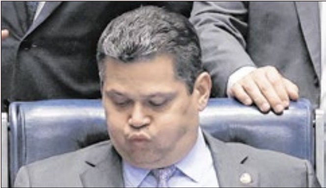
Lula terá que desfazer o bico de Alcolumbre