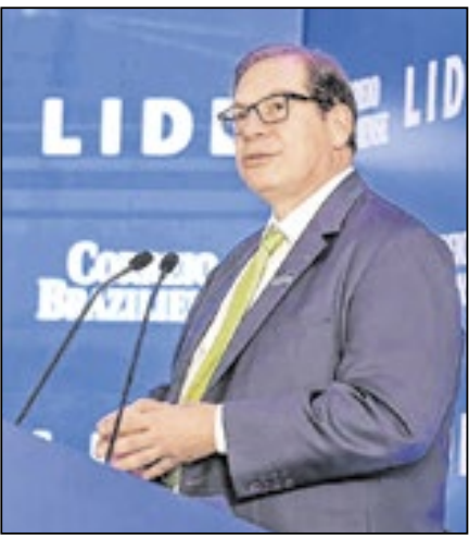
O ministro e vice-presidente do Superior Tribunal de Justiça (STJ), Luís Felipe Salomão