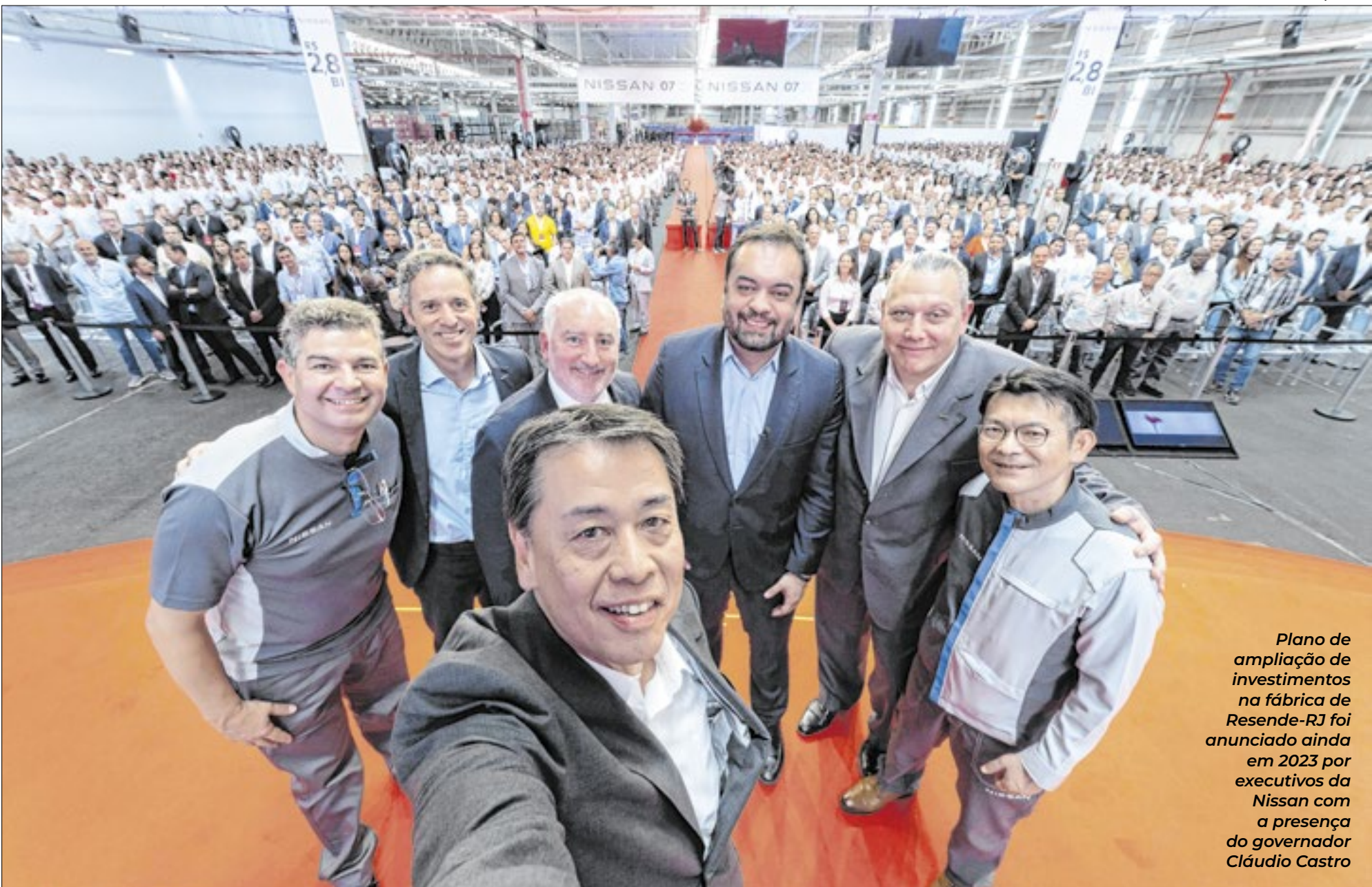
Plano de ampliação de investimentos na fábrica de Resende-RJ foi anunciado ainda em 2023 por executivos da Nissan com a presença do governador Cláudio Castro