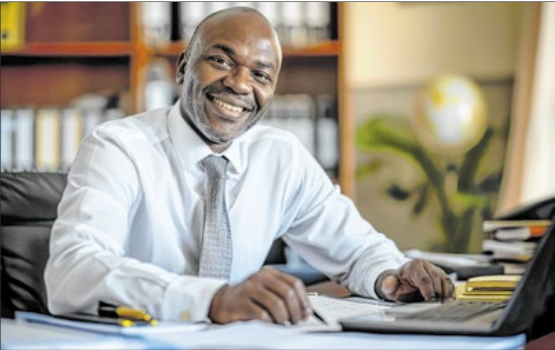
Mesmo em cargos de gestão a disparidade de salário é grande

De acordo com o Censo 2022, pretos e pardos represen-