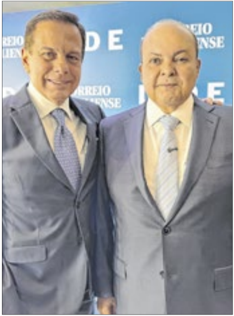
Fundador e copresidente do Conselho do Lide, João Dória com o governador do Distrito Federal, Ibaneis Rocha, durante o Brasília Summit