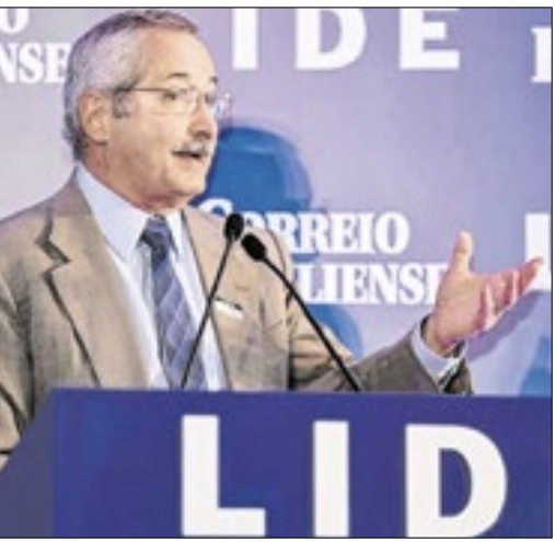
O ex-ministro da Agricultura Antônio Cabrera apontou um “descompasso moral” no tratamento de crimes econômicos ligados ao agro