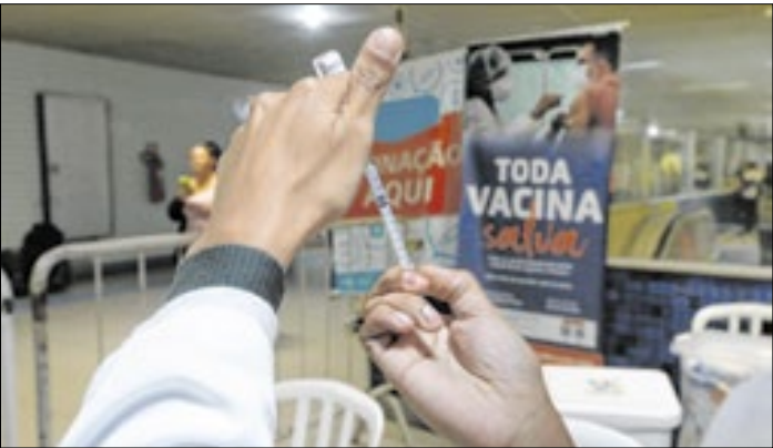
Em 2025, houve 14.474 casos da doença no Rio

A Secretaria Municipal de Saúde do Rio de Janeiro ampliou o público-alvo da vacina contra a variante JN.1 da Covid-19. Assim, quem tem a partir dos 12 anos também pode ser imunizado com a dose de reforço. Em 2025, até o momento, houve 14.474 casos da doença no Rio.