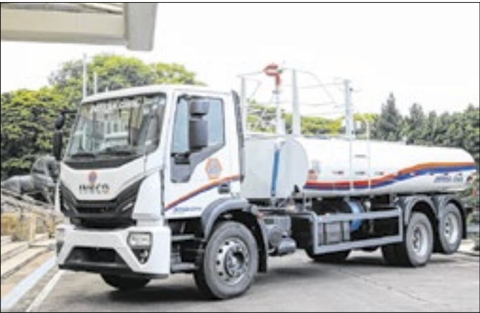
Movimento faz parte das ações preventivas

Para reforçar a resposta da Defesa Civil em caso de emergências climáticas, o Governo de São Paulo autorizou, durante o lançamento do programas São Paulo Sempre Alerta – Operação Chuvas, um investimento de mais de R$ 29 milhões para a compra de viaturas, caminhões-pipas e novos equipamentos. Ao todo serão adquiridas 20 novas viaturas e 40 caminhões-pipas, que irão reforçar os contingentes da Defesa Civil nos municípios, além de 216 kits de equipamentos, como rádios, torres de iluminação, capacetes, sopradores e tanques de 400 litros, todos destinados às ações em campo dos agentes, investimento de R$ 4,2 milhões.