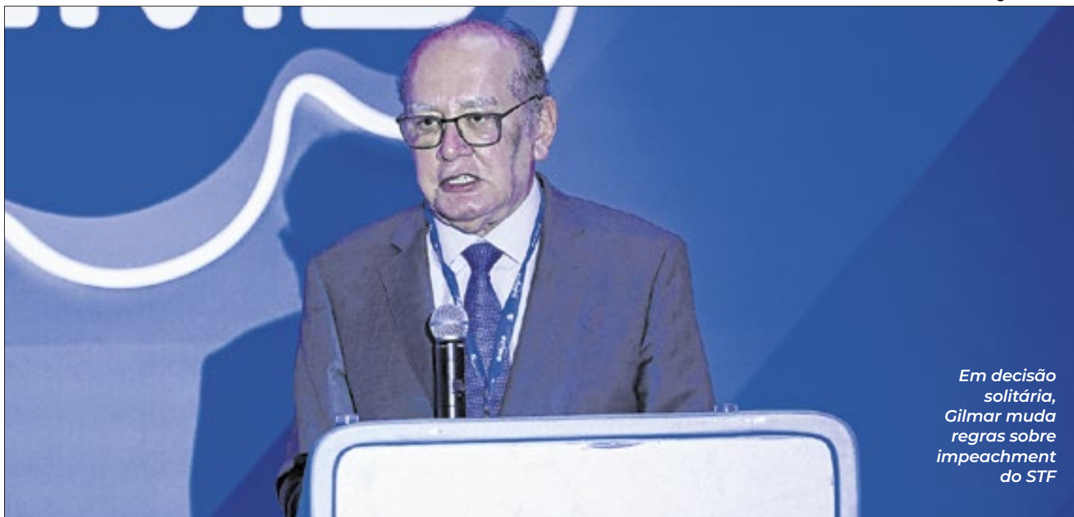
Em decisão solitária, Gilmar muda regras sobre impeachment do STF

A ação foi apresentada em setembro, quando já corria na Câmara a informação de que Paulinho seria o relator do projeto de lei da anistia, em uma articulação para que a Casa aprovasse apenas uma redução de penas, não um perdão total, a condenados pela tentativa de golpe no governo Bolsonaro.