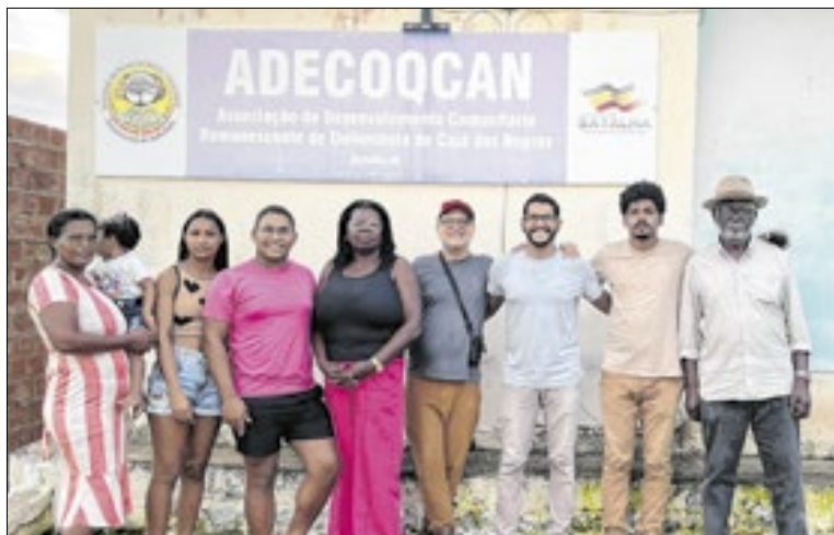
A visitação seguirá até 14 de janeiro de 2026

Fruto de uma experiência fotoetnográfica originada de uma imersão de três dias e três noites no quilombo Cajá dos Negros, em Batalha, a exposição reúne 96 fotografias selecionadas curatorialmente, produzidas durante um workshop imersivo da FRAGMA, em 2023, com apoio da Associação de Desenvolvi-