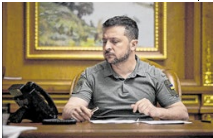
Dinheiro russo será usado para bancar o exército de Kiev