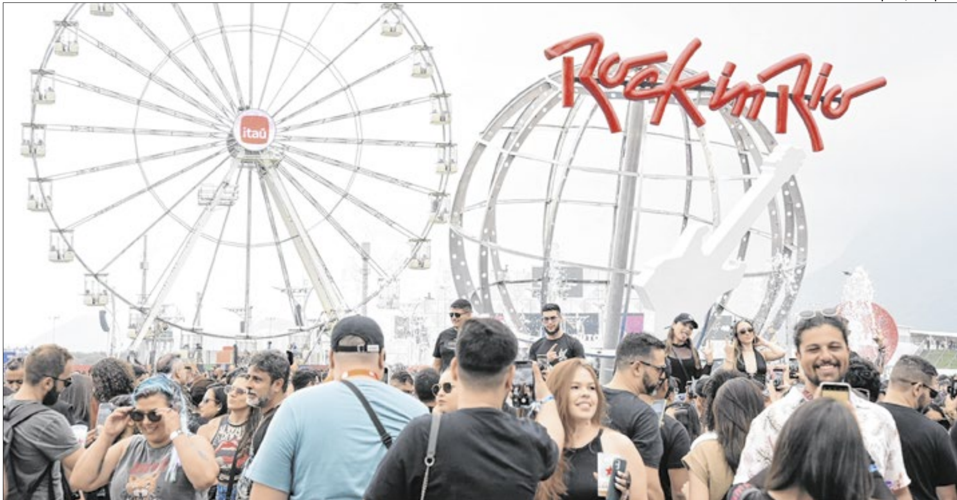
41ª edição do festival acontece em setembro de 2026 no Parque Olímpico do Rio de Janeiro