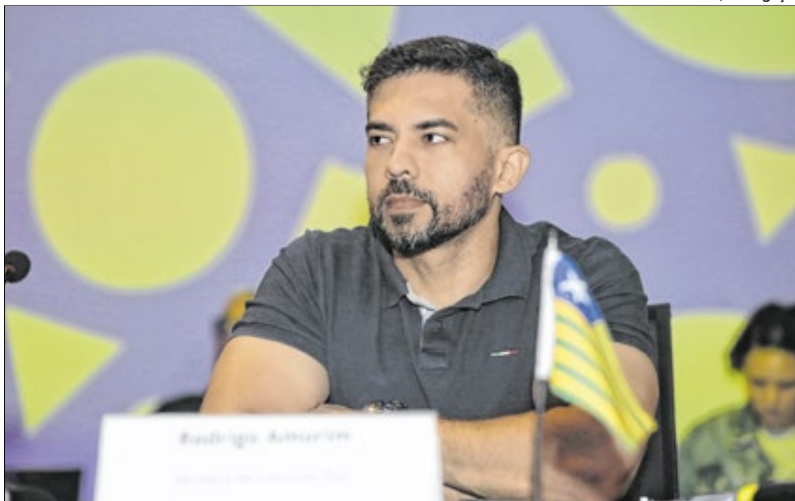
O encontro reúne dirigentes estaduais de cultura de todo o país

Realizado em um dos mais simbólicos equipamentos culturais do Ceará, o MIS, reconhecido como um espaço guardião de memórias e fomentador de novas narrativas visuais e sonoras, o encontro reforça a potência cultural do estado anfitrião, que conta