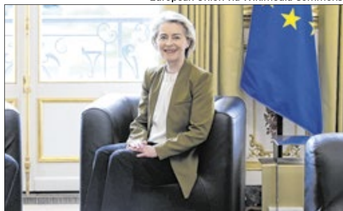
Ursula Von Der Leyen acionou uma cláusula autoritária