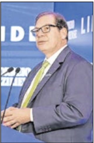
O ministro e vice-presidente do Superior Tribunal de Justiça (STJ), Luís Felipe Salomão