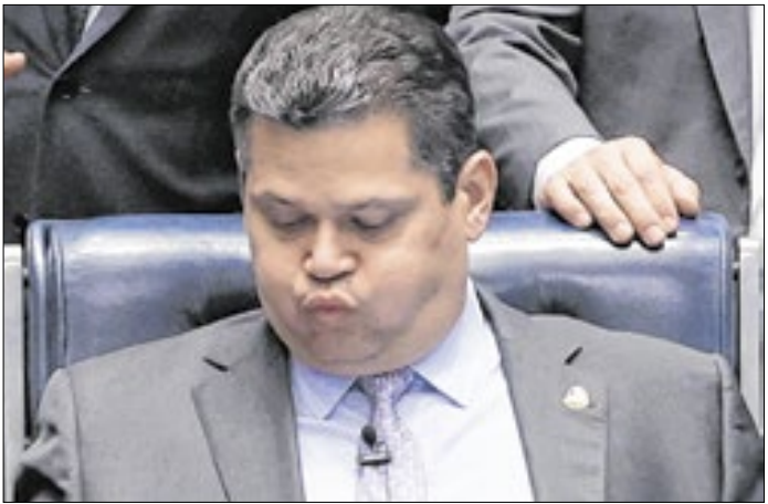
Lula terá que desfazer o bico de Alcolumbre