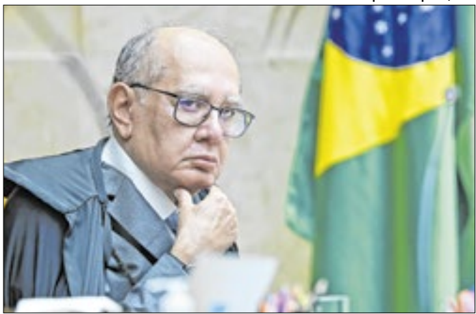
Gilmar Mendes retirou poder de senadores