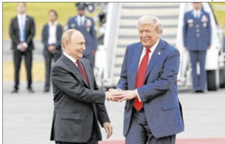
Trump e Putin estão ‘alinhados’, mas acordo segue distante

E coloca o país perto de estreitar a operação comercial em 2026. A China Central Television (CCTV) afirmou que “o recente teste é a etapa final para o CR450 entrar na fase de operação comercial e será um marco simbolizando que a capacidade tecnológica da ferrovia chinesa está avançando de ‘Fabricado na China’ para ‘Criado na China’”.