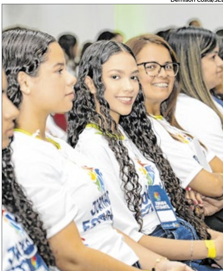
A Jornada inclui palestras, oficinas com temas diversos