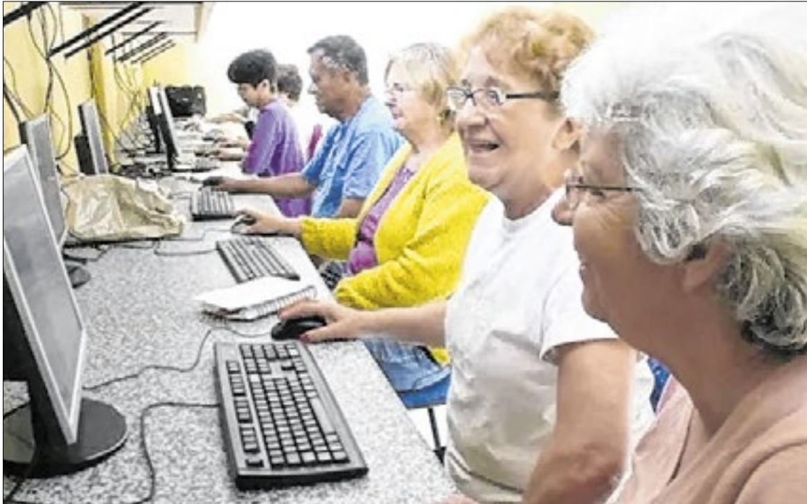
O número de idosos em atividade triplicou em três décadas no DF, indica pesquisa

O estudo mostra que a taxa de desocupação (taxa de desemprego) dessa população foi de 2,9% em 2024, a menor da série histórica do IBGE.