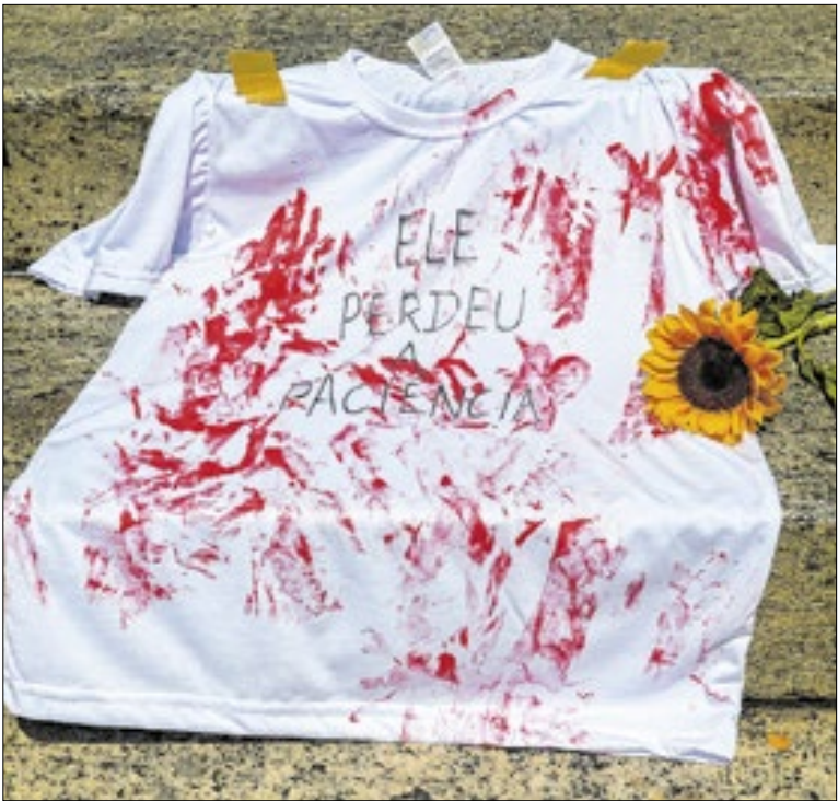
Advogada diz que problema não é a ausência de leis

Já está no ar a plataforma global Bioeconomy Challenge, construída para transformar os “Dez Princípios de Alto Nível da Bioeconomia” em ações concretas e soluções escaláveis, com metas até 2028. A iniciativa – do Ministério do Meio Ambiente e Mudança do Clima traz a bioeconomia ao centro da resposta à crise climática.