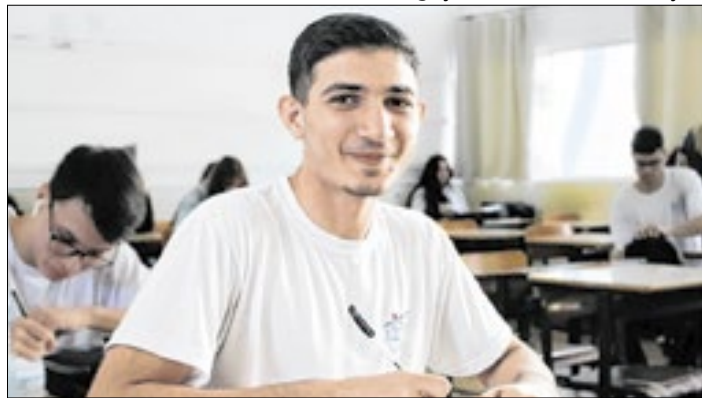
Matrículas na rede estadual de ensino começam hoje