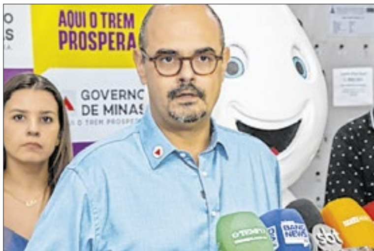
Imunizante será distribuído para os 853 municípios mineiros

Após a chegada das doses à Rede de Frio da Secretaria de Estado de Saúde (SES-MG), em Belo Horizonte, terá início a distribuição imediata para os 853 municípios mineiros. O en-