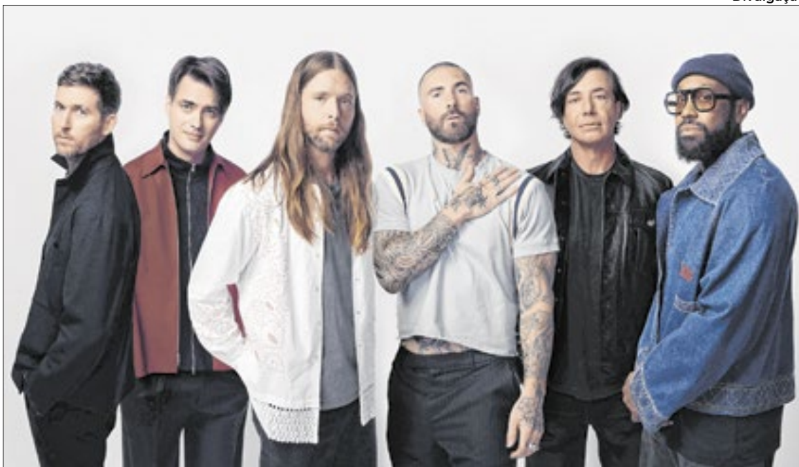
A banda californiana retorna ao evento em um momento de grande visibilidade

anos 1990. Liderado por Jay Kay, o grupo acumula sucessos como Virtual Insanity e Cosmic Girl . O trabalho mais recente, Automaton , mostra que o grupo continua expandindo sua sonoridade. No mesmo dia, Stray Kids assume o Palco Mundo, reunindo diferentes gerações de público.