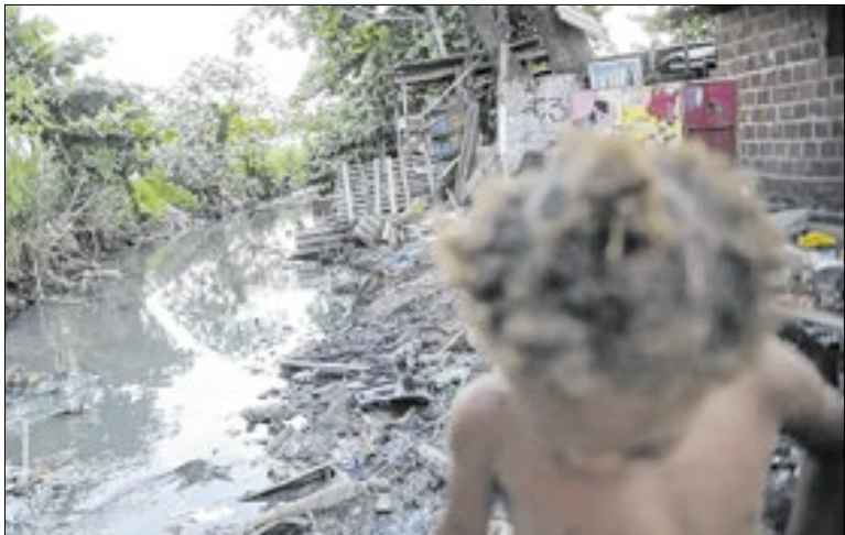
Em 2024, 48,9 milhões estavam na linha de pobreza

Em 2024, o Brasil tinha 48,9 milhões de pessoas que viviam com menos de US$ 6,85 por dia, o que equivale a cerca de R$ 694, em valores corrigidos para o ano. Esse é o limite que o Banco Mundial define como linha da pobreza. Em 2023, o contingente na pobreza era de 57,6 milhões de brasileiros.