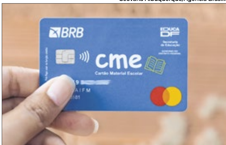
Programa dá até R$ 320 para a compra do material

O Cartão Material Escolar, destinado a estudantes regularmente matriculados na Rede Pública de Ensino do Distrito Federal, já beneficiou aproximadamente 865 mil estudantes desde 2019, segundo a Secretaria de Educação (SEEDF). O investimento do Governo do Distrito Federal (GDF) ultrapassa R$ 267,6 milhões e atende estudantes de educação infantil, ensino fundamental, ensino médio e educação especial.