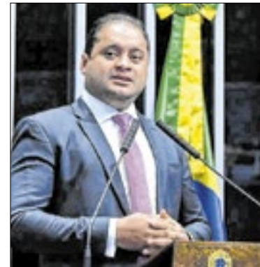
Weverton acha que Messias reverterá as dificuldades com o tempo

Alcolumbre diz que Senado não usurpa prerrogativas de Lula