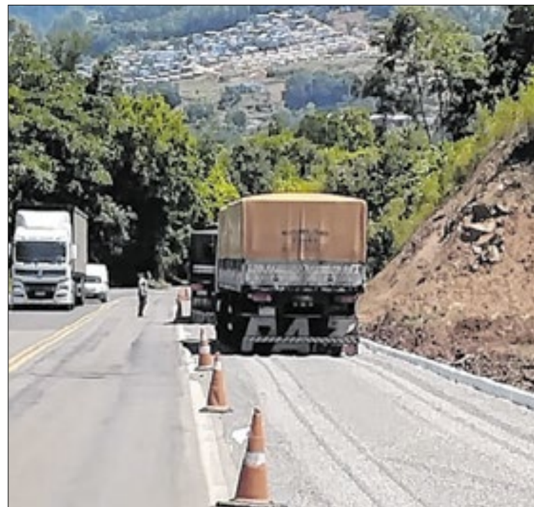
Segundo secretário, utilização mostrou a eficácia do sistema

O governo do Paraná divulgou a programação esportiva do Verão Maior 2025/2026, com provas dos Jogos de Aventura e Natureza e ações de recreação e saúde no litoral. As atividades seguem até o dia 31 deste mês com a Corrida da Virada e com a Copa Litoral de Beach Tennis, somando mais de 100 eventos.