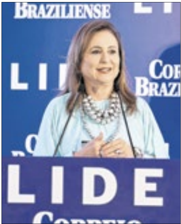
A ex-ministra e ex-senadora Kátia Abreu destacou que o país já construiu um arcabouço robusto de governança e rastreabilidade, com georreferenciamento, Cadastro Ambiental Rural (CAR) e monitoramento remoto por satélites