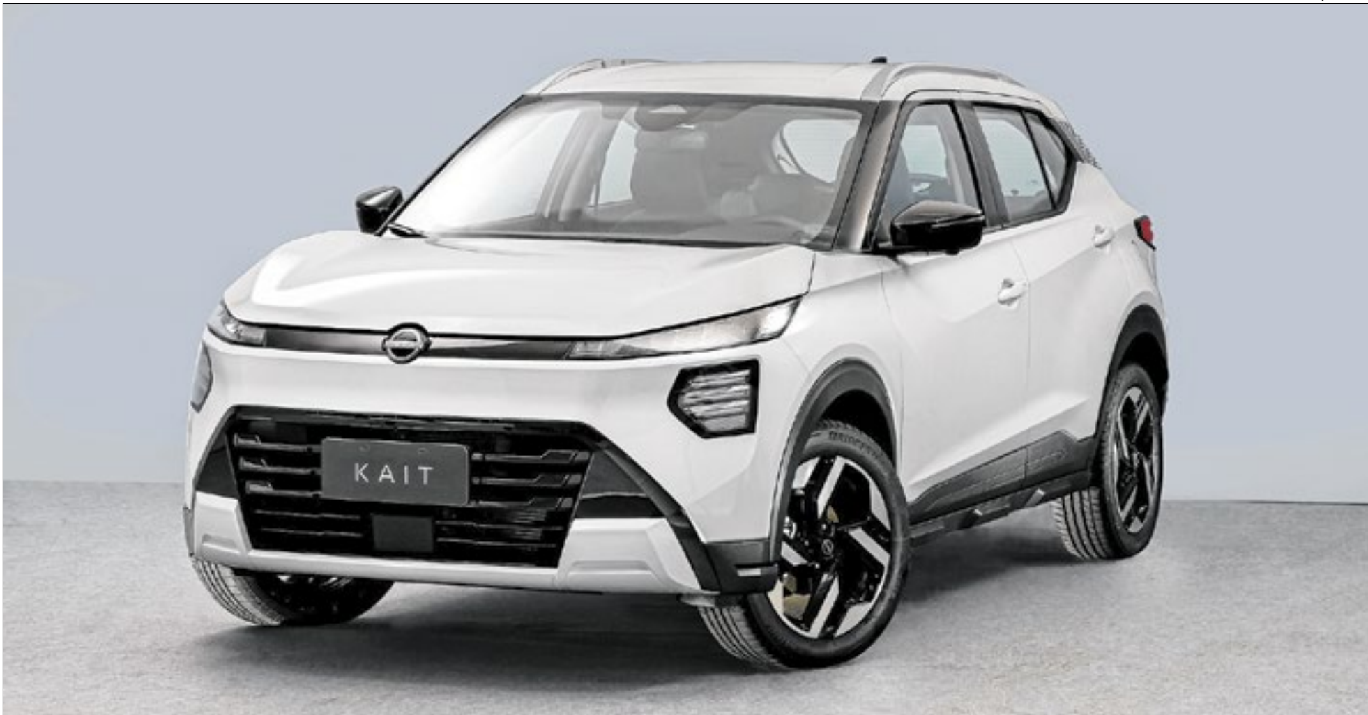
Nissan Kait é produzido na fábrica de Resende-RJ e faz parte do pacote de investimento da montadora