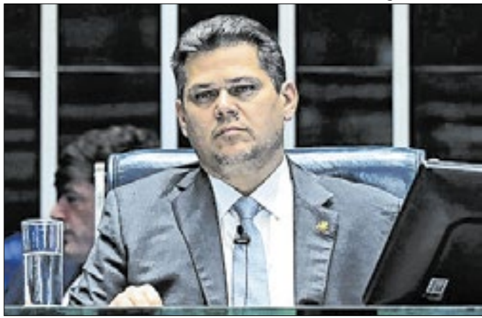
Em resposta a Gilmar, Alcolumbre citou proposta