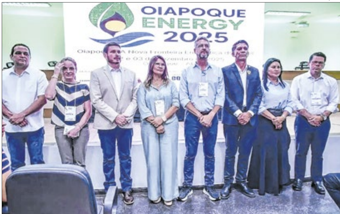
Petróleo na Margem Equatorial transformará Oiapoque em pólo do estado

O governador já havia se reunido, há um mês, com empresários e representantes do setor produtivo local para iniciar a preparação do mercado do município. Com a aproximação de grandes investimentos, Oiapoque se consolida como um dos principais polos de desenvolvimento do extremo norte do estado, abrindo