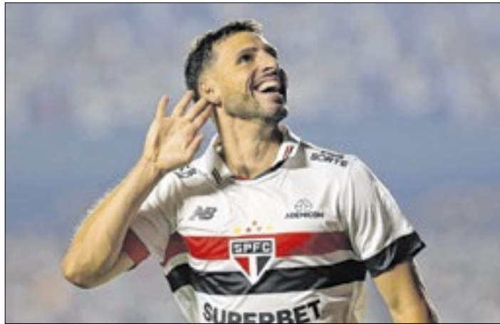
Volta de Calleri em 2021 gerou dívida com o empresário