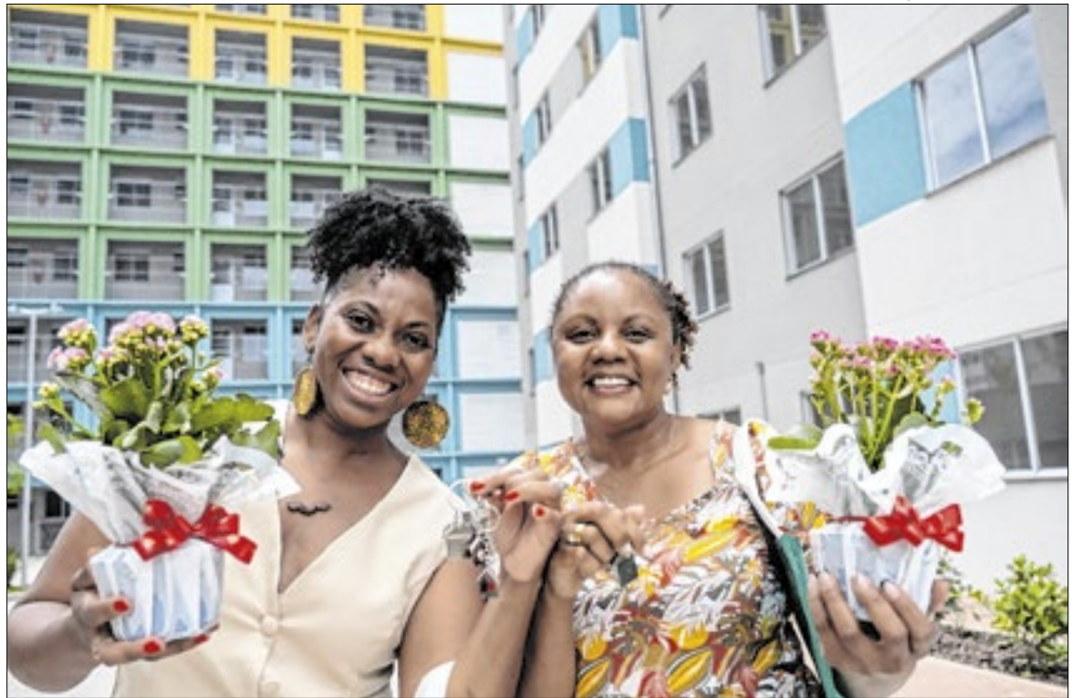
Com a entrega deste empreendimento, já foram disponibilizadas mais de 7,7 mil moradias

Governo estadual de São Paulo ofereceu mais de R$ 84,2 milhões em subsídios