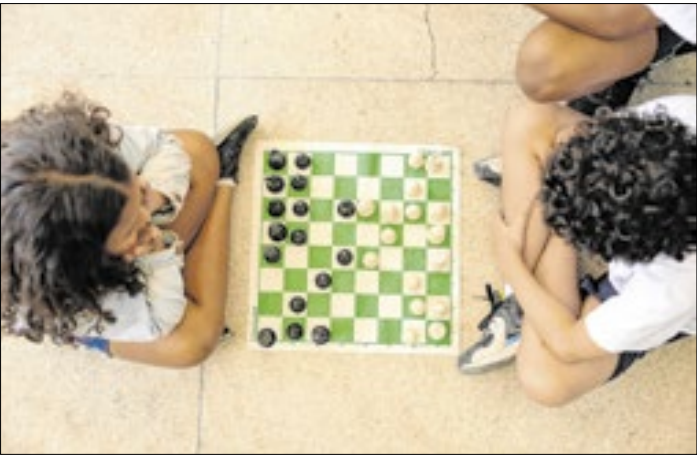
Na faixa etária de 6 a 10 anos, 90,7% estão na série certa

Nove em cada dez (90,7%) crianças de 6 a 10 anos estavam na série adequada de ensino no ano passado. Essa parcela é praticamente a mesma de 2023 (90,8%), mas fica abaixo do período pré-pandemia de covid-19. Em 2019, antes do surgimento da crise sanitária, 95,7% das crianças de 6 a 10 anos estavam na série correta. Os dados fazem parte do levantamento Síntese de Indicadores Sociais, divulgado na quarta pelo IBGE. Para medir o atraso escolar, o IBGE utiliza a taxa ajustada de frequência escolar líquida (Tafel), que representa a proporção de alunos que frequentam a etapa de ensino adequado à faixa etária ou que já a haviam concluído.