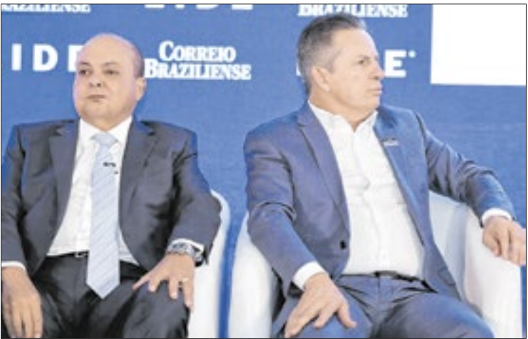
Os governadores do DF, Ibaneis Rocha (e), e do Mato Grosso, Mauro Mendes (d)