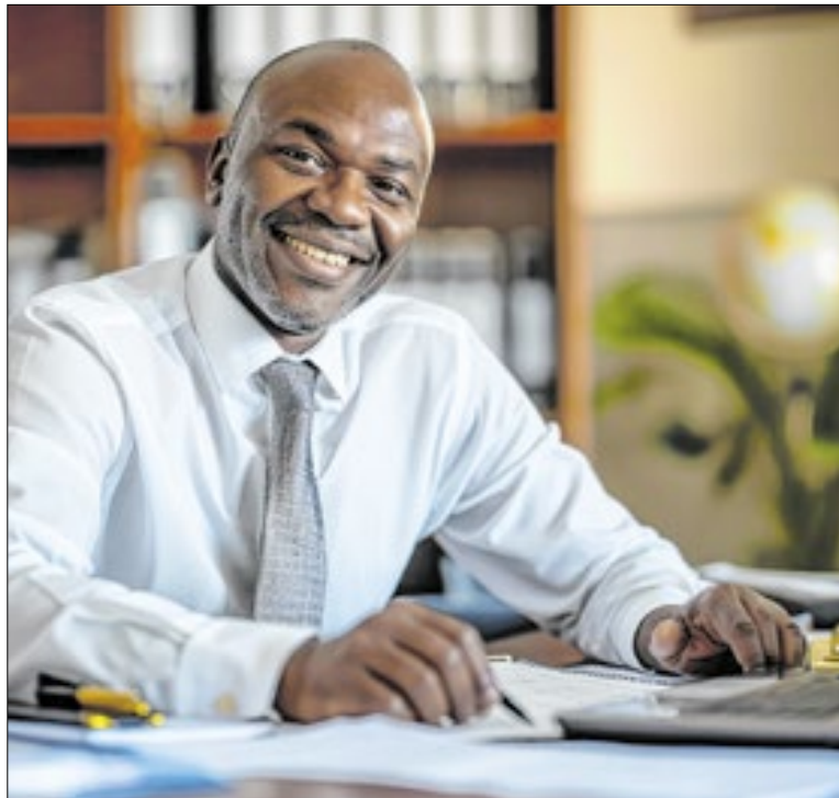
Mesmo em cargos de gestão a disparidade de salário é grande