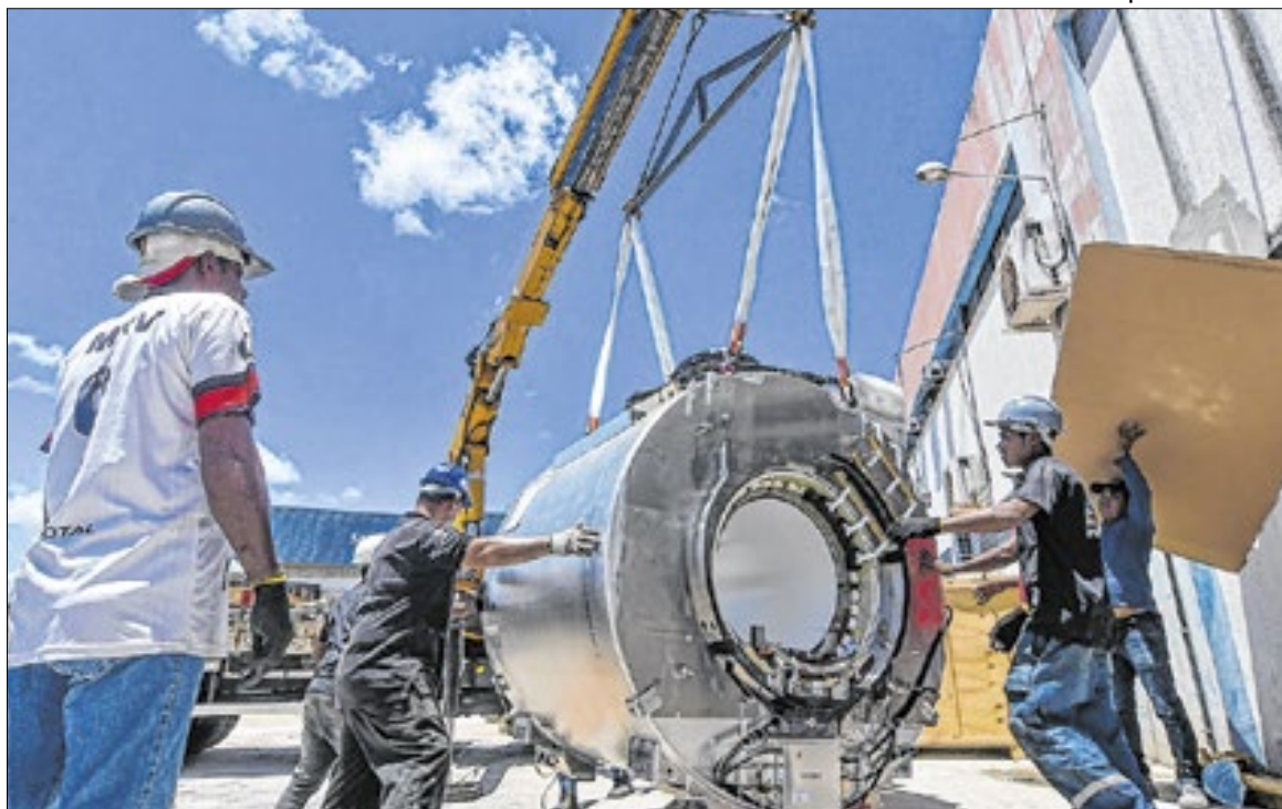
Os investimentos reforçam o compromisso em ampliar o acesso a exames

Cada aparelho representa um investimento de R$ 10.840.000,00, totalizando mais de R$ 32 milhões aplicados na modernização dos serviços de diagnóstico por imagem em Sergipe. Os equipamentos contam com tecnologia avançada, utilização de inteligência artificial e capacidade de realizar exames com redução de tempo em até 50% em comparação aos modelos disponíveis no mercado atualmente. Além da velocidade, o conforto