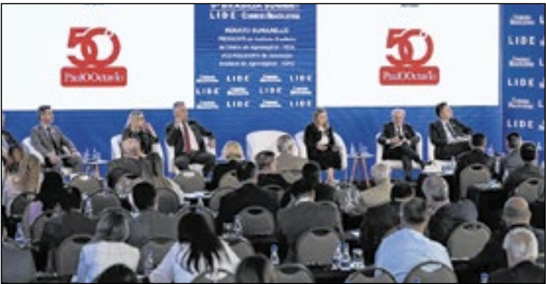
O evento reuniu autoridades, líderes do agronegócio, representantes do setor público e executivos para debater os desafios e caminhos para fortalecer a segurança jurídica no agro brasileiro

O encontro teve como objetivo debater os desafios do agronegócio brasileiro, destacando fraudes em instrumentos de crédito rural, restrições de financiamento, pressão ambiental e riscos à segurança jurídica, além de discutir soluções para garantir a sustentabilidade, o acesso ao crédito e a competitividade do setor.