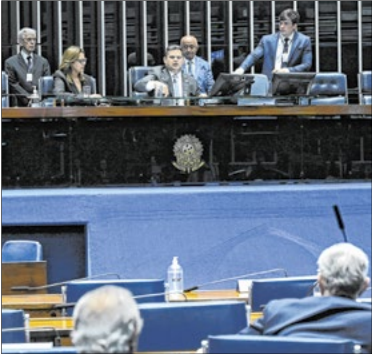
Projeto foi aprovado em um minuto pelo plenário do Senado