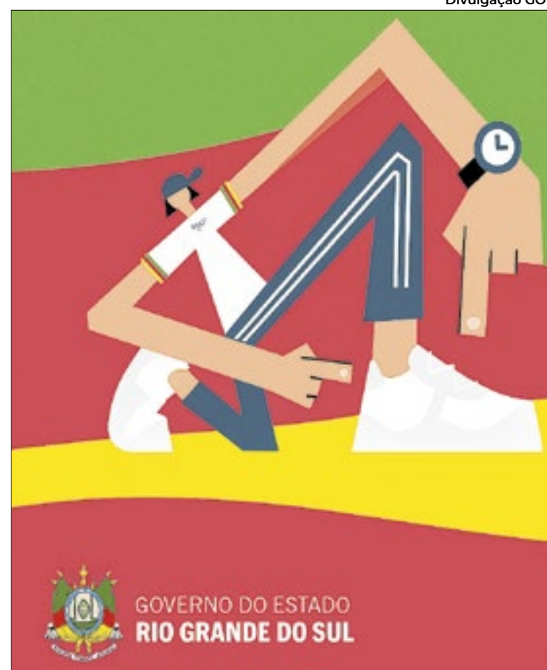
Reprodução do Cartão Pé no Futuro a ser distribuído