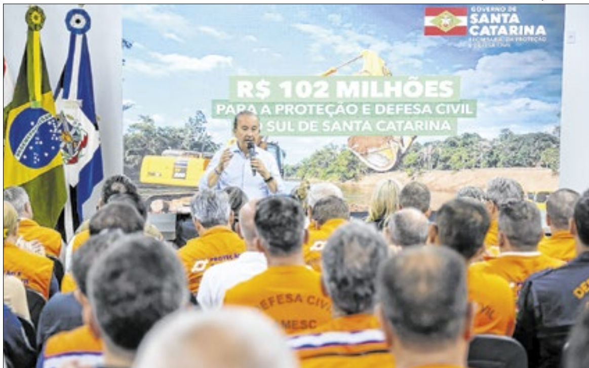
Jorginho Mello assinou o pacote de ações na defesa civil no sul do estado

Para o governador, os novos aportes representam um passo decisivo para fortalecer a infraestrutura e aumentar a resiliência da região. “Hoje nós reforçamos um compromisso muito claro com o Sul de Santa Catarina: nenhum município ficará desassistido diante dos desafios climáticos. Estamos trazendo mais de cem milhões de reais em novos investimentos que fortalecem