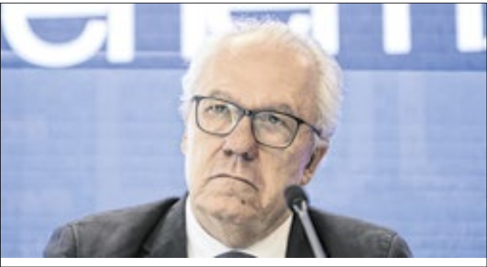
Segundo Palacios, anulação de questões foi preventiva

O presidente do Instituto Nacional de Estudos e Pesquisas Educacionais Anísio Teixeira (Inep), Manuel Palacios, garantiu nesta terça-feira (2) que não houve vazamento de questões do Exame Nacional do Ensino Médio (Enem). Segundo ele, a anulação de três questões após a realização do segundo dia da prova, no último dia 16, foi uma ação preventiva. “Não houve vazamento, o que houve foi uma tentativa de reprodução de itens memorizados a partir da participação no pré-teste”, explicou em audiência na Câmara dos Deputados