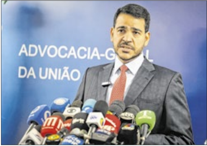
Messias sabe que o problema não é exatamente ele