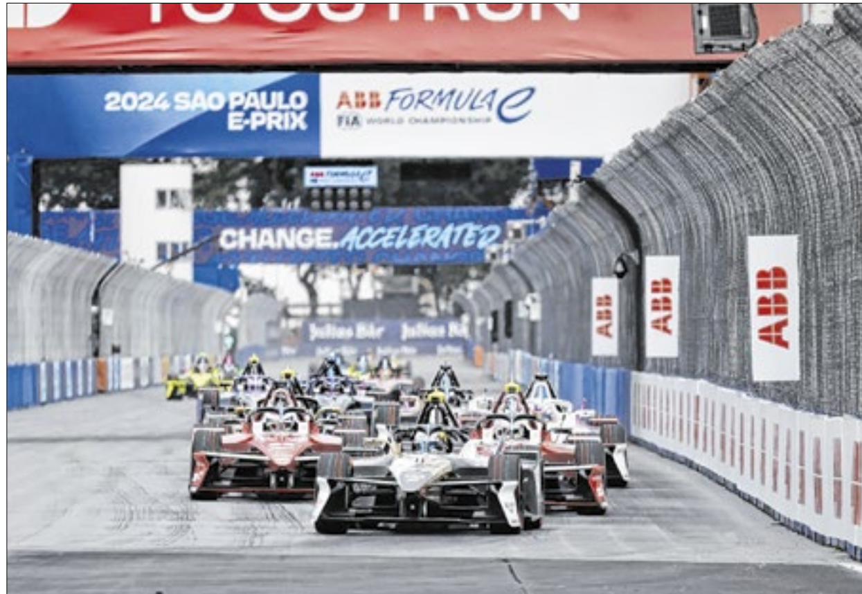
Categoria de automóveis elétricos desembarca em São Paulo para dar início a sua nova temporada

“Estou ansioso para estar na pista no Brasil e começar a nova temporada como atual Campeão Mundial de Pilotos. É uma nova temporada, então nosso foco é, mais uma vez, maximizar nosso desempenho, já que o grid estará ainda mais competitivo. É um circuito complicado, com pouca aderência e bastante irregular. Controlar a temperatura no calor será crucial, e também será importante encontrar um bom ritmo desde o