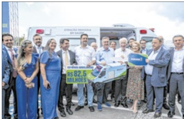
Governador entrega 150 ambulâncias com UTIs