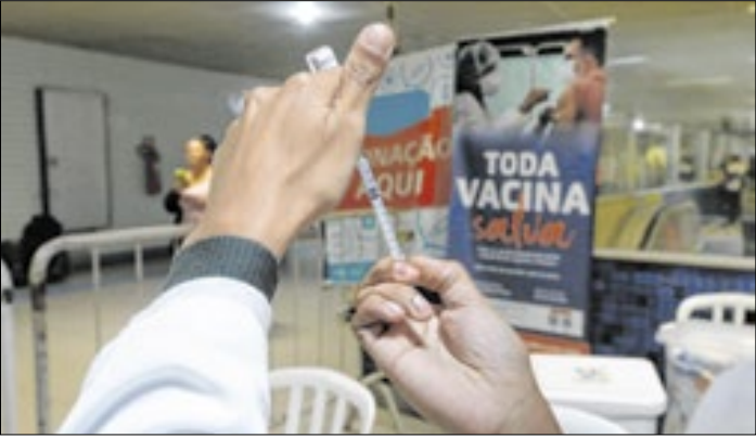
Em 2025, houve 14.474 casos da doença no Rio

A Secretaria Municipal de Saúde do Rio de Janeiro ampliou o público-alvo da vacina contra a variante JN.1 da Covid-19. Assim, quem tem a partir dos 12 anos também pode ser imunizado com a dose de reforço. Em 2025, até o momento, houve 14.474 casos da doença no Rio.