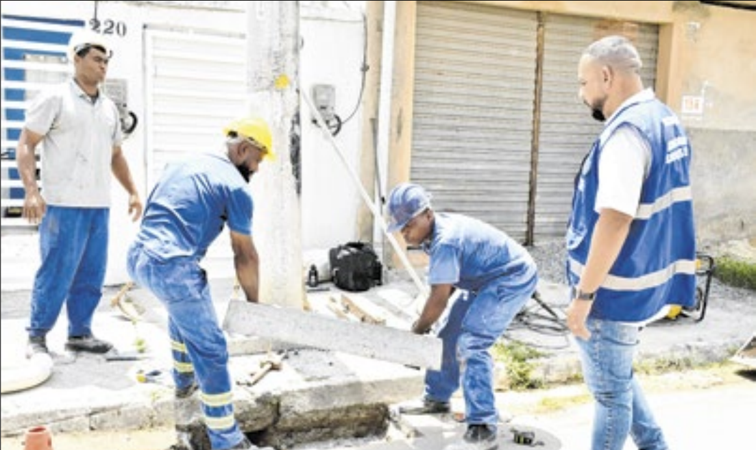
Furtos de tampas de bueiro e grelhas metálicas causavam grande prejuízo para a prefeitura

A Prefeitura de Nova Iguaçu iniciou a substituição de tampas e grelhas metálicas de bueiros por peças de concreto como estratégia para reduzir furtos e aumentar a segurança viária. O novo material, que não possui valor comercial para revenda e já foi aprovado em testes realizados em diversos bairros, é altamente resistente ao peso dos veículos. Somente em 2025, 828 grelhas e 593 tampões foram furtados — prejuízo que mobilizou a subsecretaria de Serviços Especiais, ligada à Secretaria Municipal de Infraestrutura, e equipes da Companhia de Desenvolvimento de Nova Iguaçu (Code-ni) a intensificarem o trabalho. A venda clandestina em ferros-velhos estimula o furto dessas peças, prática considerada crime de receptação. Para coibir o comércio irregular, a Secretaria de Ordem Pública realizou recentemente uma operação em 12 estabelecimentos do setor: dez foram interditados — oito por falta de alvará e dois por comercializar cobre de origem suspeita.