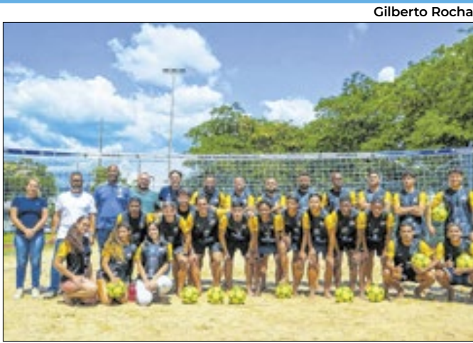
Alunos participaram da clínica de futevôlei de Meriti

A Prefeitura de São João de Meriti promoveu uma clínica de futevôlei na Vila Olímpica do município. A atividade foi organizada pelas Secretarias Municipais da Cidade e de Esportes e Lazer, em parceria com o Governo do Estado, através da Lei de Incentivo ao Esporte.