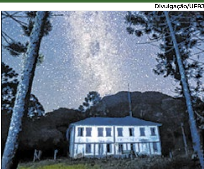
Serra do Brigadeiro quer valorizar astroturismo