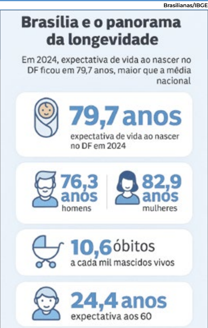
O retrato da longevidade no DF

ce de morrer do que as mulheres. No Brasil, o índice é ainda maior: 4,1 vezes. As causas externas — homicídios, acidentes de trânsito e outras mortes violentas — explicam essa sobre-mortalidade masculina, fenômeno que ganhou força a partir dos anos 1980 com a urbanização acelerada e o aumento da violência nas grandes cidades. Idosos ganham mais anos de vida No DF, quem chega aos 60 anos pode esperar viver, em média, mais 24,4 anos — sendo 22 anos para homens e 26,4 anos para mulheres. Esse número é superior à média nacional de 22,6 anos. Em 1940, um brasileiro de 60 anos viveria apenas mais 13,2 anos. Hoje, esse ganho é de mais de 9 anos, mostrando o avanço da medicina, da qualidade de vida e das políticas de saúde pública.