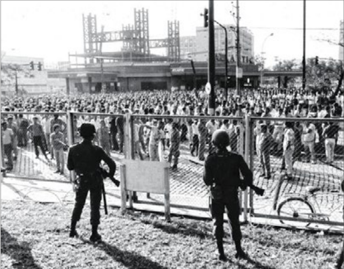
Greve de 1988 na CSN deixou três trabalhadores mortos

Na sentença, o juiz Frederico Montedonio Rego afirmou que cabe ao poder público garantir a preservação da memória nacional e classificou como inconstitucio-