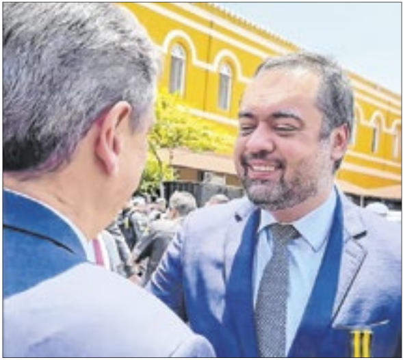
O governador do Rio, Cláudio Castro, recebendo a medalha do Centenário de Primeiro Batalhão de Choque, das mãos do governador de SP, Tarcísio de Freitas