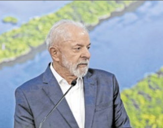
Apesar da alta rejeição, Lula lidera no Distrito Federal