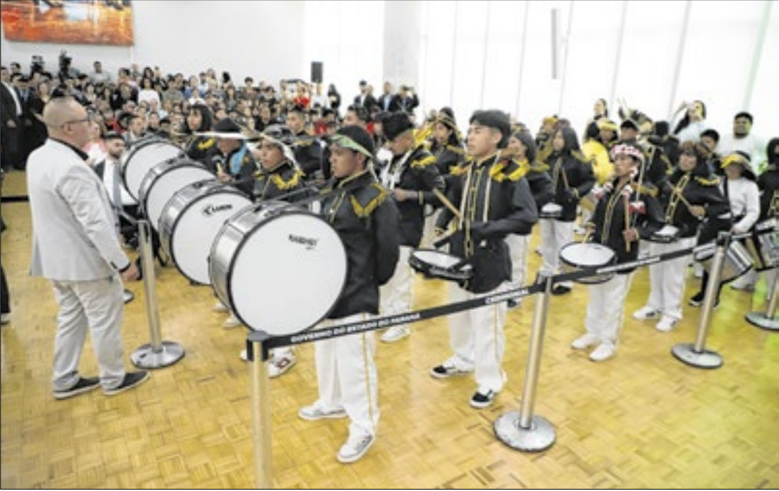
Governador anunciou que os museus paranaenses contarão com unidades satélite

A Secretaria de Estado da Cultura (Seec) também anunciou a criação de oito satélites dos museus estaduais, que serão instalados a partir de 2026