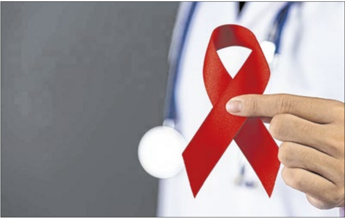
No Espírito Santo, atualmente, 20.721 pessoas vivem com HIV/AIDS

Criado em 1988, o Dezembro Vermelho simboliza luta e memória