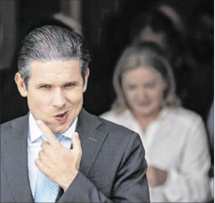
Presidente da Câmara, deputado Hugo Motta informou pelas redes sociais

deverá ser seguido pelos estados e pelo Distrito Federal.