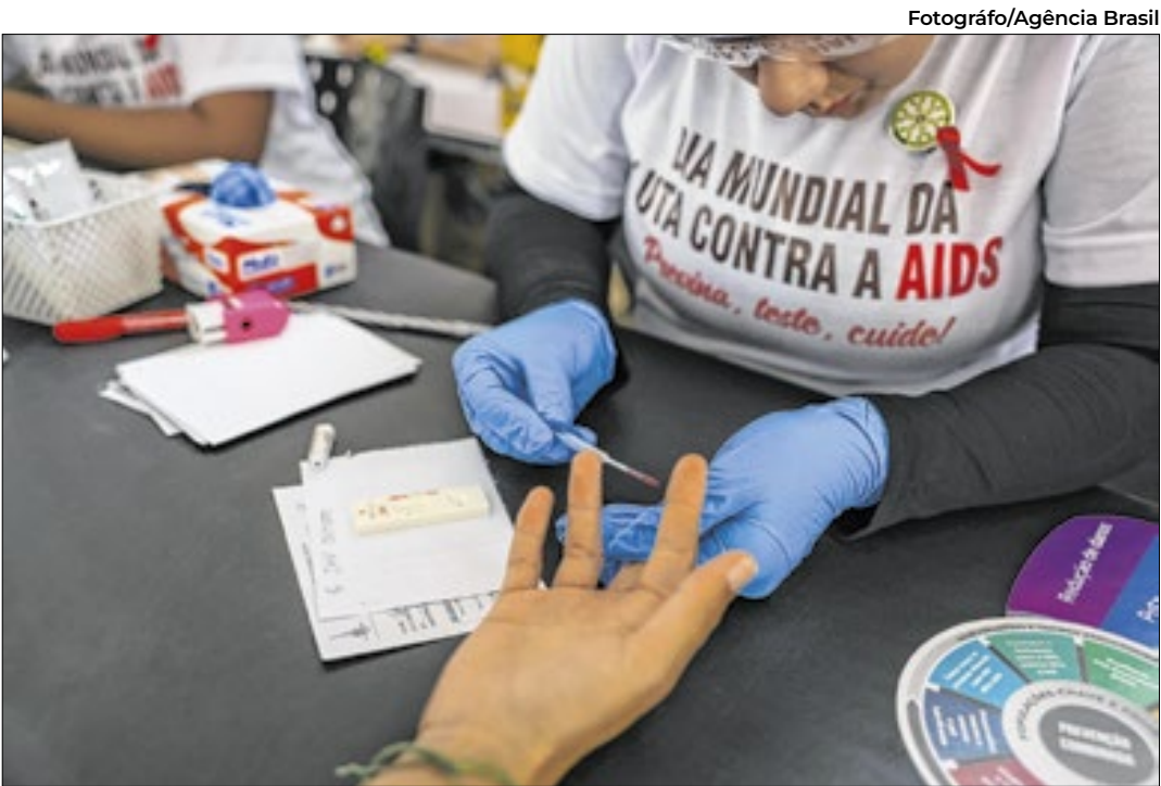
Ministro Padilha alerta para o estigma e prevenção à doença

rios para a emissão da CNH. Ainda segundo Renan Filho, são esses exames que atestam se o condutor está devidamente capacitado para dirigir. “O novo modelo segue padrões internacionais adotados por países como Estados Unidos, Reino Unido e Canadá, onde o foco é a avaliação, não a quantidade de aulas”, explicou. A abertura do processo para tirar a CNH poderá ser feita diretamente pelo site do Ministério dos Transportes ou por meio da Carteira Digital de Trânsito (CDT). O cidadão ainda precisará comparecer presencialmente a etapas