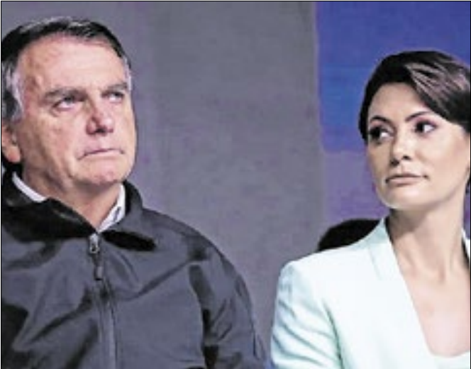
Para Flávio, Michelle atropelou Bolsonaro