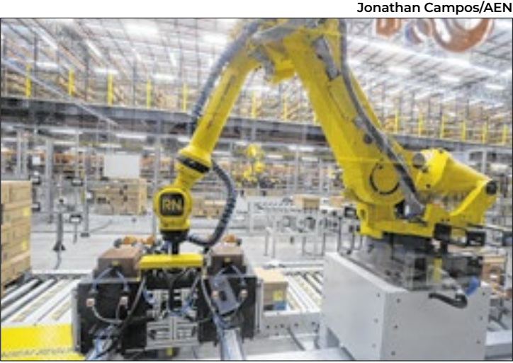
Esse é o maior número de investimentos atraídos

Para o secretário da Fazenda, Norberto Ortigara, esse crescimento expressivo de parcerias no período reflete o sucesso do programa, a implantação de no-