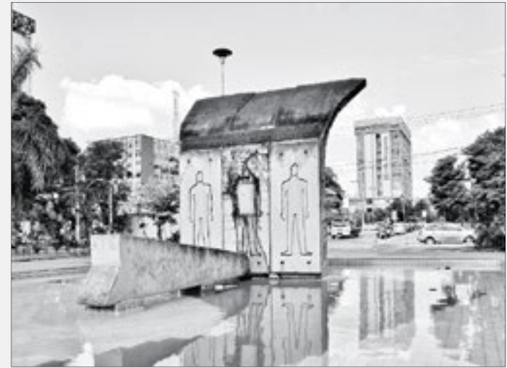
Memorial 9 de Novembro, na Praça Juarez Antunes, homenageia operários mortos durante confronto com exército

No dia 7 de novembro de 1988 é deflagrada a greve pelos metalúrgicos da CSN e ocupam setores estratégicos da usina e