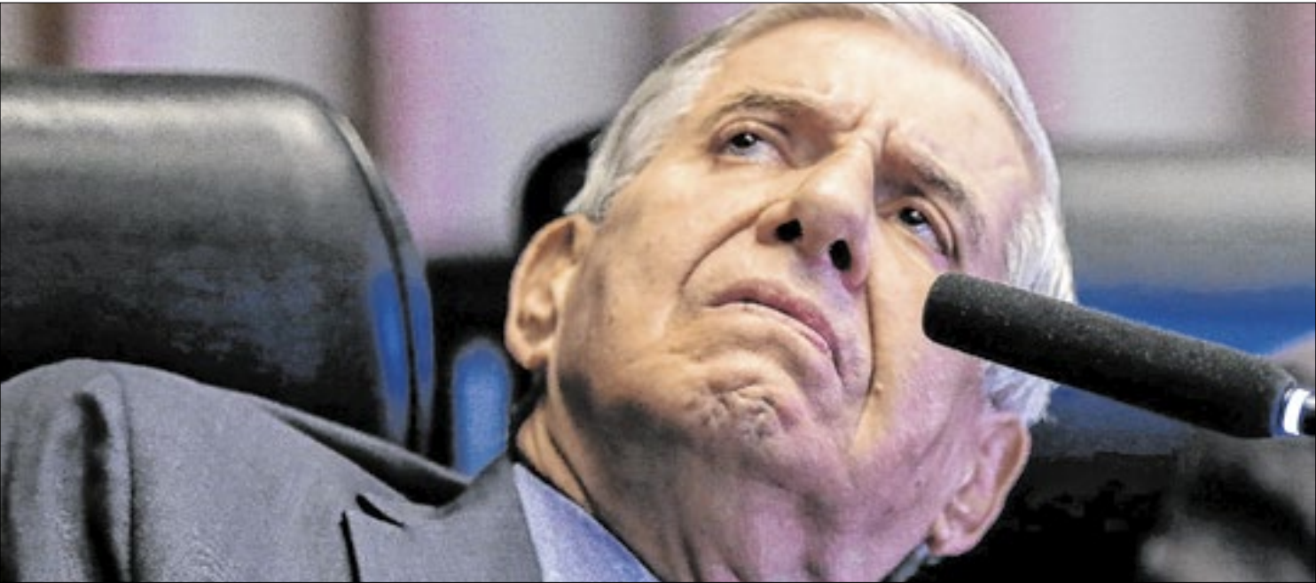
Ex-ministro do GSI afirmou sofrer de Alzheimer desde 2018