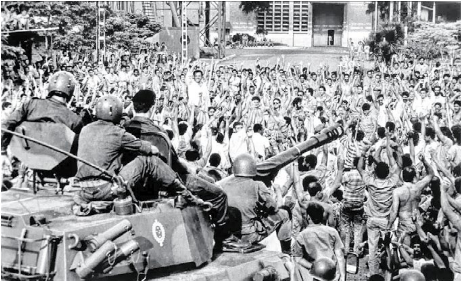
Tanques do Exército tomaram as ruas de Volta Redonda na época da greve em 1988

A CSN declarou ainda que segue “empenhada em assegurar que dados de interesse público