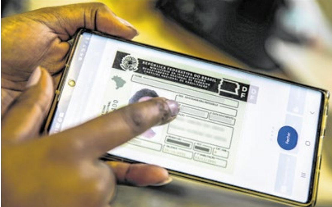
A principal mudança é o fim da obrigatoriedade de frequentar aulas de autoescola

Além de tornar o trânsito mais seguro, o ministro dos Transportes, Renan Filho, argumenta que a proposta tam-