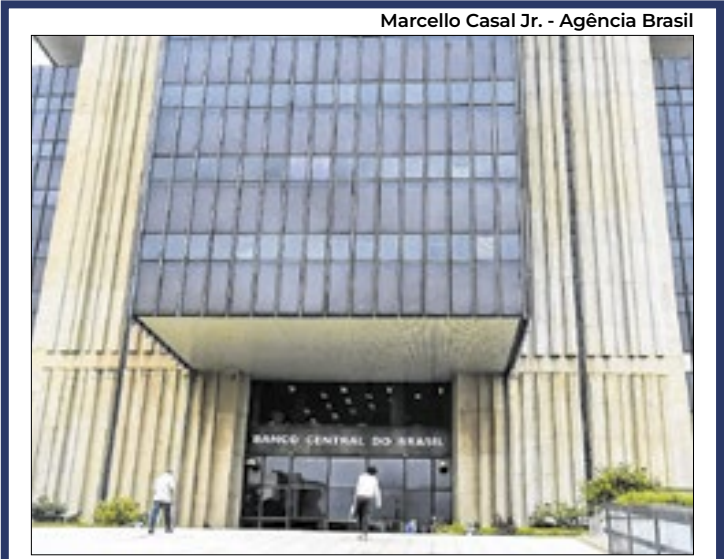
Banco Central é o órgão que divulga o Boletim Focus

A previsão do mercado financeiro para o Índice Nacional de Preços ao Consumidor Amplo (IPCA) - considerado a inflação oficial do país - passou de 4,45% para 4,43% este ano. A estimativa foi publicada no boletim Focus de segunda-feira (1º), divulgado semanalmente pelo Banco Central (BC), com a expectativa de instituições financeiras para os principais indicadores econômicos. Para 2026, a projeção da inflação variou de 4,18% para 4,17%. Para 2027 e 2028, as previsões são de 3,8% e 3,5%, respectivamente. Definida pelo Conselho Monetário Nacional (CMN), a meta é de 3%, com intervalo de tolerância de 1,5 ponto percentual para cima ou para baixo. Ou seja, o limite inferior é 1,5% e o superior 4,5%.