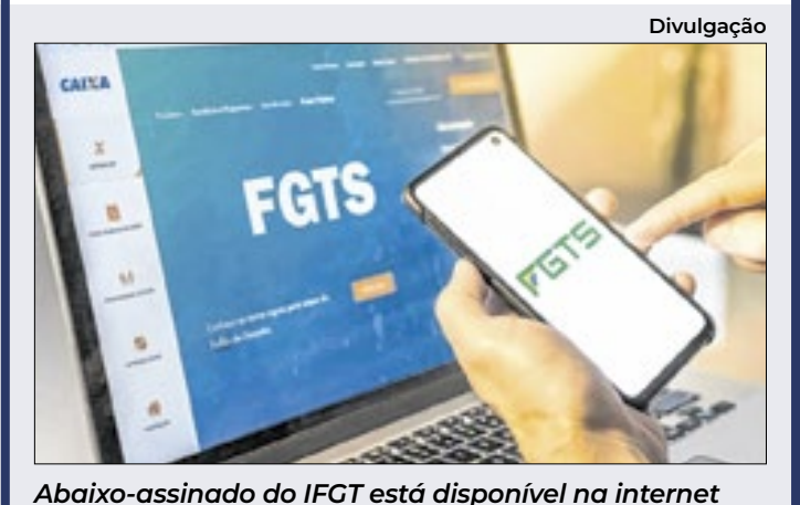
Abaixo-assinado do IFGT está disponível na internet

O Instituto Fundo de Garantia do Trabalhador propõe Projeto de Lei para impedir perda de mais R$ 30 bilhões aos trabalhadores. A proposta, encaminhada ao Senado e à Câmara, busca garantir que multas e juros por atraso no depósito do Fundo de Garantia sejam destinados ao empregado prejudicado, e não revertidos ao gover-