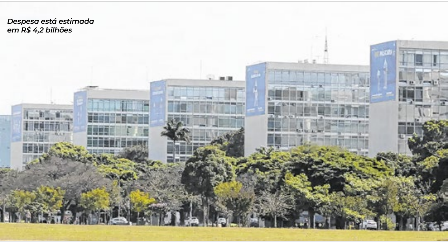
Despesa está estimada em R$ 4,2 bilhões