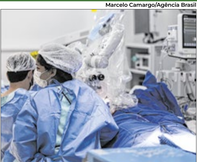
Recursos são para construção de UBS, UPA e hospitais

O Ministério da Saúde anunciou no último domingo (30) um investimento de R$ 9,8 bilhões em ações de adaptação no Sistema Único de Saúde (SUS), incluindo a construção de novas unidades de saúde e a aquisição de equipamentos resilientes às mudanças climáticas. Através de nota, a pasta informou que as iniciativas integram o Adapta-SUS, plano apresentado durante a 30ª Conferência das Nações Unidas sobre Mudança do Clima