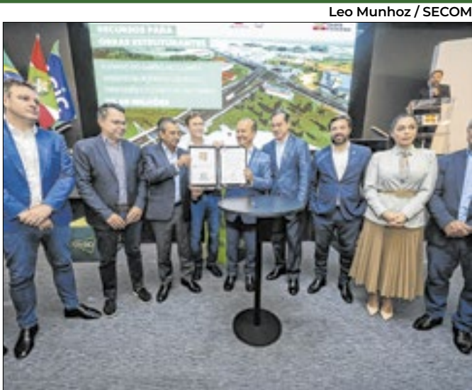
Novos postos de saúde, viadutos e elevado nos planos

No ano em que completa 100 anos de emancipação, a cidade de Criciúma recebeu um presente especial por parte do Governo do Estado. Na segunda, 1º de dezembro, o governador Jorginho Mello autorizou o repasse de R$ 240 milhões para fortalecer a Saúde, aprimorar a Infraestrutura e viabilizar obras estruturantes. Somados aos recursos já autorizados entre 2023 e 2024, o valor chega a quase R$ 300 milhões. O anúncio encerra a agenda do governador no municí-