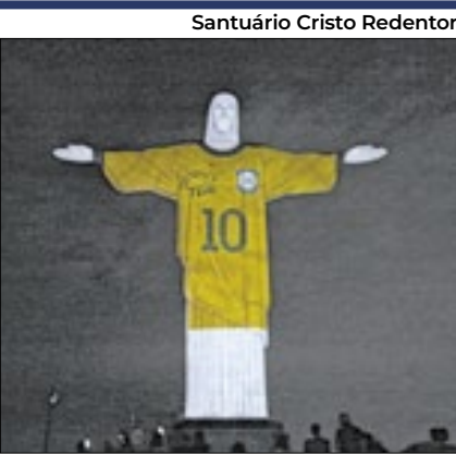
Santuário Cristo Redentor

A ‘Opep’ é uma organização que conta com 12 países e tem sede em Viena. Além da Venezuela, fazem parte dela os Emirados Árabes Unidos; a Arábia Saudita; Nigéria; Líbia; Kuwait; Iraque; Irã; Gabão; Guiné Equatorial; Congo e Argélia.