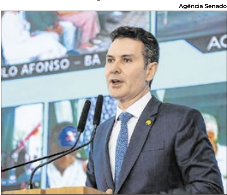
Ministro das Cidades, Jader Barbalho Filho

O Ministério das Cidades será a única pasta do governo federal a ter recursos liberados, no valor de R$ 501,4 milhões, após a redução do volume de recursos congelados no Orçamento de 2025, conforme detalhamento divulgado na sexta-feira (28) pelo Ministério do Planejamento e Orçamento. As emendas parlamentares terão reforço de R$ 149,3 milhões. A liberação dos recursos consta de decreto publicado em edição extraordinária do Diário Oficial da União. Esse decreto prevê a redução de R$ 12,1 bilhões para R$ 7,7 bilhões do total de recursos congelados no Orçamento, divulgada pelos Ministérios da Fazenda e do Planejamento no último dia 21. Em tese, o volume de recursos liberados corresponderia