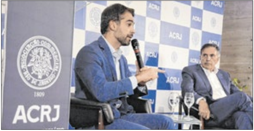
Gestão, segurança e investimentos foram alguns temas abordados pelo governador do Rio Grande do Sul