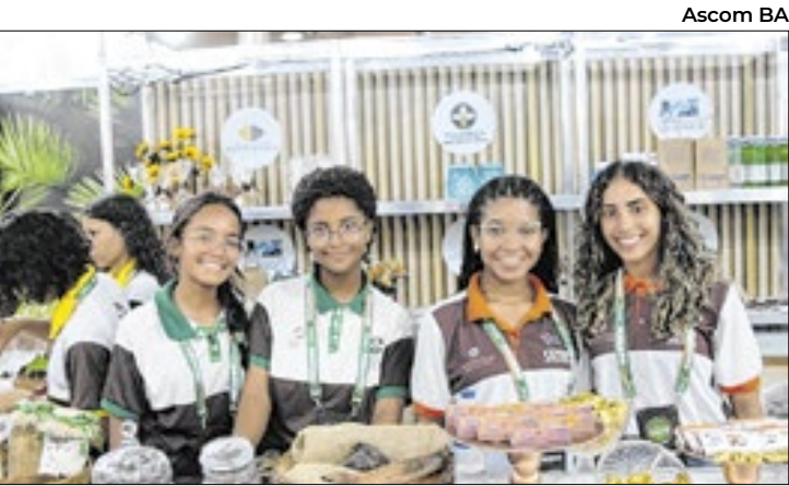
SEC expõe alimentos, cosméticos e artigos de couro