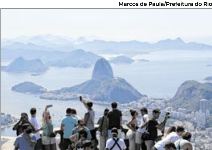
Resultado é reflexo de uma política de promoção

O resultado é reflexo direto de uma política robusta de promoção do destino Rio de Janeiro no exterior. Em 2025, o Governo do Estado, por meio da Secretaria de Estado de Turismo (Setur-RJ) e da TurisRio, esteve em mais de 20 cidades internacionais, incluindo destinos estratégicos, como Argentina, EUA e Europa, e outros nunca antes explorados, como