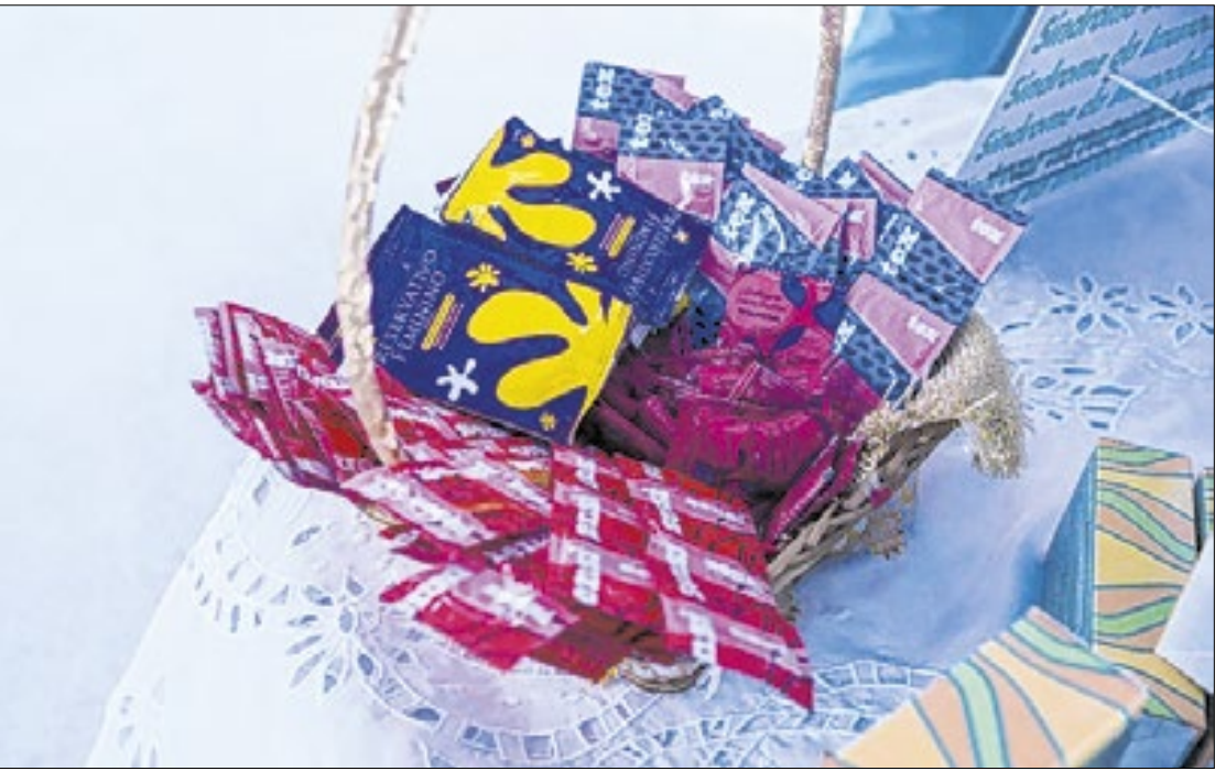
Durante a ação houve distribuição de preservativos masculinos e femininos

Campanha reforça prevenção e debate desafios do HIV no Estado