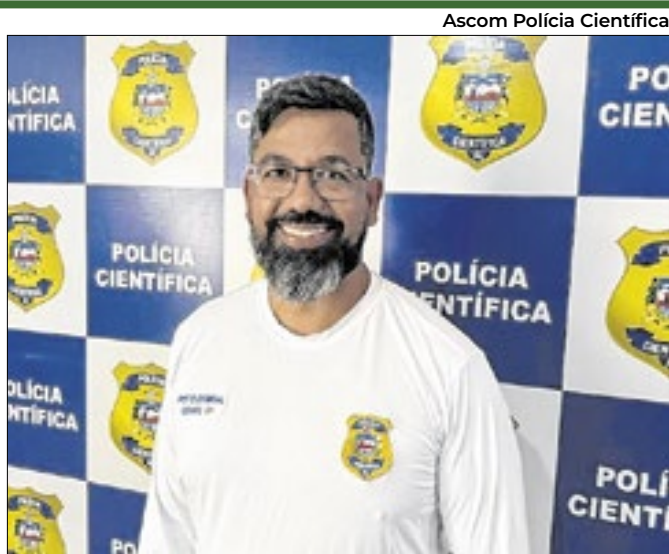
Se escolhido irá representar 46 países da sétima região