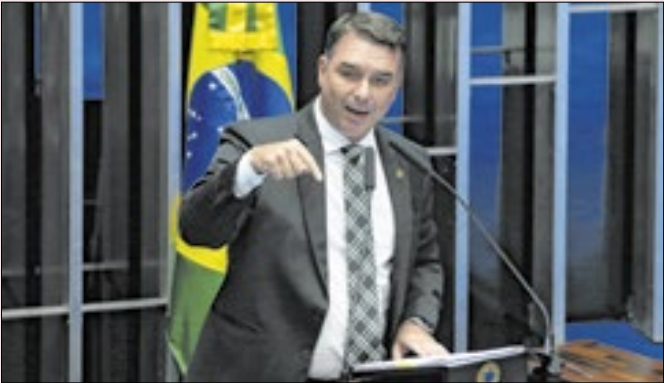
O senador e a coroa: conselho de D. João VI